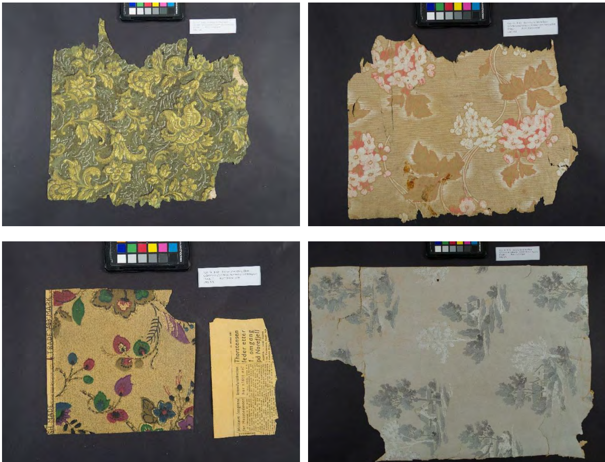
Fire av totalt seks separerte lag med tapeter fra Fossesholm gård

Separerte lag tørkes på trekkpapir i papirtørkereol. Eventuell tørrensing utføres med svamp (WallMaster® og Wishab®), og viskelær (Cretacolor Monolith®-line), dersom overflaten er stabil.