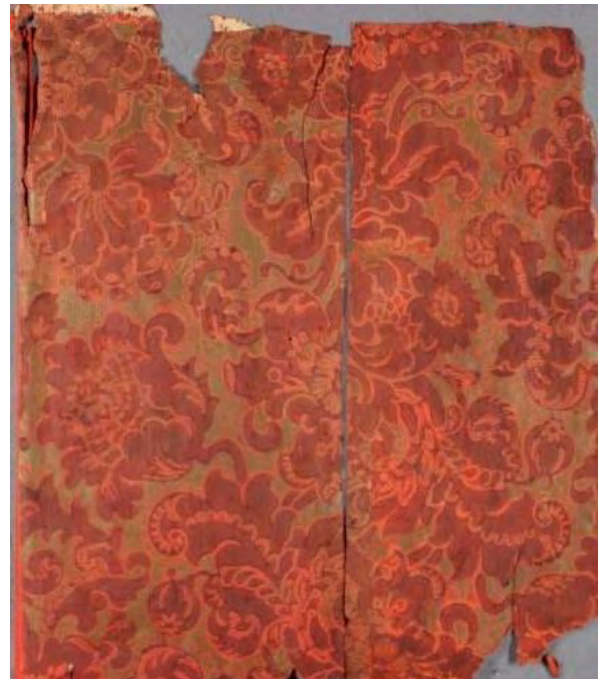
Tapetfragmenter fra Sophienlund, Oslo