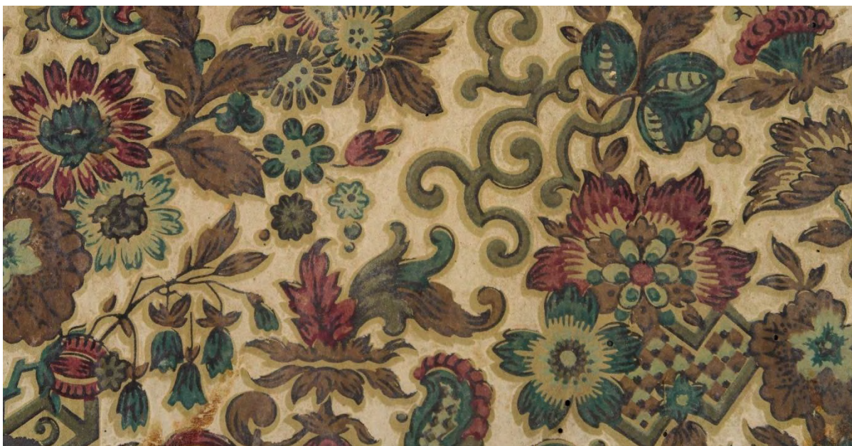
Tapetfragment fra Berg-Kragerø museum

NIKU arbeider systematisk for å oppfylle kravene i helse-, miljø- og sikkerhetslovgivningen og tilfredsstillende kravene i forskrift om systematisk helse-, miljø- og sikkerhetsarbeid i virksomheten (internkontrollforskriften). I dette oppdraget vil vi ta særlig hensyn til at fargepigmentene i tapetfragmentene i noen tilfeller kan inneholde helseskadelige stoffer.