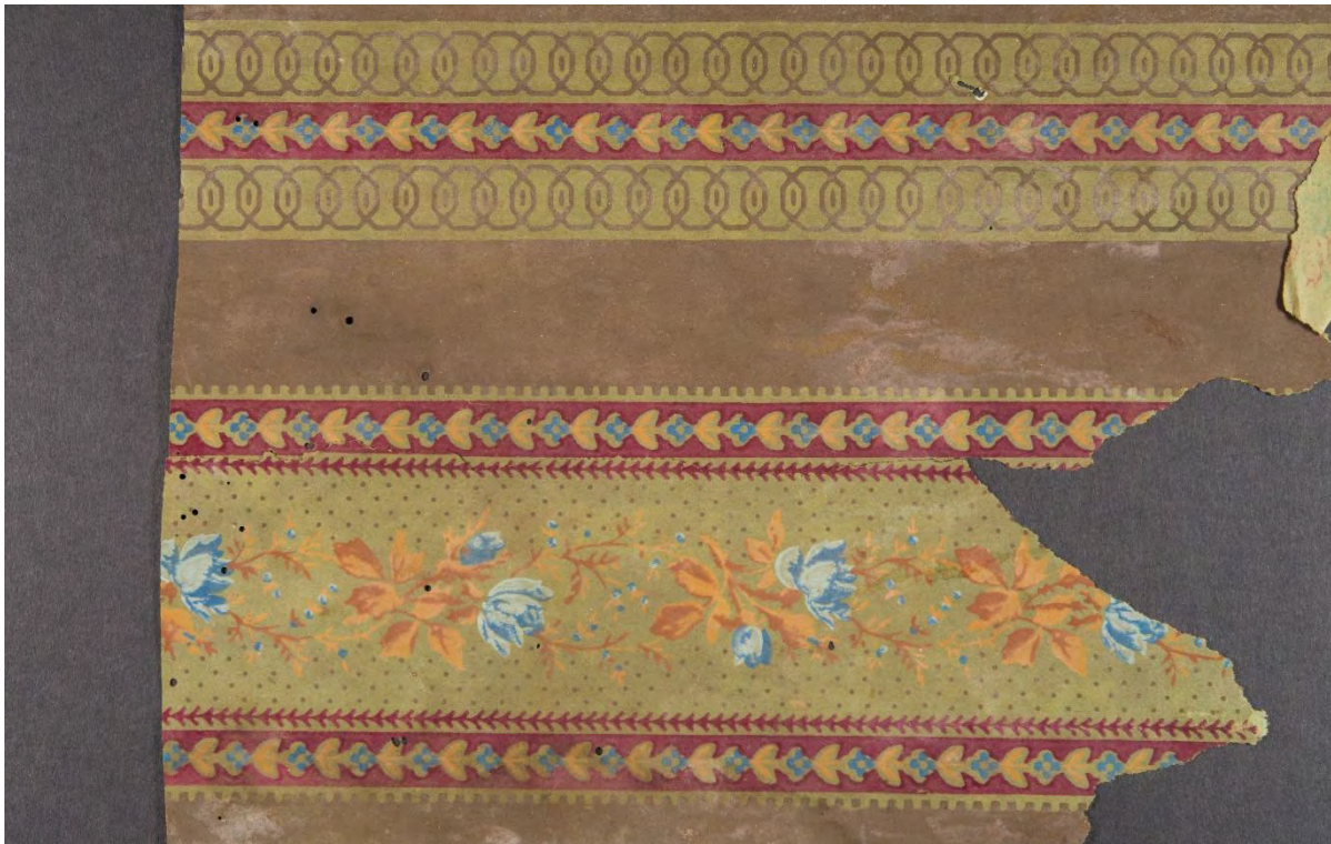
Tapetfragment fra Berg-Kragerø museum