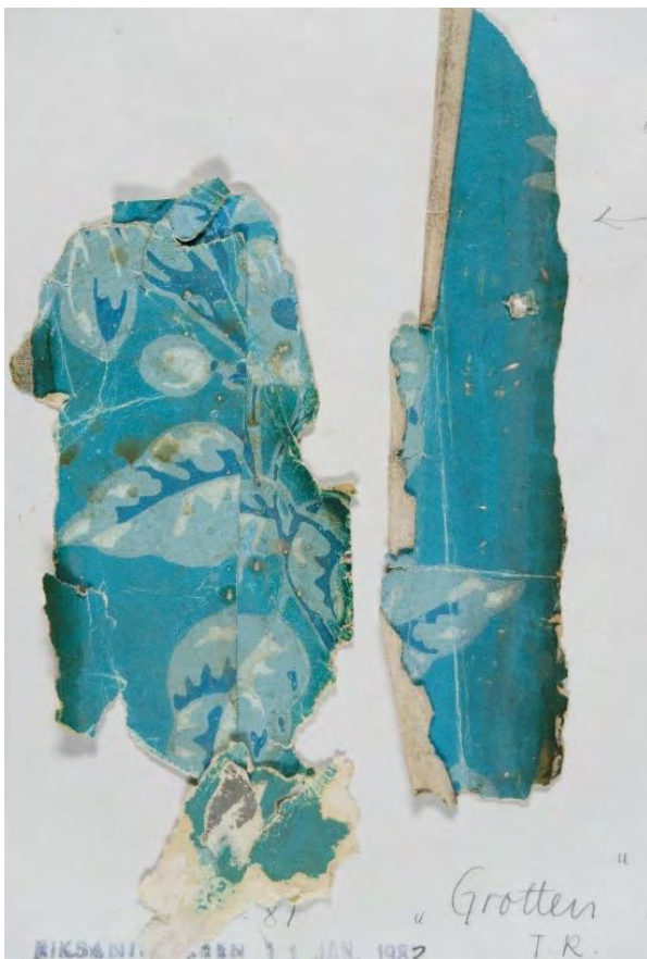
Tapetfragment fra «Grotten», Oslo

Kun en liten del av samlingen er registrert og systematisert, og samlingen er derfor svært lite tilgjengelig og egnet for bruk. For å gjøre tapetsamlingen tilgjengelig for bruk, og for å bevare den for ettertiden, ønsker NIKU nå å gjennomføre en digital registrering og fotografering av samtlige tapetfragmenter.