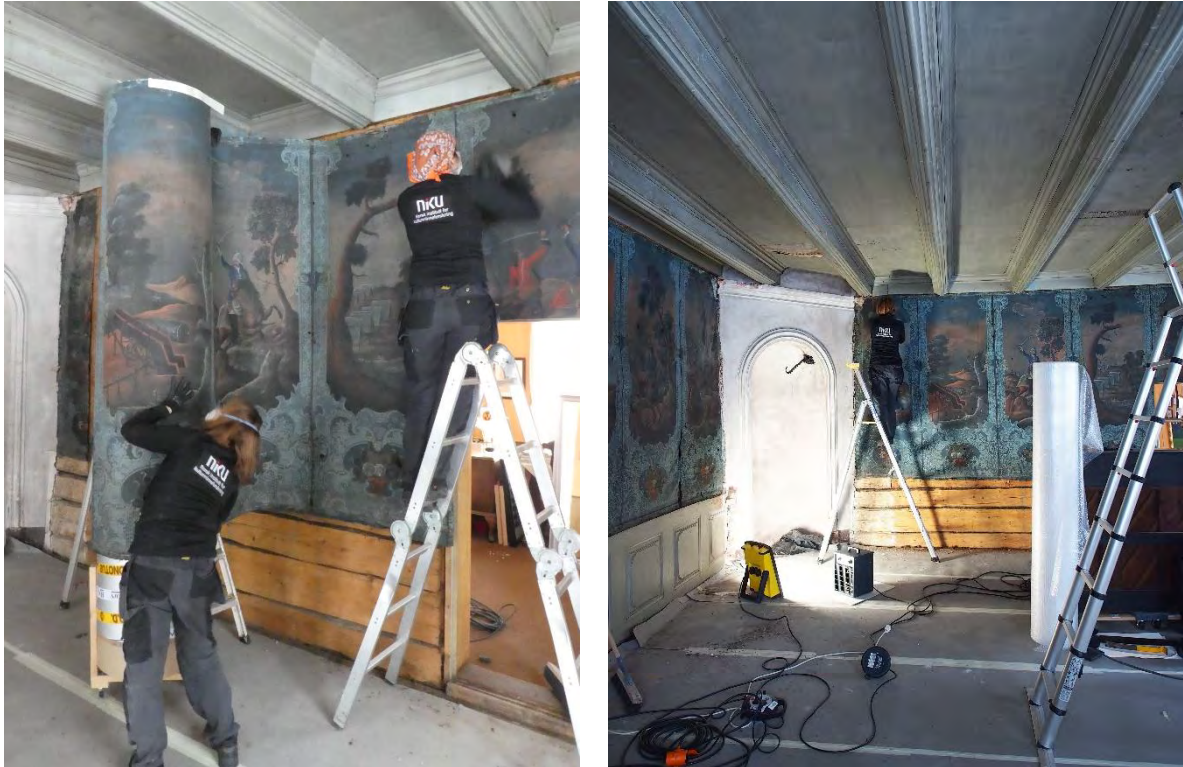
NIKU i arbeid med å demontere 1700-talls lerretstapet i salen på Hovin gård i 2017

Samlingen var først magasinert i Riksantikvarens arkiv på Akershus festning, i kruttårnet og i arkivskuffer på atelieret. Da Riksantikvaren i 1994 flyttet til Dronningens gate 13, fulgte samlingen med dit, og da NIKU etablerte seg i Storgata 2 i 2004, ble hele samlingen flyttet og lagret i kjelleren her.