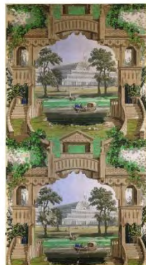
Wallpaper illustrating the Crystal Palace, manufactured by Heywood, Higginbottom & Smith, about 1853 – 55, Manchester, England