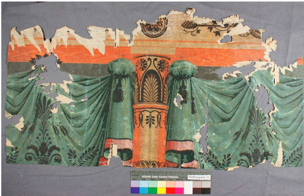
Tapetfragment fra Rådhusgaten 12, Oslo