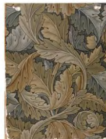
Acanthus, wallpaper, designed by William Morris, manufactured by Jeffrey & Co., 1875, Britain