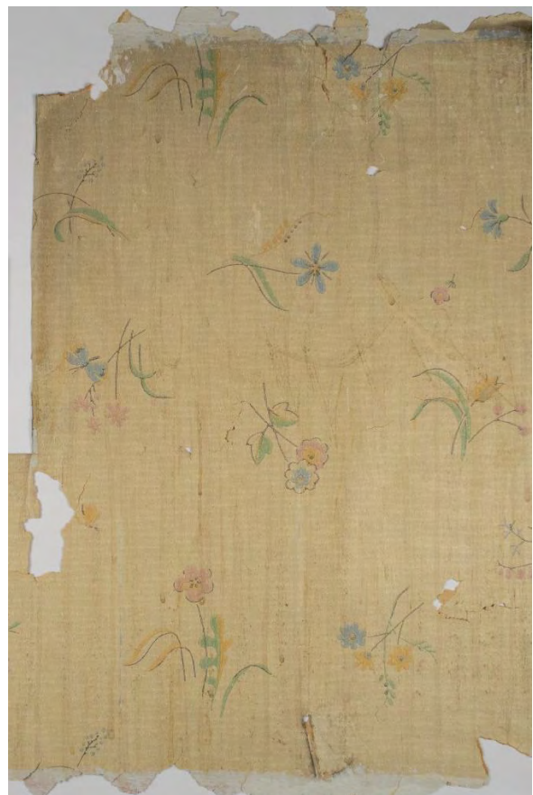
Tapetfragment fra Villa Stenersen, Oslo