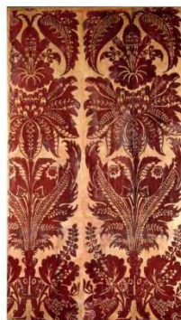
Panel of red flock wallpaper, identical in pattern with the paper formerly hung in the Queen's Drawing Room at Hampton Court Palace, about 1735, England