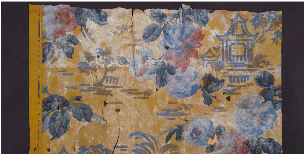
Tapetfragment fra Havnegata 108, Drammen

Til gjennomføring av digitaliseringsprosjektet er det behov for 6 personer, med følgende bakgrunn: Konservator, arkitekt og arkivar. Se for øvrig vår prosjektgruppe, avsnitt 10 side 20.