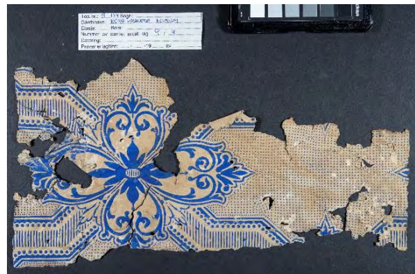
NIKU vil benytte fast fotostasjon til fotografering og registrering av tapetfragmentene