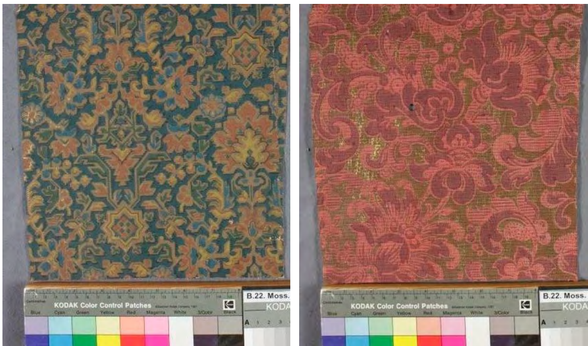
Tapetfragmenter fra Vanse gård