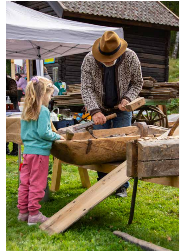
TRADISJONSHÅNDVERK: Fra åpningen av Kulturminnedagene 2021.

Forutsigbare økonomiske rammer for frivilligheten er viktig. Både stat, fylke og kommune gir bidrag til frivillig kulturvern, men private fond og stiftelser har