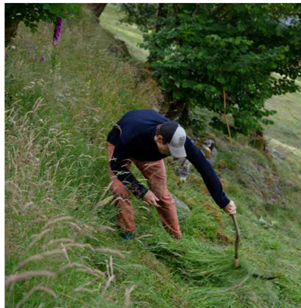
HAVRÅTUNET: Slått med stutturv på Havråtunet.

Også den europeiske landskapskonvensjonen 10 påpeker viktigheten av å styrke enkeltmenneskets og lokalsamfunnets medvirkning i arbeidet med planlegging, vern og forvaltning av landskap. Konvensjonen etablerer ansvar og rettigheter for alle. Dette gjelder å etterspørre landskaps hensyn i omgivelsene sine, engasjere seg for å ta vare på landskapskvaliteter, delta når fagfolk, byråkrater og politikere diskuterer landskapets verdier og forvaltning og bidra når myndigheter innarbeider landskaps hensyn i planlegging og forvaltning.