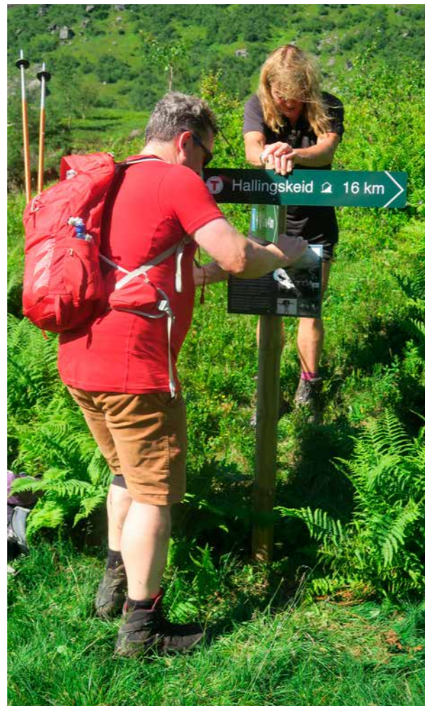
VISER VEI: Frivillige setter opp ny skilting på slepa Osa Hallingskeid.