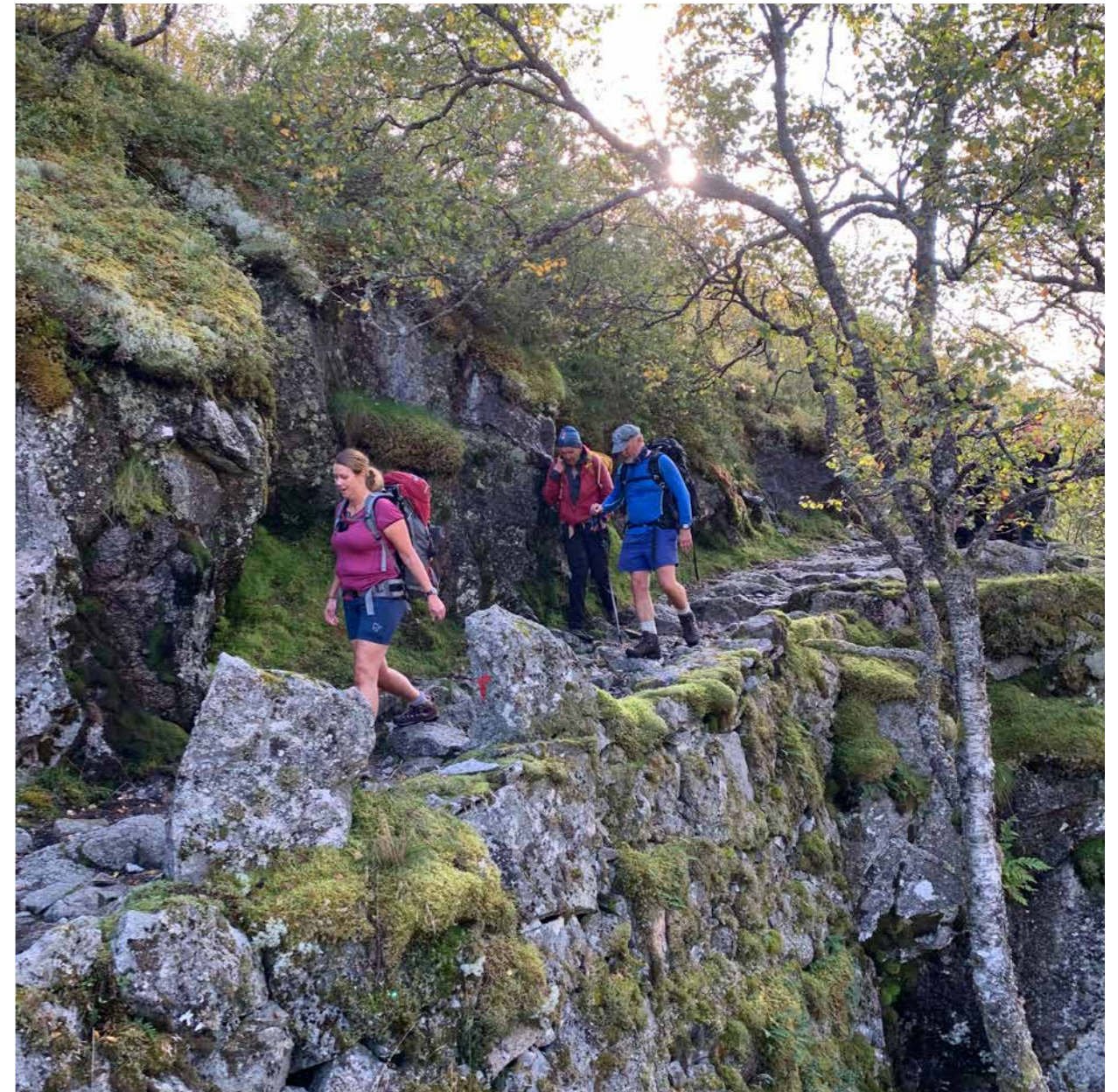
HISTORISKE VANDRERUTER er et samarbeidsprosjekt mellom Den norske Turistforeningen og Riksantikvaren. Uten betydelig frivillig innsats fra DNTs mange medlemmer ville det ikke vært mulig å gjennomføre dette viktige prosjektet. Her fra åpningen av den historiske vandrерuten Viglesdalen i Rogaland.

Flere høringsinstanser har oppfordret Riksantikvaren til å inkludere nye kategorier av kulturmiljø og kulturminner i ansvarsområdet for forvaltningen. Å inkludere nye kategorier av kulturminner i den offentlige kulturmiljøforvaltningens arbeidsfelt kan være et viktig virkemiddel for å inkludere nye grupper i frivillig arbeide. Stortingsmeldingen har vektlagt engasjement som et av de tre nasjonale målene. Engasjement kan være knyttet til å være opptatt av, og gjennomføre det som allerede er vedtatt innenfor «det etablerte kulturmiljøfeltet», men det kan også være knyttet til aktivitetsområder som i dag ikke ligger innenfor bl.a. Riksantikvarens ansvarsområde.