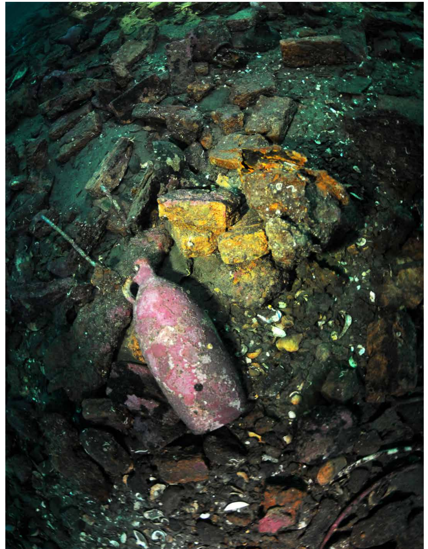
GALEASEN JUFFRAU ELISABETH sank i skjærgården utenfor Søgne i 1760. Søgne Etter flere år med frivillig leting fant Søgne dykkerklubb vraket våren 2019. Funnet ble meldt til museet, og de har i etterkant fått finnerlønn av Norsk maritimt museum. De har også fått tilskudd til grunnundersøking av Riksantikvaren.

Høsten 2021 intervjuet Riksantikvaren fylkeskommunene i forbindelse med revisjon av Riksantikvarens frivillighetsstrategi. 21 Det kom innspill om at det er viktig med god dialog mellom kulturminneforvaltningen og frivilligheten, men det ble også påpekt at det er viktig med «armlengdes avstand».