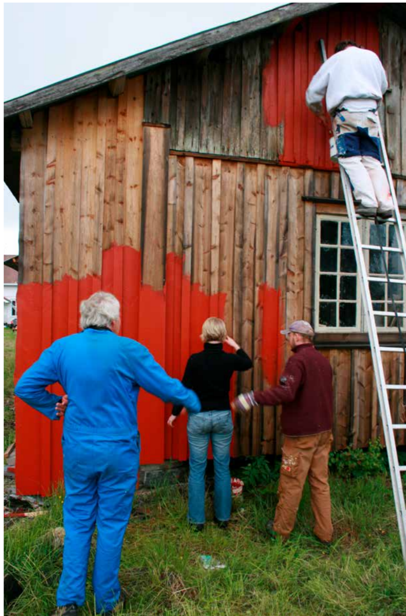
KURS I KOMPOSISJONSMALING i regi av Fortidsminneforeningen i Akershus.