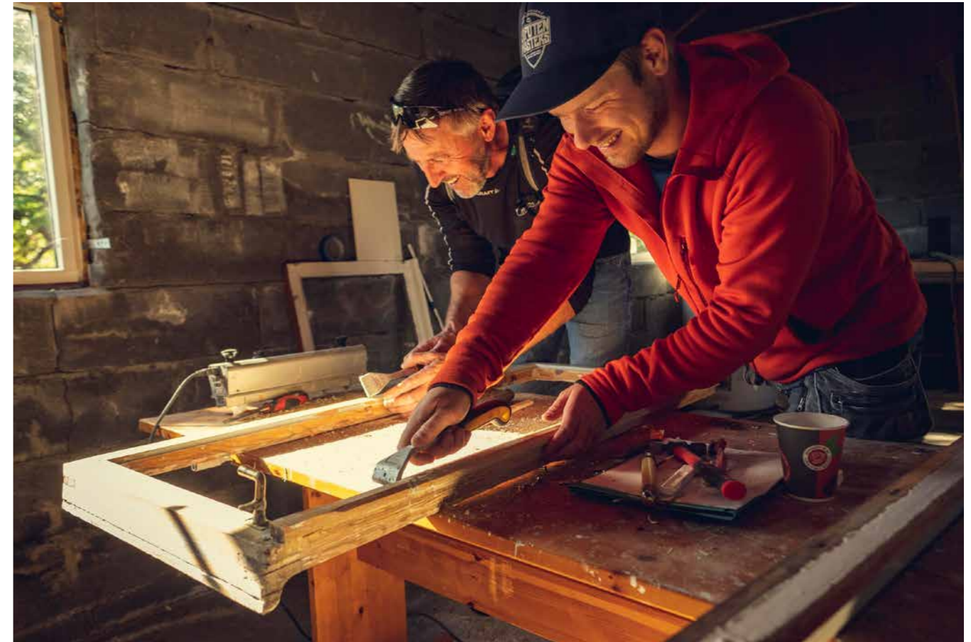
VINDUSRESTAURERING: Kurs i vindusrestaurering i regi av Fortidsminneforeningen.