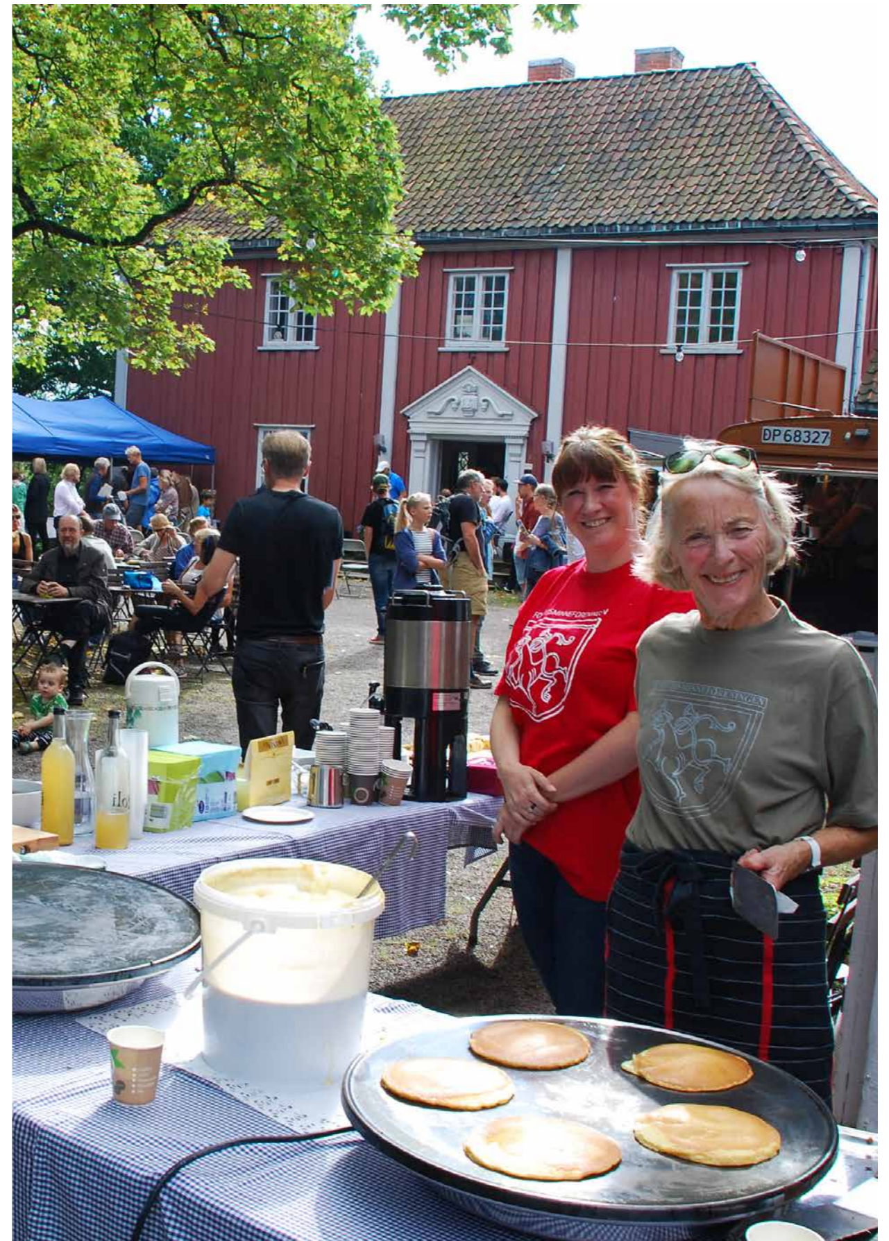
BYGNINGSVERN DAGEN PÅ VØIENVOLDEN i regi av Fortidsminneforeningen Oslo og Akershus. Frivillig innsats for kulturmiljø handler også om sosialt samvær, mat og drikke..

Også andre konvensjoner som verdensarvkonvensjonen, konvensjonen om immateriell kulturarv og Maltakonvensjonen er konvensjoner der frivillige organisasjoner og enkeltpersoner er gitt en viktig rolle. Europarådets rammekonvensjon om beskyttelse av nasjonale minoriteter pålegger også statene å legge forholdene til rette for at de nasjonale minoritetene kan uttrykke, bevare og videreutvikle sin kultur og identitet. Dette må videreføres i frivillighetsarbeidet. Riksantikvaren mener det er viktig å legge til rette for at den samiske befolkning og de fem nasjonale minoritetene og det flerkulturelle samfunnet blant annet blir naturlige parter i frivilligheten.