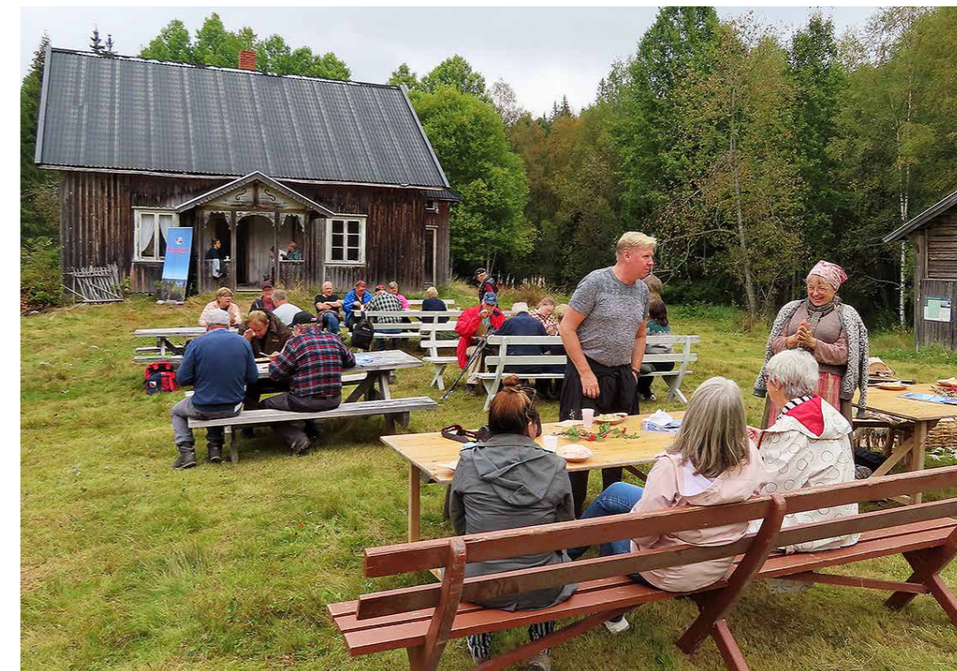
ABBORHØGDA: Arrangement under Kulturminnedagene på Abborhøgda i regi av Finnskogen Natur- og Kulturpark, Norsk Skogfinsk museum og Fortidsminneforeningen.