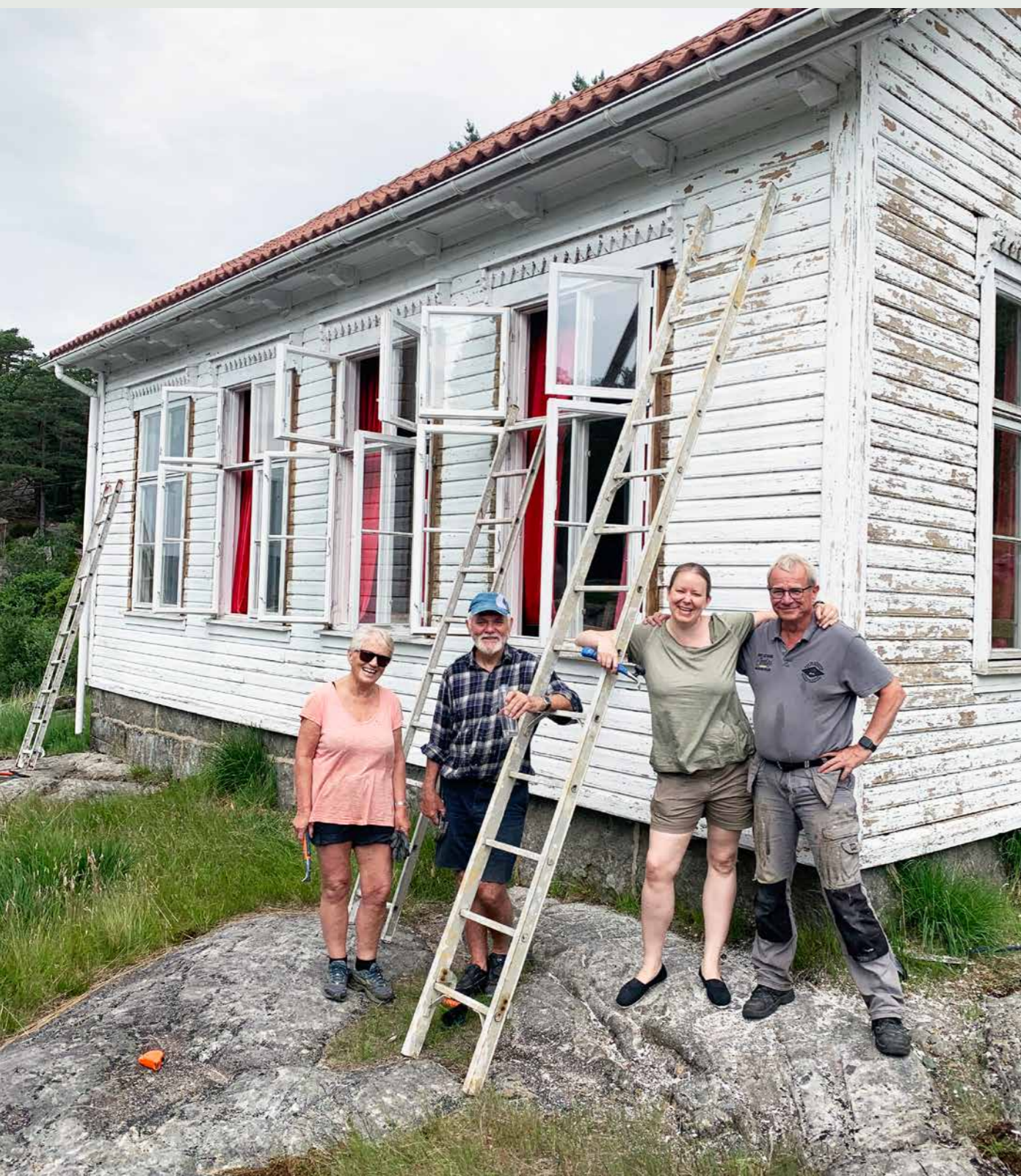
UORGANISERT FRIVILLIG AKTIVITET. Ståby skolehus i Flekkefjord vedlikeholdes av venner av Ståby skolehus. Eneste organisering er en Facebookgruppe og de som vil kan betale inn en liten sum årlig. På denne måten holdes skolehuset ved like og brukes til samlinger og møter.