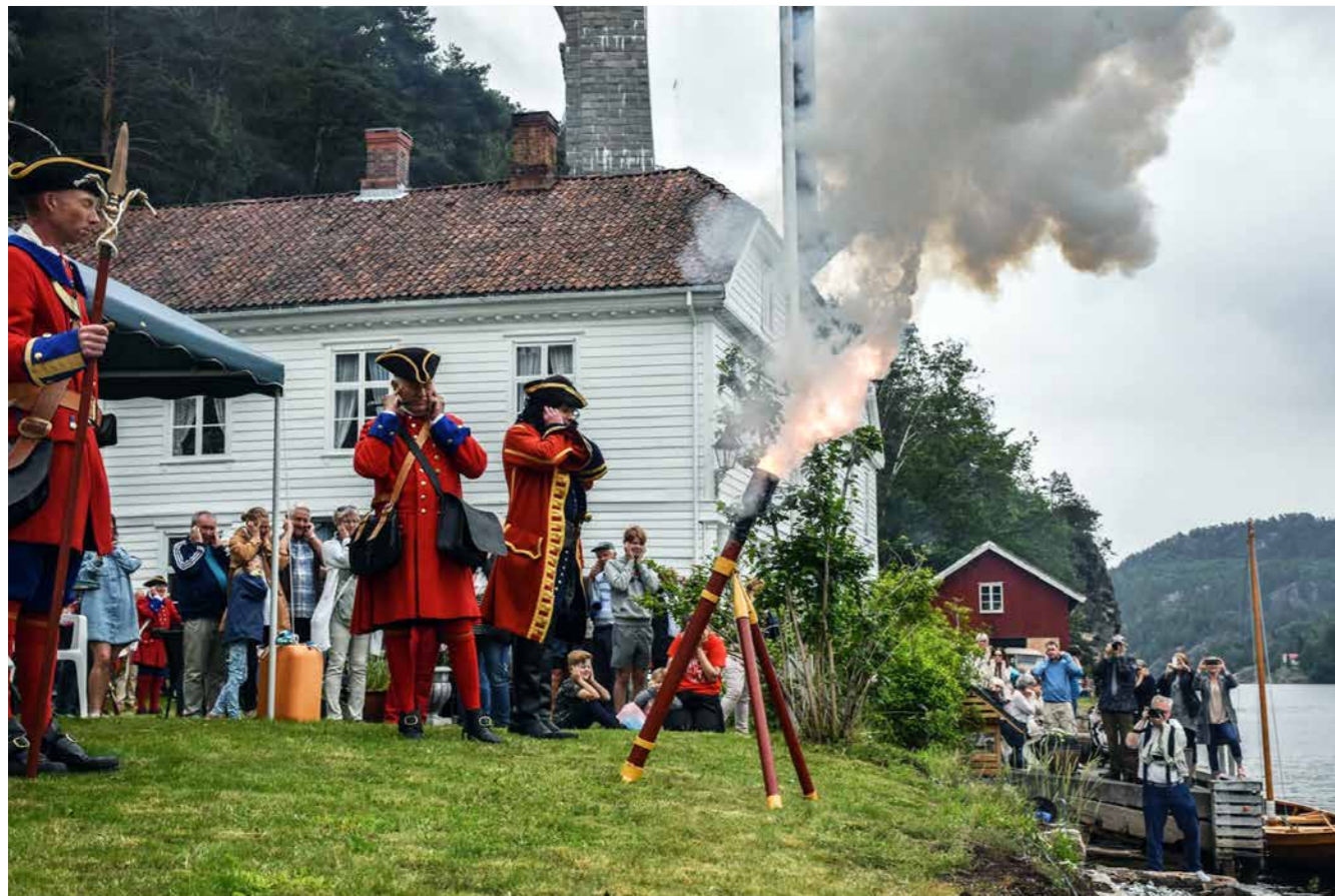
GAMLE SVINESUND er et eksempel på at frivillig innsats nytter. Fortidsminneforeningen avdeling Østfold startet bergingsaksjonen allerede tilbake i 1969. Huset ble berget fra forfall og er i dag i privat eie. Eier åpner for publikum ved utvalgte anledninger. Her fra foreningens jubileumsarrangement i 2019.

Videre ble det understreket at det er behov for ytterligere samordning og forenkling, at effekter av frivillighet bør dokumenteres og at det utarbeides eksempelsamlinger på gode samarbeidsprosjekter. Det ble pekt på at tilskudd og regionale støtteordninger som forutsetter eller samspiller med andre støtteordninger og generell grunnstøtte, er sentralt. I tillegg ble viktigheten av framsnakking og anerkjennelse av lokalt engasjement understreket fra fylkeskommunene.