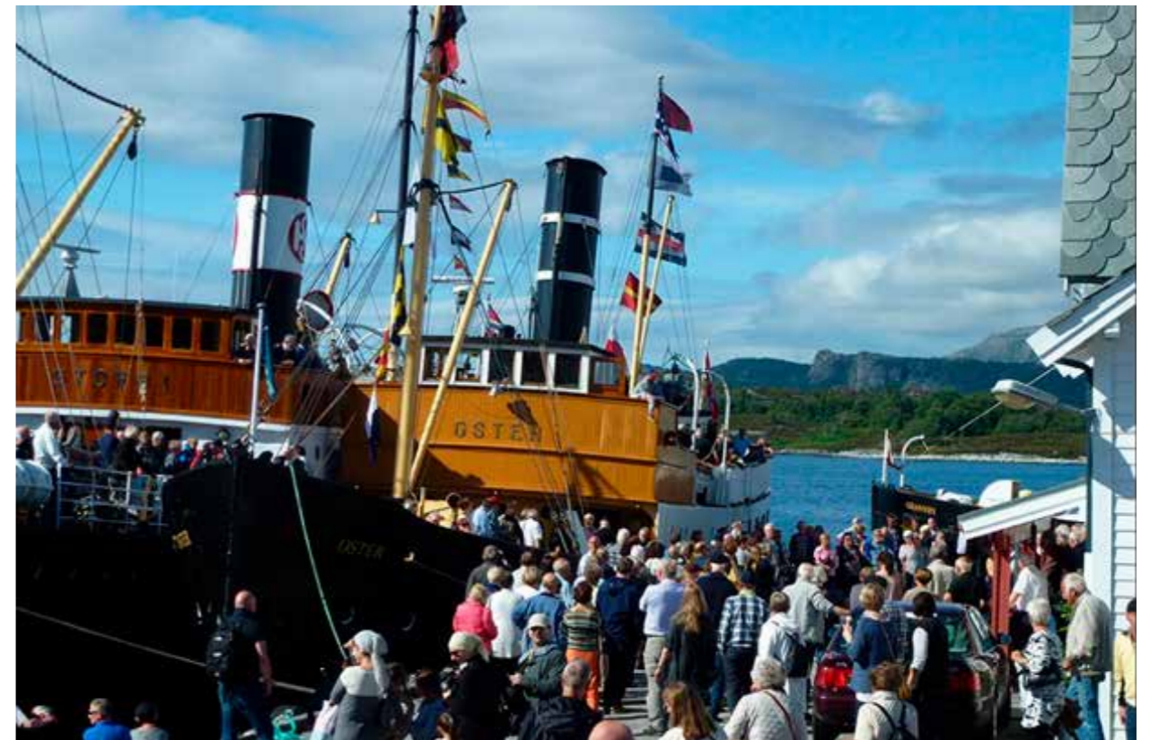
FARTØYVERNEN: Kystkultur samler mange, og fartøyvernet har betydelig frivillig innsats. Foreninger har satt feltet på dagsorden og sikret viktige kulturminner og fartøyer. Veteranbåten Oster er et av 198 fartøyer som er med i Norsk Forening for Fartøyvern.

I stor grad er samspeillet mellom forvaltningen og frivilligheten – lokalt, regionalt og nasjonalt – preget av gjensidig respekt og tillit, men vi vet også at det kan oppstå konflikter i møte mellom frivillig engasjement og forvaltningsmessige krav og forventninger. Dette kan skyldes ulike roller, ulike verdsett og arbeidsmåter i kulturmiljøforvaltningen og i det frivillige kulturvernet.