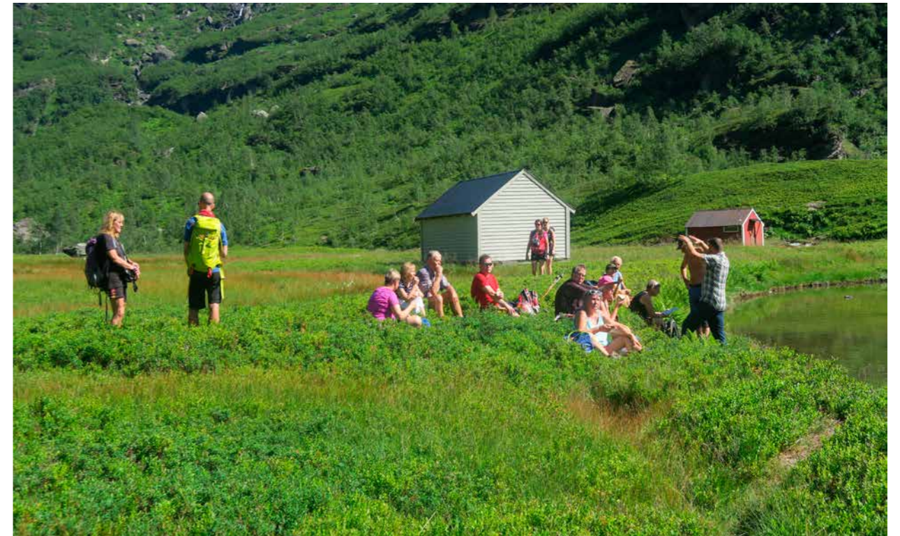
UTEN MAT OG HVILE DUGER HELTER IKKE. Frivillige tar seg en rast ved Ossete.

Riksantikvaren egen strategi påpeker at Riksantikvaren skal inneha ekspert- og rådgiverrollen og samfunnsaktørrollen. Direktoratet skal også tilrettelegge for engasjement og deltakelse. Videre skal vi søke nye måter å bruke kulturmiljø på for å skape lokal identitet og næringutvikling. Ved store utbyggingstiltak som innebærer omfattende arealinngrep som kan påvirke kulturminner, kulturmiljø og landskap, må avklaring av kulturmiljøverdiene skje i samarbeid med lokalmiljøene. Det vil legge grunnlag for gode løsninger og øke bevisstheten om kulturmiljøverdiene. Riksantikvaren skal utvikle bevaringsstrategier og frivillige organisasjoner blir viktig også i dette arbeidet. Alt dette er viktige faktorer hvor frivilligheten spiller en stor rolle, og er viktige arenaer som blir vesentlig for vårt videre samarbeid med frivilligheten.