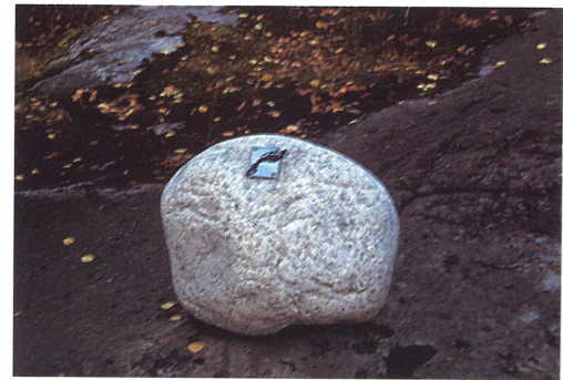
Øverst: Merking av pilegrimsleden. Frøyshov, Hole kommune, Buskerud.