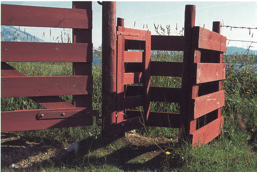
Selvlukkende port i kultursti. Tjøtta, Alstadhaug kommune, Nordland.