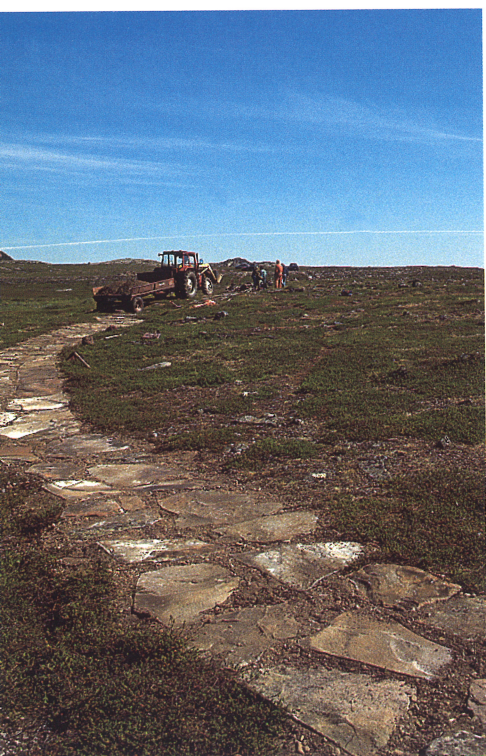
Bruk gjerne stedlig og naturnært materiale. Hellelagt sti på Mortensnes, Unjárgga/Nesseby kommune, Finnmark.

Mye taler for at vi bør være restriktive med tiltak ute i marka. Forsiktig merking som forklares på kart i et fyldigere hefte er ofte en bedre løsning enn mange, store skilt med lange tekster. Skilt krever også mye vedlikehold.