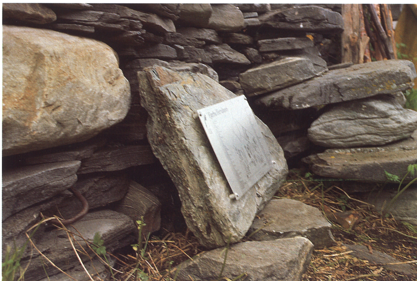
Skiltplate med glass og avstandshylse. «Fotefar mot nord», Birtavarre, Gáivuotna/Kåfjord kommune, Troms.