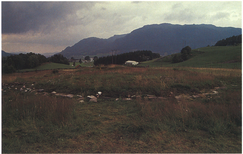
Restaurert gravrøys ett år etter, der fotkjeden er avdekket. Ølen kommune, Hordaland.