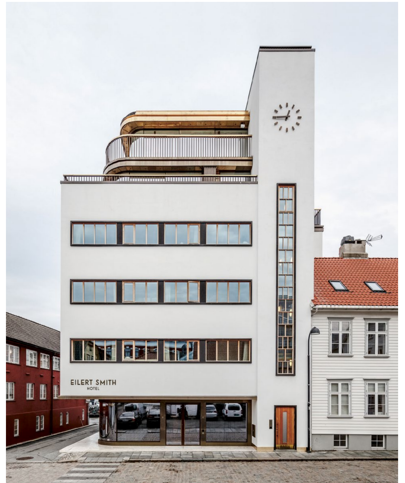
↑ TRANSFORMASJON OG REHABILITERING av Eilert Smith Hotell i Stavanger. Det flotte, funksjonalistiske bygget i Nordbøgaten i Stavanger er oppført i 1937 for Rogaland Fellesskjøp. I 2019 ble bygningen rehabilitert, transformert og bygget på for å kunne tas i bruk som hotell. Arbeidet er gjort på en slik måte at det opprinnelige, tidstypiske uttrykket er bevart og videreført.

Bærekraftig utvikling, ombruk og fortetting av allerede utbygd areal er pekt på som viktige bidrag til å redusere klimagassutslippene.