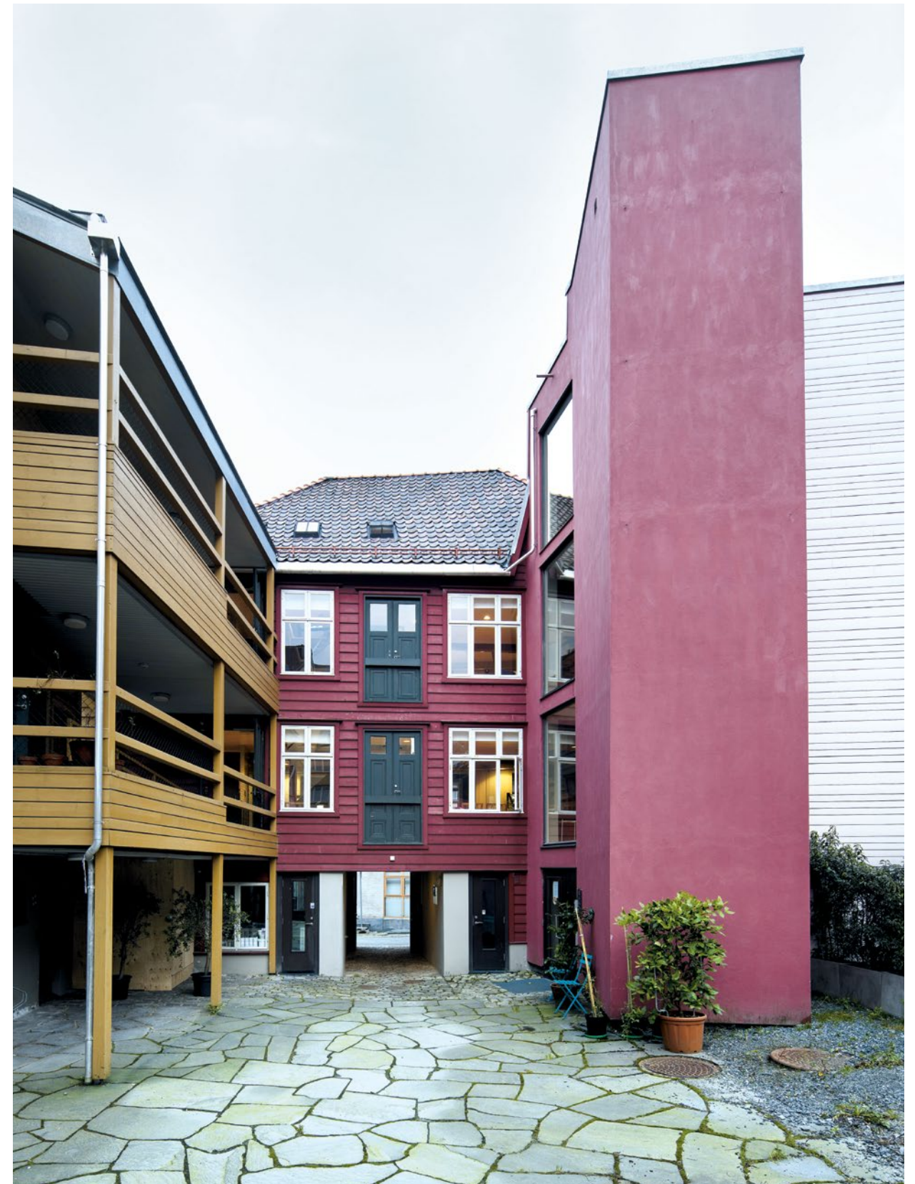
↑ OMBRUK AV ELDRE TREHUS til velfungerende kontorlokaler. Da Byantikvaren i Bergen skulle ha nye kontorlokaler, ønsket etaten å skape et forbildeprosjekt som skulle vise hvordan gamle bygninger kan utvikles og få nytt liv. Et viktig mål med prosjektet var å ombruke og gjenskape så mye som mulig av den opprinnelige materialbruken og arkitekturen.

Riksantikvaren er direktorat for kulturmiljøforvaltning og er underlagt Klima- og miljødepartementet. Direktoratet skal sørge for at den statlige kulturmiljøpolitikken blir gjennomført og har et overordnet faglig ansvar for fylkeskommunenes og Sametingets arbeid på kulturmiljøfeltet. Riksantikvaren har myndighet til å avgjøre hvorvidt kulturminner, kulturmiljøer og landskap er av nasjonal interesse. Riksantikvaren har også innsigelsesmyndighet og myndighet til å gi dispensasjon fra kulturminne-