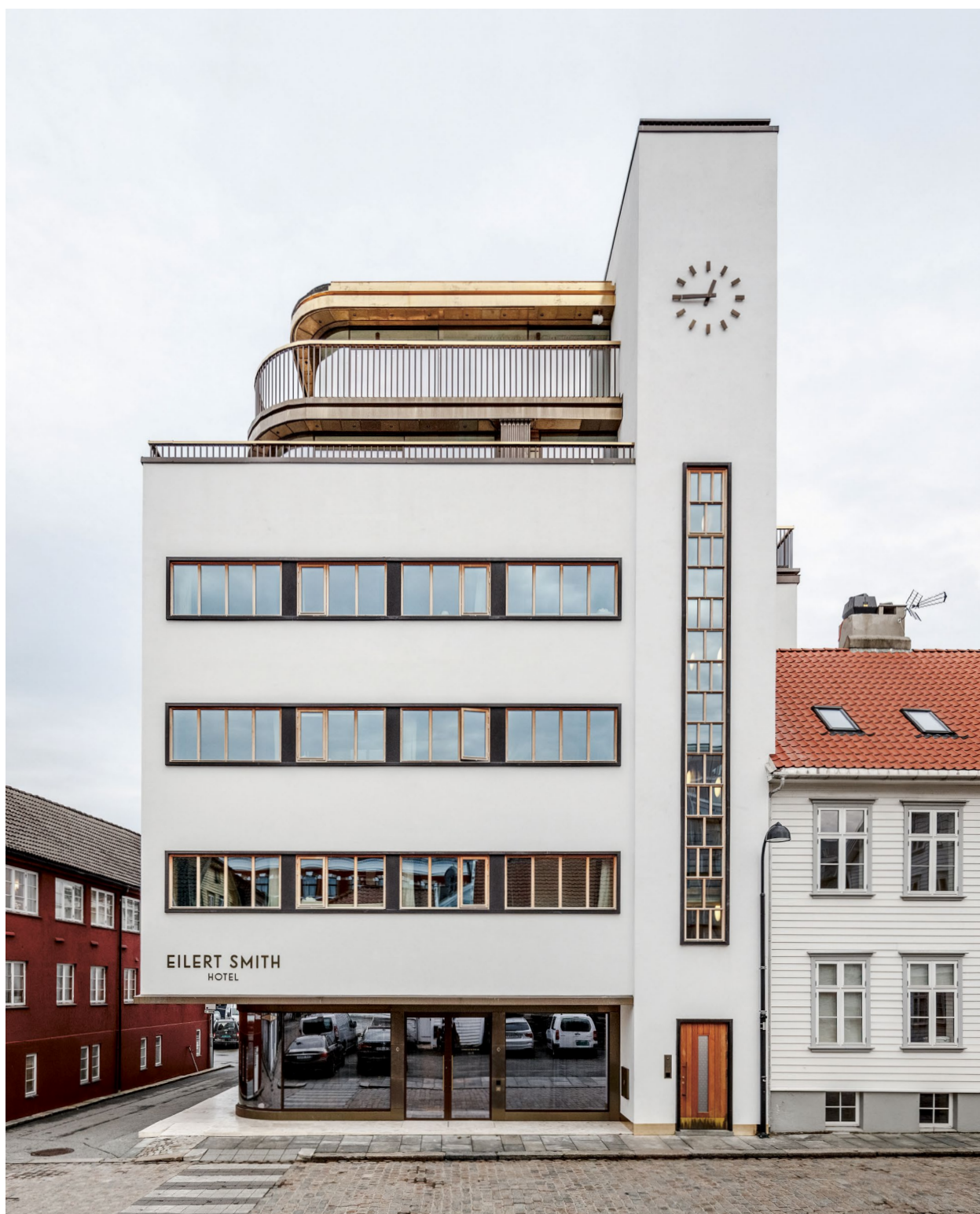
↑ TRANSFORMASJON OG REHABILITERING av Eilert Smith Hotell i Stavanger. Det flotte, funksjonalistiske bygget i Nordbøgaten i Stavanger er oppført i 1937 for Rogaland Fellesskjøp. I 2019 ble bygningen rehabilitert, transformert og bygget på for å kunne tas i bruk som hotell. Arbeidet er gjort på en slik måte at det opprinnelige, tidstypiske uttrykket er bevart og videreført.