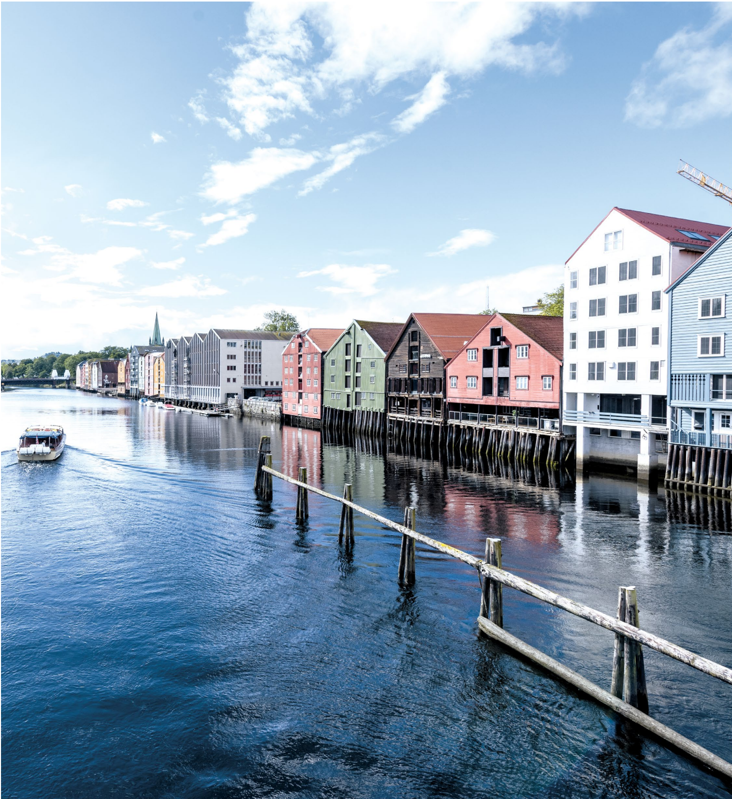
↑ BRYGGENE I TRONDHEIM BERIKER BYEN. Bygningene ligger langs Nidelva i Kjøpmannsgata og brukes til mange ulike formål. I nyere tid har flere bygninger føyd seg i rekka, inspirert av formspråket til de eksisterende husene.