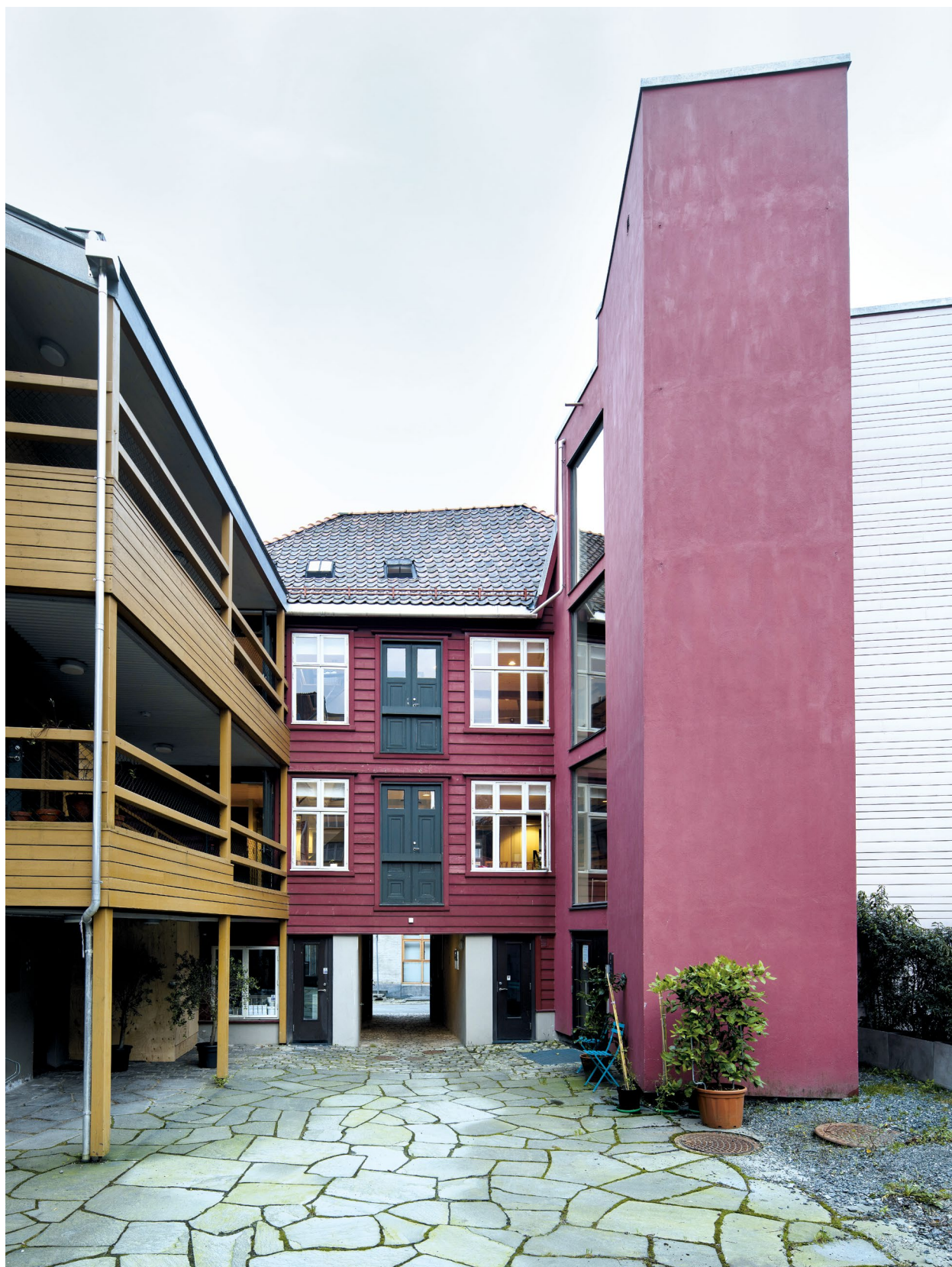
↑ OMBRUK AV ELDRE TREHUS til velfungerende kontorlokaler. Da Byantikvaren i Bergen skulle ha nye kontorlokaler, ønsket etaten å skape et forbildeprosjekt som skulle vise hvordan gamle bygninger kan utvikles og få nytt liv. Et viktig mål med prosjektet var å ombruke og gjenskape så mye som mulig av den opprinnelige materialbruken og arkitekturen.