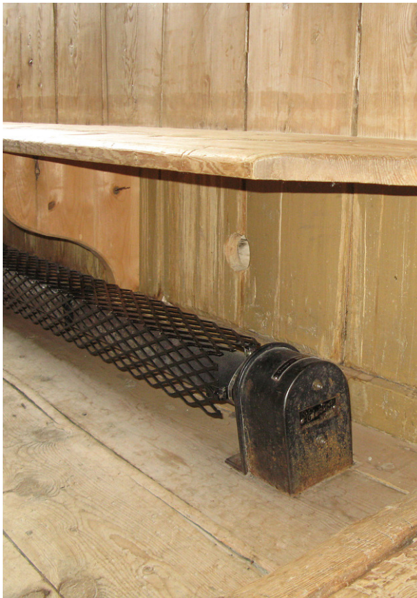
Fra Lesjaskog kirke.