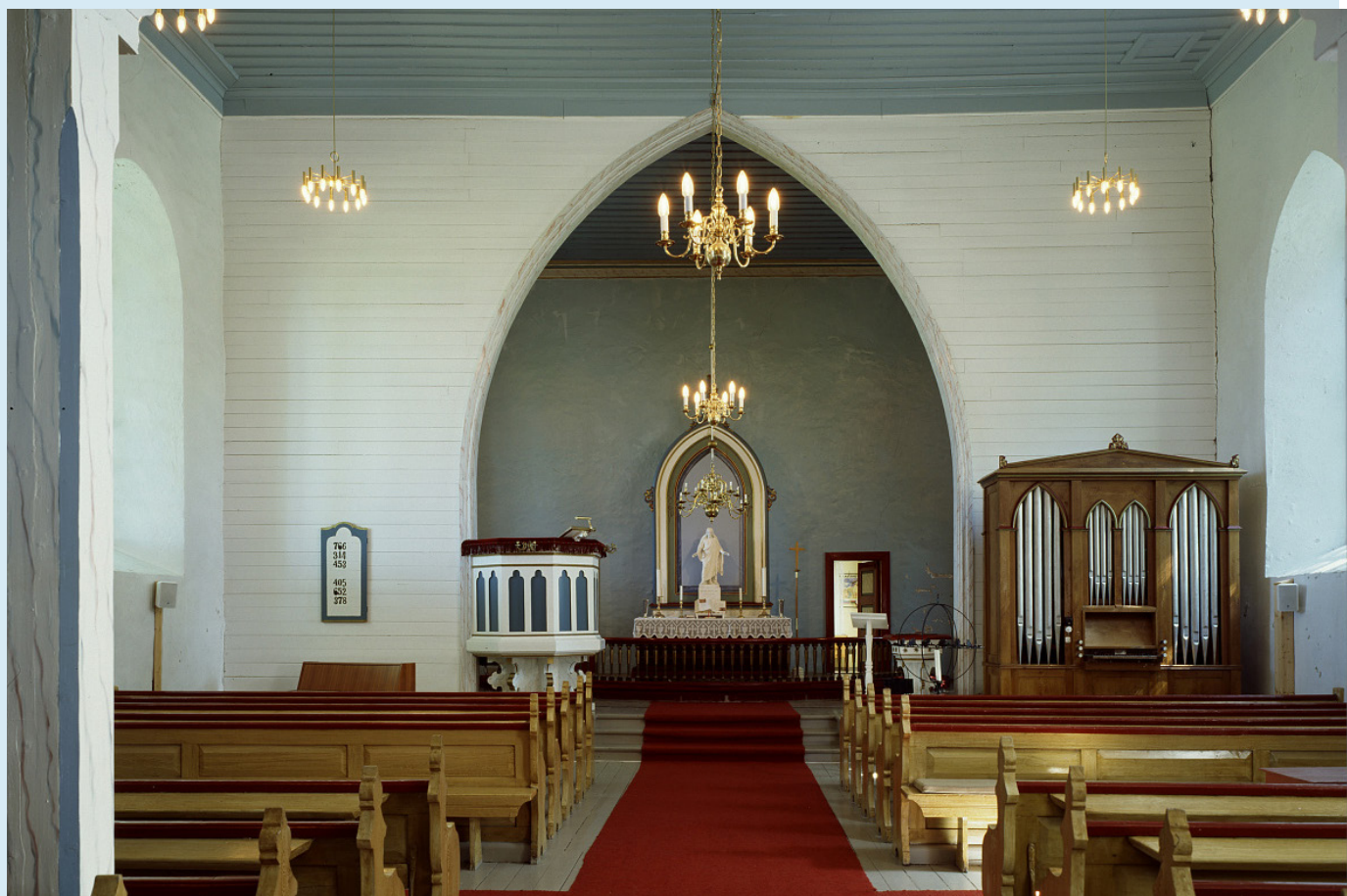
Tjøtta kirke.