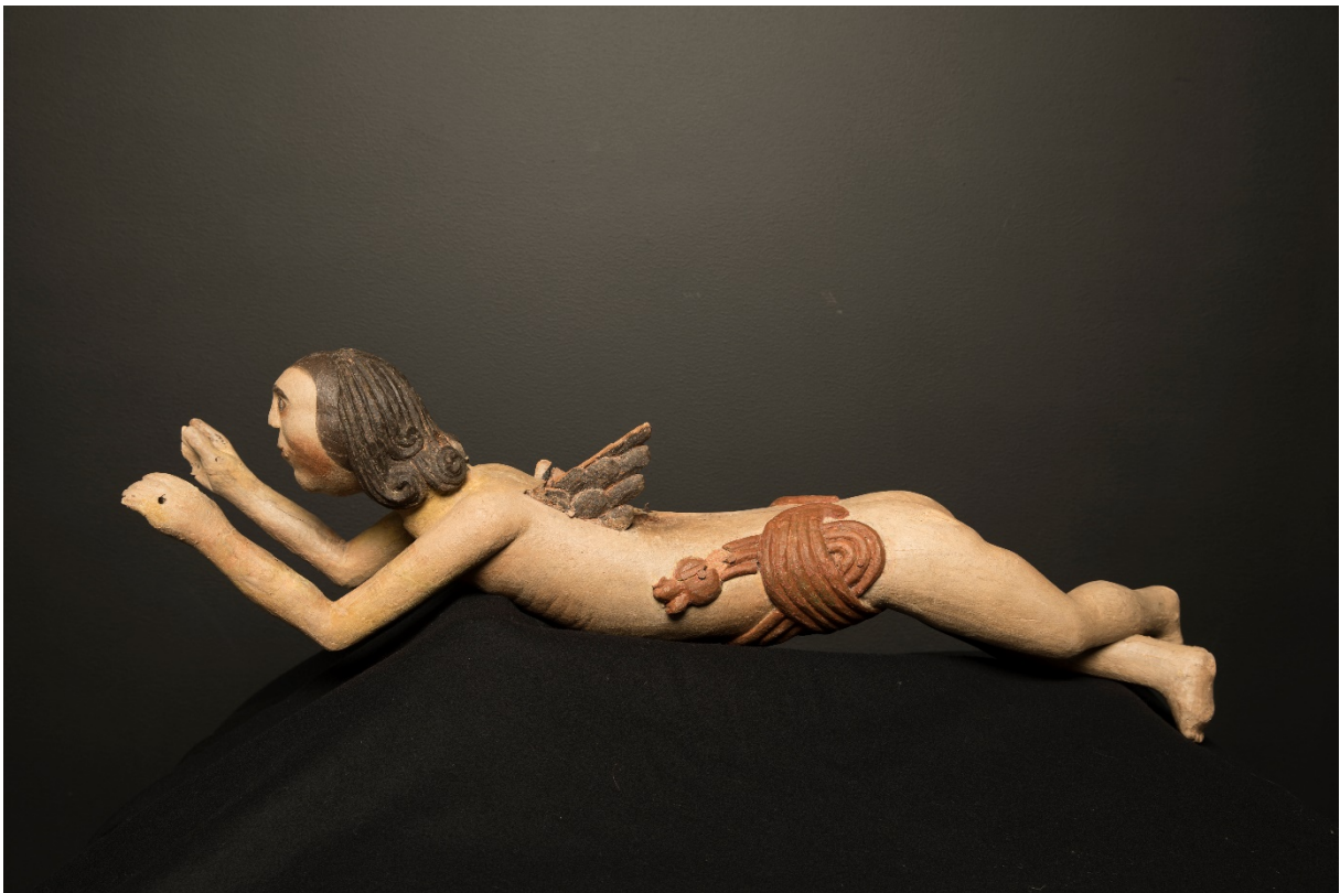
Figur 22 Heloptak basunengelens venstre side, etter behandling.