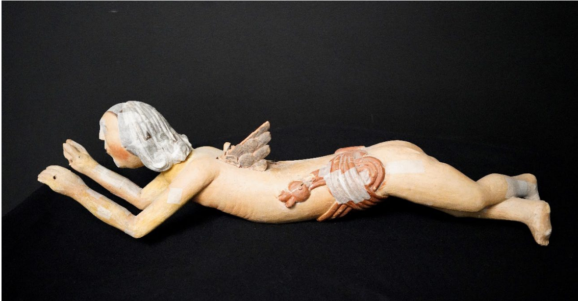
Figur 3 Helopptak engel fra Rygge kirke, sett fra venstre side, før behandling med forsidebeskyttelse, etter transport.