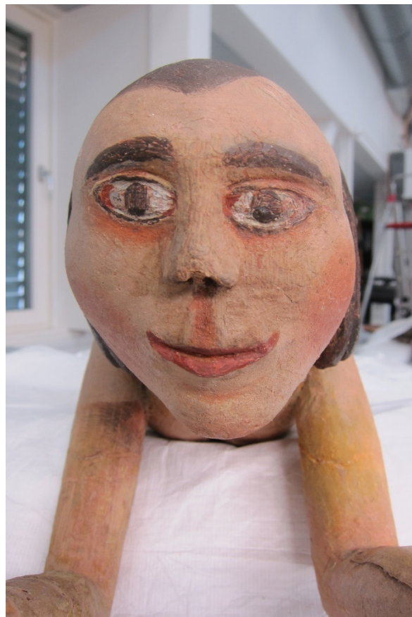
Figur 19 Engelenes ansikt etter retusjering.