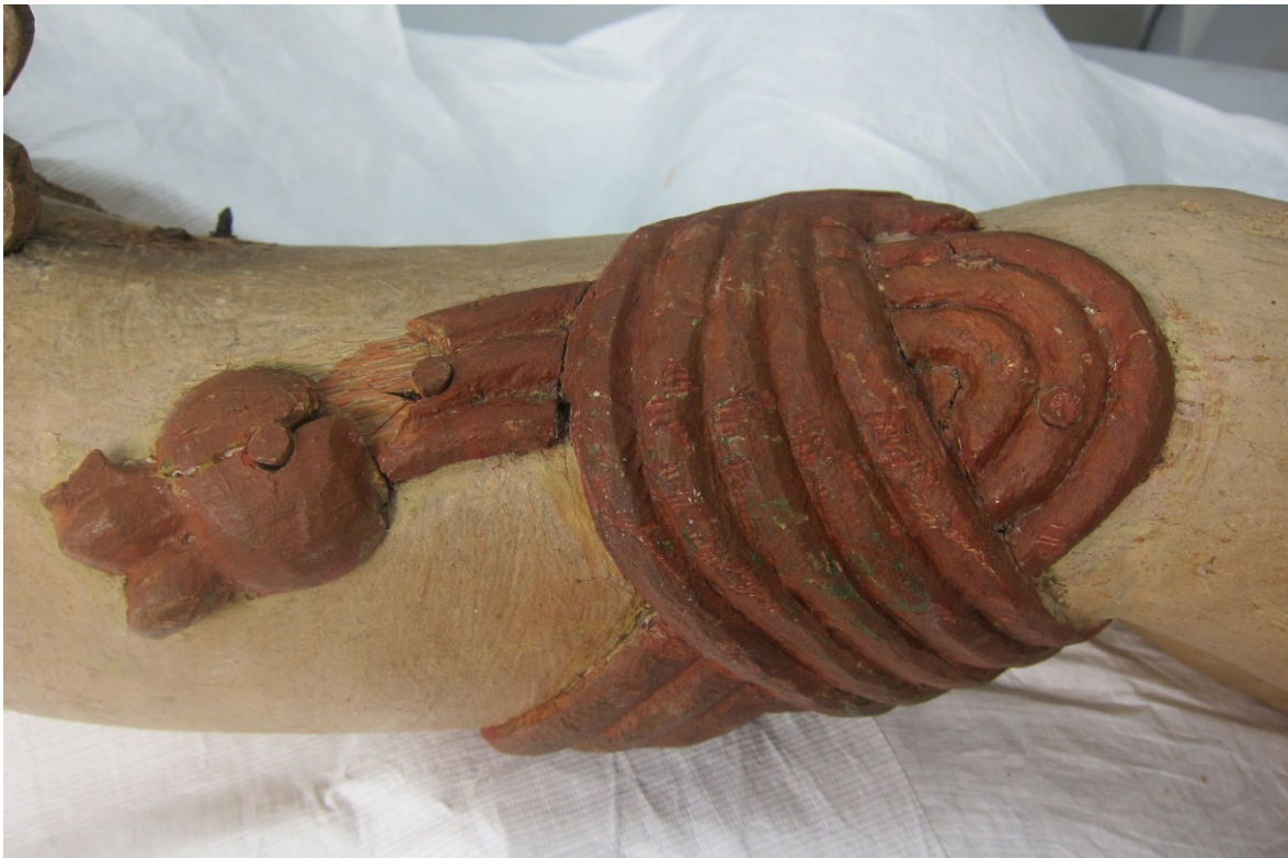
Figur 16 Venstre side av lendekledet etter festing av maling og retusjering. Utfall i treverk er retusjert.

Til retusjering ble det brukt lys- og vannstabile Gamblin colours som er utviklet til konservering. Integreerte retusjeri strekteknikk ble utført med spisspensel og lagt inn i skader i malingslaget. I tillegg ble misfargete eldre retusjer stedvis justert i forhold til omgivelsesfargen. Spesielt på armene var det overmalinger og retusjer fra forskjellige tidspunkt i fortiden. Her ble det forsøkt å formidle mellom de ulike fargelag ved å justere med strekretusjer.