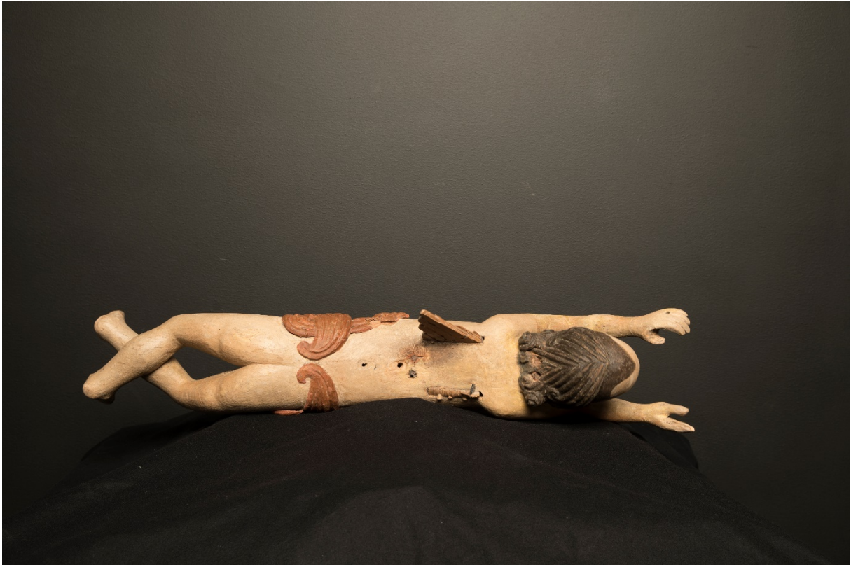
Figur 25 Helopptak basunengelens overside, etter behandling.