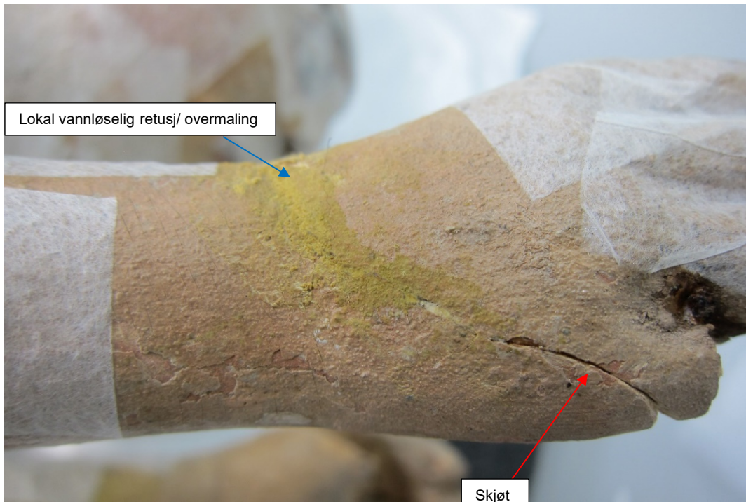
Figur 8 Høyre hånd har en skjøl som ser ut å være opprinnelig (rød pil).