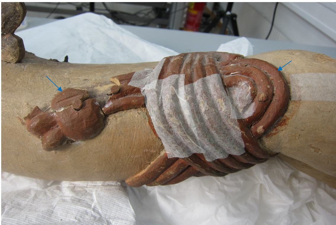
Figur 7 Venstre side av lendeledet. Den midtre delen er skåret sammen med engelens kropp, mens to biter er skåret ut ekstra og festet med plugg (blå piler).