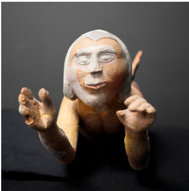
Figur 2 Engel fra Rygge kirke forfra. Før konservering, med nødsikring for transport.