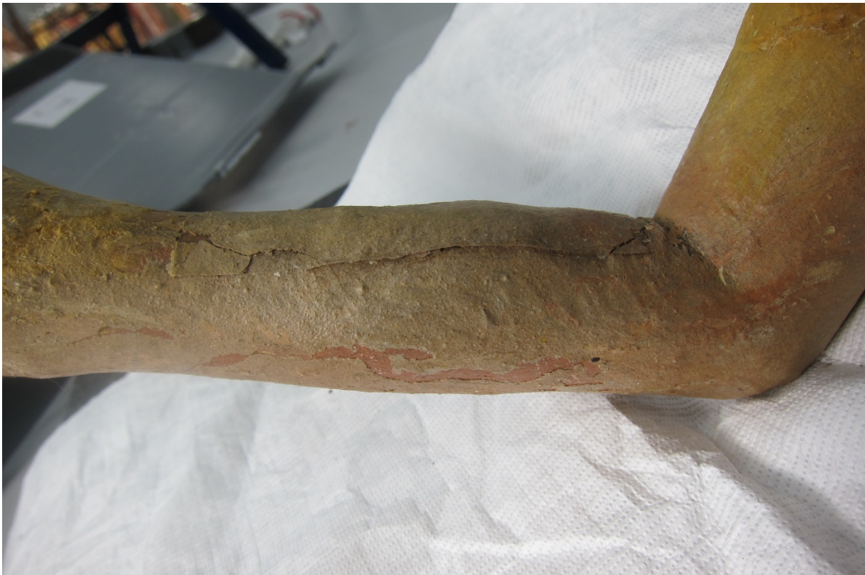
Figur 13 Detalj. Oppskallet maling på engelens venstre arm.