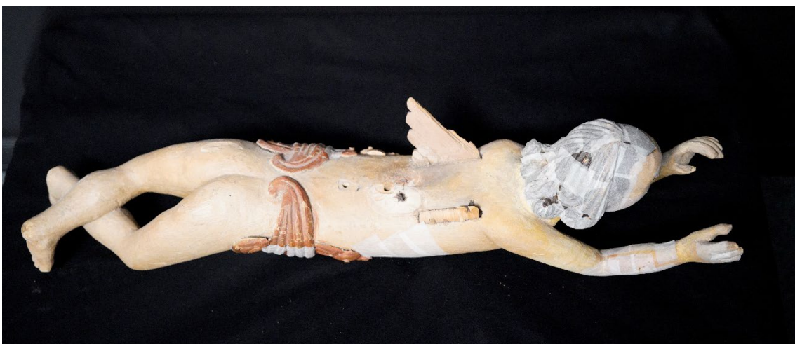
Figur 5 Helopptak engel fra Rygge kirke, sett ovenfra, før behandling med forsidebeskyttelse, ved ankomst på NIKUs konserveringsatelier.