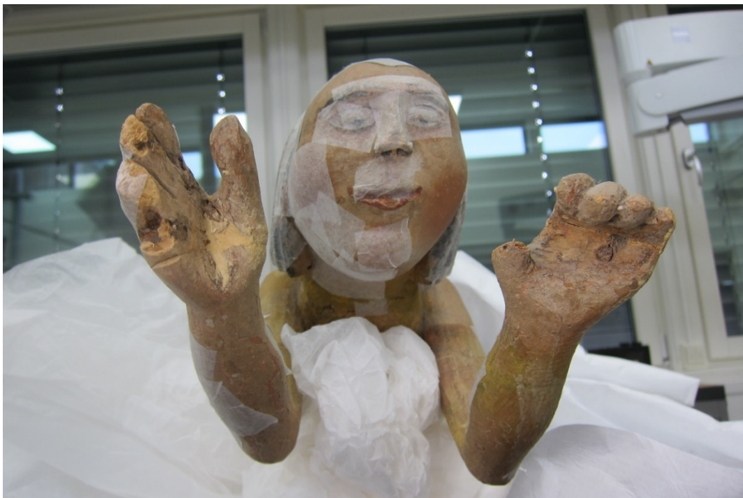
Figur 9 Flere fingre er skadet. Hendene har plugger til festing av basun og skriftbånd.