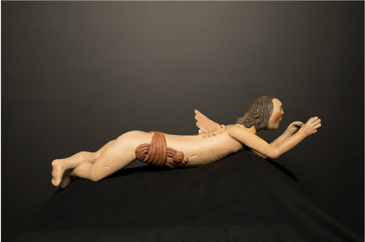
Figur 23 Helopptak basunengelens høyre side, etter behandling.