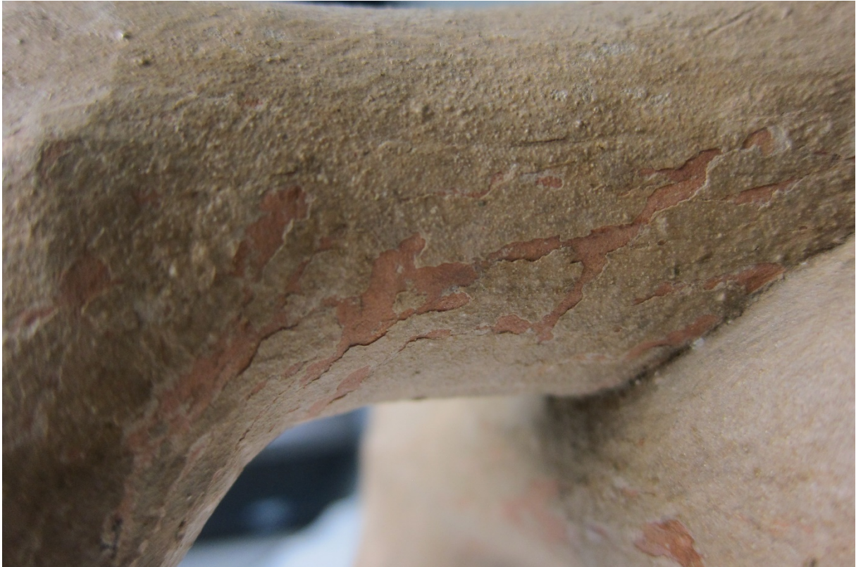
Figur 14 Detalj. Oppskallet maling på engelens beiner.