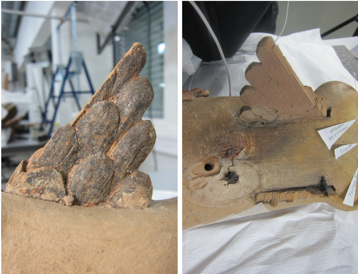
Figur 6a og b Vingene er brukket av. Av venstre vinge er det bevart en triangel med målene 5,5 x 9 x 10 cm.