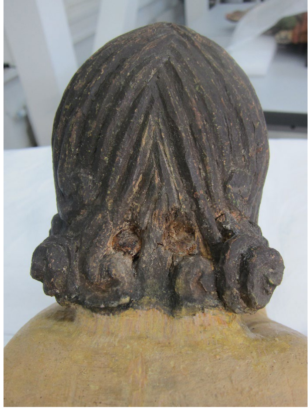
Figur 21 Hår og nakke etter retusjering.