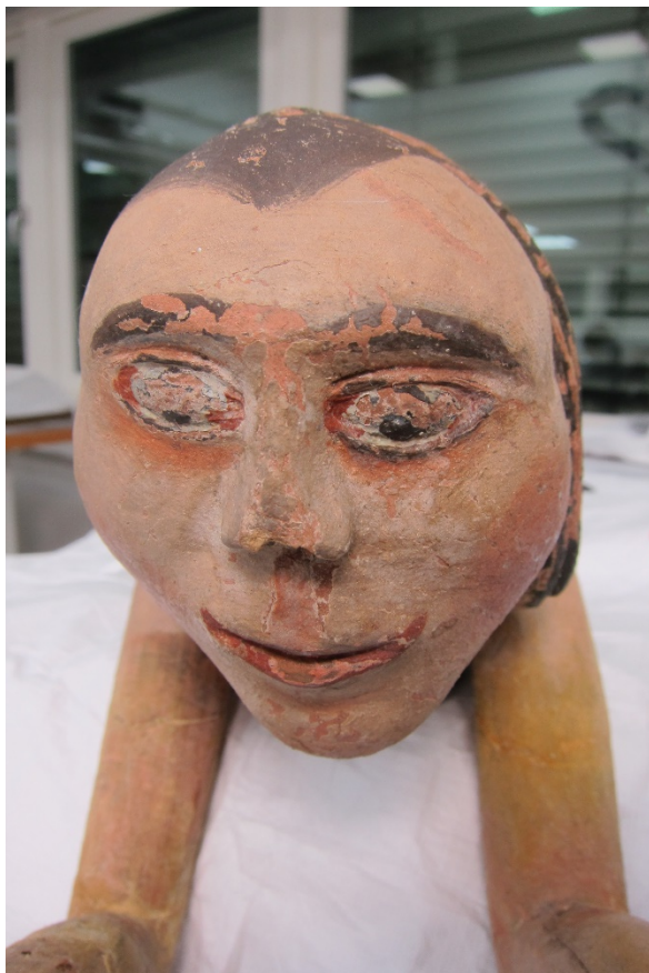
Figur 18 Engelenes ansikt før retusjering.