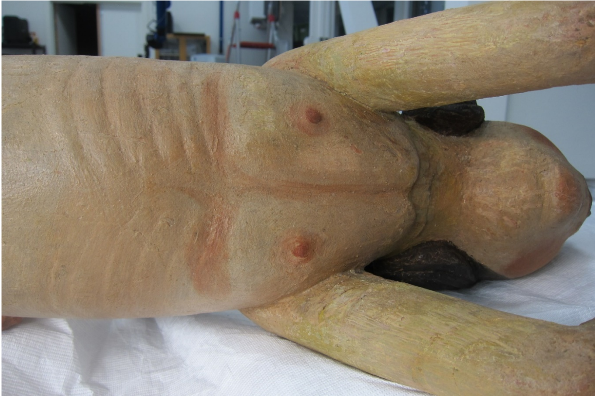
Figur 17 Skulpturens bryst etter festing av maling, rensing og retusjering.