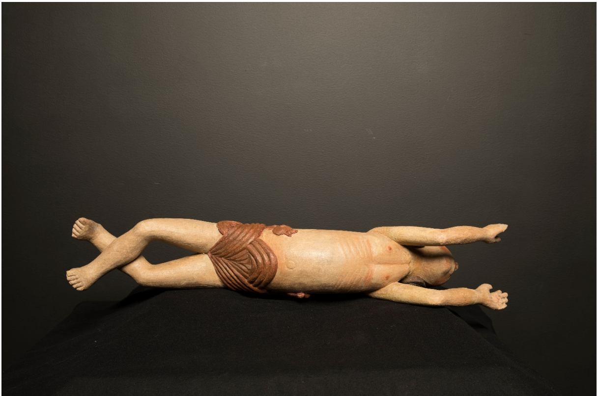
Figur 24 Helopptak basunengelens underside, etter behandling.