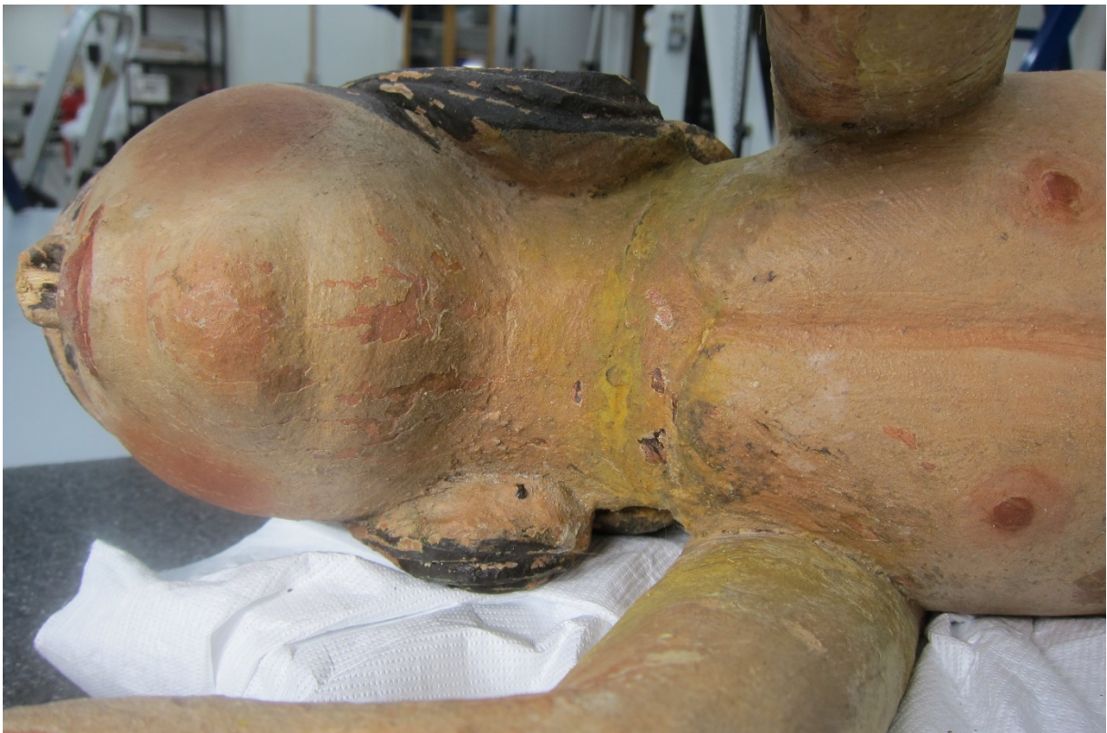
Figur 15 Detalj. Oppskallet maling under engelens hake. Gule retusjer på hals og armer.