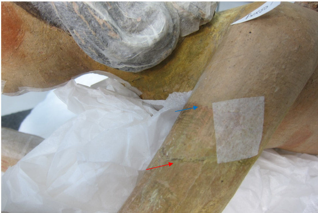
Figur 11 Armene er skjøtt på (rød pil). Den opprinnelige karnasjonsfargen har blitt forsøkt avdekket ved en tidligere behandling (blå pil).