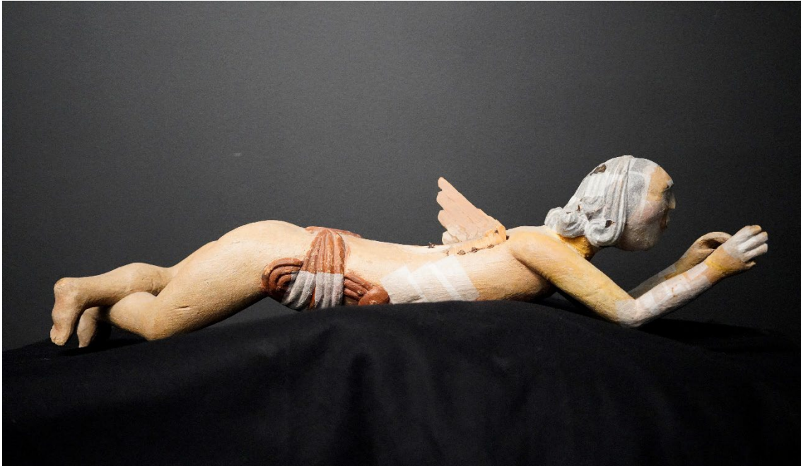
Figur 1 Helopptak engel fra Rygge kirke sett fra høyre side før behandling med forsidebeskyttelse ved ankomst på NIKUs konserveringsatelier.