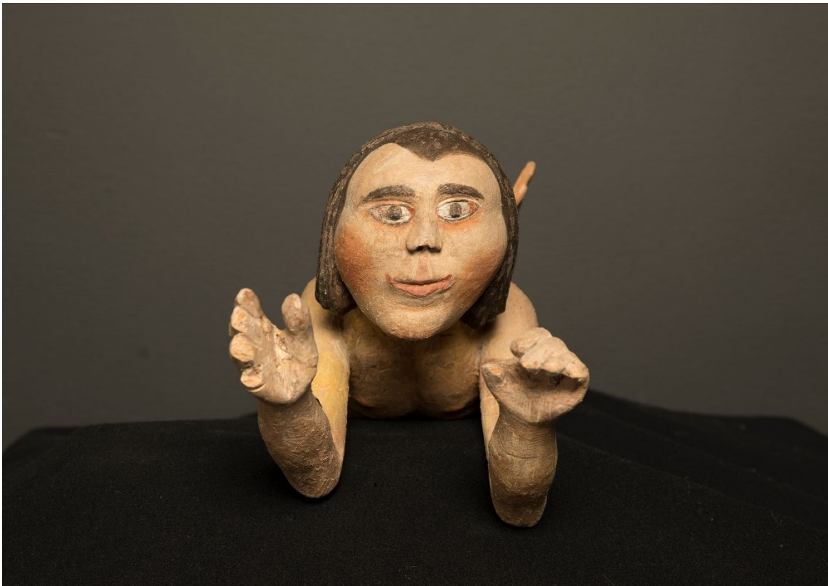
Figur 26 Helopptak basunengel front, etter behandling.