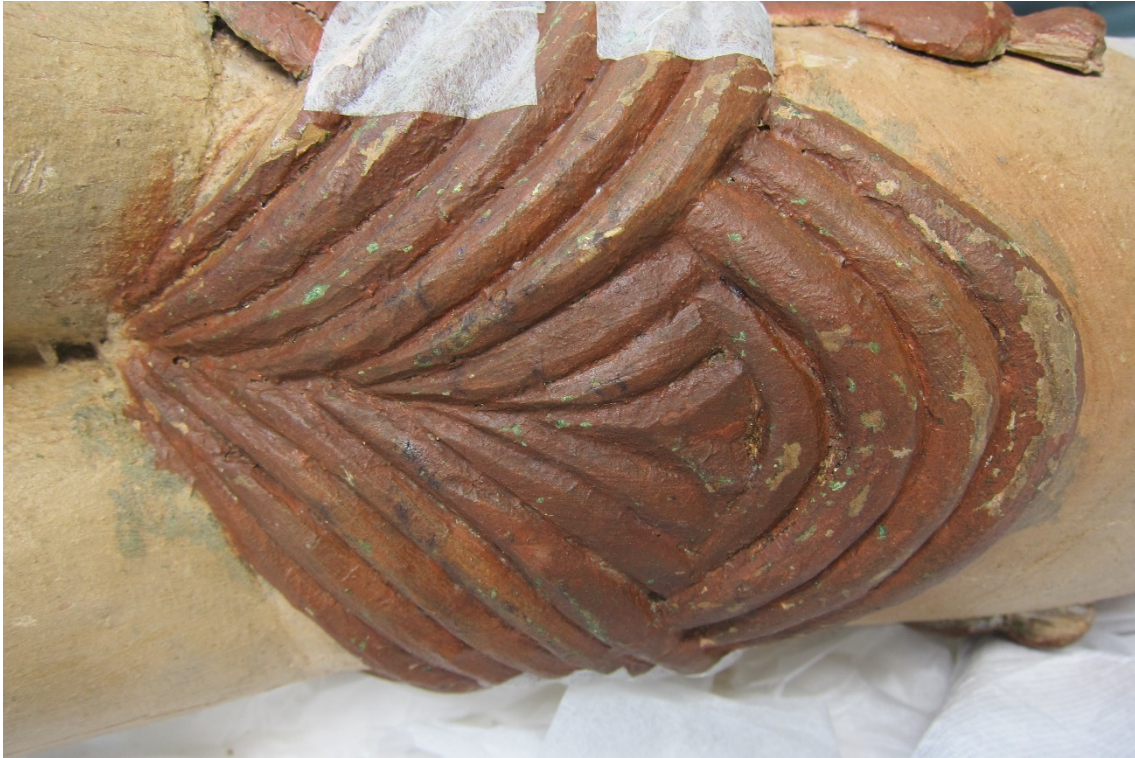
Figur 12 Lendeklede med av- og oppskallinger.