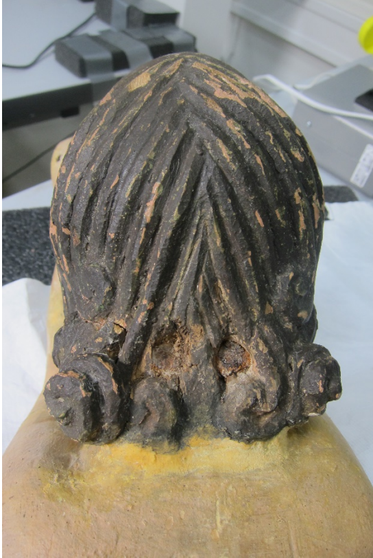
Figur 20 Hår og nakke før retusjering.