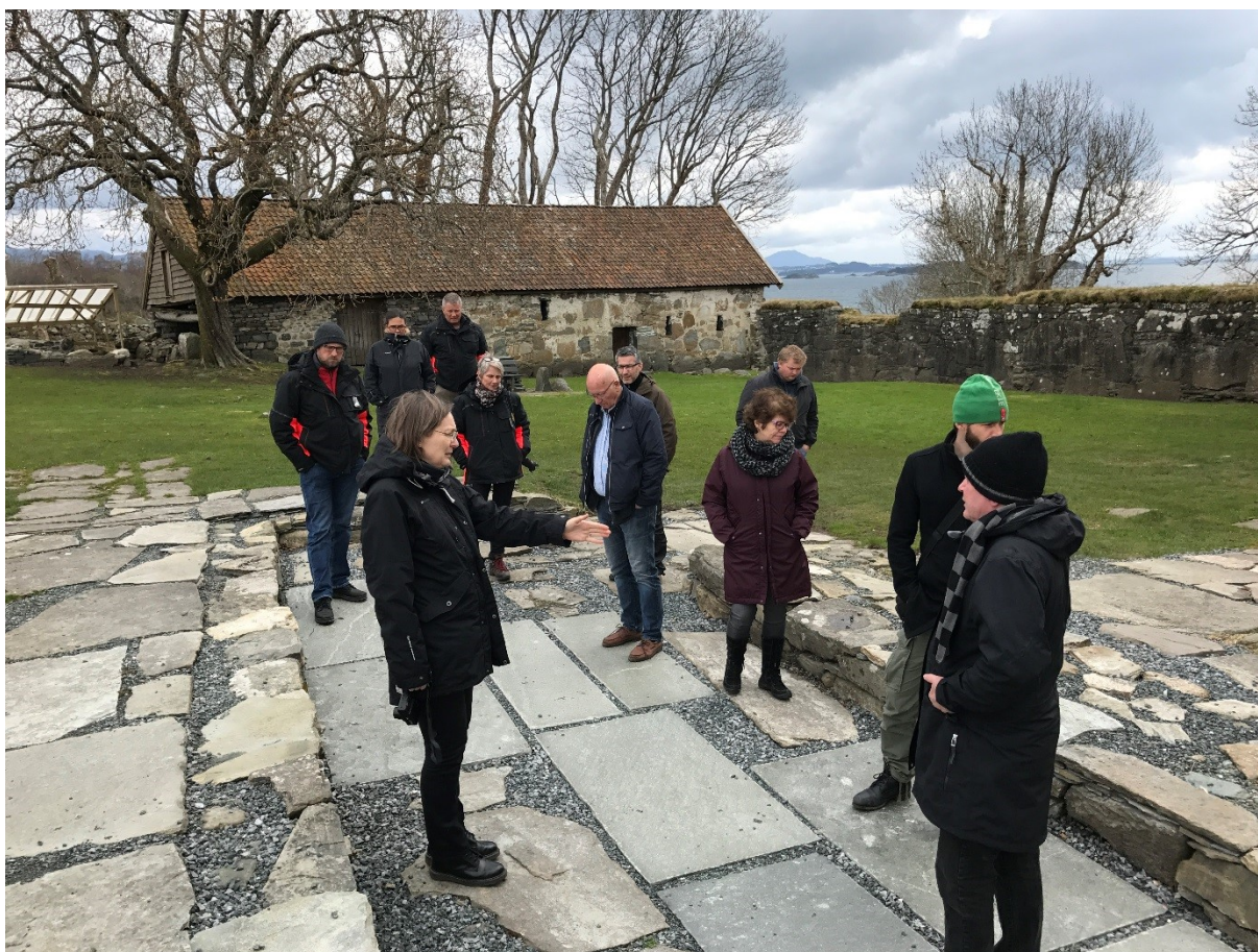
Synfaring i korsgangen april 2017.