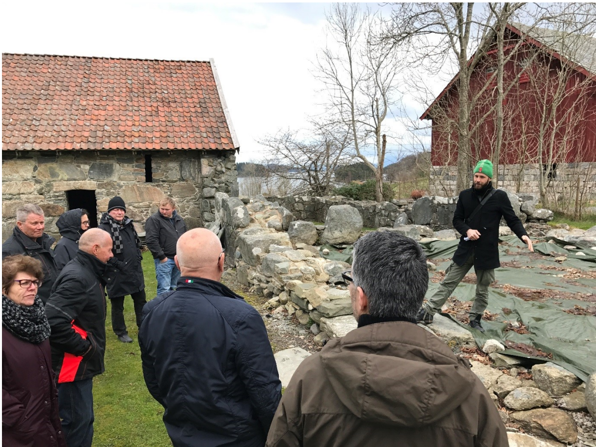
Synfaring i vestfløyen april 2017.