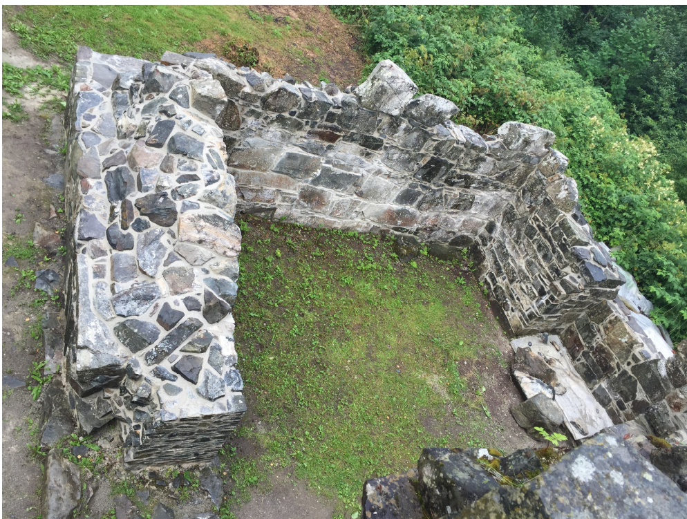
Foto 2005/06.28 2016-07-31 17.11.47: Ferdig murt toppdekke 2016.