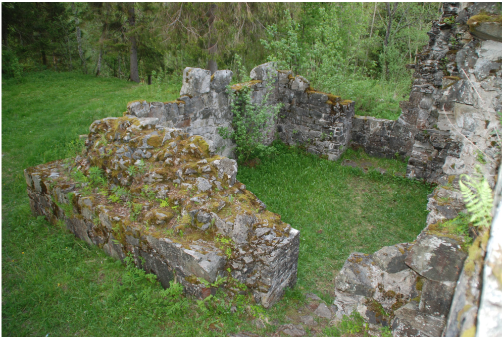
Foto 2005/06.02-02: Toppen på nordre korsarm, slik den framstod i 2006.

Arbeidet på Munkeby klosterruin i 2016/17 har vært slutføring av nordre korsarm og meisling av hele nordvegg i skipet. I nordre korsarm ble samtlige sementholdige mørtler hugget ut, steiner limt og nye fuger i kalkmørtel tilført. Oppløst fugemateriale og sementholdige mørtler i murkjerne er fjernet og erstattet med naturlig hydraulisk kalkmørtel, styrke 3,5 (NHL 3,5). Kalkmørtel er blandet på stedet med lokal sand 0-4 millimeter naturlig bakkesand. Fuger er ettervannet og etterkomprimert.