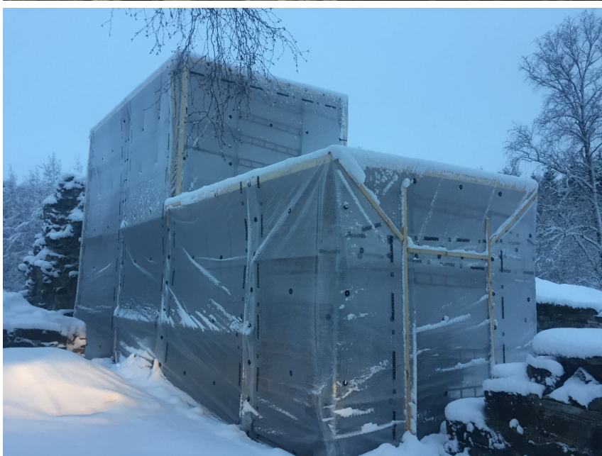
Foto 2005/06.28- 2016-06-09 10.21.26 (øvt): Ferdigstilling av toppdekke Nordre korsarm.

Foto 2017-01-03 10.35.54 (nedst): Nordveggen i skipet klargjort for meisling vinteren 2016/-17.