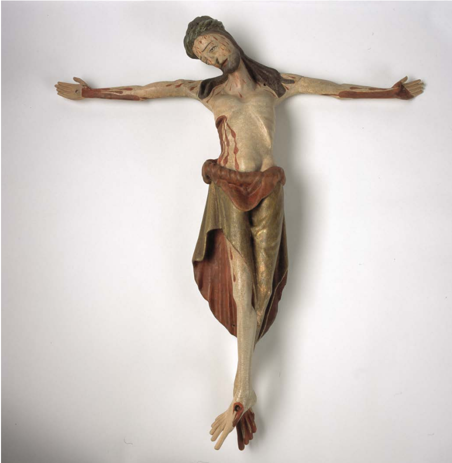
Avdekkja: Det vesle krusifikset etter behandling.

døme på korleis kunst frå mellomalderen vart tilpassa kyrkjelege og kunstnariske verdiar på 1700-talet.