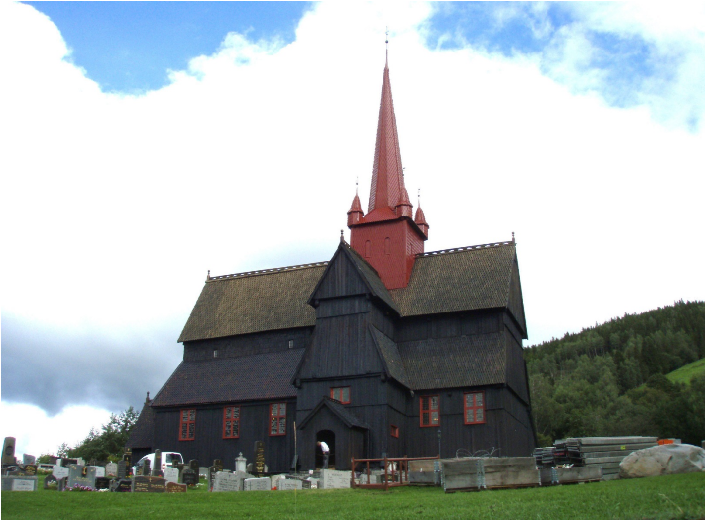
Tjærebreidd: Kyrkja med ny spontekking og tjære .

Det har over flere år vært observert at preikestolen i stavkyrkja har vore i dårlig konserveringstilstand. I 2014 vart difor preikestolen konserverert av NIKU. Preikestolen er datert til 1703, samtida med kongemonogrammet i korskiljet. Konserveringsarbeidet besto hovudsakleg i festing av måling og rensing av overflata for støv og smuss. Det vart også utført noko kitting på nokre av dei mest utsette delane på preikestolen. Desse vart tona inn med fargar etterpå. 5 Utover arbeidet med limfarkedekoren i kyrkja, dei to krusifiksa og preikestolen, vart måleriet Tempelskatten behandla. 6