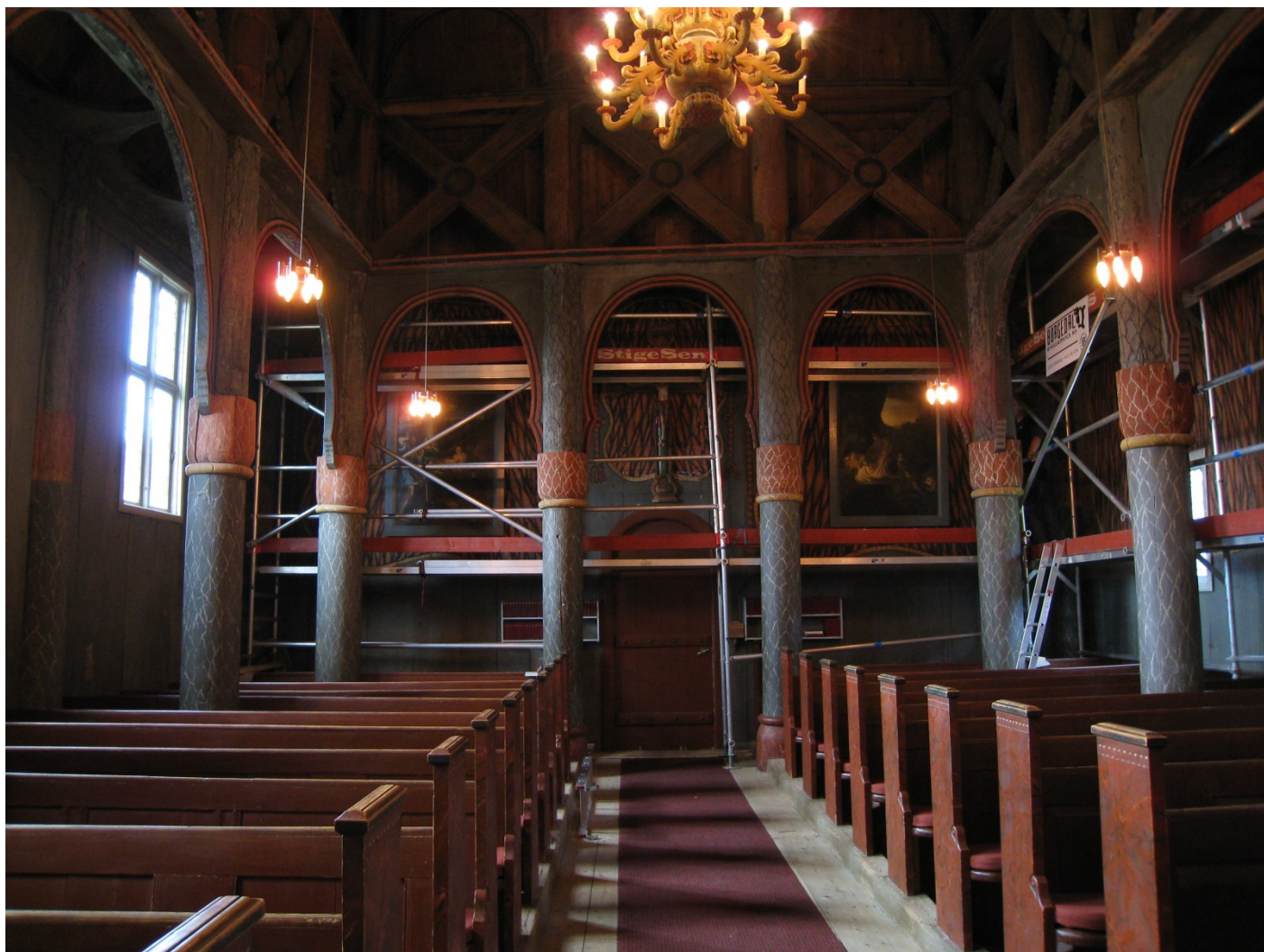
Skipet: Arbeidet med dekoren i kyrkja.