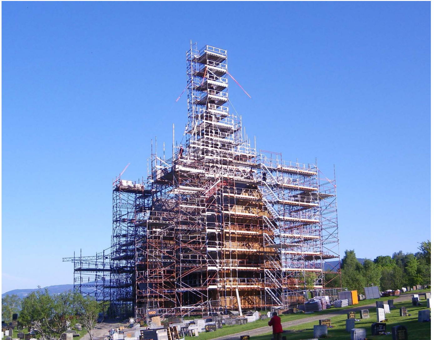
Takarbeid: Kyrkja slik ho stod under arbeidet med taket.