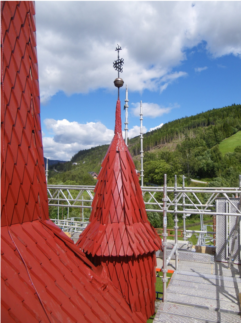
Fial: Ny spontekking og linoljemåling på spir og fialar.

undersøkast nærare. Kyrkja hadde og behov for tjæring.