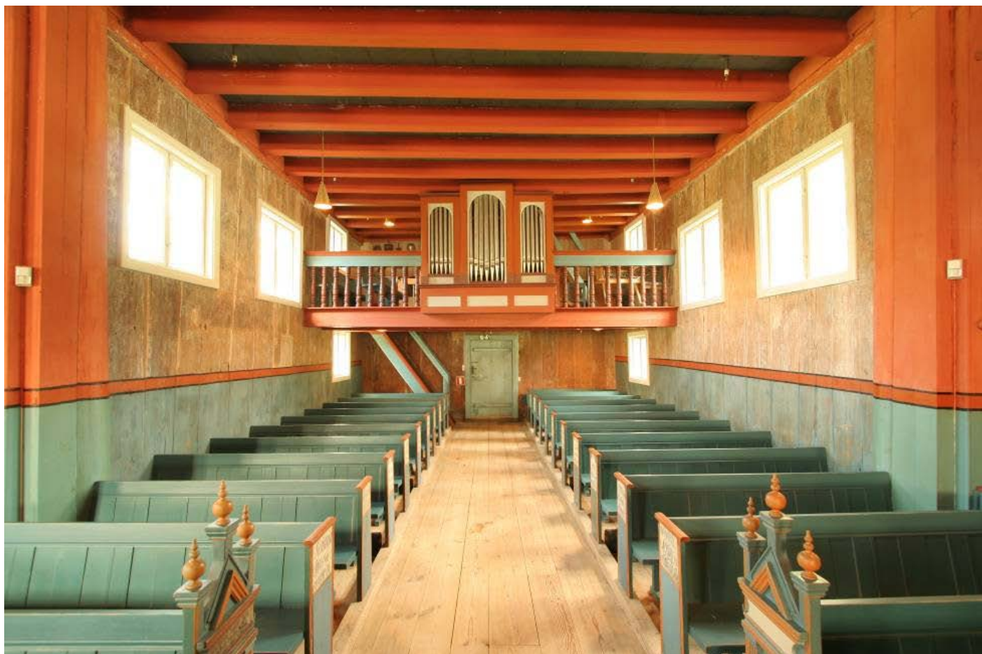
Limfargedekor: Vestre krossarm etter avdekking.

Tilstanden til himlingsdekoren i kyrkja var særst dårleg. Det var store områder med avskalningar og laus måling. Dette saman med slurvete retusjeringar og moderne bøtingar i samband med gjennomføringar av røyr og leidningar gav eit særst dårleg inntrykk. Himlingsdekoren vart difor konsolidert. I 2014 vart det undersøkt om det kunne gjennomførast ei konsolidering av laus måling i himlinga til mellomalderskipet. Det vart ikkje funne noko eigna metode for dette arbeidet, så arbeidet vart utsett. 4