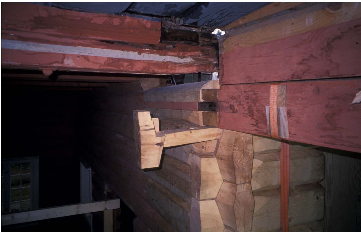
Novhovud: Spunsing av laft oppunder taket i kyrkerommet .