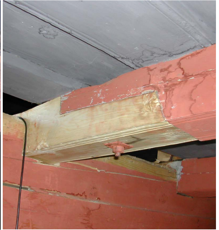
Spunsing: To ulike utføringar av spunsar i takbjelkane i kyrkja.

hadde eit solid opplegg mot vest, denne vart difor bevart og tilført ein solid skøytt.