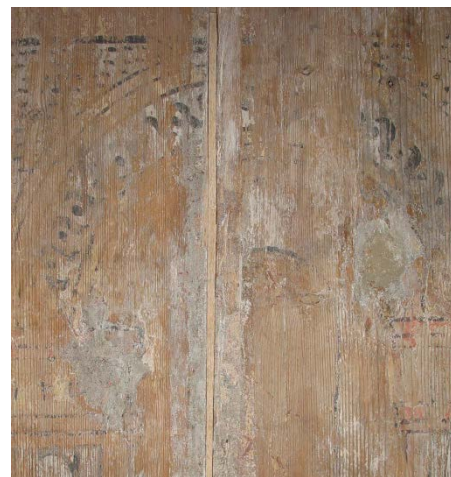
Limfargedekor: Detalj frå vestre krossarm etter avdekking.

utbeta. Arbeida vart utført i perioden 2004-2005. I stavkyrkjedelen av kyrkja vart gamle overmålingar fjerna for å få fram den gamle limfargedekoren i kyrkja.