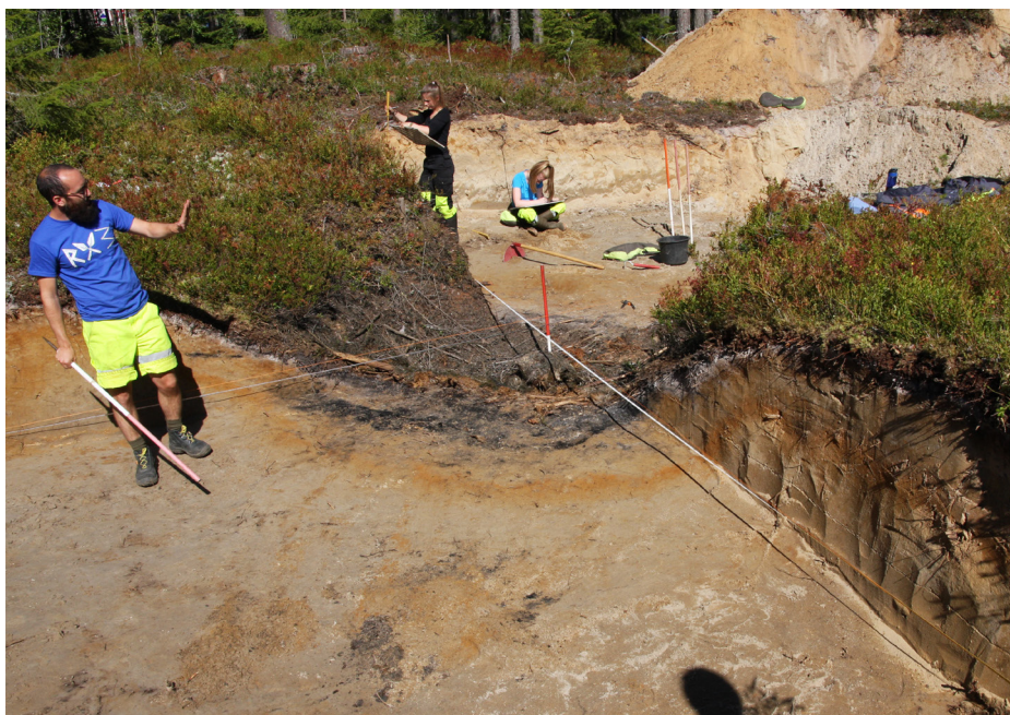
En av flere fangstgroper graves ut av arkeologer i forbindelse med bygging av ny riksvei 3 i Østerdalen. Elverum kommune.