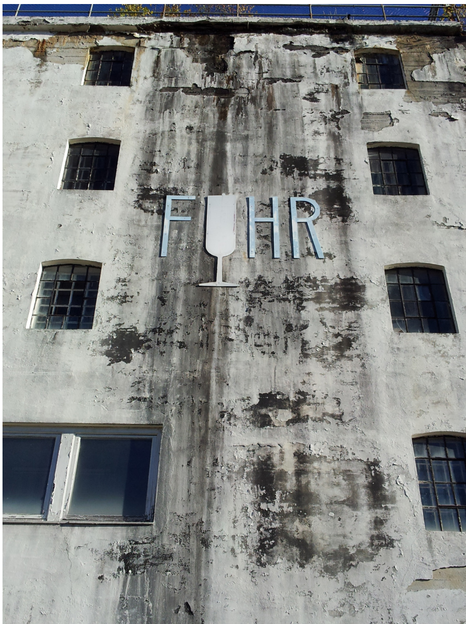
Vinproduksjonen ved Fuhr fabrikker har opphørt, og bygningen ble ikke lenger vedlikeholdt. I dag er den revet og skal erstattes av boligblokker. Grimstad kommune.

Kommunen kan også selv ta initiativ til å utarbeide særskilte planer med kulturminner, kulturmiljøer og landskap som tema. En slik plan vil kunne fungere som grunnlag for utarbeiding av arealplaner. Kommunens kulturminnepolitikk synliggjøres i slike planer. Planen kan enten gjøres formelt bindende gjennom at den behandles etter plan- og bygningsloven, eller den kan ligge til grunn for arbeid med slike planer. Uavhengig av formell status vil den være en kunnskapsbank om de kjente kulturminnene, kulturmiljøene og landskapet i kommunen.