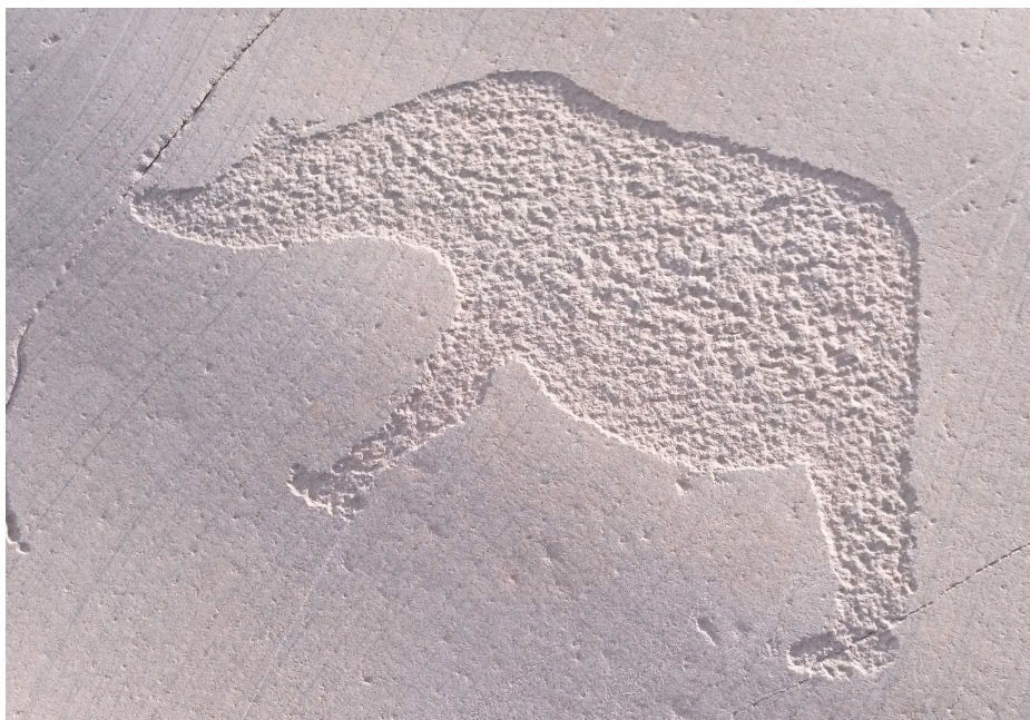
En liten bjørn kommer tuslende bort gjennom helleristningsberget i Hjemmeluft/Jiepmaluokta. Alta kommune.