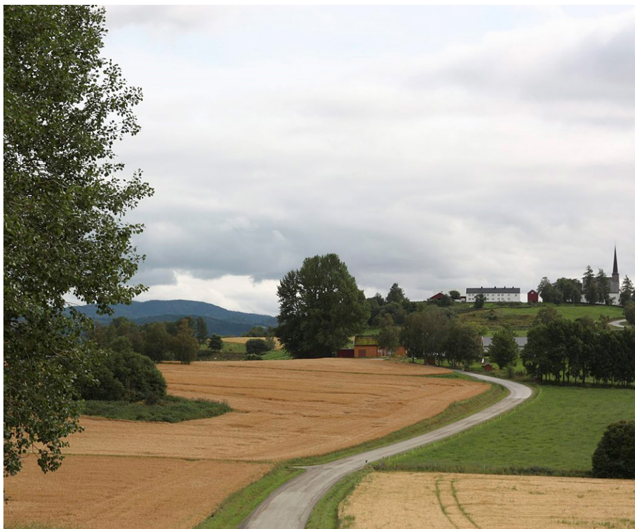
Mære kirke er fra slutten av 1100-tallet. Også før denne kirka har det stått en kirke der. Rester etter enda eldre bygninger kan være restene etter et hov fra førkristen tid. Et storslått jordbrukslandskap omgir kirka som ligger på et høydreag med vid utsikt i alle retninger. Steinkjer kommune.

Eventuell søknad om tillatelse til inngrep i automatisk fredet kulturminne eller inngrep som kan ha innvirkning på kulturminnene, skal sendes Riksantikvaren i god tid før arbeidet er planlagt igangsatt.