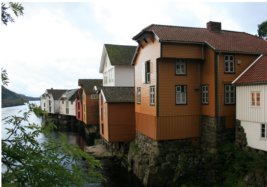
Sogndalstrand, i dag et fredet kulturmiljø med velholdte bygninger og stolte eiere, og et av Rogalands best besøkte reisemål. Sokndal kommune.