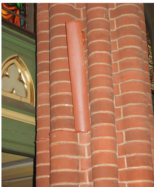
Høyttaler som er godt tilpasset interiøret i Bragernes kirke. Drammen kommune.

Kirkens interiør skal bevares. Eventuelle høyttalere som er nødvendige for kirkelige handlinger må ha en farge som gjør at de tar minst mulig oppmerksomhet. De skal ikke plasseres på dekorerte flater, eller slik at de kan virke forstyrrende på viktige kunstneriske eller arkitektoniske motiver. Tiltaket skal gjennomføres med minimale inngrep. Tiltaket må godkjennes av biskopen.