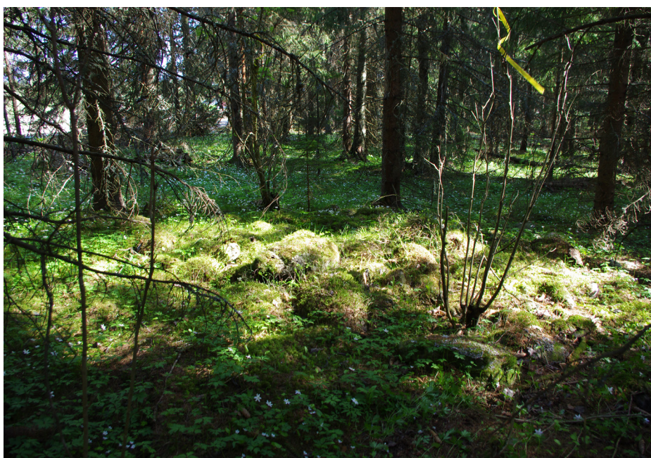
Sola lyser på en liten rydningsrøys i skogen i Bråstadmarka. Gjøvik kommune.