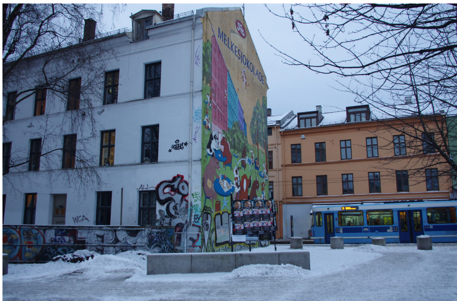
Bygården med Melkesjokoladereklame på veggene, Thorvald Meyers gate 66 på Grünerløkka, var ønsket revet og erstattet med et nytt boligkompleks. Oslo kommune.

I Norge er det funnet kulturminner fra en 12000 år lang periode. Disse representerer et mangfold av uttrykk fra menneskers liv og virke, fra steinalderen og opp til vår egen tid.