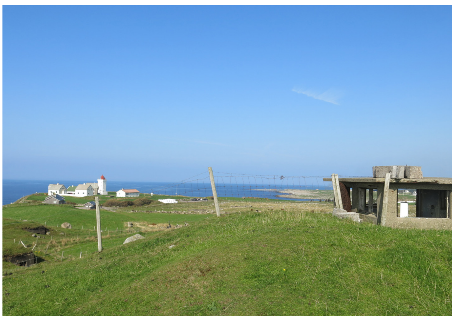
Obrestad fyr kneiser ytterst mot havet og har siden 1873 ledet sjøfarende langs den værharde Jærkysten. I det vakre kultur- og naturlandskapet langs Jærstrendene finner vi også flere minner fra tyskernes Atlanterhavsvoll. Hå kommune.