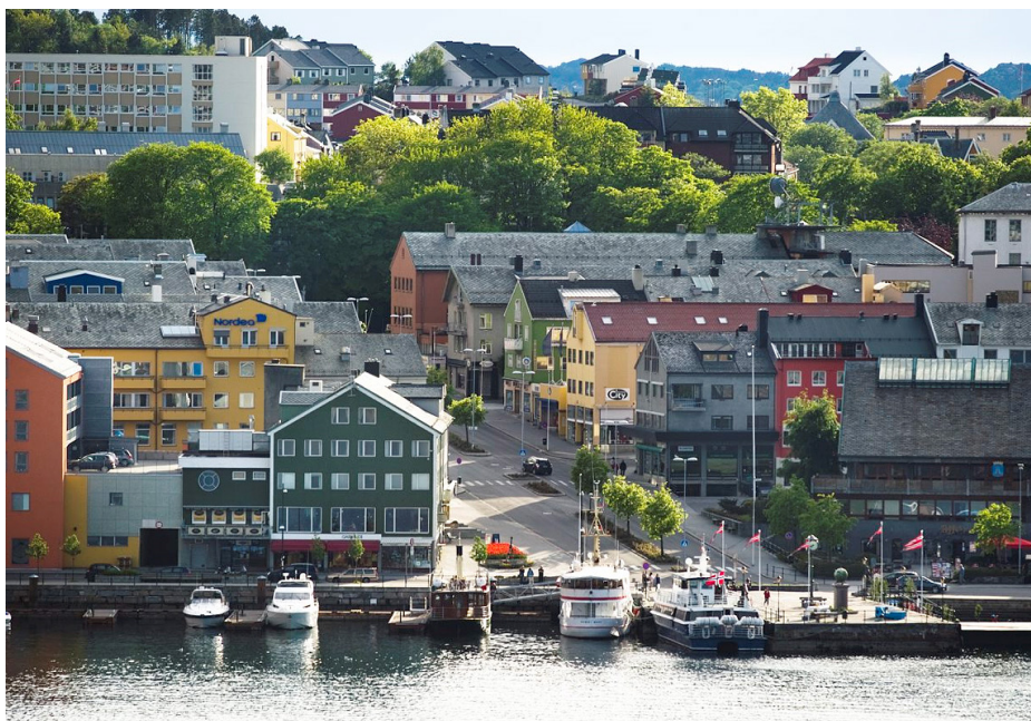
Kristiansund ble bombet av tyskerne i april 1940. Dagens by er i sentrum preget av gjenreisningsbebyggelse, og nesten alle husene er fra 1940- og 1950-tallet. Kristiansund kommune.