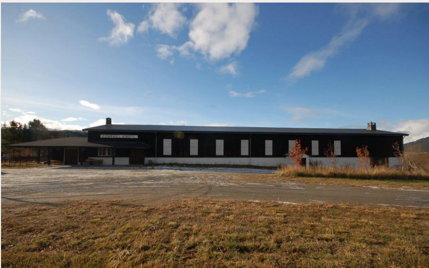
Dombås kino ble bygget i 1942 av den tyske okkupasjonsmakten, som en del av et større anlegg. Den var svært avansert for sin tid, med 550 sitteplasser, amfi, offiserlosjer og orkes-tergrav. Kinoen er fortsatt i bruk i dag og ble fredet i 2015.