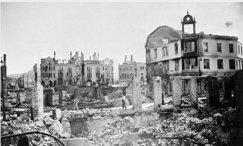
Kristiansund etter det tyske angrepet på byen i 1940.

• frigjøringen i 1945 og oppgjøret etter krigen (for eksempel rettslokaler, interneringsleire eller fengsler)