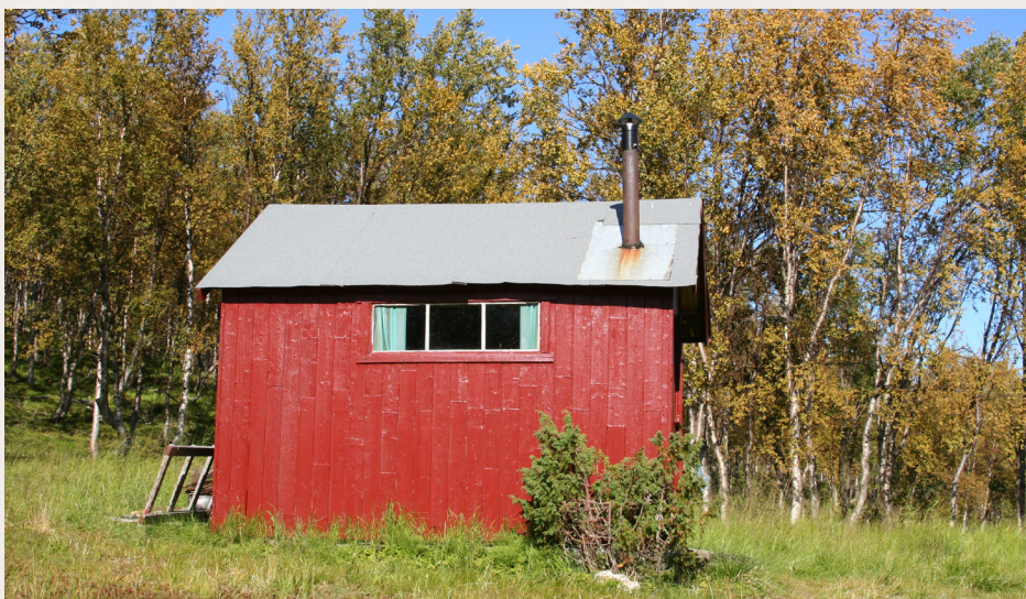
«Huleboerhytta» i Ytre Billefjorden i Porsanger kommune i Finnmark. To voksne og fem barn brukte hytta som skjulested fra oktober 1944 til april 1945 under tvangsevakueringen av Finnmark.