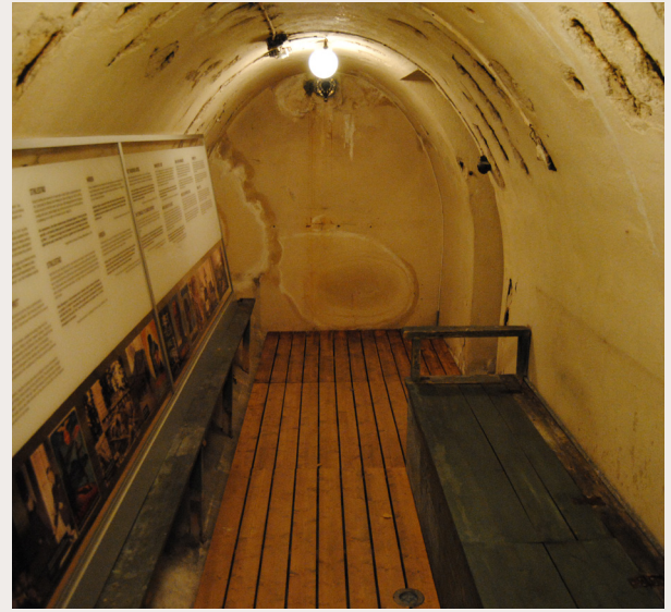
Villa Grande på Bygdøy i Oslo ble under krigen innredet av Vidkun Quisling som førerbolig og fikk navnet «Gimle». Her finnes det også en bunker bygget spesielt som tilfluktsrom for Quisling. I dag holder Senter for studier av Holocaust og livssynsminoriteter (HL-senteret) til i bygningen.