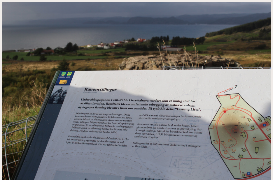
Formidling av hva som har skjedd på stedet under andre verdenskrig kan gi en ekstra dimensjon til friluftslivet. Dette skiltet forteller om kanonstillinger ved Nordberg fort på Lista i Vest-Agder.

Den smertefulle kulturarven kan brukes både til å minnes og forsones seg med fortiden, og med tanke på at kommende generasjoner skal kunne lære av historien. Krigens angår ikke bare dem som opplevde den, nye generasjoner har arvet og må forholde seg til fortellingene fra denne viktige perioden i vår historie.