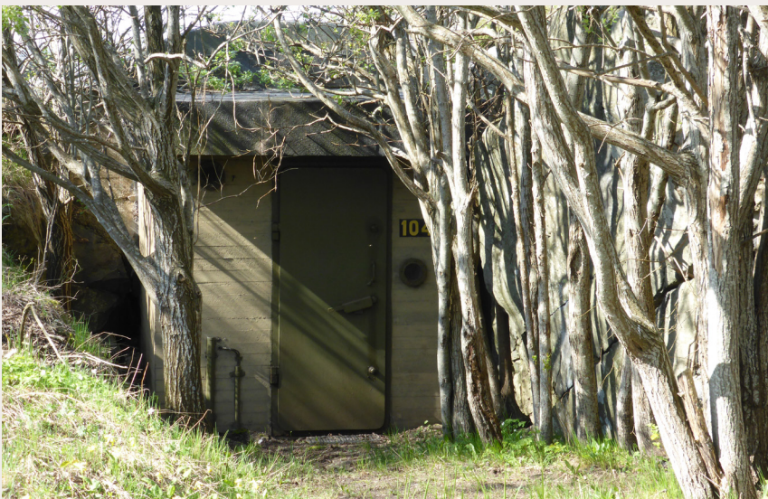
Bunker ved Oddane fort i Vestfold som ble fredet i 2015.