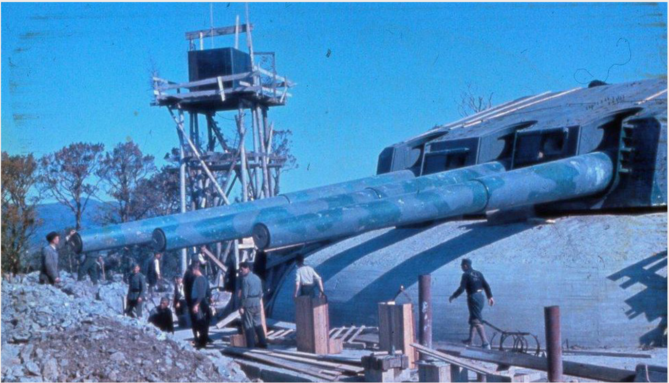
De tyske festningsverkene langs Atlanterhavsvollen strakte seg fra Biscaya-bukta i sør til Finnmark i nord. Tvangsarbeid var en viktig forutsetning for byggingen av forsvarslinjen. Bildet viser kanontårnet ved Austrått fort i Sør-Trøndelag under krigen på et fundament av støpt betong.