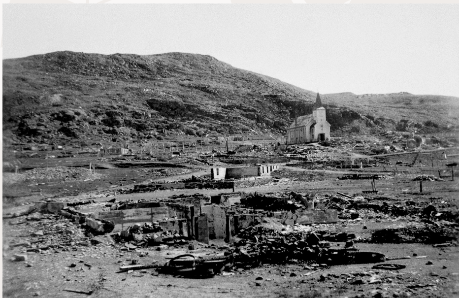
Ca 75 000 mennesker ble fordrevet av tyskerne i forbindelse med nedbrenningen av Finnmark og Nord-Troms i 1944-45, der en hel landsdel mistet nesten hele sin materielle kultur. Slik så Honningsvåg ut i 1945.