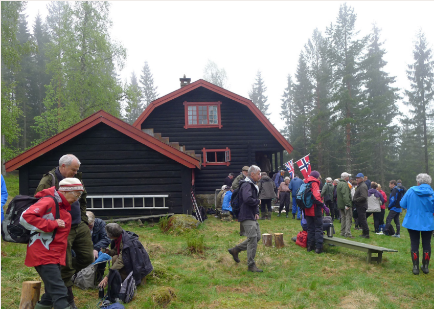
Rudsetra i Lunner kommune i Oppland var et viktig skjulested for motstandsbevegelsen under krigen. Hytta er blitt tatt godt vare på av lokale entusiaster og er under fredning.