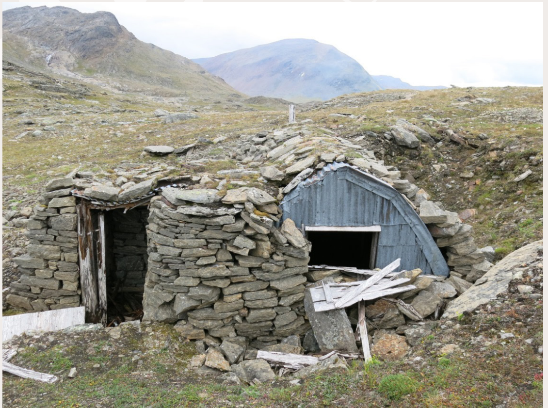
Lyngelinjen i Storfjord i Troms, som tyskerne fikk bygget i 1944-45 for å møte en invasjon fra Sovjetunionen, har vært lite kjent i ettertid. Denne mannskapsforlegningen og andre spor etter Lyngelinjen forteller om militær strategisk tenkning i nordområdene og lidelsene til de sovjetiske krigsfangene som ble brukt til tvangsarbeid.

Over hele Norge finnes det kulturminner fra andre verdenskrig. Krigsminnene kan være alt fra tyske kystfort i betong til provisoriske skjulesteder bygget av motstandsbevegelsen, eller rester etter fangeleirer for utenlandske krigsfanger. Ofte forteller krigsminnene om overgrep og lidelser. Disse smertefulle historiene er også en del av kulturarven.