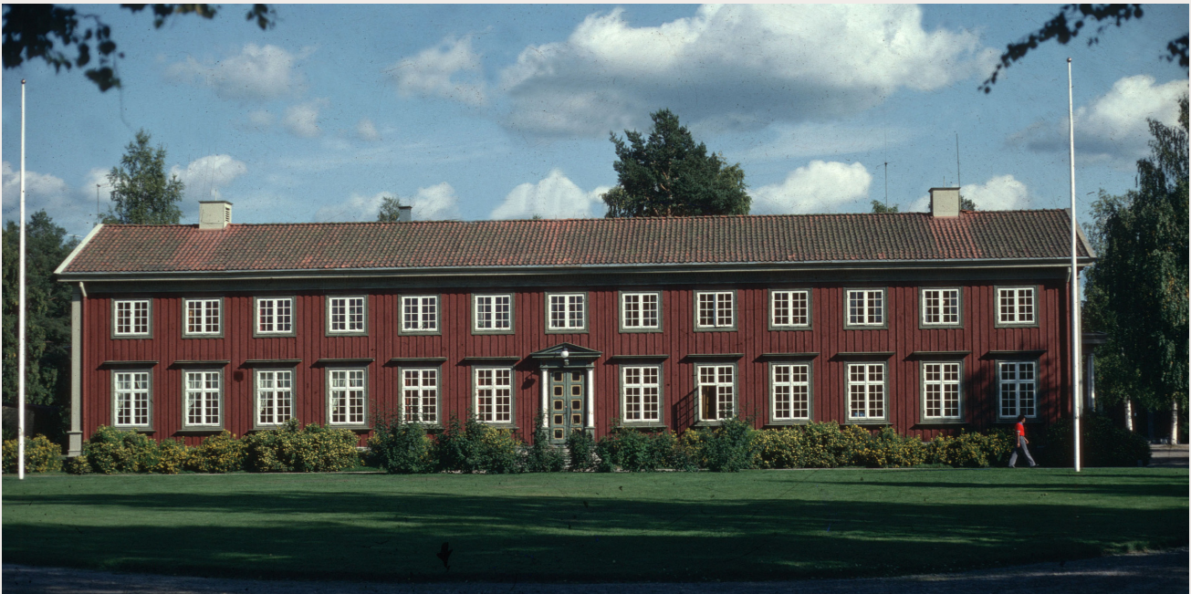
Elverum folkehøgskole i Hedmark fikk mange ulike funksjoner i løpet av okkupasjonsårene og rett etter krigen. Her ble den såkalte Elverumsfullmakten inngått, og det var også her Kongen ga sitt historiske nei 10. april 1940 da han ble stilt overfor okkupasjonsmaktens krav. Under krigen ble tyske soldater innkvartert på skolen. Etter krigen ble over 100 «tyskerjenter» internert her.