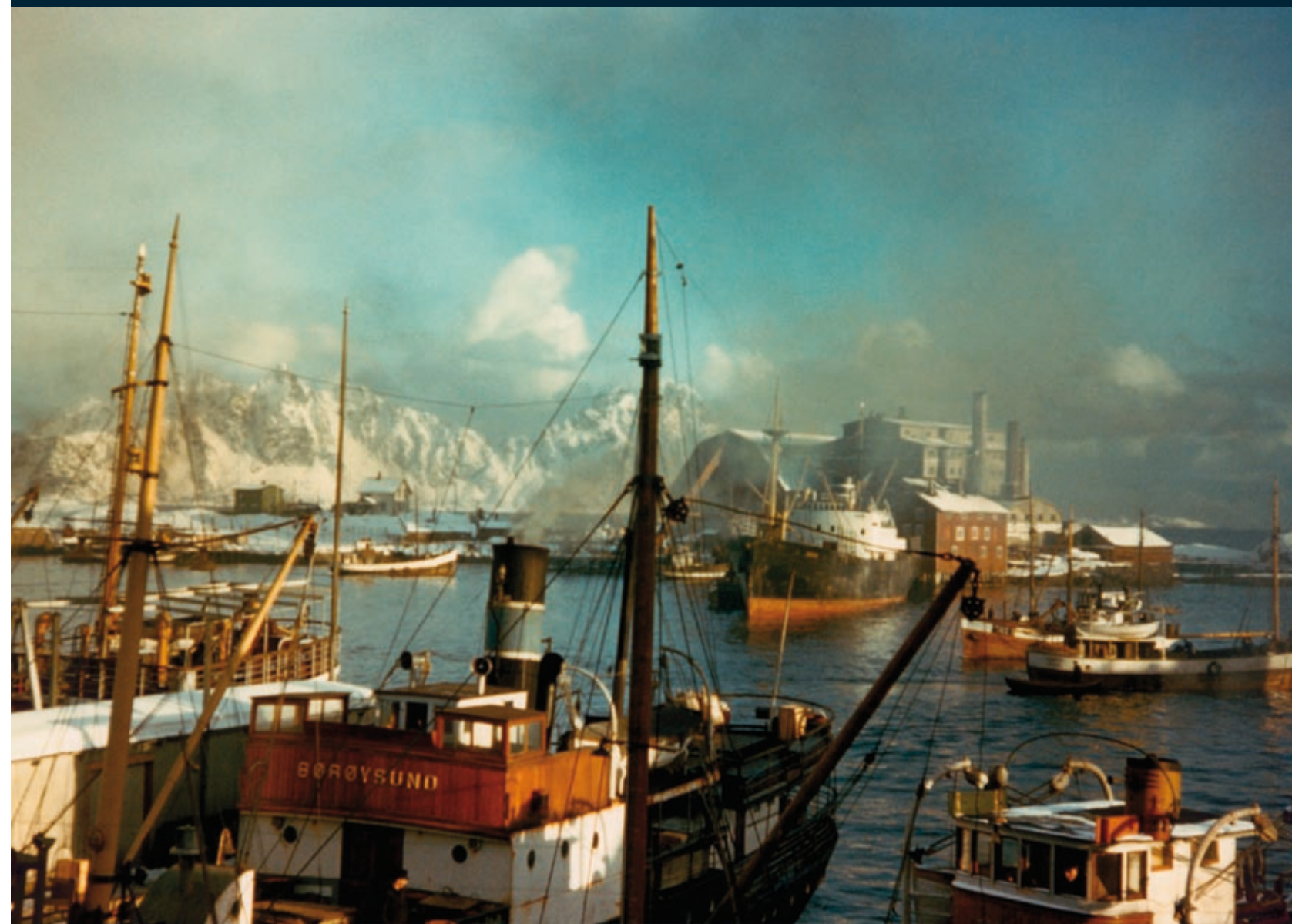
Da dette bildet ble tatt på havna i Svolvær i 1947, var det fortsatt svært stor deltakelse i lofotfisket.

Først var jeg redd for at noen hadde dødd. Det stanket så rart i oppgangen. Jeg satte fra meg bæreposene og holdt pusten mens jeg åpnet postkassen. Da sto jeg plutselig med opphavet til stanken i hånda: Et postkort merket 'Greetings from Norway'. Det var en tørrfisk. Flatpresset og på størrelse med et vanlig kort. Sendt fra Finnmark av en vittig østlending. Etter en stund fikk imidlertid skribenten hjelp fra en som kunne den kulturelle koden: Hva jeg gjorde med tørrfiskkortet? Først prøvde jeg å gi det til naboens katt. Det urbane bakgårdsdyret snudde halen til meg i avsky. Så fant jeg fram lufttette plastposer. Akkurat da jeg skulle til å pakke kortet inn, fikk jeg uventet hjelp fra en nordlending. Han snuste på kortet. Så leste han beskjeden. Og så spiste han det.