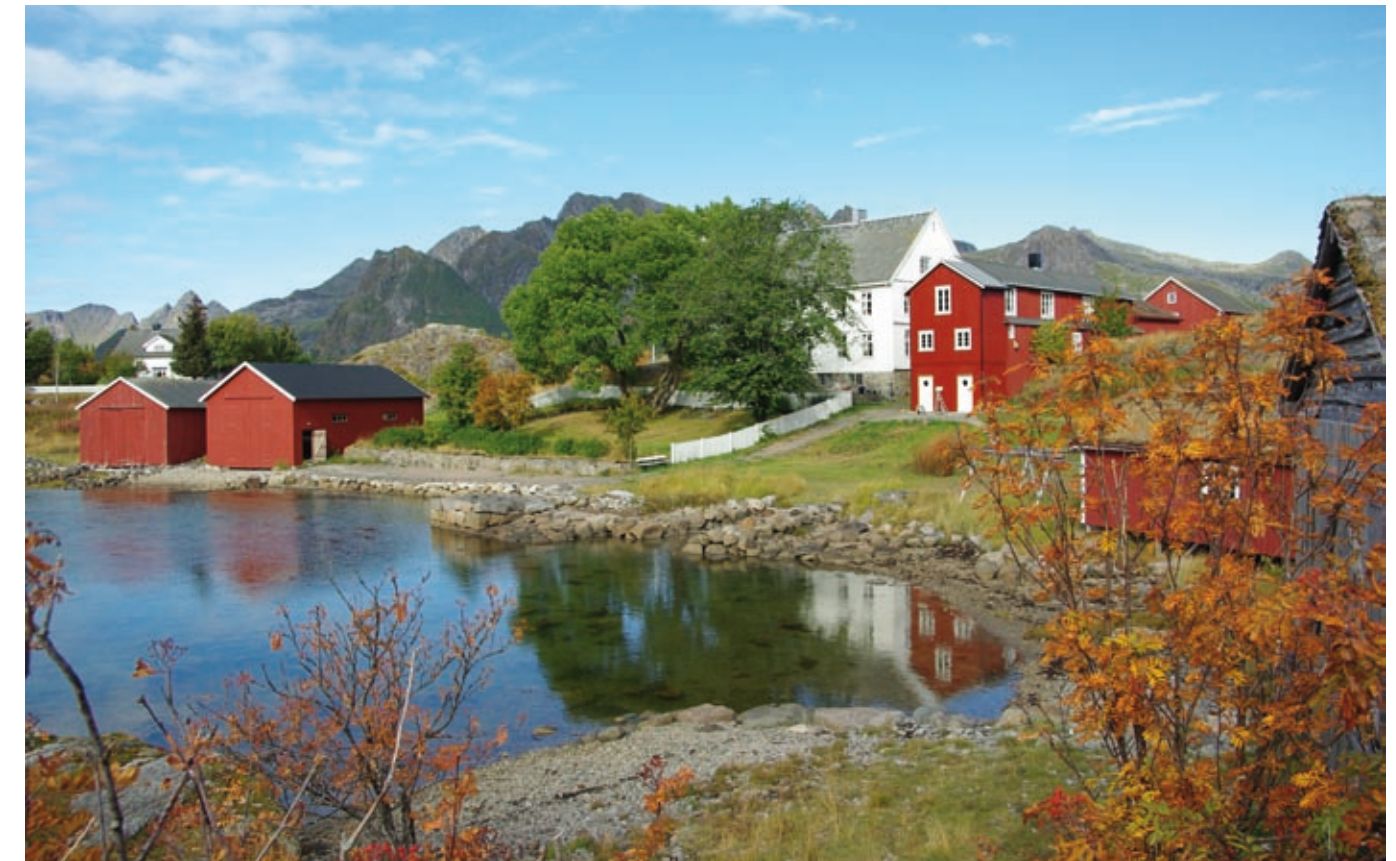
Enkelte av de gamle væreierboligene er i dag i bruk som museer. Storvågan like vest for Kabelvåg var et av Lofotens største fiskevær på 1800-tallet. Lofotmuseet holder hus i deler av den gamle bygningsmassen. Væreierboligen, det hvite huset sentralt i bildet, ble satt opp i 1815. Foto: Thomas Røjmyr. Museum Nord - Lofotmuseet.

De siste tiårene har betydning en renessanse for de økonomiske og kulturelle forbindelsene på tvers av grensa i nord. I 1992 kom boka "Pomor: Nord-Norge og Nord-Russland gjennom tusen år" med Einar Niemi som redaktør. Forsida viser litografiet Grenseland av Kaare Espolin Johnson. ©Kaare Espolin Johnson/BONO 2009 Bokomslag: Gyldendal Norsk Forlag.