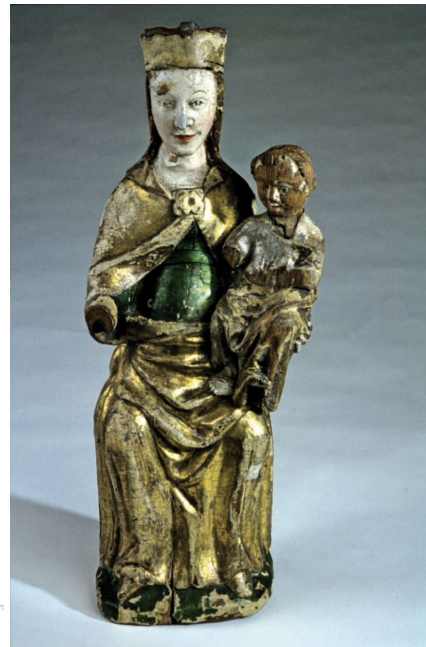
Kirkekunst til nordnorske kirker var en av de mer eksklusive "varene" som ble spredt nordover langs kysten sammen med korn og mel. Mye av kirkekunsten er laget i Tyskland, særlig i Lübeck. På bildet ser vi Madonna med barnet, Ibestad kirke, ca. 1300.

I dag er Italia det viktigste markedet for lofottørrfisk av ypperste kvalitet. Handelsforbindelsen mellom Lofoten og