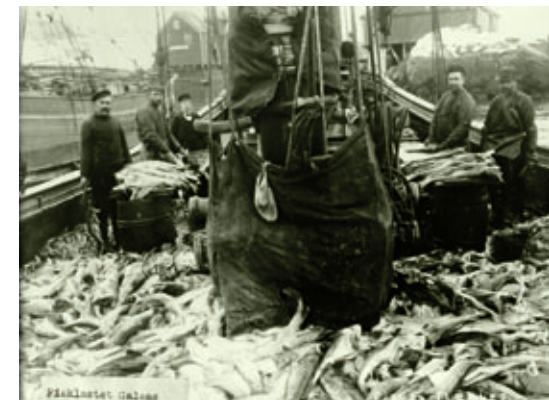
Overproduksjon kjennetegnet krisa i mellomkrigstida. Fangstene var høyere enn det som var mulig å selge på de internasjonale markedene til regningssvarende priser. Dette bildet som er tatt noen tiår tidligere, ca. 1895, gir også inntrykk av overflod på fiskefeltet, galeasen bugner av skrei som flekkes før salting.

Ett av spørsmålene som ble diskutert var overgang til trålfiske. Tråldriften i stor skala var blitt vanlig i andre land, særlig i England, Tyskland, Frankrike og Spania. Kunne trålen gi bedre lønnsomhet i norsk fiske? Ja, det var mulig. Men utbygging av en flåte av store trålere ville også innebære en trussel mot kystfiskerne i den tradisjonelle flåten. De fryktet å bli presset ut av fiskeryrket, gjennom brukskollisjoner der trålerne seilte gjennom og ødela