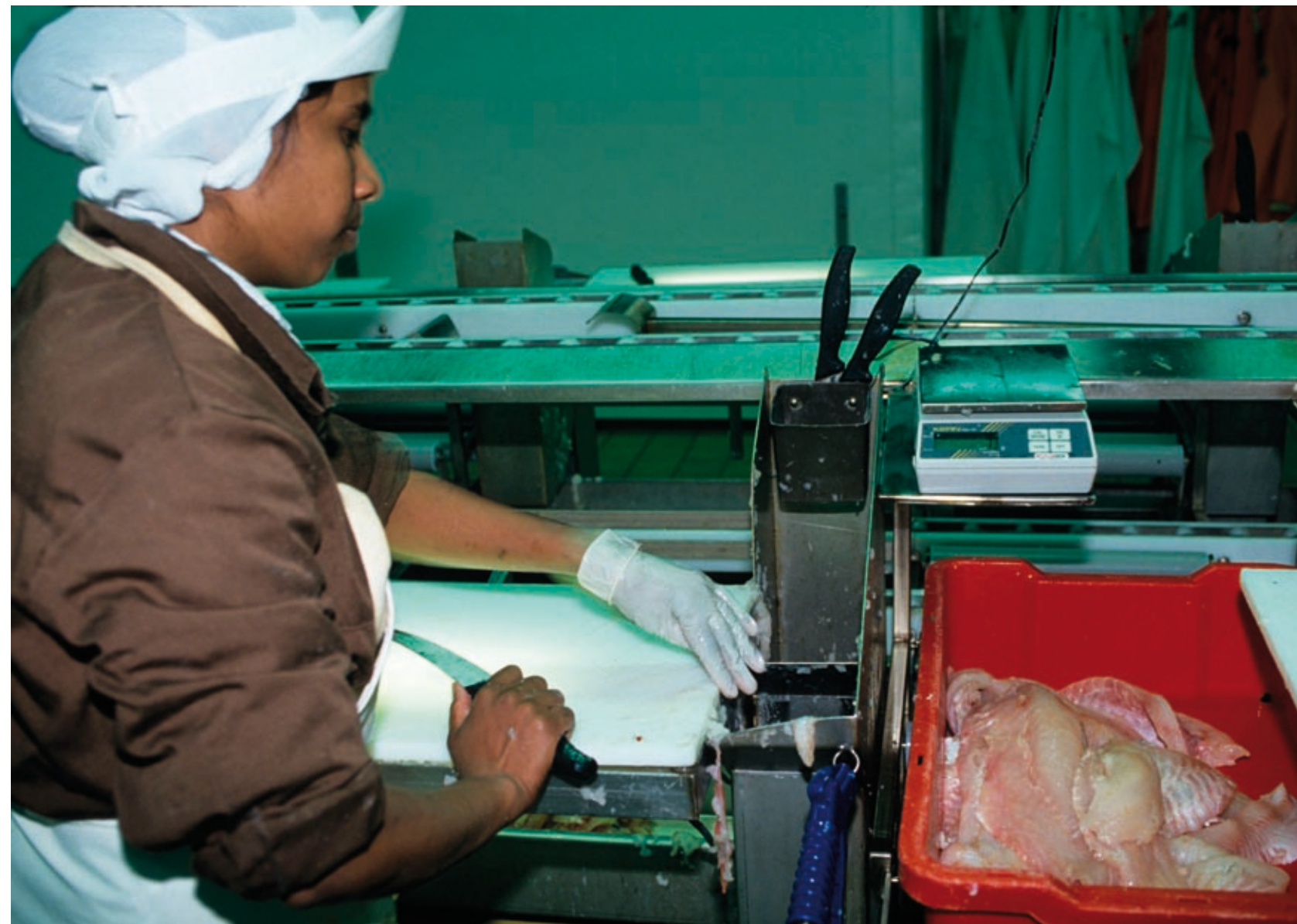
Fiskeindustrien fikk etter hvert et forholdsvis stort innslag av innvandrere i arbeidsstokken. Her ser vi en av dem i arbeid på fileten i Sørvær i Hasvik i Finnmark. Bildet er tatt i 1994.

Fryseriene representerte en tung og dyr satsing med store investeringer i bygninger og maskiner. Det var avgjørende for å få til lønnsomhet at anleggene fikk tilstrekkelig tilførsel av fisk til å sikre jevn og kontinuerlig drift. Her oppsto det raskt krav fra industrien om liberalisering av trålpolitikken. Fryseriene ønsket seg tillatelse til å bygge egne trålere som kunne supplere leveransene av råstoff fra kystflåten. Men en åpning for industrieide fartøyer ville representere et brudd på prinsippet om fiskereie til båt og bruk som fiskerorganisasjonene sto sterk vakt om. Saken vakte strid også internt i det regjerende Arbeiderpartiet.