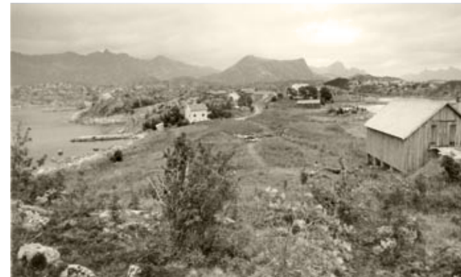
Fra den arkeologiske utgravningen av middelalderbyen Vágar i Storvågan vest for Kabelvåg sommeren 1985. Feltet ligger like ved Museum Nords avdeling Lofotmuseet.

Handelen foregikk fra starten av der fisket og produksjonen skjedde – i Lofoten. Her vokste det etter hvert fram en kjøpstad for tørrfiskomsetningen. I sagaen kan vi lese om Vágar, og gjennom arkeologiske utgravninger de siste tiårene like vest for dagens Kabelvåg er det klarlagt at det virkelig lå en liten middelalderby