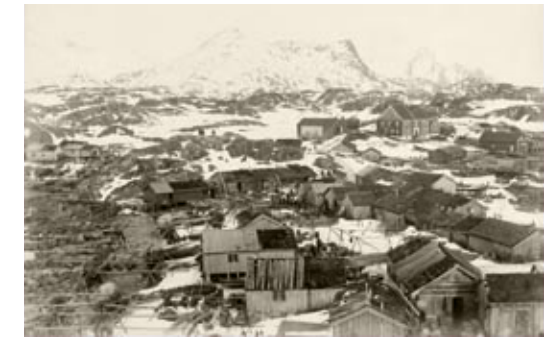
Rorbumiljø i Storvågan ca. 1890. Buene ligger tett i tett. Det er i dette området de arkeologiske utgravningene av middelalderbyen Vågar er gjort de siste tiårene.

mellom rorbuleie og tilgang til de beste settene for garnfiske og linefiske opphørte. En viktig følge av den nye loven var at utviklingen i lofotfisket heretter ble svært godt dokumentert gjennom årlige beretninger. Her finnes opplysninger om deltakelsen fordelt på de forskjellige bruksarter og fiskevær, utbyttet av fisket, antall kjøpefartøyer, vær og vind samt en rekke andre forhold. Materialet gir rike muligheter for forskning, og lofotfisket er sannsynligvis et av verdens best dokumenterte fiskerier overhodet. Statistikken forteller om en svært høy aktivitet på lofothavet, alt i 1860 deltok det 24 000 fiskere. Etter en nedgang først på 1870-tallet, steg