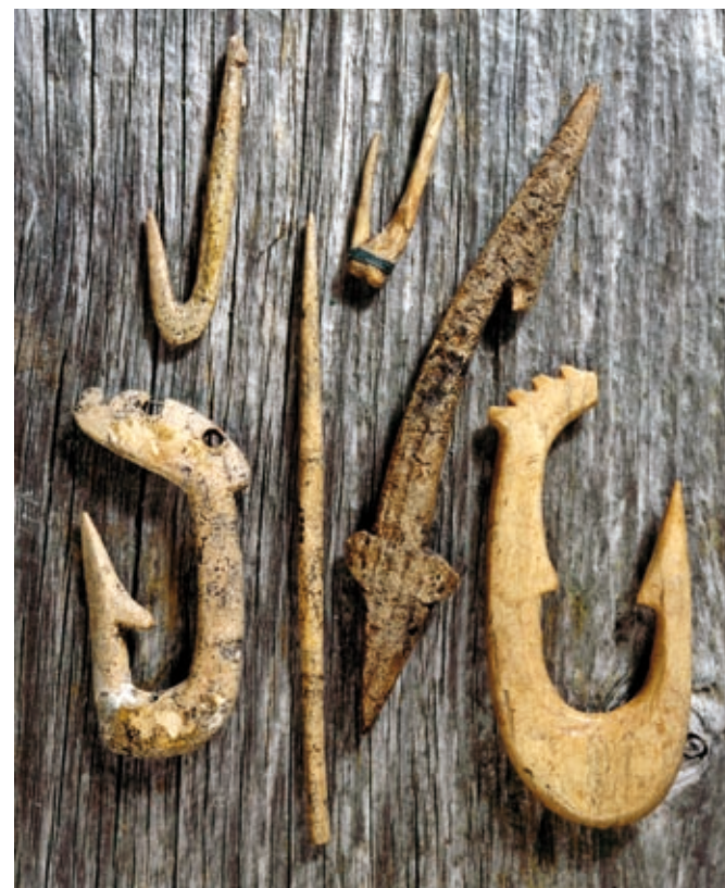
Fiskekroker av bein.

Lofoten har alltid stått i en særstilling i torskefisket. Her gytte den største andelen av torskebestanden på et nokså avgrenset geografisk område og i farvann der store øyer ga tilstrekkelig beskyttelse mot storhavets voldsomme krefter slik at forholdsvist små og spinkle fartøyer kunne delta i fisket. I Lofoten faller også tidspunktet for gytingen og skreifisket i februar, mars og begynnelsen av april sammen med den perioden på året da vilkårene for å lage tørrfisk av ypperste kvalitet er omtrent perfekte. Området