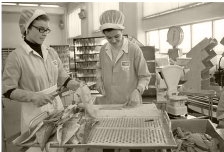
To kvinner i filethallen på Findus i Hammerfest.