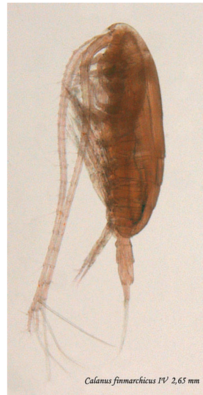
Raudåte, Calanus finmarchicus IV 2,65 mm

Det ubetinget viktigste oppvekstområdet for den norsk-arktiske torskestammen er i Barentshavet, for en stor del i Russisk økonomisk sone. Torsken er en vandrende bestand. Som ungtorsk søker den inn mot norskekysten på jakt etter lodda. Dette ga i sin tur opphav til vårtorskerefisket i Finnmark. Når den norsk-