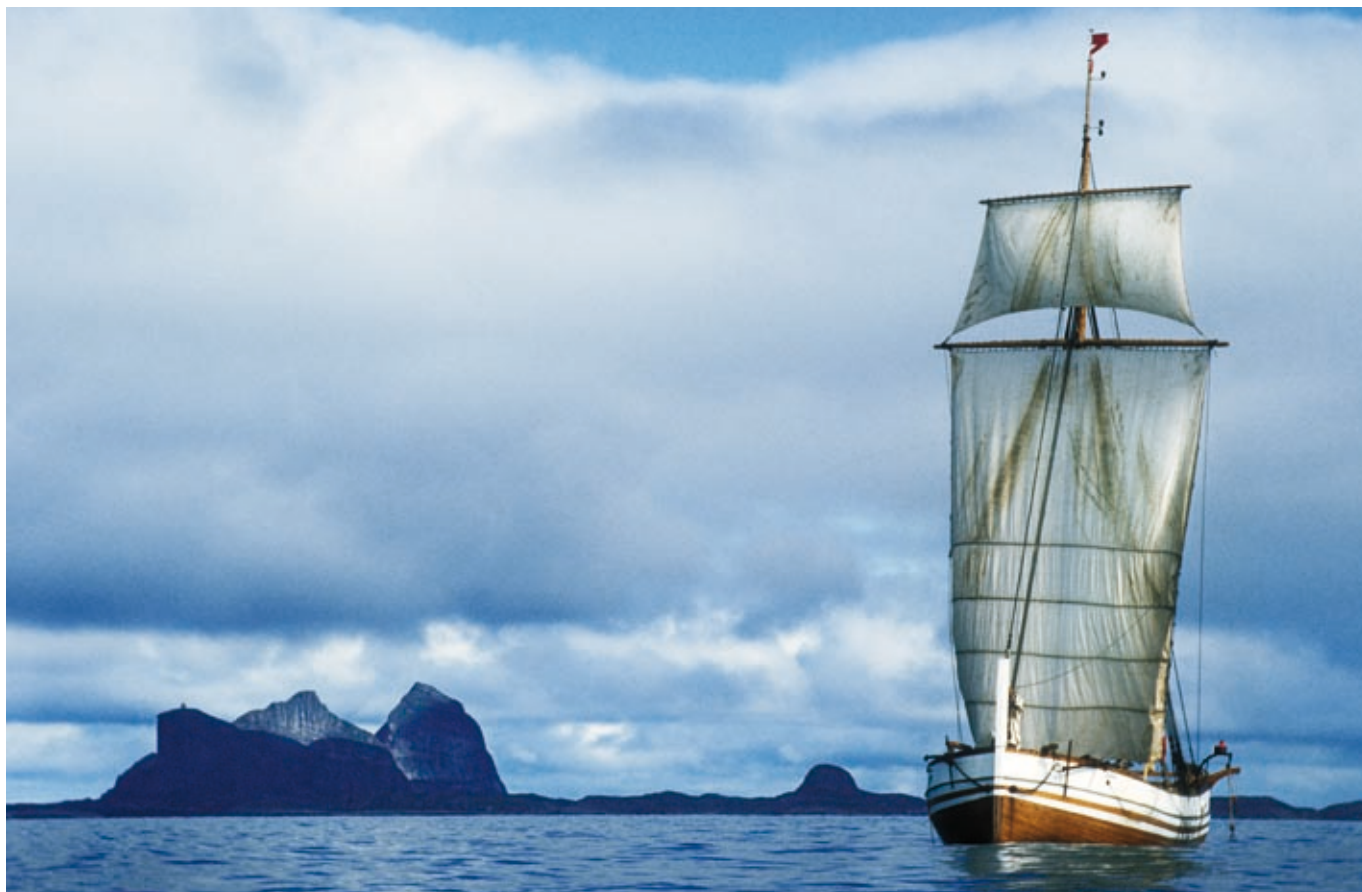
"Pauline" er den siste seilende originale jekta i Norge. Den er bygd i Steinkjer i 1897 og eies i dag av Egge museum, avdeling i Stiklestad nasjonale kultursenter. Her er "Pauline" fotografert under seil på nordlandskysten, med Træna i bakgrunnen.

steder med tett bosetting av spesialiserte fiskere. Vi finner dem for eksempel på Nord-Møre, i Trøndelag, nord i Vesterålen på Bleik, på Andenes og på Langenes og videre nordover på Senja, i Nord-Troms og ikke minst i Finnmark, der det fant sted en norsk befolkningsekspansjon ytterst på kysten.