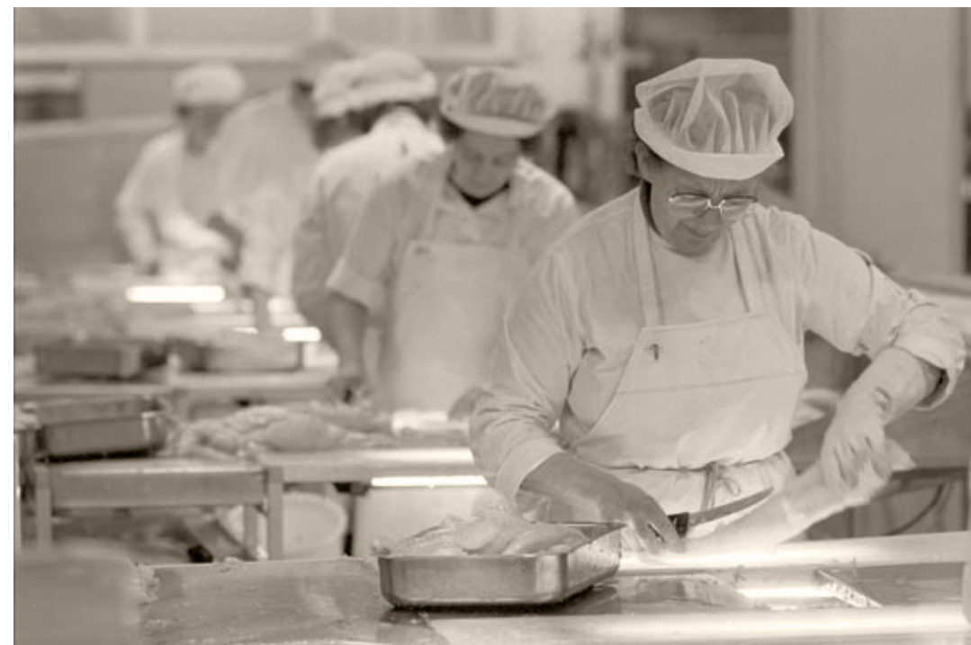
Filetskjæring utviklet seg etter hvert til samlebandsproduksjon og ga arbeid til mange kvinner. Her ser vi filethallen på Melbu Fiskeindustri.

Innen klippfisksektoren oppnådde eksportleddet lovbeskyttelse for sin virksomhet gjennom Klippfiskloven av 1932. Tillatelse til å drive eksport av klippfisk ble gjort avhengig av medlemskap i bransjeorganisasjonen De norske klippfiskeksportørers landsforening, som var stiftet året før. De tradisjonsrike eksportfirmaene fikk nå en form for monopol til å fortsette sin virksomhet, mens konkurranse fra nykommere ble sterkt vanskeliggjort. Eksportleddet fikk også styrket sin stilling i forhold til fiskerne gjennom den nye ordningen. Dette skjedde blant annet da eksportørene i Kristiansund begynte å skaffe seg råstoff gjennom å begynne med saltfisktråling og egenproduksjon av klippfisk. Med lovbeskyttelsen av eksportforretningen i ryggen, ble det lettere