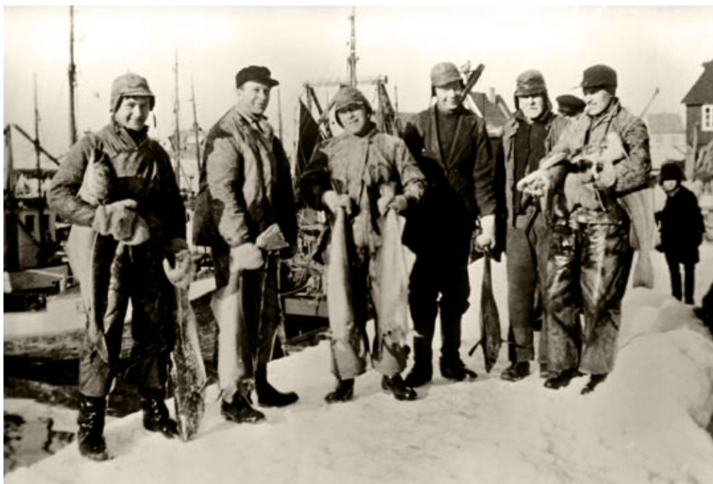
Minsteprisordningen i 1936 ble oppfattet som et stort framskritt av fiskerne. Kanskje det er derfor disse karene ser så fornøyde ut? Bildet er tatt dette året på kaia i Kabelvåg.

etter Mussolinis angrep på Etiopia i 1935 og innføringen av økonomiske sanksjoner mot Italia fra Folkeforbundet, ble det likevel innført et minste-