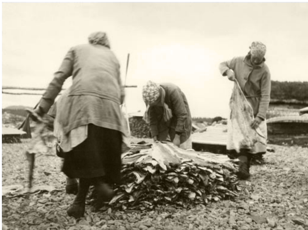
Nordvestlandet var sentrum for klippfisktilvirkningen i Norge, men det ble drevet slik produksjon mange steder. Her ser vi tre kvinner i arbeid med tilvirkning av klippfisk i Bukta i Alta i 1926.

så lenge det foregikk i sjøvann i fjæra. Tørkingen foregikk ved at fisken ble lagt ut på svaberg og klipper. Lettskya vær med brukbar vind og uten for sterk sol ga den beste tørken. Fisken ble samlet sammen og lagt i store stabler på treplatter og med et "flak" av tre på toppen om kvelden. Dette måtte også gjøres dersom det tok til å regne heftig i løpet av arbeidsdagen. Tørkeprosessen ved denne naturmetoden varte gjerne i flere uker, og det kunne bli svært mange vendinger for bergarbeiderne, som i stor grad var kvinner