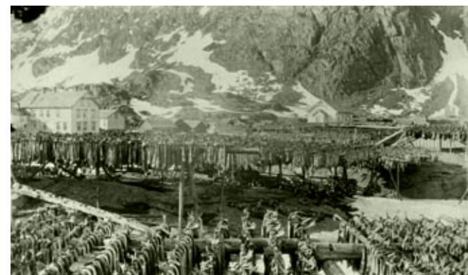
Tørrfiskproduksjon kjennetegnes den dag i dag av svært liten bruk av tekniske hjelpemidler. Dette bildet er tatt i Sørvågen på Moskenesøya i Lofoten ca. 1900.

utestående line- og garnbruk på feltet slik en hadde erfart med de utenlandske trålerne, og ved at trålfisken gjennom mer effektiv drift kunne utkonkurrere fisken fra den tradisjonelle flåten. Dersom den vanlige norske kystfisker på denne måten ble tvunget til å gå på land, ville alternativet være særdeles dårlig – køen av arbeidsløse ville bli ytterligere forlenget.