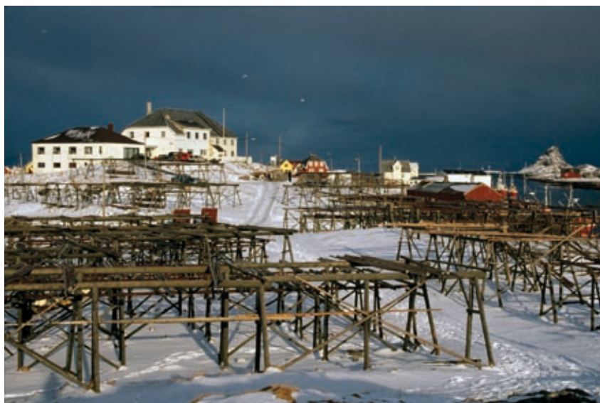
Røst der Pietro Querini strandet i 1432 har opplevd et svært rikt fiske i de siste årene. Her er stedet fotografert i 1996. Hjellene er klare for henging av sesongens fangst.