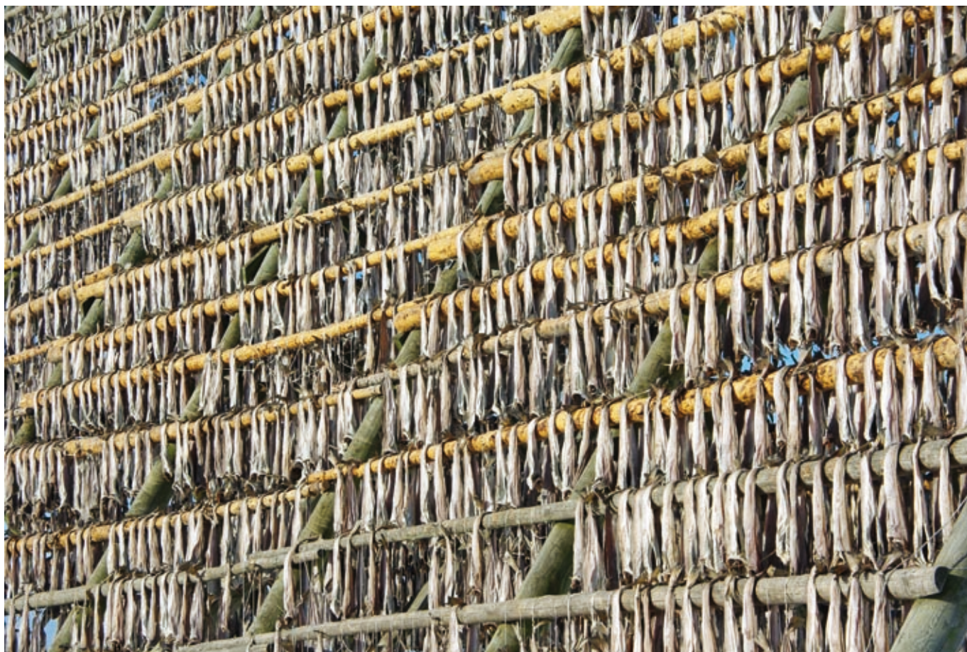
Fullhengt hjell i Svolvær etter avsluttet lofotfiske i begynnelsen av april 2009.

arktiske torsken er kjønnsmoden starter den altså på den lange gytevandringen fra Barentshavet til norskekysten. Ringen er sluttet. En ny årsklasse blir til.