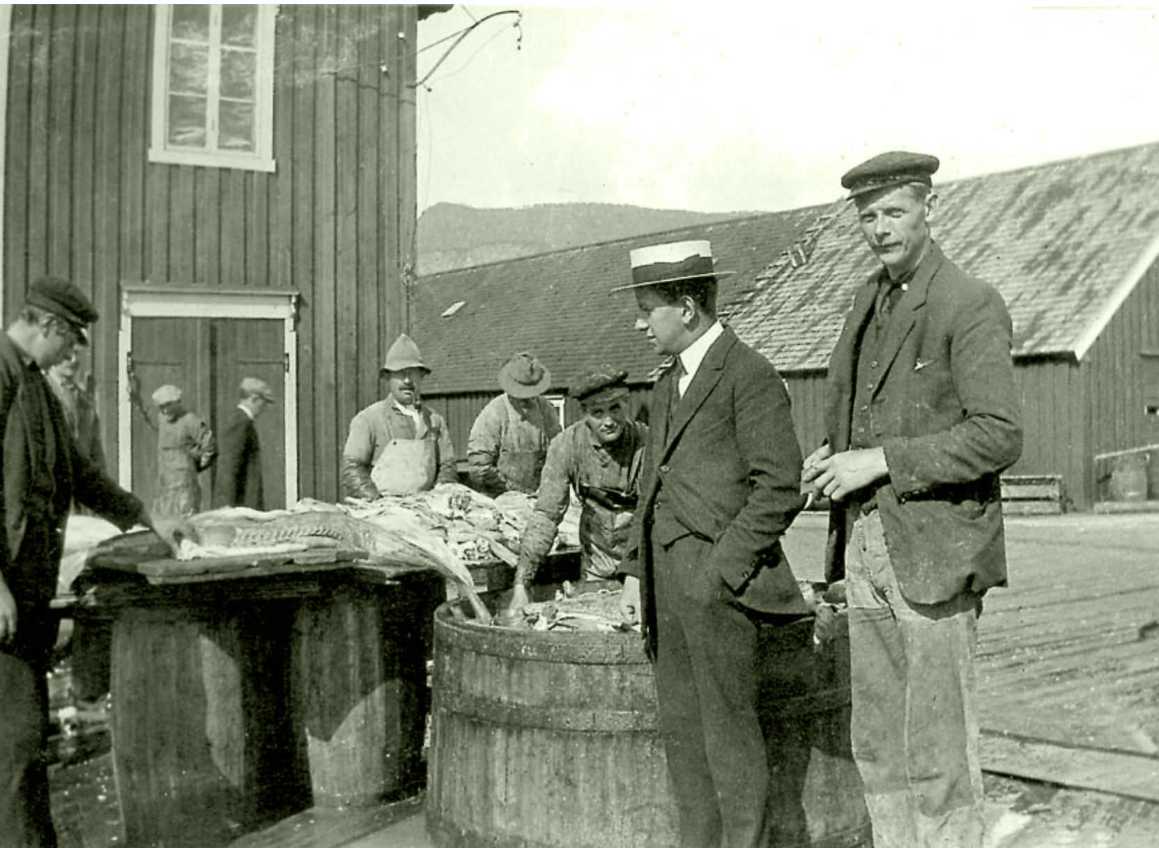
Produksjon av torsk med enkle hjelpemidler tidlig på 1920-tallet. Bildet er tatt på kaia på Melbu i Vesterålen. Stedet Melbu var likevel tidlig ute med forsøk på kjøling og frysing, og kom seinere til å få landets første filetanlegg for produksjon av frossenfisk med kontinuerlig drift helt fram til vår tid.