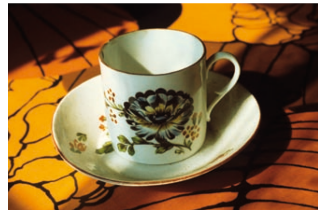
Pomorhandelen kom til å bety mye både økonomisk, sosialt og kulturelt lengst nord på norskekysten. Bildet viser en gjenstand som minner om dette kultur møtet, en gammel russekopp, fotografert i Kvitnesstua på Karlsøy i Troms.