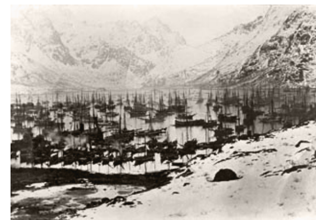
Da Trollfjordslaget fant sted i 1890, var det typisk østlofotfiske, med best fiske for fiskeværene i øst. Bildet er tatt et annet sted i Øst-Lofoten, i Sildpollnes i Austnesfjorden, øst for Svolvær. Trengselen på havet ser ut til å være stor.