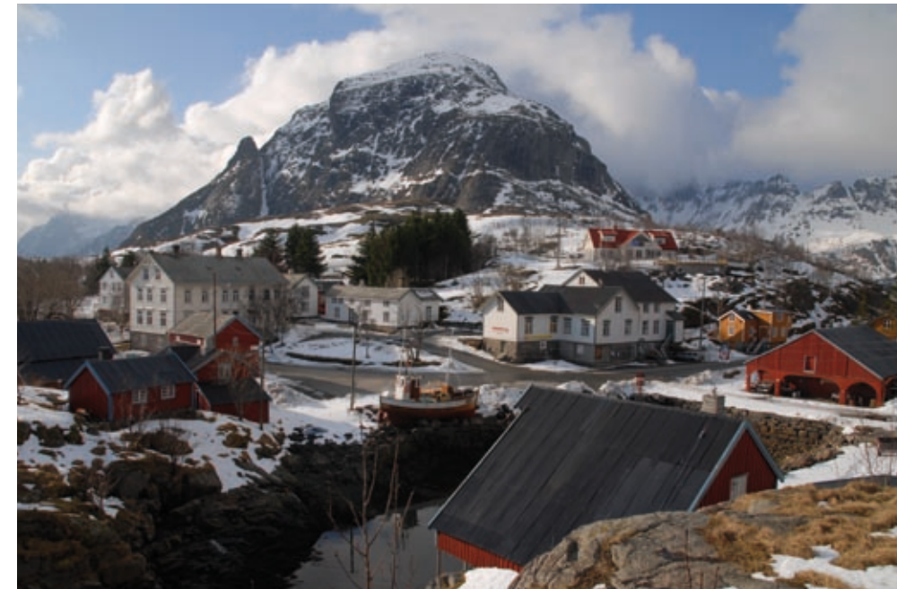
Fiskeværet Å ligger lengst vest i Moskenes kommune i Lofoten og utgjør endepunktet for dagens E 10. Bygningsmassen er i stor grad bevart slik den var i lofotfiskets storhetstid sist på 1800-tallet. Norsk Fiskeværmuseum arbeider med å ta vare på tradisjonene knyttet til fiskeværskulturen.

i gjennomsnitt veide 2,7 kg, har det dreid seg om hele seks millioner tørrfisk, det vil si en virkelig massevare. De gode inntektene fra handelen med tørrfisk må også ha vært en medvirkende faktor når kirka som institusjon kunne sette i gang byggingen av den gedigne Nidarosdomen, Nordens