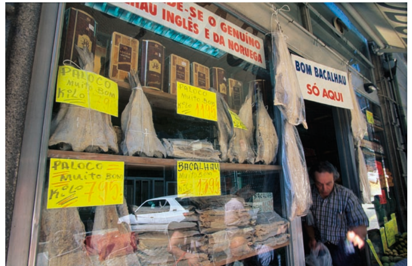
Klippfisk er populær mat i Portugal. Her ser vi en spesialforretning i byen Porto, fotografert i 2000.

Stor og fin "La Plata-fisk" pakkes i helkasser på Th. Øverlands brygge på Nordlandet i Kristiansund.