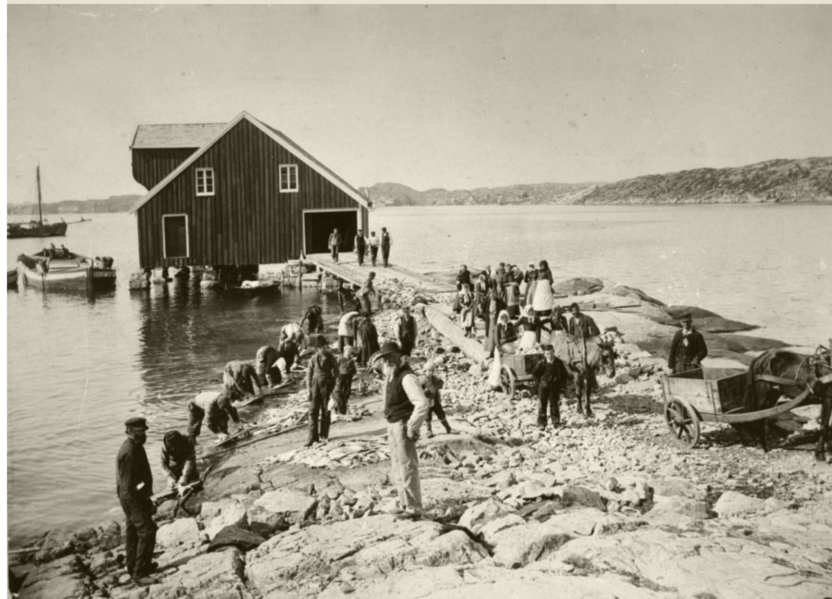
Vasking av saltfisken i fjæra var hardt arbeid, tungt, fuktig og krevende for ryggen. Bildet er fra Stangdraget i utkanten av havna i Kristiansund. Lekteren har kommet med saltfisk som vaskes i fjæra før fraktning med hest og kjerre opp til fiskebergene. Ved de eldste bergene i byen var det ikke tilrettelagt for hestetransport, her måtte alt bæres på ryggen.

Tørkeprosessen startet med grundig vasking av saltfisken. Her var viktig å fjerne salt og urenheter og å skrubbe vekk svarthinna med børste eller vott. Dette var særlig hardt arbeid