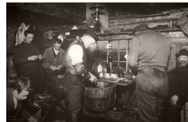
Fiskerne ble mindre avhengige av rorbuene på land etter hvert som fiskebåtene ble større og fikk lugar om bord. Men selv etter andre verdenskrig ble rorbuene brukt i forholdsvis stort i omfang under lofotfisket. Bildet fra ca. 1950 viser lineegning i rorbua.