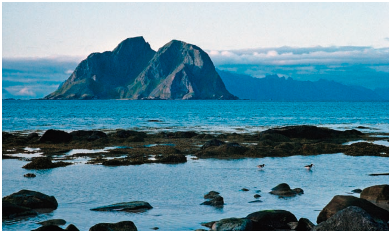
Lofotveggen: Utsikt fra fjæra på Værøy mot øya Mosken med lofotveggen i bakgrunnen.

tusenvis av kilometer fra Barentshavet nord for Norge og Russland til norskekysten. Skreien, som den også kalles ut fra det gammelnorske