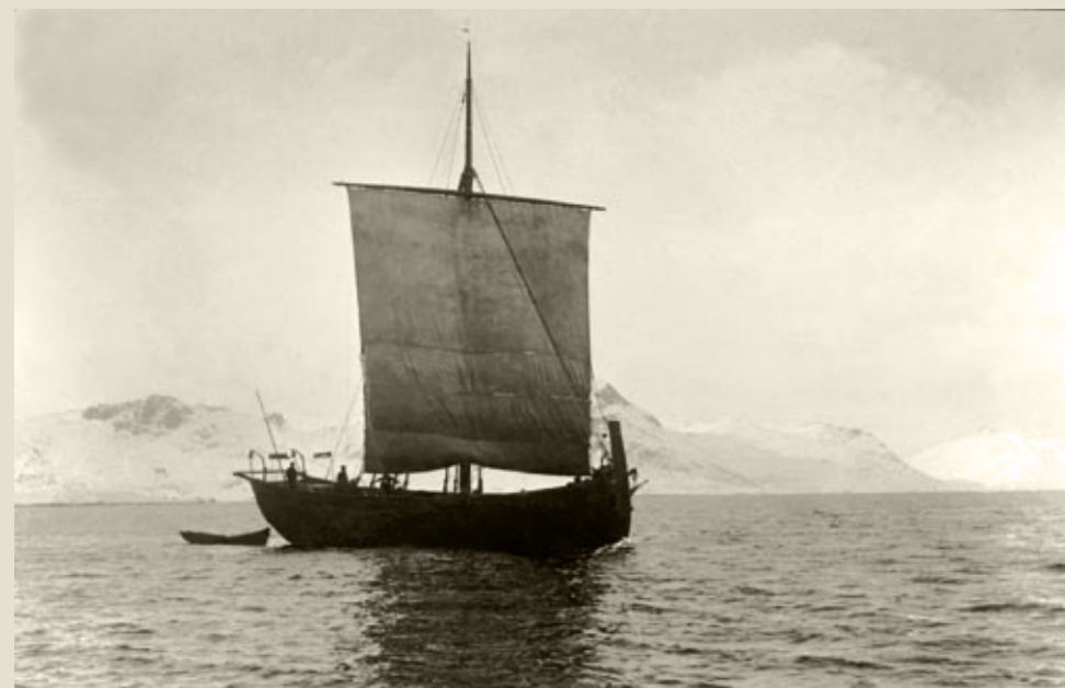
Bildene viser to klassikere i torskfiskets historie, med røtter hundrevis av år tilbake. Øverst en nordlandsbåt, åttringen, med fem mann ved årene. Nederst transportfartøyet jekta. Begge båttypene var rigget med råseil. På slutten av 1800-tallet kom sneseilrigging i småbåtflåten og etter hvert dekk og motor. Åttringen ble med over i den nye tida. Den ble forsterket og tilpasset motordrift og fikk innebygget maskin. Slik oppsto motoråttringen. Jekta er fotografert ca. 1890, åttringen ca. 1900.