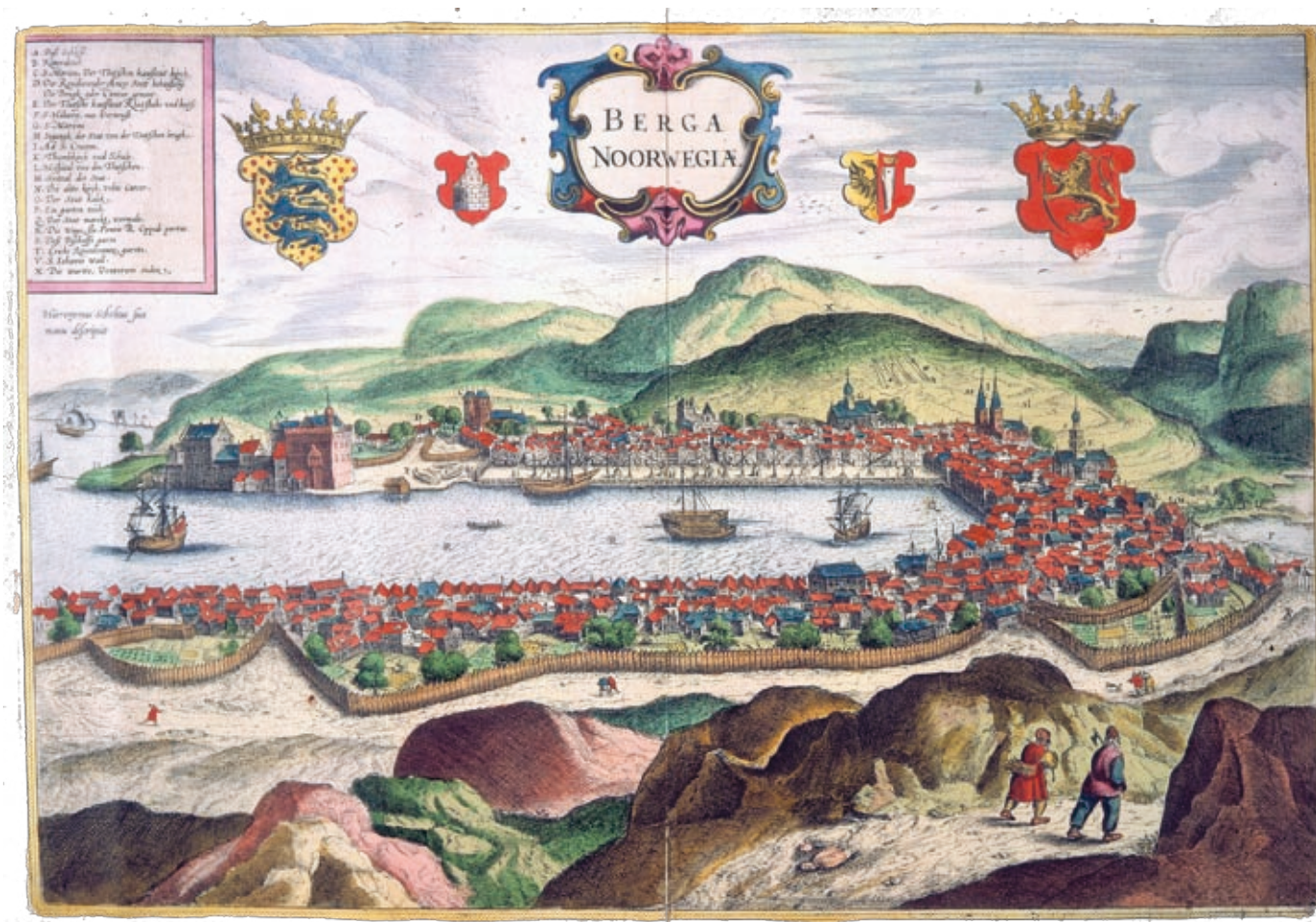
Bergen sto helt sentralt i tørrfiskhandelen, enten konjunktorene i geskjeften gikk opp eller ned. Dette håndkolorerte kobbersticket fra 1588, signert Hieronymus Scholeus, er kjent som den første avbildning av byen. Legg merke til våpenskjoldet til høyre der tørrfisker er utstyrt med krone.

Skal vi peke ut en hovedlinje i norsk fiskerihistorie, må det bli svingningene og usikkerheten. Næringen er aldri stabil og jevn, svingningene er det eneste sikre. Svingningene gjelder både på ressursida og på markedssida. Fra slutten av 1500-tallet var det foreløpig slutt på de gode tidene i fiskeriene i Norge. Nå gikk svingningene den andre veien. Fiskerinæringen var på vei inn i sin første markedskrise. Folketallet var på kraftig opptur over hele Europa med sterk etterspørsel etter jord og stigende priser på jordbruksprodukter. Fiskerne fikk nå mindre korn i bytte mot tørrfisker sin. Norsk fisk møtte også alvorlig konkurranse fra andre land for første gang. Christoffer Columbus hadde funnet veien til Amerika, og de rike fiskefeltene ved Newfoundland var begynt å bli