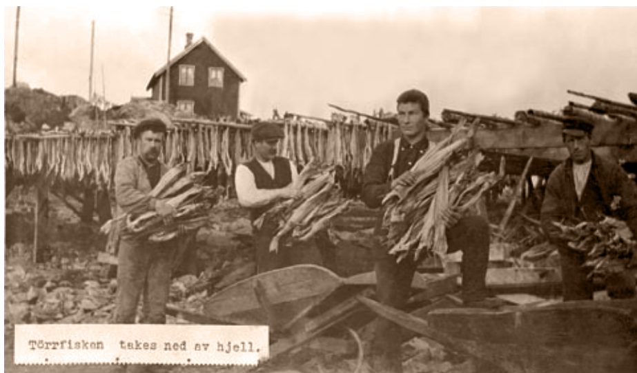
Bildet er tatt for atskillig mange år siden, men tørrfiskproduksjonen foregår fortsatt for en stor del med manuelt arbeid.

har ikke tatt seg opp igjen etter kollapsen rundt 1990. Torskefisket i Nordsjøen er heller ikke bærekraftig og møtes med kraftige advarsler fra havforskerne. Og hva med oppdrett av torsk? Her skjer det en rivende utvikling akkurat nå. Bare framtida vil vise hva dette får å si, både for fisket etter villtorsk og for handelen med torskeprodukter i framtida.