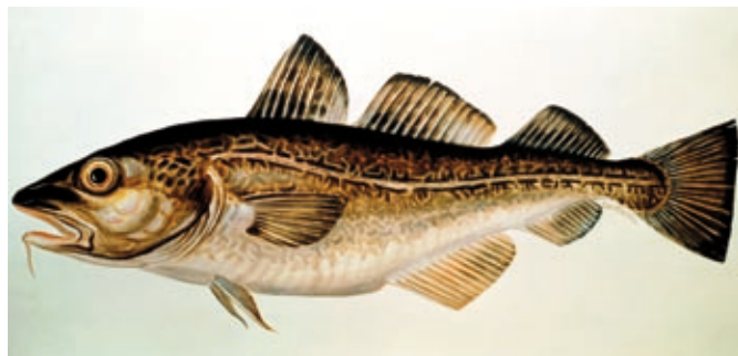
Torsk, Gadus morhua . Tegning: Pål Thomas Sundhell.

Det finnes flere slags torsk, kysttorsk og nordsjøtorsk for eksempel, men her snakker vi om den suverent største og viktigste bestanden, i dag og til alle tider, den norsk-arktiske torsken. Ressursen deler vi i dag med Russland. Dette skjer på grunnlag av torskestammens levevis og utbredelsesområde. Den norsk-arktiske torsken legger hver vinter ut på ei reise på