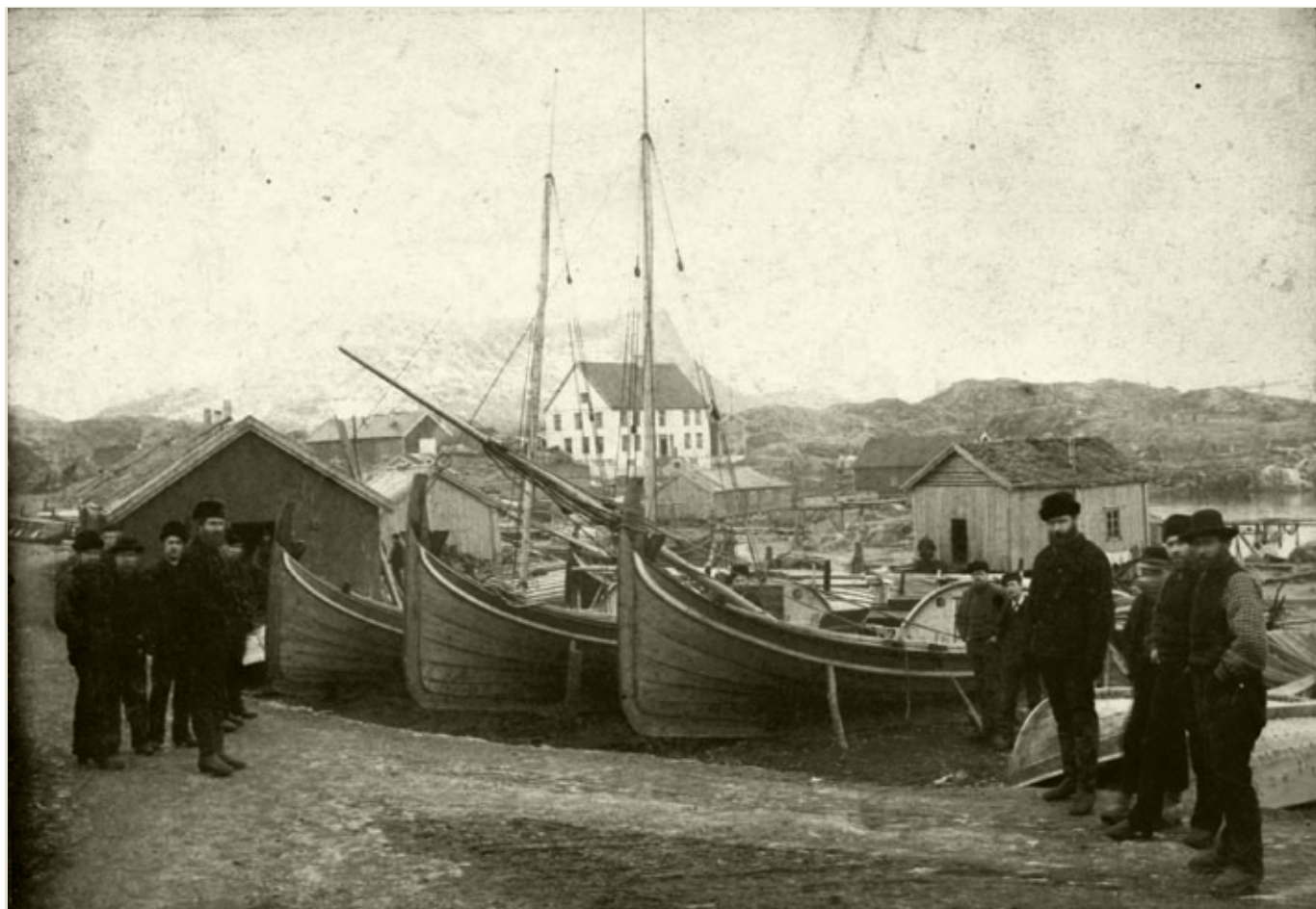
Loføtfisket var selve pengemaskinen i kystøkonomien, men også en viktig sosial, politisk og kulturell arena, med rike muligheter for meningsutveksling og innhenting av informasjon. Bildet er fra Storvågan ca. 1890. Væreierboligen i bakgrunnen.