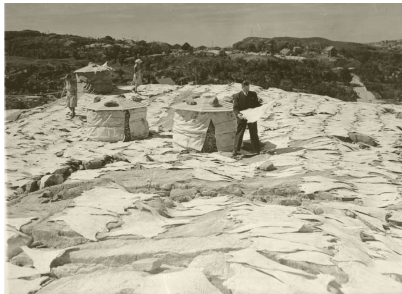
Fra klippfiskberget ved Vikan på Nordlandsøya i Kristiansund (i dag Vestbase oljehavn) Her ser det ut til å være god tørk. Disponenten i dress inspiserer en skikkelig storfisk. Fisken i la med stein på fiskeflakene er ferdigtørket og lagt i press. Strie er hengt utenpå for å beskytte fisken mot regn.

Pomorhandelen må også nevnes. Russiske pomorskuter kom fra 1700-tallet seilende fra Kvitsjøen på sommerstid til finnmarkskysten, og etter hvert lenger sørover, helt ned til Troms og Nordland. Skutene var lastet med korn, mel og andre varer som pomorene byttet bort mot fisk. Betegnelsen pomor stammer fra det russiske po more - ved havet – ordet betyr kystboer eller