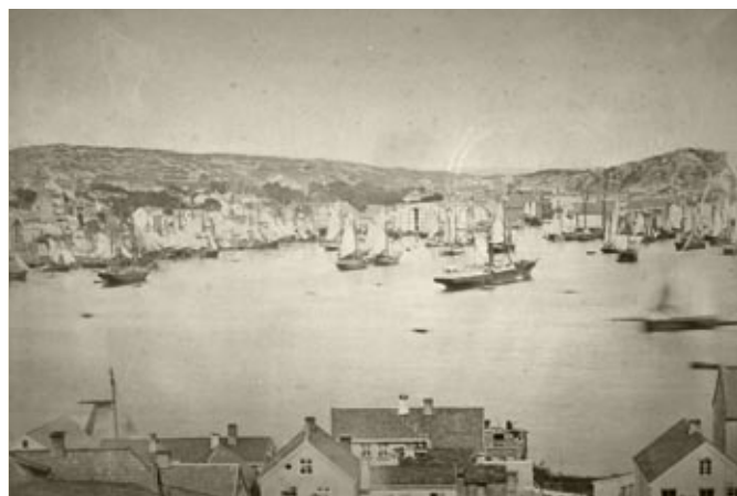
Kristiansund var lenge selve klippfiskbyen i Norge og sto sentralt både i tilvirkning og eksport. Bildet fra havna, byens hjerte, er tatt midt på 1870-tallet. Dette var på slutten av den såkalte spansketida, da spanske skip seilte til Kristiansund og Ålesund og kjøpte opp klippfisk. Det er en solskinnsdag etter langvarig regn så alle skutene har seilene oppe for tørk.

Mens henging til tørrfisk må sies å være en svært lite arbeidskrevende produksjonsform, var det annerledes med