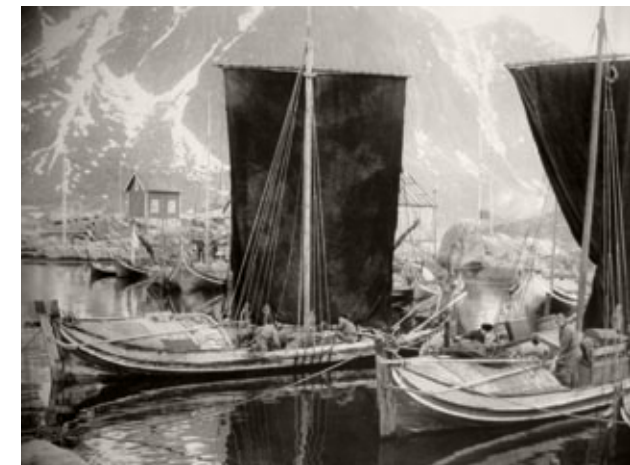
Bildet er tatt under toppåret i lofotfisket i 1895 og viser tradisjonelle nordlandsbåter med råseil i Svolvær. Løftingen, taket akter i de to båtene i forgrunnen, ble tatt av under selve fisket.

Tidligere hadde fiskerne gjennomgående holdt seg til de samme stedene og gjerne de samme rorbuene fra sesong til sesong. Motoren røsket for en stor del opp i denne gamle og tradisjonsbundne stabiliteten; nå skiftet utøverne i større grad oppholdssted i takt med