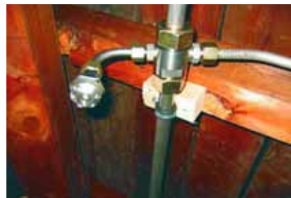
Vanntåkeanlegg på loftet kan hindre at en brann sprer seg ut av bygningen.