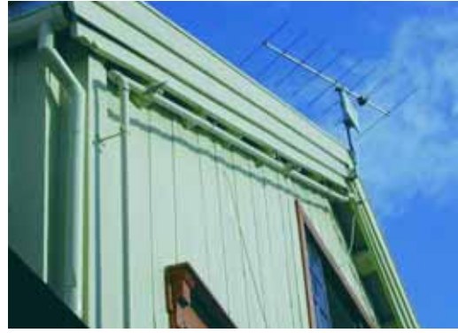
Fasadesprinkleranlegg kan forhindre at bygningen blir antent fra utsiden.

Automatiske sløkkeanlegg kan likevel være på sin plass i strategiske deler av et trehusmiljø, for eksempel: