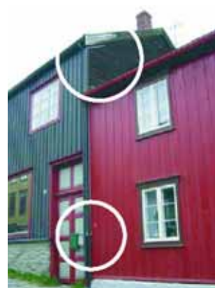
Brannvesenet kopler på vann til vanntåkeanleggene fra utsiden av bygningen. På bildet til høyre ser vi også hvordan vannrørene er ført inn på loftet.

Brannspredning mellom bygninger kan bremses ved å beskytte fasadene med vann fra slanger, ved bruk av vannspray, ved å påføre egnede brannhemmende midler, ved å sette opp provisoriske gipsplater, eller ved å henge opp brannklassifisert presenning.