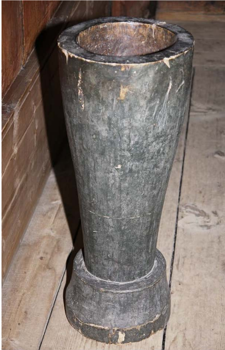
Figur 2. Døpefonten med avskallinger og riper forårsaket av uvøren håndtering og flytting. Foto: I. Schonhowd, Riksantikvaren, 2013.