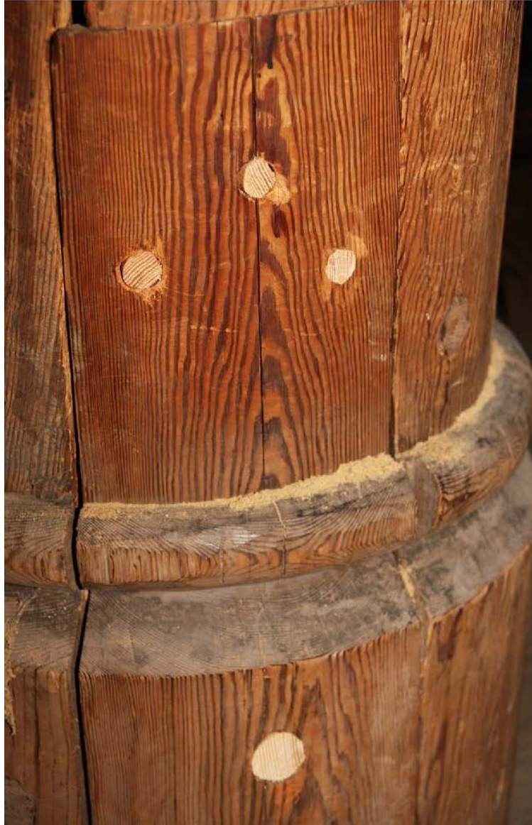
Figur 4. Sydvestre søyle i skipets midtrom er angrepet av treborende insekt. Staven ble spunset i 2012.