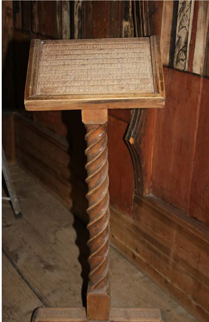
Figur 3. Leseput fra 1574.