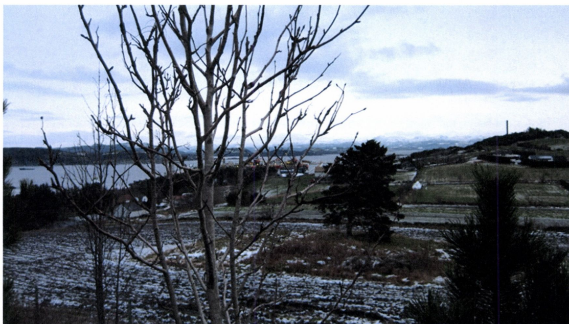
Fig. 2. Utsikt mot kirketuft fra middelalder på Randaberg, Randaberg k. Det er vid utsikt mot Byfjorden.

Som det framgår av ovennevnte, ble ikke selve kulturminnet målt opp, men holmen tufta ligger på er om lag 36 x 25 meter. Det har aldri vært foretatt arkeologiske undersøkelser i kirka eller på kirkegården.