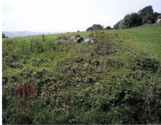
og status i juni 2009