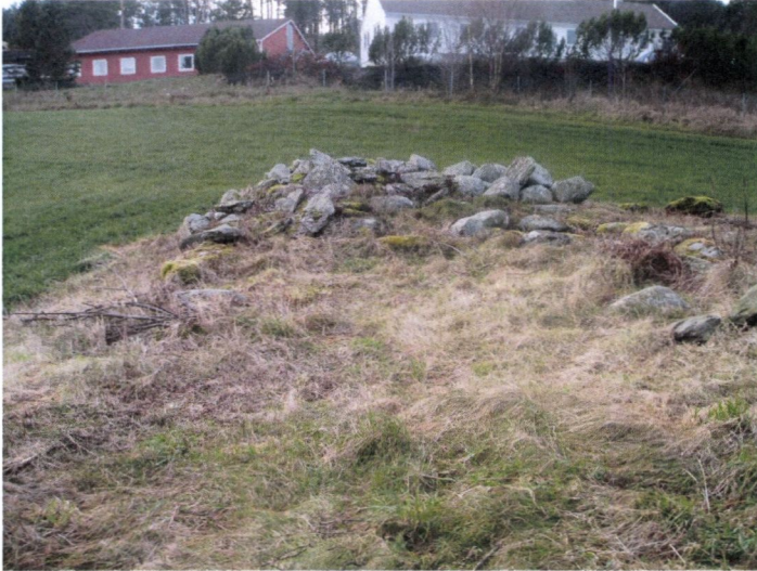
Etter skjøtsel i 2007

Her kan med fordel følges opp på tidligere utført førstegangsskjøtsel., Samt flytte skilt og anlegge sti + lemmer.