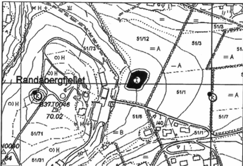
Fig. 1. ID 54032. Kirketuft og kirkegård fra middelalder på Randaberg, Randaberg k. Tufta er orientert i øst-vestlig retning.