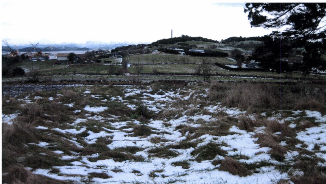
Fig. 3. Kirketuft fra middelalder på Randaberg, Randaberg k. Et svakt søkk i tufta er synlig når vegetasjonen er lav.

Selv om det foretas årlig skjøtsel, vil kulturminnet gi begrenset opplevelsesverdi. Det går rester av et gjerde over tufta og det ligger moderne rydningsstein og stein som kan stamme fra grunnmuren i kirka i den vestlige delen (se vedlegg 2). Om vinteren og etter skjøtsel er det riktignok mulig å skimte et søkk i bakken (fig. 3), men om publikum forstår hva de ser er heller tvilsomt.