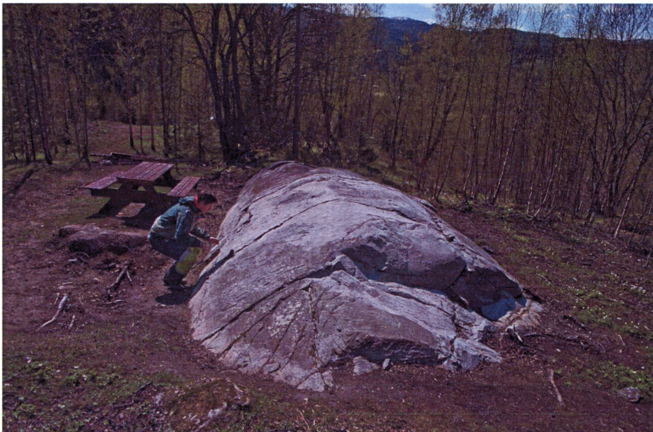
Foss IX, avdekket og veldig ren