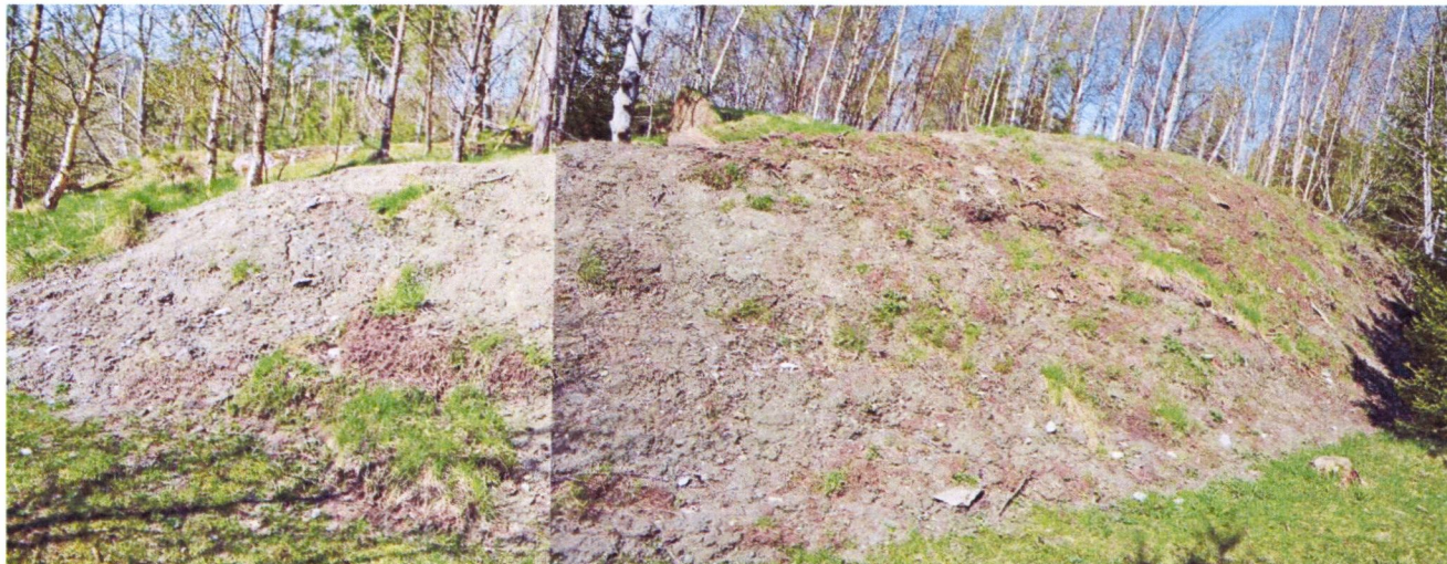
Foss I tildekket med vekstduk og jord, begynner å gro til fint

Under oppholdet på Foss befarte vi også Foss I som ble tildekt med vekstduk og matjord høsten 2011 og Foss IX som ble avdekt.