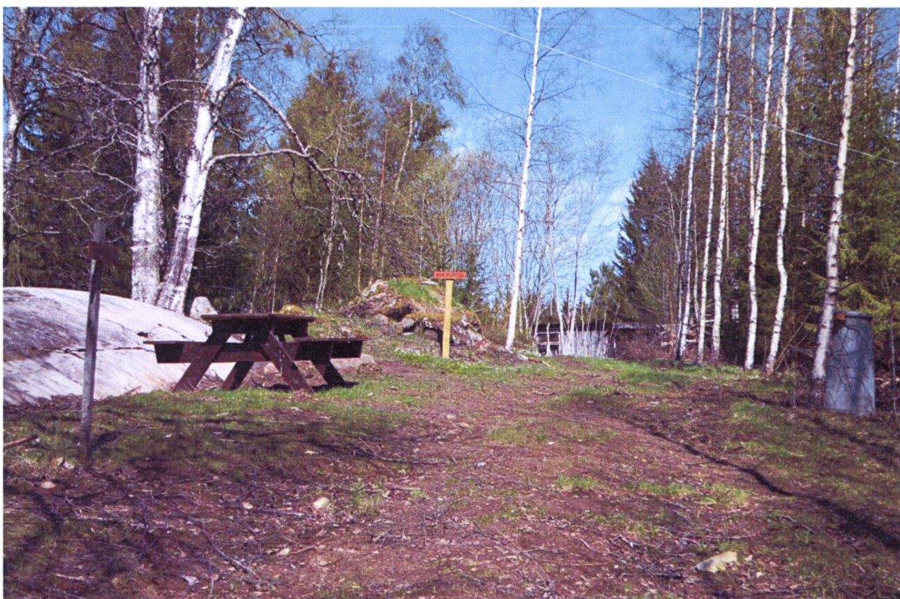
Foss IX, tilrettelagt med flere retningsskilt, samt med rasteplass