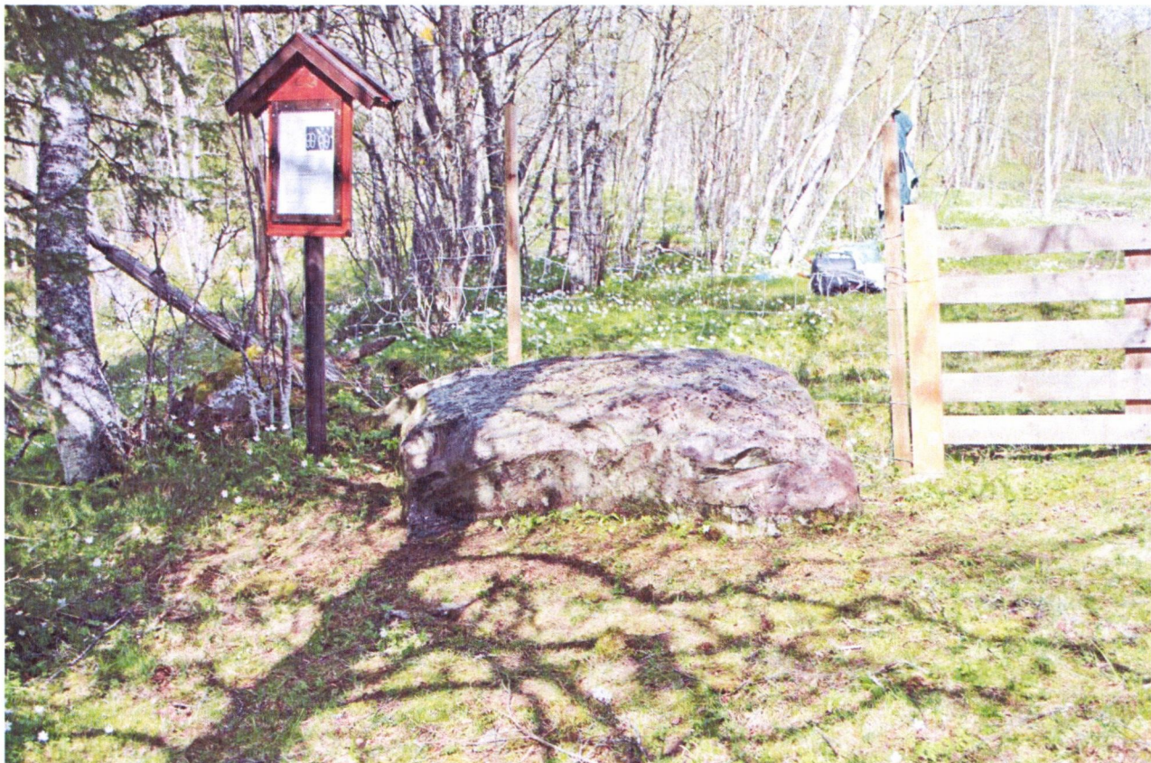
Foss II, før og etter rens, foto tatt mot øst