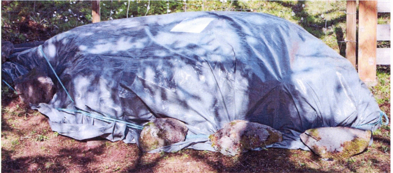
Foss II, spritet og tildekket, foto tatt mot øst