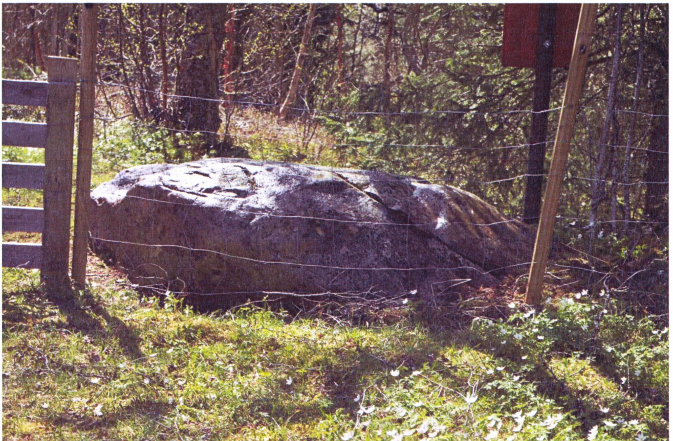
Foss II, før og etter rens, foto tatt mot vest