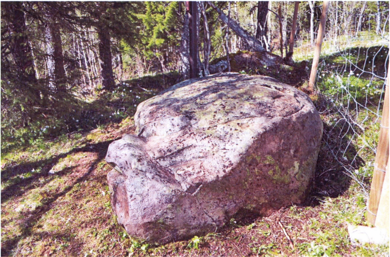
Foss II, før og etter rens, foto tatt mot nord