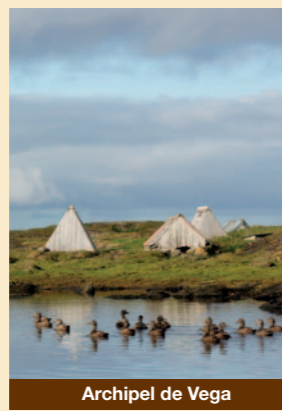
Archipel de Vega