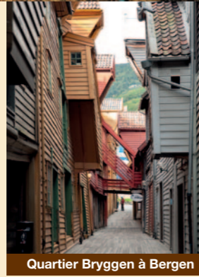
Quartier Bryggen à Bergen

Le Conseil pour l'héritage culturel (Riksantikvaren) et le Conseil pour l'environnement (Miljødirektoratet) représentent la Norvège au Comité du patrimoine mondial de l'UNESCO.