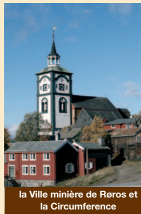
la Ville minière de Roros et la Circumference