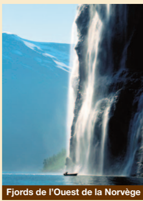
Fjords de l'Ouest de la Norvège