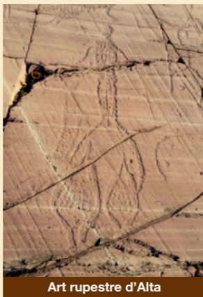
Art rupestre d'Alta