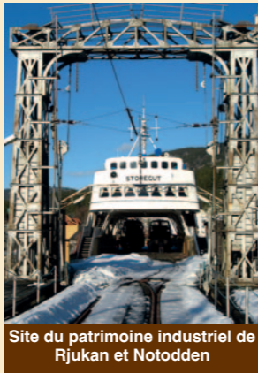
Site du patrimoine industriel de Rjukan et Notodden