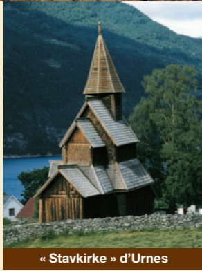
« Stavkirke » d'Urnes