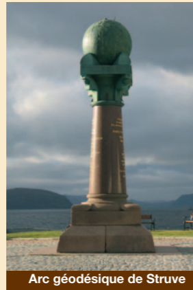
Arc géodésique de Struve