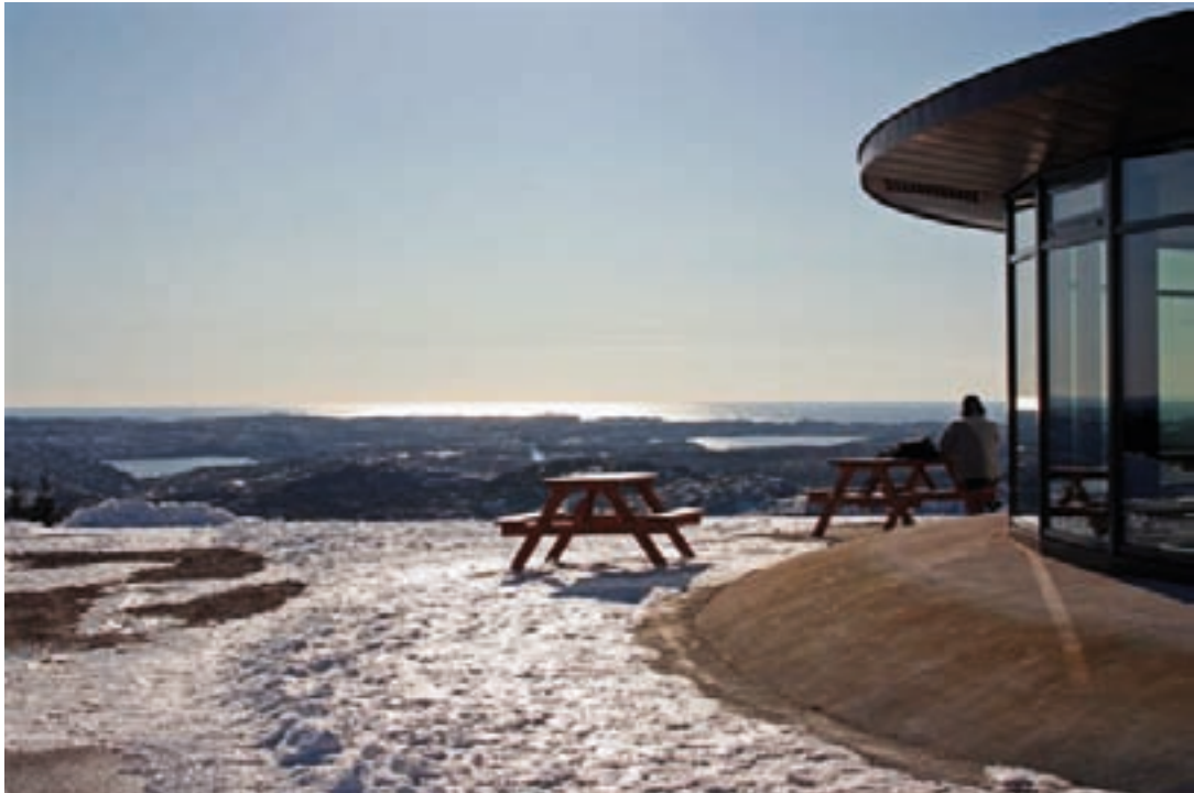
Frå Fjell festning

I 2010 har PIN-prosjektet hatt fokus på økonomisk verdiskaping i eit langsiktig perspektiv. Det har vore arbeid med ein verdiskapingsplan der økonomisk, kulturell, miljømessig og sosial verdiskaping har vore viktige dimensjonar å få fram.