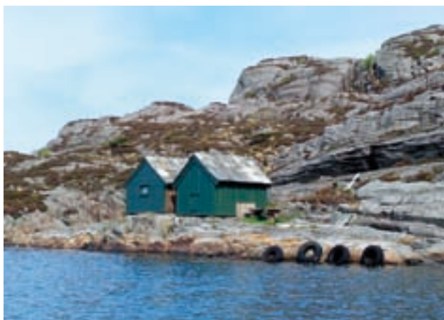
Selstøbuene – etter restaurering