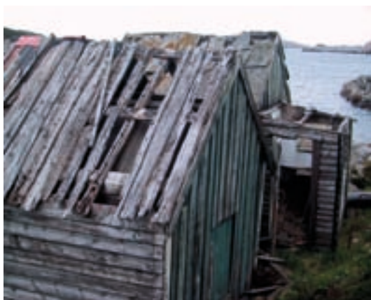
Selstøbuene – før restaurering

Restaureringsarbeidet representerer i seg sjølve ei økonomisk verdiskaping på den måten at kulturminna har fått ei kvalitetsheving og auka verdi og status. I tillegg har me døme på at kulturminna inngår i næringsverksemd, som Selstøbuene og gravplassen i Havørnsafari.