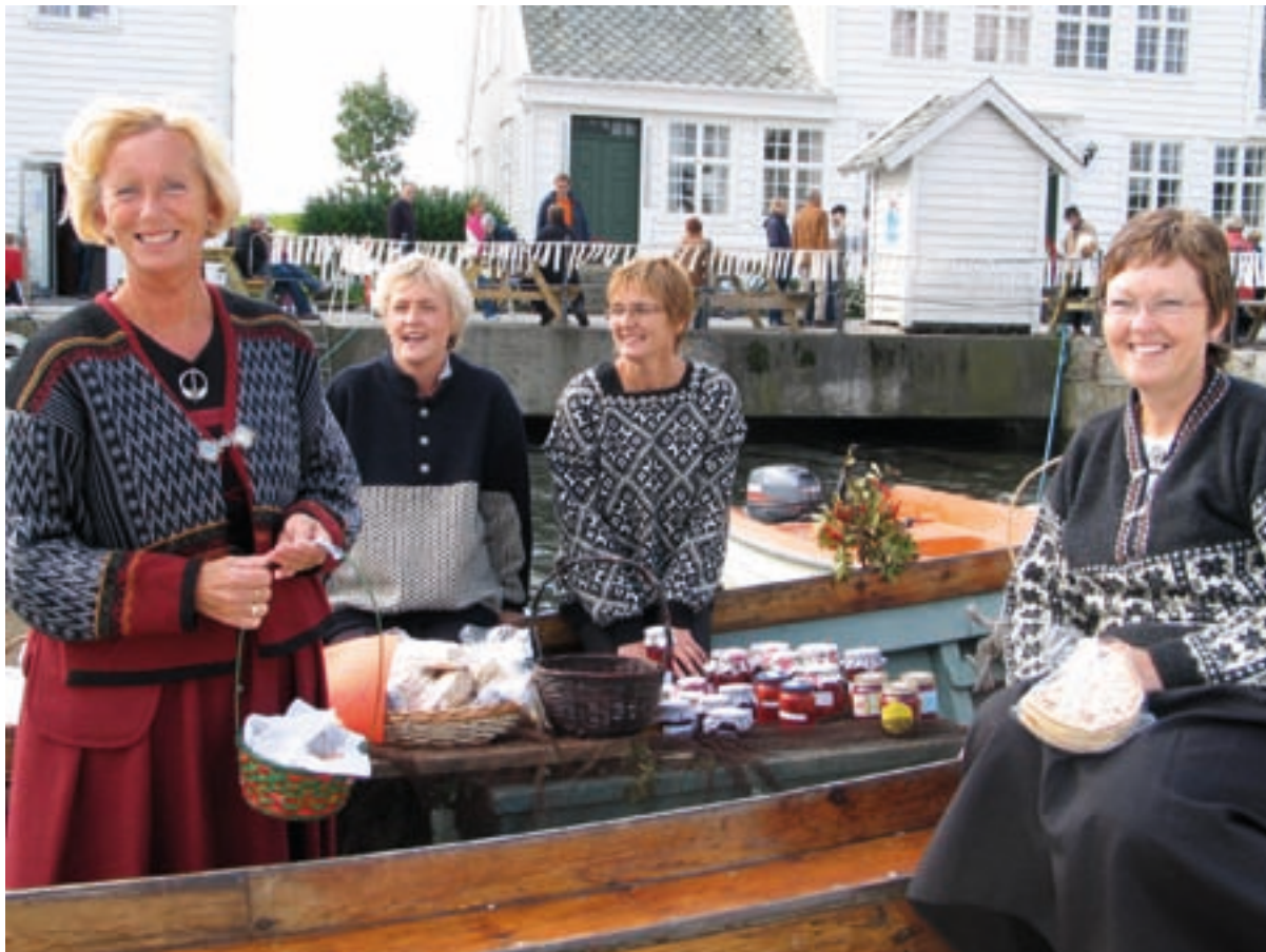
Flytande marknad på Glesvær, Kaisess.