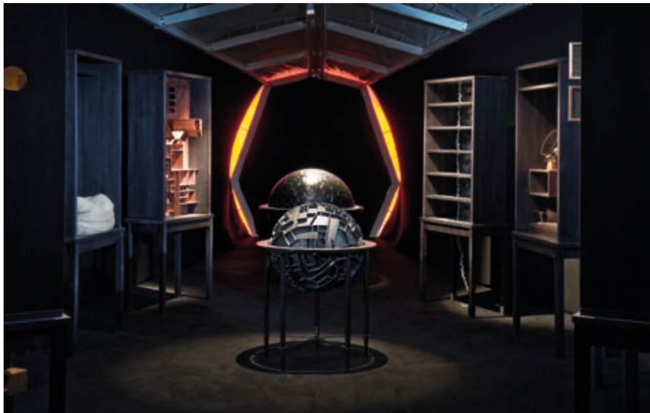
Utstillingen "Biblioteket" av Woojung Chun. (Korea). Kuratert av James Putnam. Produsert av Gitte Sætre.

Med si arkitektoniske form og kunstnariske profil er Luftskipet unikt. Kulturminne og samtidskunst har tidligare møtt kvarandre blant anna gjennom prosjektet "Museale forstyrrelser". Her inviterer Norsk kulturråd til refleksjon rundt historie, kulturarv og kulturarvinstitusjonar ved å la samtidskunstnarar jobbe fram kunstprosjekt ved kultur-historiske museum. Luftskipet er eit langsiktig og integrert prosjekt gjennom nærings-utviklingselskapet Gode Sirklar. Satsinga på denne type prosjekt handlar om å ønskje ny kunnskap om metodar for formidling. Spektakulære og alternative prosjekt gir også auka merksemd i lokal, nasjonal og internasjonal presse.