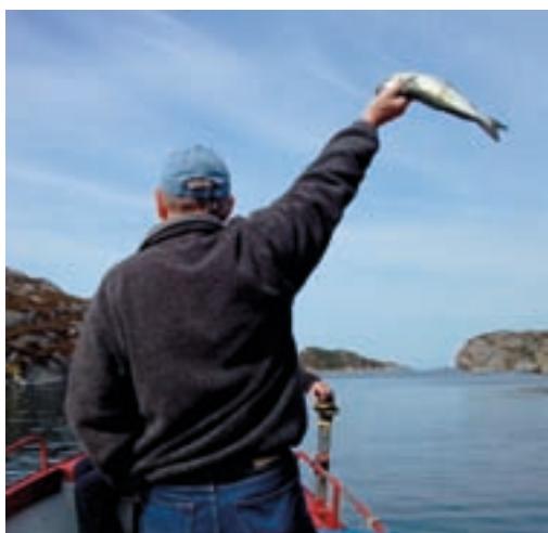
Havørnsafari i Telavåg

Døme på suksesshistorie i Sundpiloten er Havørnsafari i Telavåg - opplevingsturar som nyttar dei ferdig restaurerte Selstøbuene og Kyrkjegarden ved havet aktivt. Havørnsafari gjev økonomisk inntening utan store utgifter.