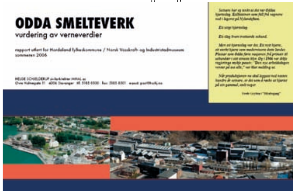
Utsnitt fra forside, "Odda Smelteverk, vurdering av verneverdier"

- Kokstørke - Blandekammer - Transportgang - Grøntareal langs Røldalsveien - Smie