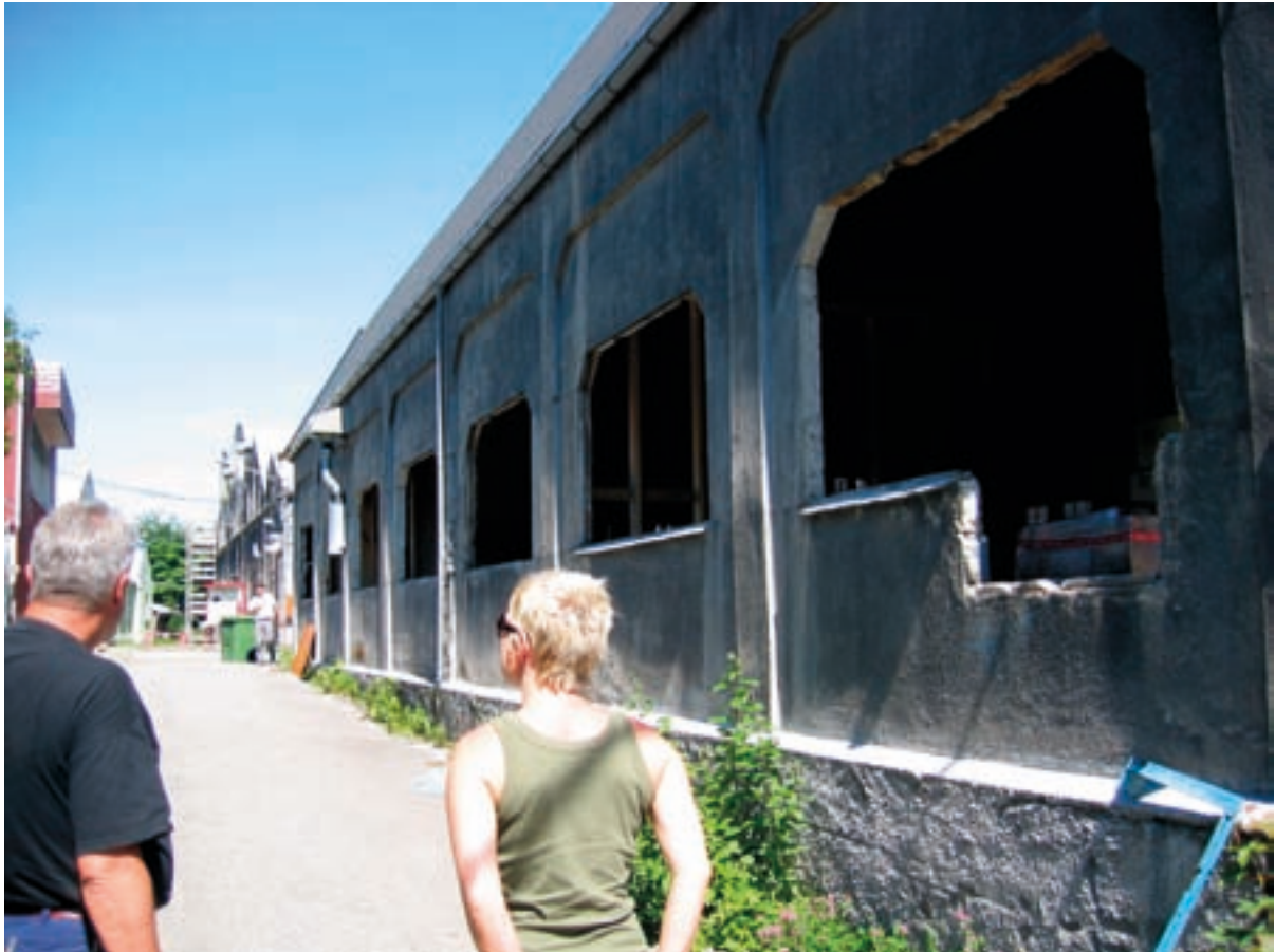
Containerverkstedet i juni 2008

ville kunne gitt Oddaprosessen (og Unescoarbeidet) et løft, og et større, internasjonalt nettverk å spille på.