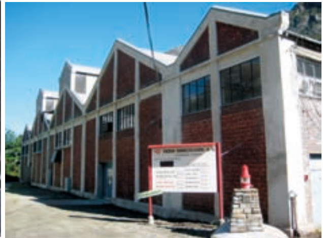
Før og etter: Lindehusets vestfasade i 2008 og i 2009