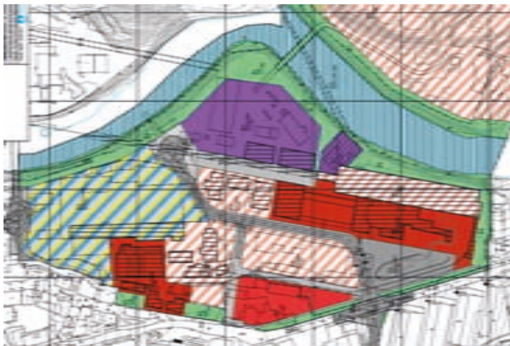
Utsnitt fra reguleringsplanen

og Industristadmuseum imot daværende miljøvernminister Helen Bjørnøys utfordring om å bli ett av 11 pilotprosjekter innenfor Riksantikvarens verdiskapingsprogram på kulturminnefeltet, og Oddaprosessen.no så dagens lys. Oddaprosessen ble i starten drevet parallelt med prosjektet Odda i utvikling .