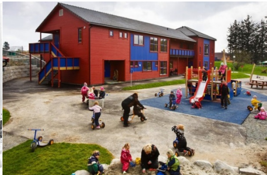
Espira Sletten barnehage