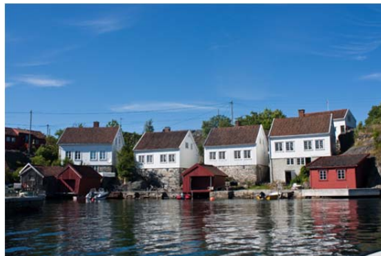
Småskala bolig/ sjømenn

Videre ser vi et behov for å ta tak i temaet « Grøntanlegg ». Her er det behov for å sikre de sentrale hagehistoriske verkene, men også vesentlig å inkludere grønntanlegg i nye fredninger av boliger/ boliganlegg.