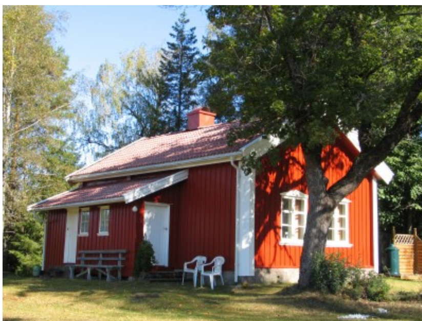
Skolestue, Østfold. Foreslått fredet av privatperson 2012.

Det er fredet noen grunnskolebygg fra det tidlige 1900-tallet i de store byene. Noen skolestuer er ivarettatt av lokale museer. (Se ellers kommunal/ fylkeskommunal sektor 6.14)