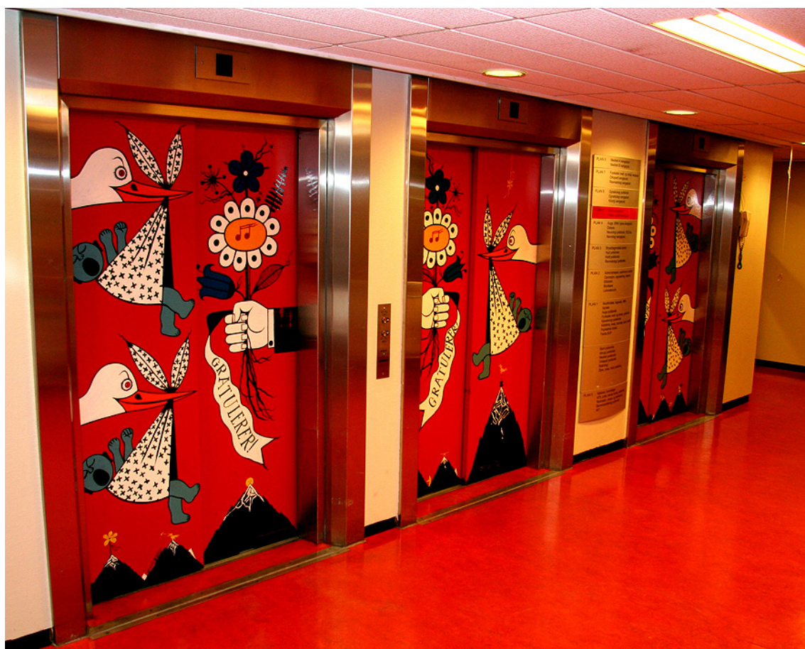
Heisparti til fødeavdelingen: Førde sentralsjukehus er fra 1979 er et av mange anlegg fredet gjennom de statlige landsverneplanene.

For enkelte temaer ser Riksantikvaren behovet for en mer systematisk tilnærming til utvelgelse av fredningsobjekter. Vi har de siste årene arbeidet mye med verneplan som metode og ser at dette er en god måte å gjennomføre fredninger på. For noen få utvalgte tema vil det være aktuelt å bruke verneplan som metode. Innenfor andre av de prioriterte temaene vil antall fredninger være så begrenset at utarbeidelse av en verneplan ikke vil være hensiktsmessig.