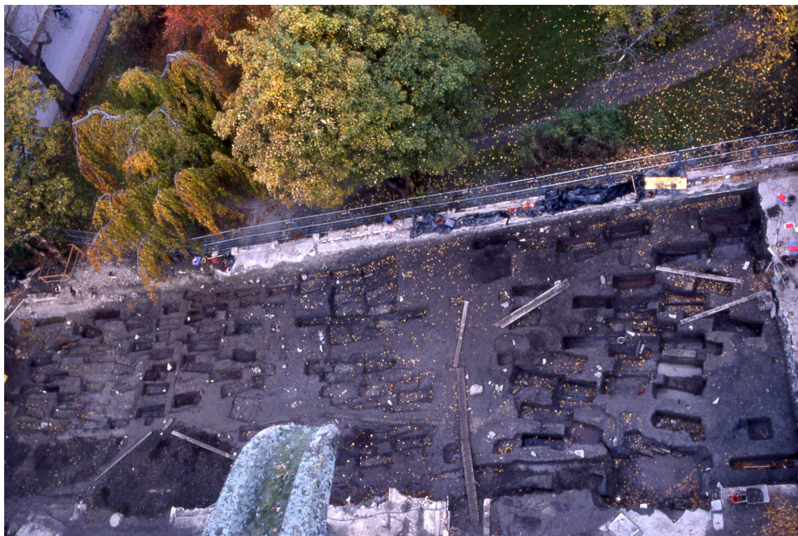
Utgraving ved Nidarosdomen i forbindelse med nytt servicebygg: Til høyre i bildet er graver som ble flyttet ut av krypten og gjenbegravd på midten av 1800-tallet. Disse er stort sett fra 1700-tallet. Til venstre er fattigkirkegården, som var i bruk rundt århundreskiftet 17-1800.

med metode- og kriterieutvikling. Dette vil være et satsingsfelt fremover.