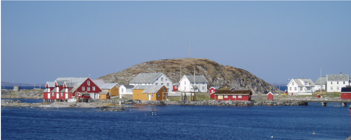
Sør-Gjæslingan i Nord-Trøndelag: Kulturmiljøet ble fredet i 2010 for å ta vare på det særegne fiskeværet som kilde til kunnskap og opplevelse for dagens og framtidens generasjoner.