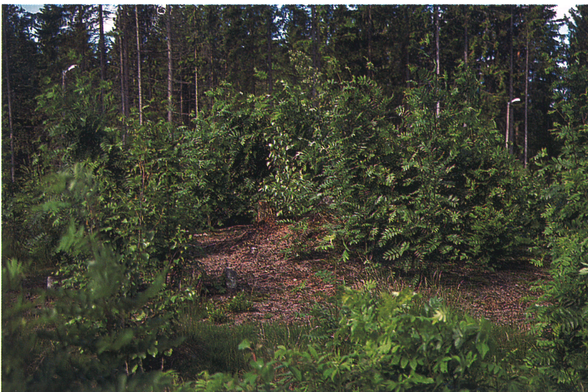
Granskogen ble fjernet og erstattet med spredte bjørketrær. Lauvoppslag og kratt to år etter. Trømborg, Eidsberg kommune, Østfold.