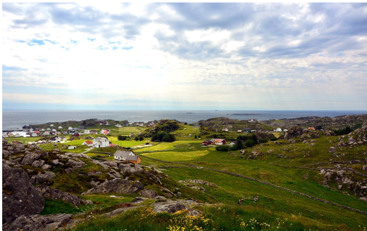
Utsira. Til venstre deler av Sørøvågen.