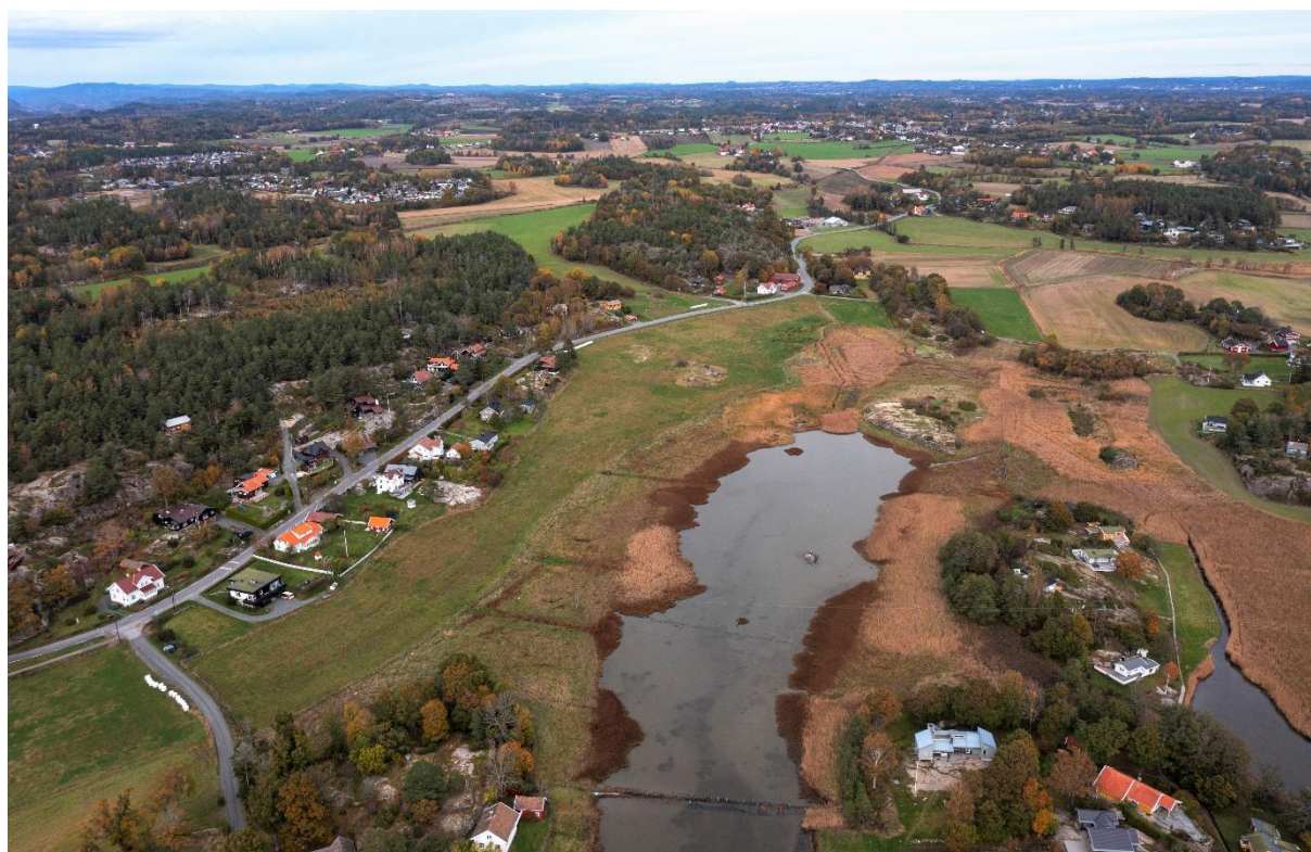
Kaupangskilen med gården Kaupang. Huseby, Lunde og Gjerstad i bakgrunnen.