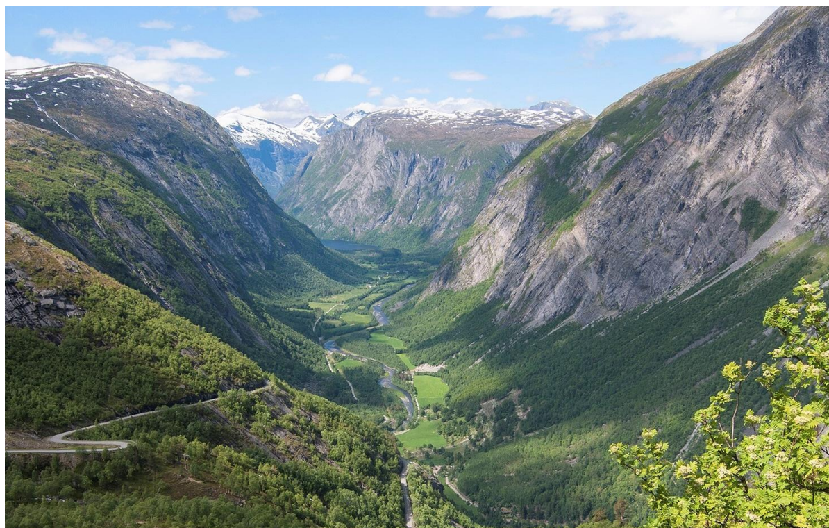
Eikesdalen sett frå Finnsetlia, øvst i området.