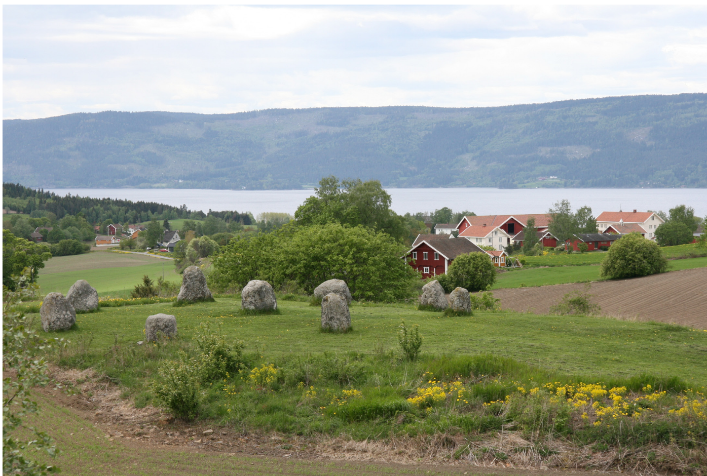
Gravanlegg fra jernalderen, Bilden.