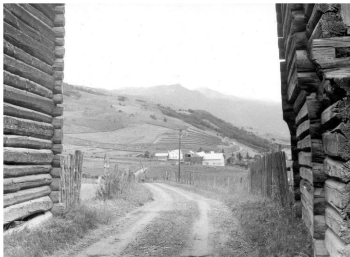
Filnavn: N5_Nordgard Valde_1961_Helge Müller.jpg