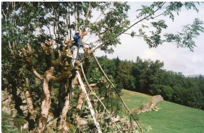
Filnavn: 5_Eineberg_1990ca_ Knut Skjånes.jpg