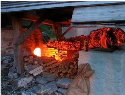
Bevisstheten omkring materialforståelse øker. Her er kalkovnen i Hyllestad.