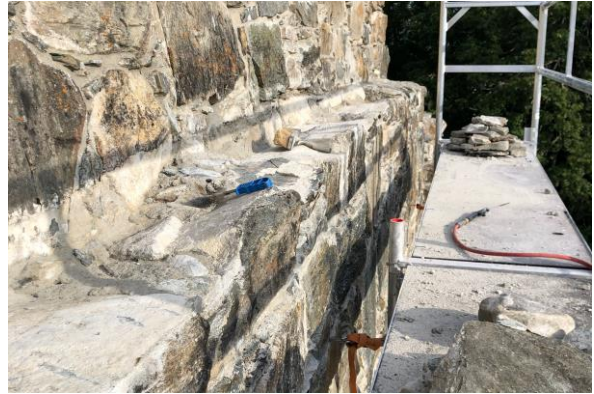
Det utsatte partiet i vestveggen under arbeid.

Reinskloster er i hovedsak ferdig konserververt, men et parti på vestveggen innvendig har en konstruksjon som gjør den utsatt for fukt. Det ble derfor gjort utbedringer på denne. Arbeidet er utført av Bakken & Magnussen AS.