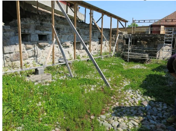
Nordveggen i tårnet under konservering.

Murverket var i dårlig forfatning og enkelte steder var det kritisk, også av sikkerhetsmessige årsaker. Spesielt gjelder dette nisjene i kjellerdelen. Disse er forsterket med stålrammer. For øvrig er murverket konserververt som funnet, men et lite parti av østmuren er tilført et skift for å få bedre avrenning. Kalkmørtel fra egen ovn. Arbeidet er utført av Anno Museum Domkirkeodden og innleide murere.