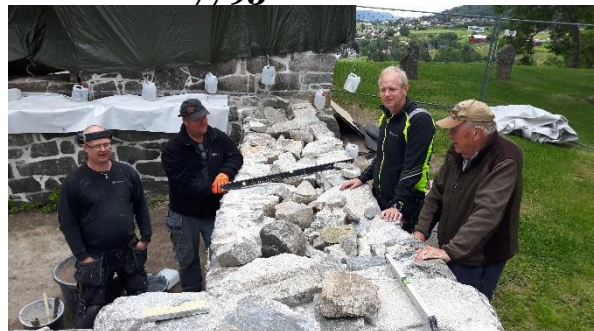
Her diskuteres løsning for utforming av toppdekke i våpenhus.

På Holla er de avsluttende arbeidene i gang. Det er arbeidet på ulike deler av ruinen, men spesielt verd å nevne er nyoppmuring av vestportalen og nytt toppdekke på våpenhus. Ifbm. nylegging av Fischers midtgang er det utført arkeologiske undersøkelser. Ingen spesielle funn fra disse. Arbeidet er utført av Murmester Gulliksen AS og NIKU.