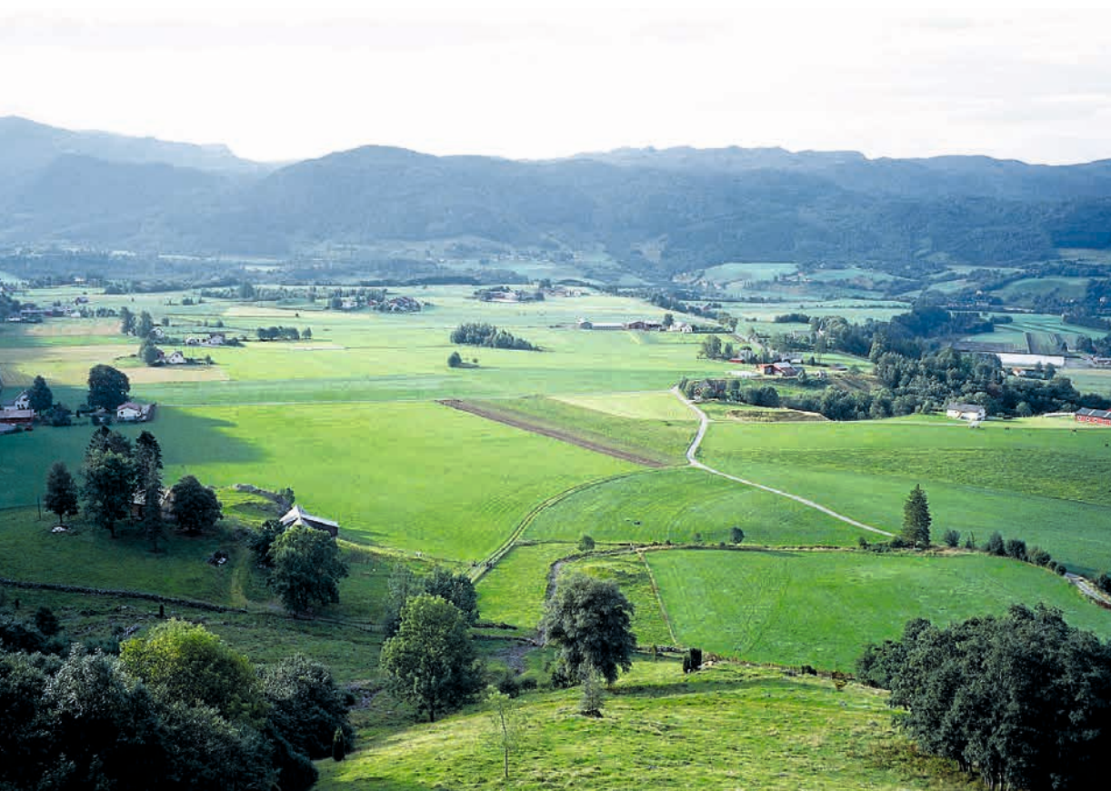
HORDALAND: KULA-området Etne , Rikt jordbrukslandskap med lang historie . I det skålforma landskapet i Etne ligger de vide og fruktbare terrassene Stødle og Grindheim. Dette har vært et rikt jordbruksområde i lang tid, noe en stor mengde av bergkunst og gravminner vitner om.

Dersom det skal være mulig å bevare og bidra til å styrke det kulturhistoriske særpreget, må endringer i arealbruken og ny arealbruk ta utgangspunkt i landskapskarakteren, de angitte nasjonale interessene og sårbarheten til landskapet. Eksemplene på neste side omtaler noen landskapselementer og hva de kan være sårbare for. De er hentet fra rapportene for Hordaland, Troms og Østfold.