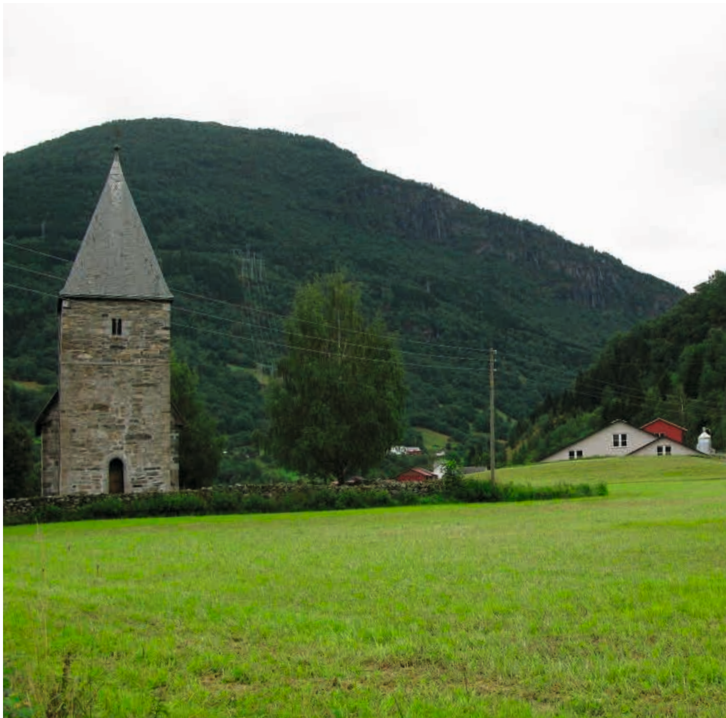
SOGN OG FJORDANE: Vik i Sogn. Summen av mange mindre tiltak kan endre landskapet over tid. Innvirkningen på landskapet bør vurderes når byggesøknader i KULA-områder behandles. Fellesfjøset i Vik i Sogn er tilpasset landskapet og underordnet kirken.