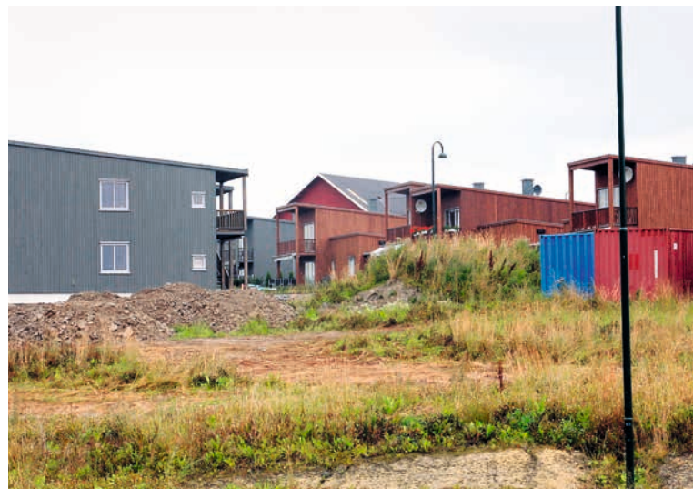
ØSTFOLD: Spydeberg. Jordbrukslandskapet har her blitt til et boligområde.