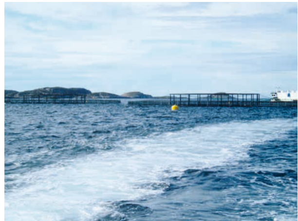
TRØNDELAG: Akvakulturanlegg/fiskeoppdrettsanlegg i Vikna. Kystnære sjøområder kan være viktige deler av noen landskap, og konsekvenser for de kulturhistoriske verdiene må vurderes når akvakulturanlegg planlegges.

Ved planer om mineraluttak i, eller i nærheten av, et KULA-område må det vurderes om et slikt tiltak vil være i konflikt med verdiene som er vektlagt i det spesifikke landskapet. Dette gjelder både verdiene innenfor området hvor det vurderes uttak og fjernvirkningen av dette.