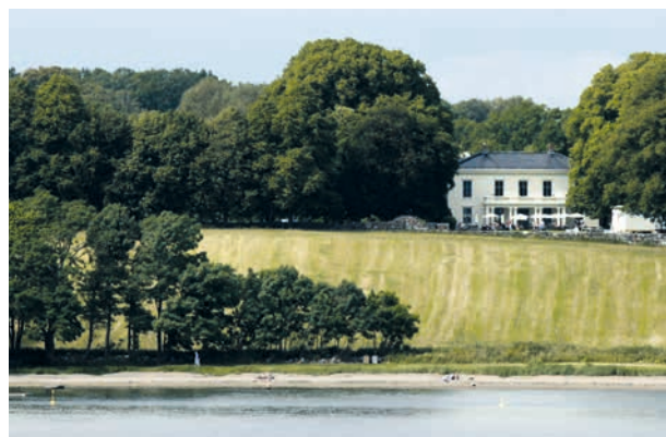
ØSTFOLD: KULA-området Søndre Jeløy , Lystgårdslandskap . Hovedbygningen på Alby er en representant for de verdifulle bygningene som ble bygget på lystgårdene, og som fortsatt preger landskapet. Dette er et av Norges mest helhetlige og best bevarte lystgårdslandskap.

Les mer om de Kulturhistoriske landskapene av nasjonal interesse på prosjektsiden for KULA på Riksantikvarens nettsider .