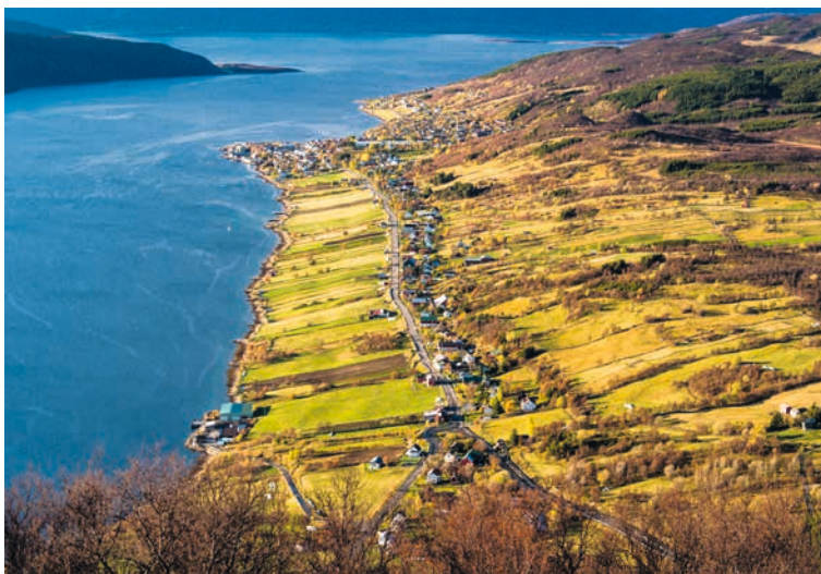
TROMS: KULA-området Kveøya og Borkenes – Vik , Frodig jordbrukslandskap med lang kontinuitet . På Kveøya er det en bred brem av innmark i aktiv bruk. Der dyrkes det søte, smakfulle jordbær og gourmetpotet.

Les mer om de Kulturhistoriske landskapene av nasjonal interesse på prosjektsiden for KULA på Riksantikvarens nettsider .