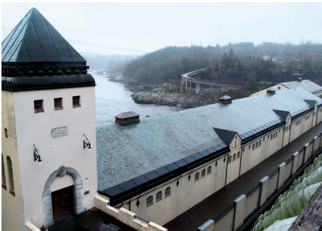
ØSTFOLD: KULA-området Glomma gjennom indre Østfold, Kraft- og forsvarslandskap. Områdene rundt de tre kraftverkene, som inngår i KULA-området Glomma gjennom Indre Østfold, er sårbare for inngrep og endringer. Eventuell ny bebyggelse krever god tilpassing. Vamma kraftverk er det nederste av de tre kraftverkene.