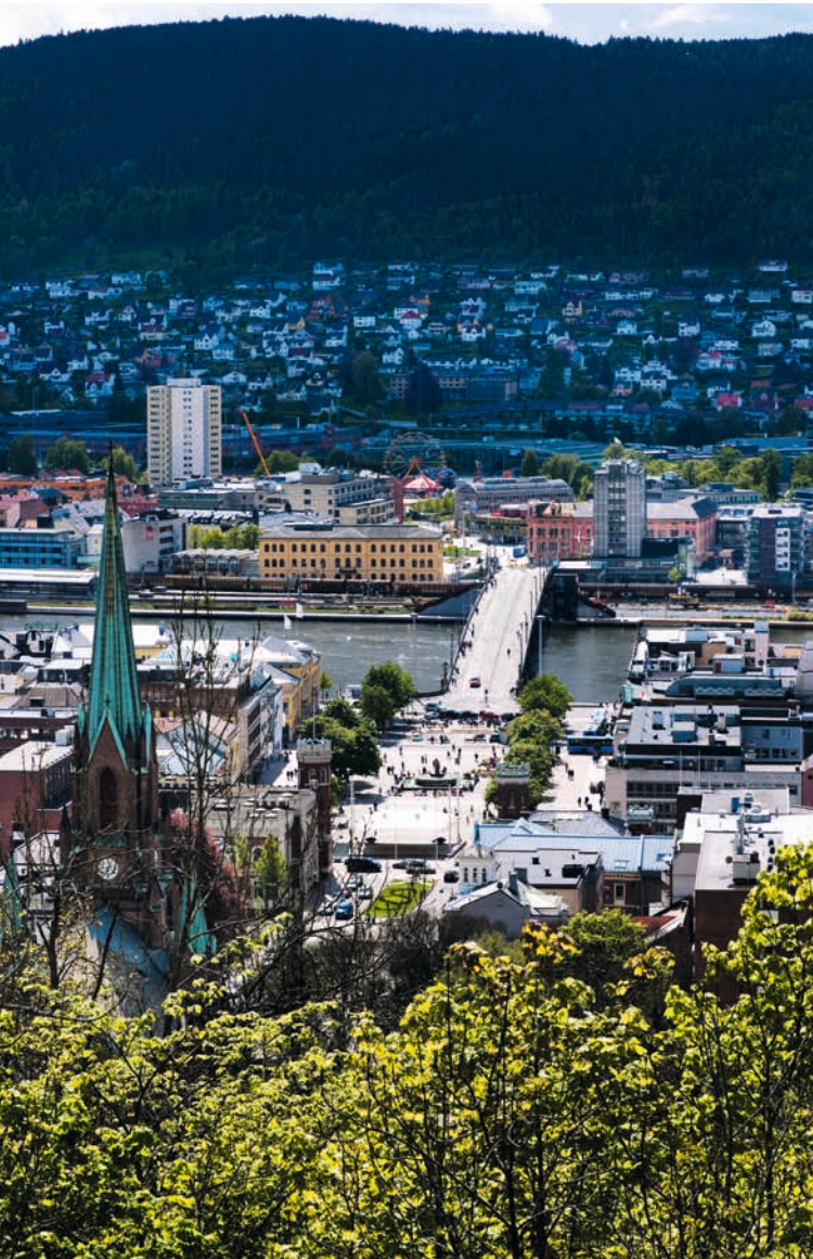
BUSKERUD: Utsikt over NB!-området ved Bragernes torg i Drammen.

Både KULA-registeret og NB!-registeret inneholder områder av nasjonal kulturhistorisk interesse. Der KULA-registeret omfatter større områder som viser historiske landskapstrekk og sammenhenger, omfatter NB!-registeret kulturmiljøer innenfor byer og tettsteder.