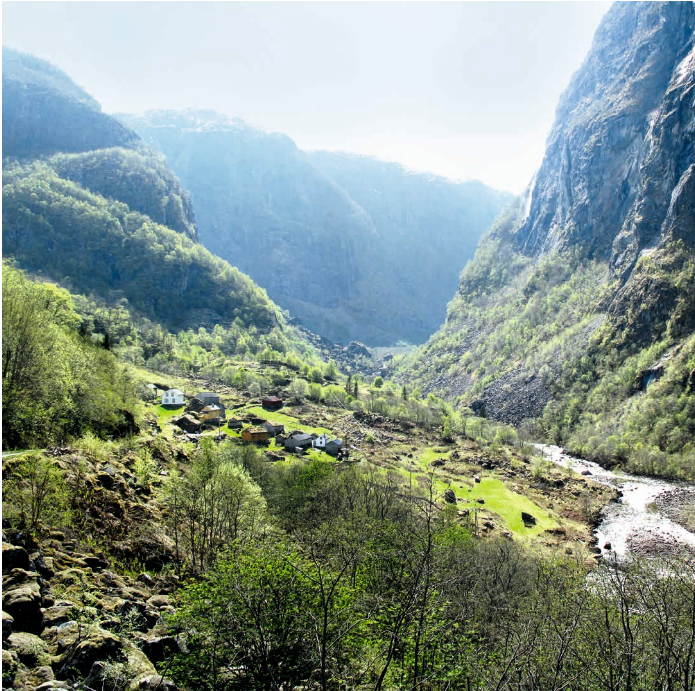
HORDALAND: KULA-området Eidfjord , Jernvinneanlegg og gravminne . Ferdselsveger mellom aust og vest. Gjennom Hjulmodalen går en sentral ferdselsrute fra vest til øst opp fra Hardangerfjorden til Hardangervidda. Landskapet er sårbart for blant annet kraftutbygging og hyttebygging, og bør i kommuneplanens arealdel legges inn som hensynssone c) med særlig hensyn til landskap og kulturmiljø.