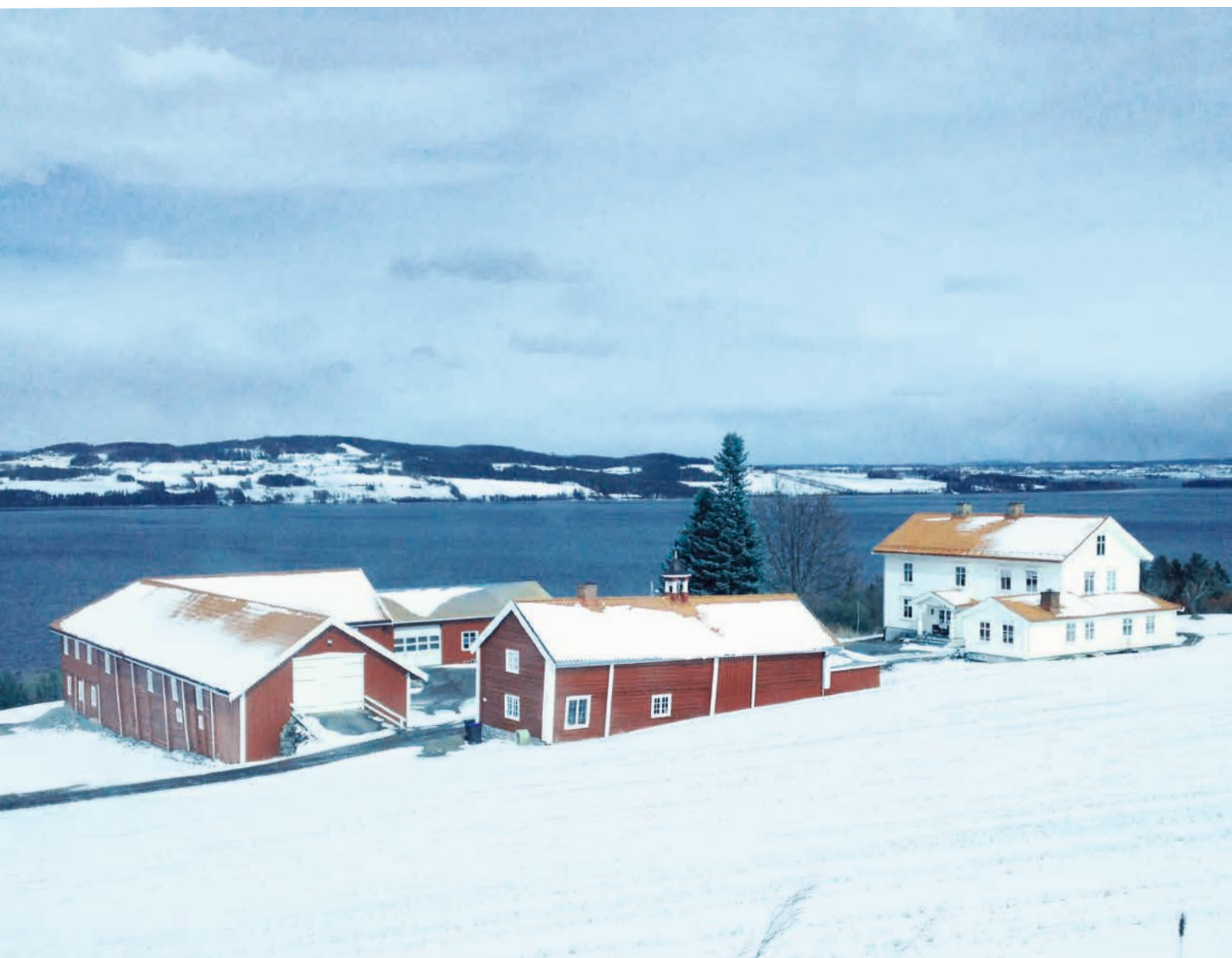
OPPLAND: Balke Lillo, Toten. Store og staselige gårdstun og enkeltbygninger setter sitt preg på landskapet i området Balke – Lillo på Toten. Rike arkeologiske funn viser at her har det vært bosetning og jordbruksdrift i lang tid.