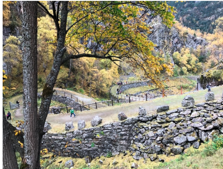
SOGN OG FJORDANE: Vindhellavegen i Lærdal. Restaureringen av Kongevegen over Filefjell gir grunnlag for verdiskaping lokalt. Veganlegget imponerer og begeistrer fotturistene, men landskapet de tar seg fram gjennom, er også en viktig del av opplevelsen og forståelsen av historien om veganlegget og om livet i denne delen av landet før i tiden.

Når KULA-registeret i et fylke er ferdigstilt, er det kommunen som har hovedansvaret for at landskapene blir godt ivaretatt. Riksantikvaren ønsker at kommunene innarbeider landskapshensyn i sine planer og i annen forvaltning. Utfordringen er å bruke landskapet som en ressurs i samfunnsutviklingen, på en slik måte at vi både bevarer kvalitetene og videreutvikler dem i et langsiktig perspektiv. Riksantikvaren er også involvert i satsingen Utvalgte kulturlandskap i jordbruket i samarbeid med natur- og landbruksforvaltningen. Mer om forskjellen på dette og KULA finnes i kapittel 1.3.3.