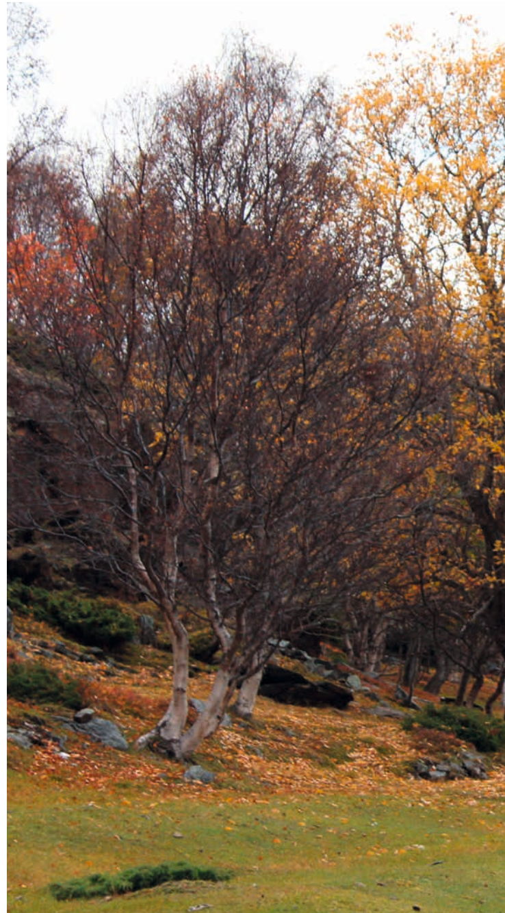
TROMS/ROMSSA/TROMSSA: KULA-området Spildra/Spittá/Pitansaari, Skorpa/Skárfu/Karfunsaaari og Nøklan/Lohkkalsuol/Lokkala , Brytningslandskap: fra sjøsamisk til norsk, fra samisk mytologi til kristen tro, fra sentrum til periferi. Spildra er fremdeles et livskraftig sjøsamisk samfunn hvor folk i hovedsak livnærer seg på fiske, gårdsbruk og turisme. Beitelandskap ved Fjellnes øst for Dunvik.

Se Riksantikvarens eksempelsamling Bestemmelser til arealplaner for flere eksempler.