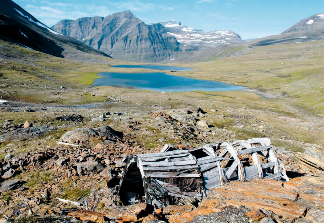
TROMS/ROMSSA/ TROMSSA: KULA-området Storfjord/Omasvuotna/Omasvuono , Konfliktlandskap . Dekningsrommet i Norddalen er en del av Lyngelinja fra andre verdenskrig og er blant de mange hundre sporene etter krig og kald krig i dette landskapet.