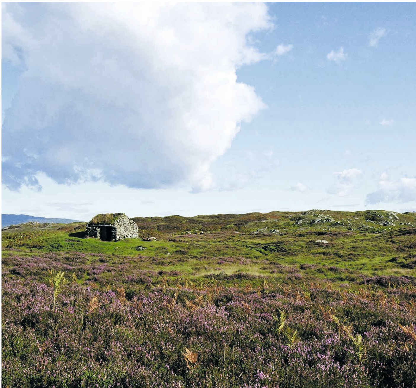
HORDALAND: KULA-området Den indre farleia , Fiskarbondelandskap , lynghei og farlei . Lyngheilandskapet på Lygra er framstående i nasjonal sammenheng. Lyngheia var tidligere utbredt i hele det lave, langstrakte området. I arbeidet med å formidle de kulturhistoriske interessene knyttet til landskap, skal regional kulturminneforvaltning støtte seg på registeret over KULA-områder.