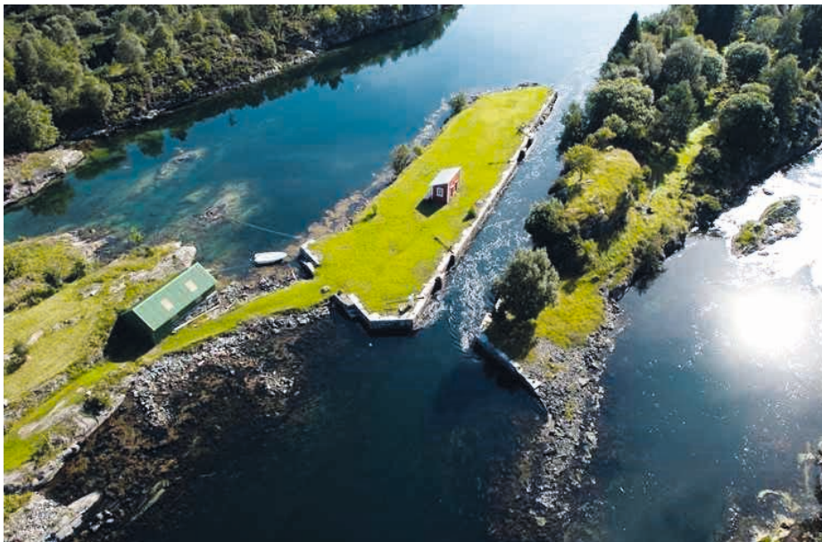
HORDALAND: KULA-området Den indre farleia, Fiskarbondelandskap, lynghei og farled. Gjennom de mange sundene i det langstrakte landskapet, er det sterke strømmer som har vært premissgivende for fast bosetning siden steinalder og for ferdselen i farleia fram til moderne tid. Lindåsslusene ble bygd i 1908 og er en av to bevarte sjøsluser i landet.

Permanent busetnad og framvekst av eit kombinert næringsgrunnlag av fiske og jordbruk har stor tidsdjupne og ein kontinuitet i landskapet. Lyngheilandskapet på Lygra er sjeldant og framstående i nasjonal og internasjonal samanheng. Landskapet er eit av dei nasjonale kjerneområda for samanbygde hus og for bruk av stein som byggjemateriale, som plasserer landskapet i eit kulturelt felleskap med andre område kring Nordsjøen. I dette landskapet ligg den strategisk viktige indre farleia. Den har mange kulturminne knytt til seg med stor tidsdjupne og høg opplevingsverdi. Her er mange gravrøyser som vitnar om maktstrukturar i forhistoria. Kongsgarden på Seim vitnar om kor viktig Den Indre Farleia var i vikingtid og kva rolle den spelte i noregshistoria.