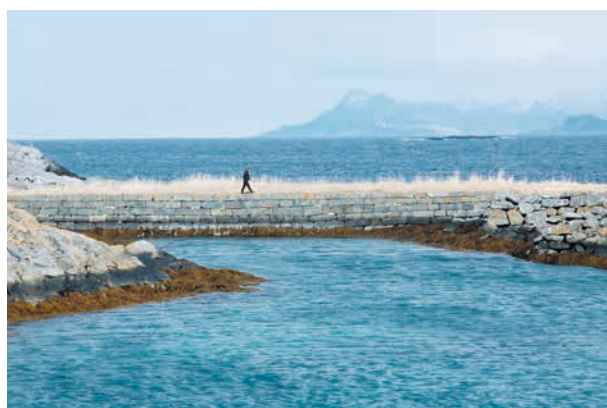
TROMS/ROMSSA/TROMSSA: KULA-området Yttersida av Senja/Sáccá fávlebeal , Fiskerilandskap . Utenfor Senjakysten ligger Senjaværene, en rekke av tidligere bebodde øyer, holmer og skjær. Store og godt synlige ruiner av moloanlegg vitner om utnyttelsen av de rike forekomstene av sild og skrei på 1880-tallet. Bildet er fra Steinavær på Senjas Vestkyst.

Les mer om de kulturhistoriske landskapene av nasjonal interesse på prosjektsidene om KULA på Riksantikvarens nettsider .