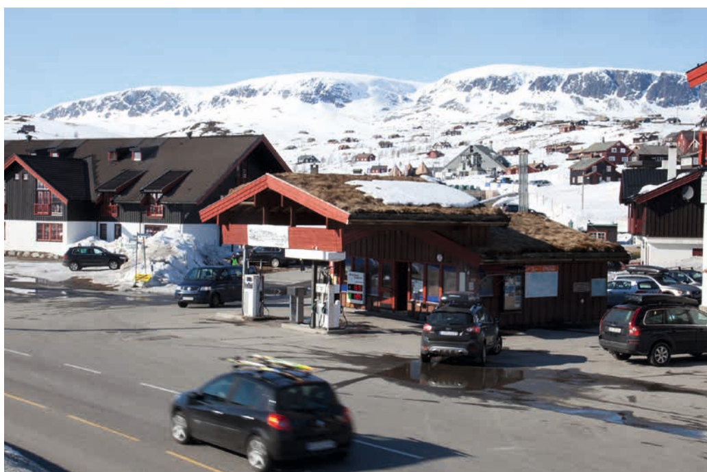
BUSKERUD: Ustaoset. Landskapet her har vært gjennom store endringer de siste hundre år. Kommuneplanens arealdel er kommunens viktigste virkemiddel for forvaltningen av de kulturhistoriske verdiene i landskapet. Foto: Anders Beer Wilse/Norsk Folkemuseum (1922) og Oskar Puschmann/NIBIO 2015