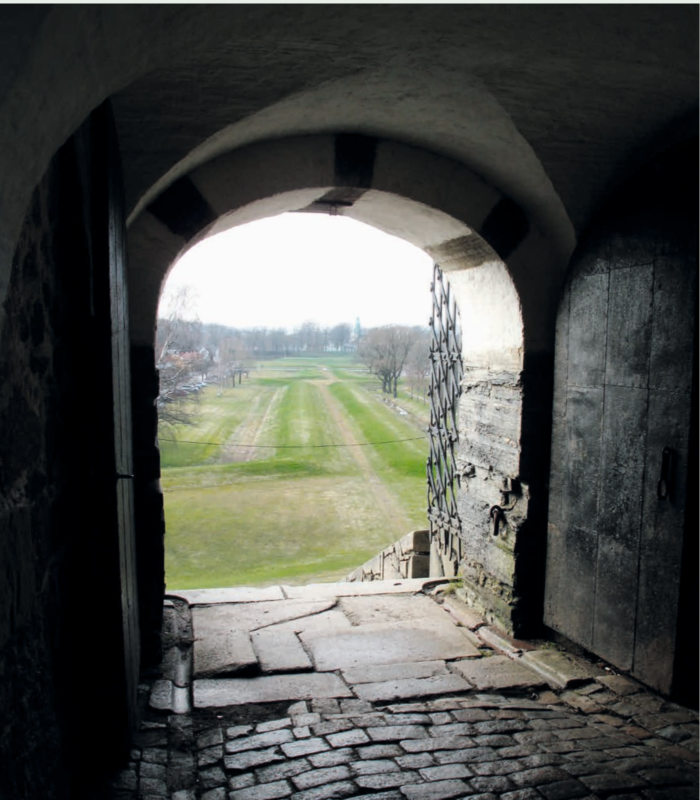
ØSTFOLD: KULA-området Fredrikstad festning, gamlebyen og byens marker, Festningsby med bymarker . Kongsten er et lite festningsanlegg utenfor Gamlebyens murer. «Den dekkede vei» sikrer kontakten mellom de to.