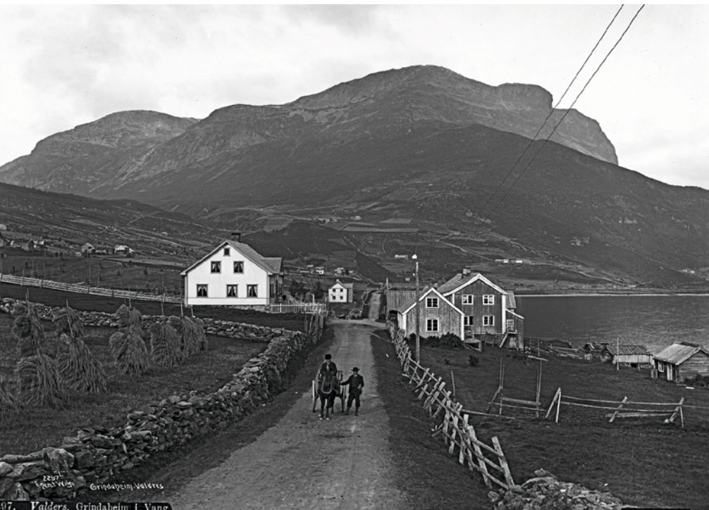
OPPLAND: Grindaheim, Vang i Valdres. Landskap er alltid i endring. En bevisst holdning til endringer og kunnskap om landskapet, kan bidra til at historiske spor ivaretas i arealplanleggingen. Foto: Axel Lindahl/Norsk folkemuseum 1889 og Oskar Puschmann/NIBIO 2013