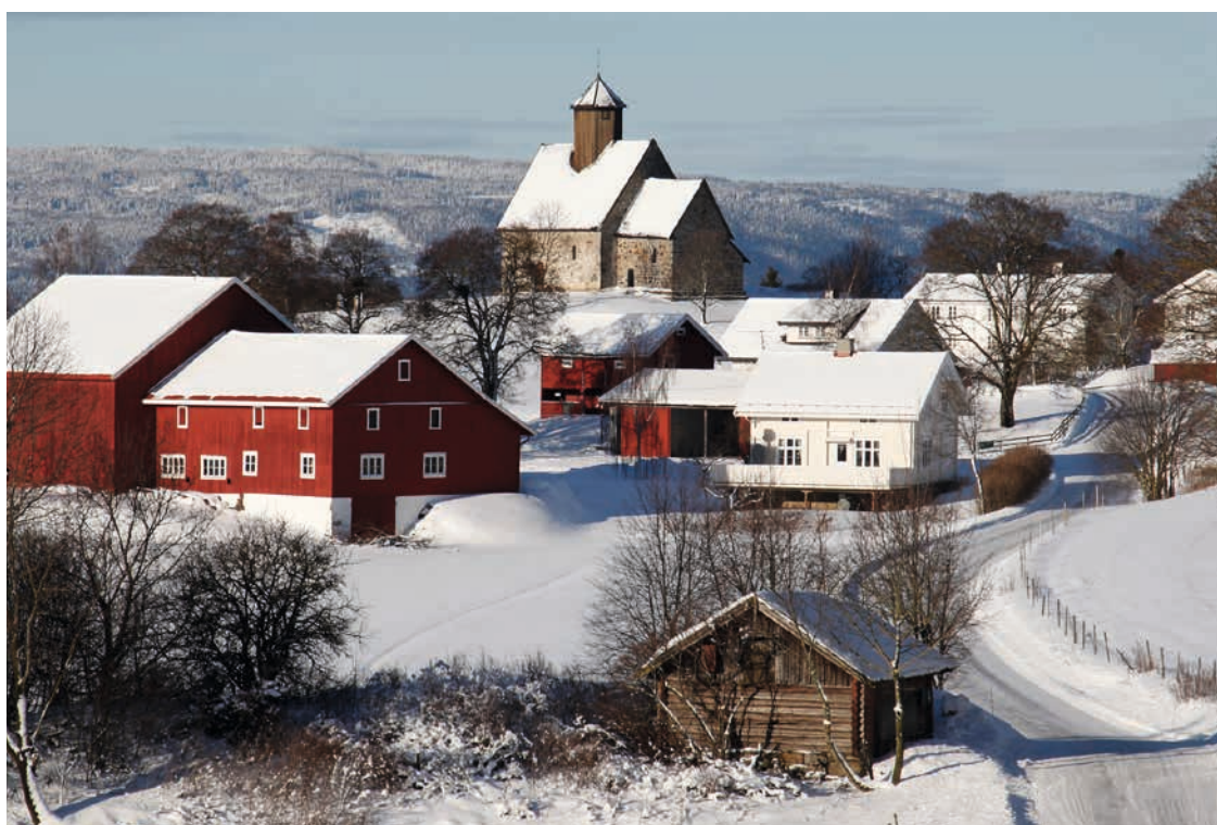
OPPLAND: Tingelstad, Gran. Landskapet har endret seg lite i tiårsperioden som skiller de to bildene. Foto: Oskar Puschmann/NIBIO - 2007 og 2015