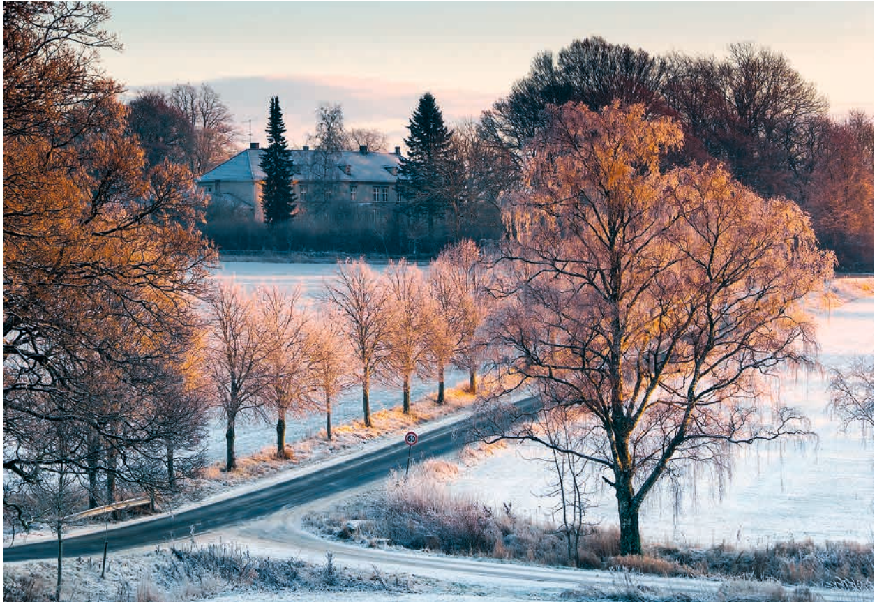
ØSTFOLD: KULA-området Værne kloster-området , Herregårdslandskap . Dette området er en viktig representant for herregårdslandskapene i Norge. En rekke historiske strukturer er bevart, et eksempel er alléen på bildet med herregården i bakgrunnen.