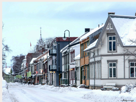
Trehusbyen Levanger, her sett fra Kirkegata.

Riksantikvaren er direktorat for kulturminneforvaltning og er faglig rådgiver for Klima- og miljødepartementet i utviklingen av den statlige kulturminnepolitikken. Riksantikvaren har også ansvar for at den statlige kulturminnepolitikken blir gjennomført og har i denne sammenheng et overordnet faglig ansvar for fylkeskommunenes og Sametingets arbeid med kulturminner, kulturmiljøer og landskap.