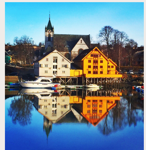
De karakteristiske bryggene ved sundet hadde i sin tid en viktig funksjon i byens næringsliv.