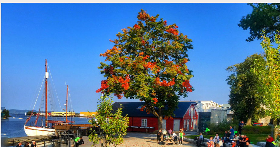
Kulturmiljøfredningen omfatter store parkområder som Sjøparken (på bildet), Øvre park (Seiersteds park), Torget, Nedre Park og Nedre Torg.

De fredete byggene er fordelt på 62 boligeiendommer, 24 næringsseiendommer, 55 kombinerte bolig og næringsseiendommer, sju andre bygg, som kirke og menighetshus, samt ni tomter. Byggeteknikk viser bygningene i Levanger stor variasjonsbredde. Denne variasjonsbredden er karakteristisk for tidsrommet rundt 1900, da industrielt framstilte bygninger er i ferd med å erstatte den håndverksbaserede byggetradisjonen. Levanger er dermed et svært godt eksempel på urbane trehusmiljø, slik de fremsto ved inngangen til det tyvende århundret.