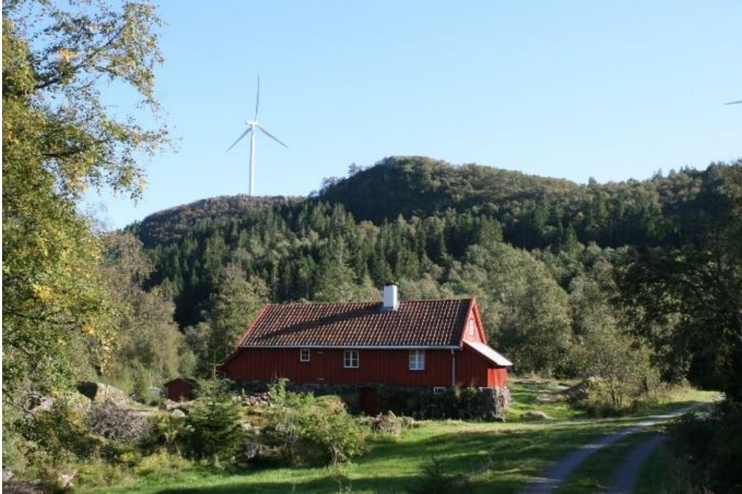
Fra Frøysti, Farsund kommune, med Lista vindkraftverk i bakgrunnen.

høyst ulike kulturminner som kan ha funksjonell sammenheng, men som ikke nødvendigvis har det.