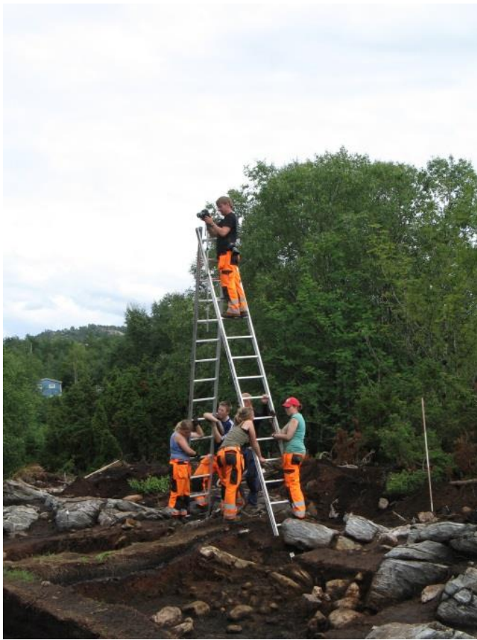
Utgraving av en steinalderboplass på Bjørøy, Fjell kommune, har gitt ny kunnskap om bosetning og ressursutnyttelse langs Vestlandskysten for 8000 år siden.