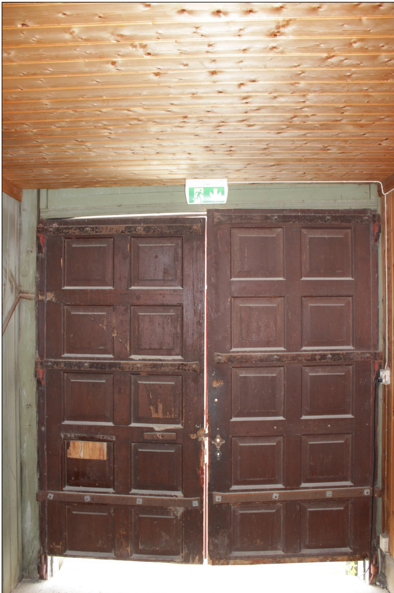
Figur 8. Røros. Bergmannsgata 19. Portrommet. Innsiden av portene og resten av veggfeltene på vestveggen skal ikke overmales.