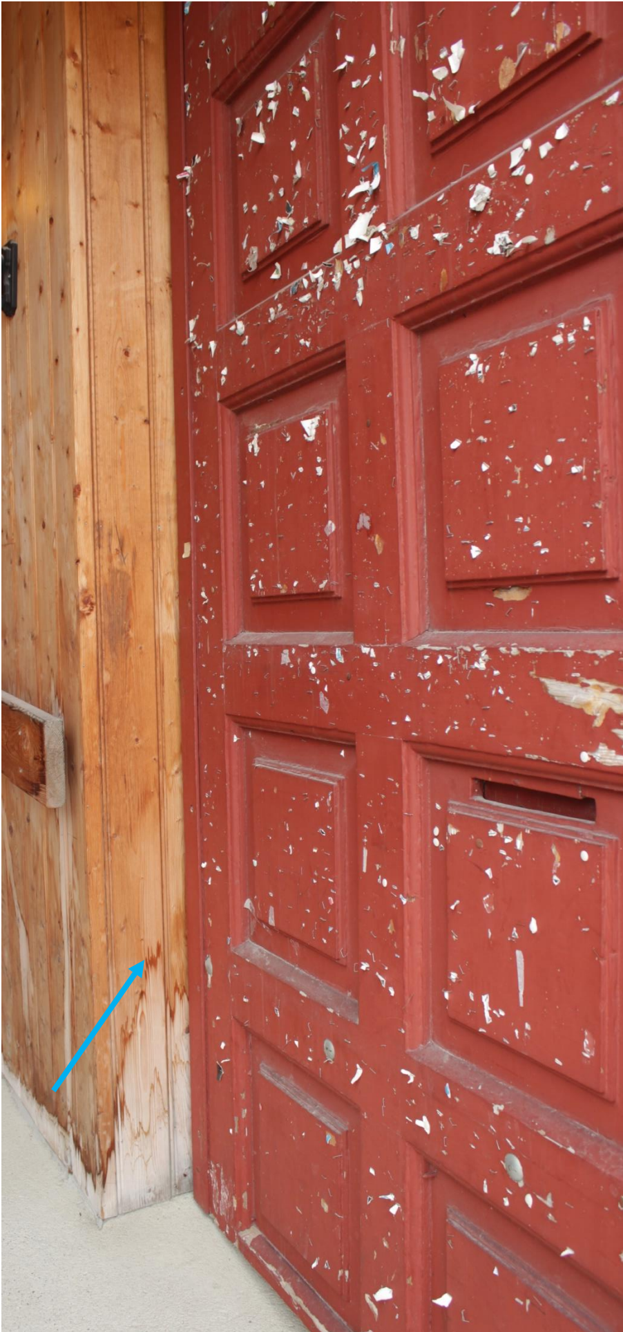
Figur 5. Røros. Bergmannsgata 19. Portrommet. Veggfeltet markert med blå pil skal males med veggfargen fram til den grønne veggfargen bak porten.