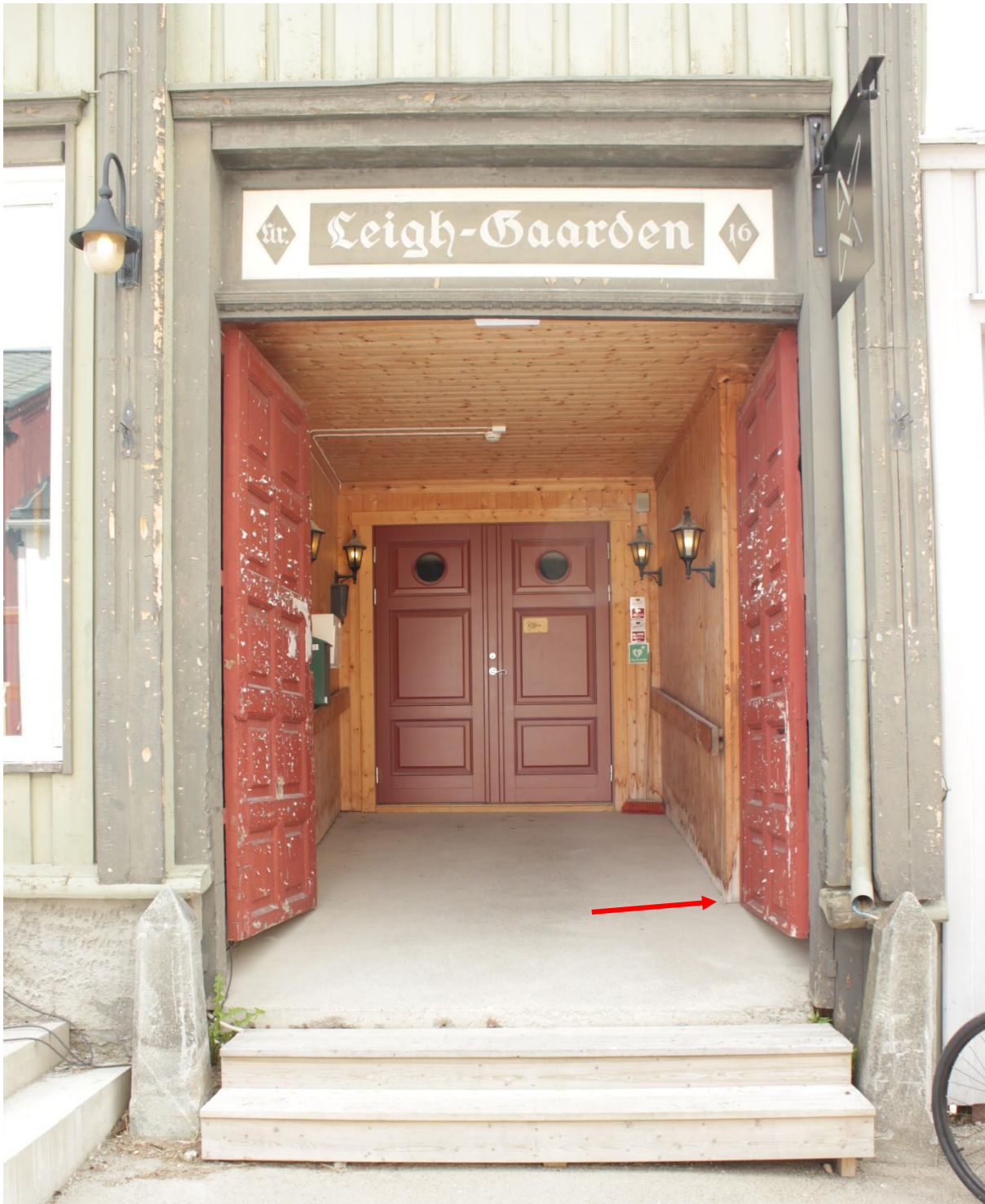
Figur 1. Røros. Bergmannsgata 19. Portrommet sett fra Bergmannsgata. Fra gata går en simpel tretrapp, og en skrå betongrampe som ble etablert da ble etablert en dagligvarehandel i Engzeliussgården. Rampen fortsatte ut i gata. Se figur 2. Hvis rampen fjernes til det punktet som er markert med en rød pil, vil det kunne etableres en trapp fra det punktet og innover mot døra til Kulturminnefondet. Det vil også være mulig å rekonstruere de forhuggete delene nederst på begge portbladene slik at porten kan lukkes og låses.