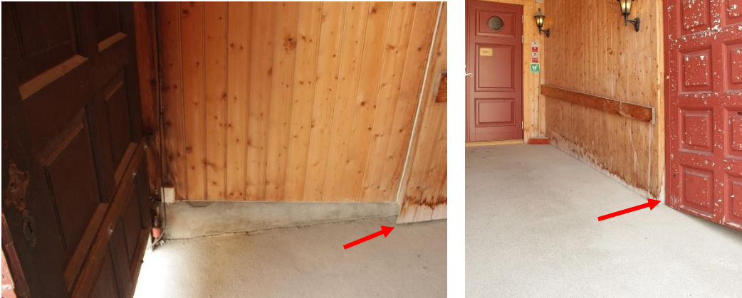
Figur 3. Røros. Bergmannsgata 19. Portrommet. De røde pilene markerer avslutningen på fotlistene mot vest, på nordveggen til venstre og sydveggen til høyre.

Dagens forslag er basert på meget enkle tiltak for snekker og maler.