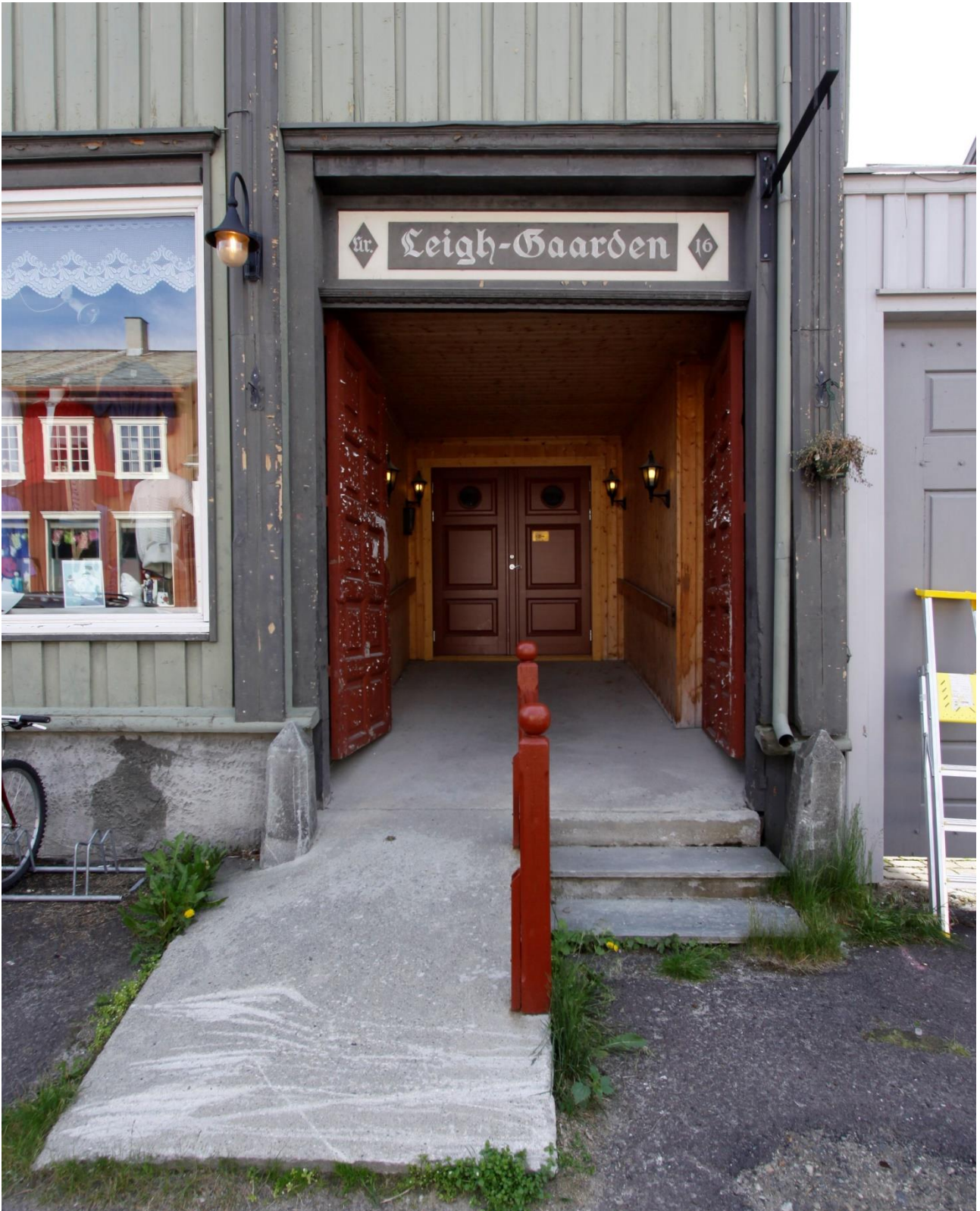
Figur 2 Røros. Bergmannsgata 19. Portrommet med den forlengete rampen slik den så ut i juli 2012. Foto: J. Brønne 6.7.2012.