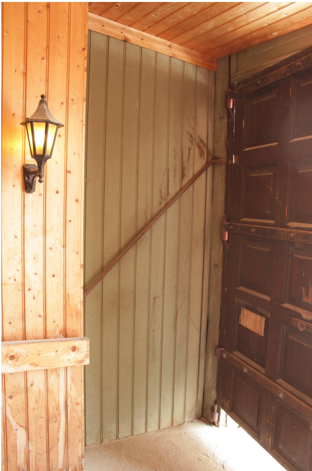
Figur 7. Røros. Bergmannsgata 19. Portrommet. Dette grønmalte veggfeltet bak sydporten males ikke over.