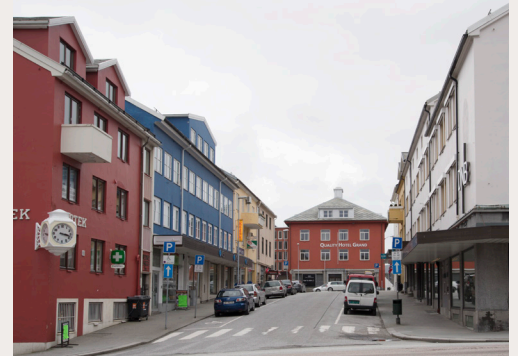
Gjenreisningsarkitekturen i Kristiansund gir byen særpreg og karakter. Byplanen for gjenreisningen la vekt på siktakser, gateutforming og møteplasser.