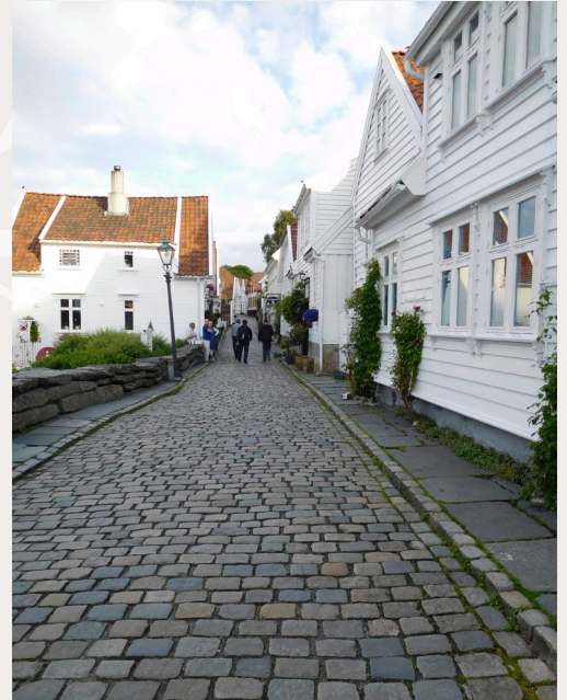
Gamle Stavanger. Helhetlige bygningsmiljøer omfatter også gatebelegg, belysning og annen uteroms-møblering, som er viktig å ivareta i byutviklingen.