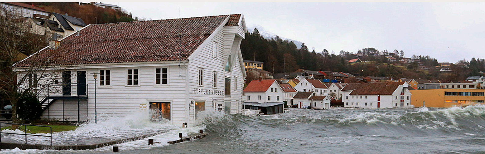
Klimautviklingen vil gi mer storm og uvær. Dette er utfordrende for bevaring av kulturminner. Bildet viser storm på Sand i Ryfylke.

Fagrådet for bærekraftig bypolitikk (MD/KMD 2013) anbefalte å styrke byene og øke kvalitetene i etablerte bymiljøer. De skriver at: Det er ikke bærekraftig at eksisterende bebyggelse fraflyttes, blir stående tom eller rives. Derfor må det legges til rette for byomdanning ved gjenbruk, og fortetting gjennom transformasjon. Byspredning fører til at bestående kvaliteter forsvinner og at verdier går tapt. (s. 13). Rådet pekte også på viktigheten av å lette presset på de mest attraktive byområdene og stimulere til investeringsvilje i mindre utviklede byområder (s. 44).