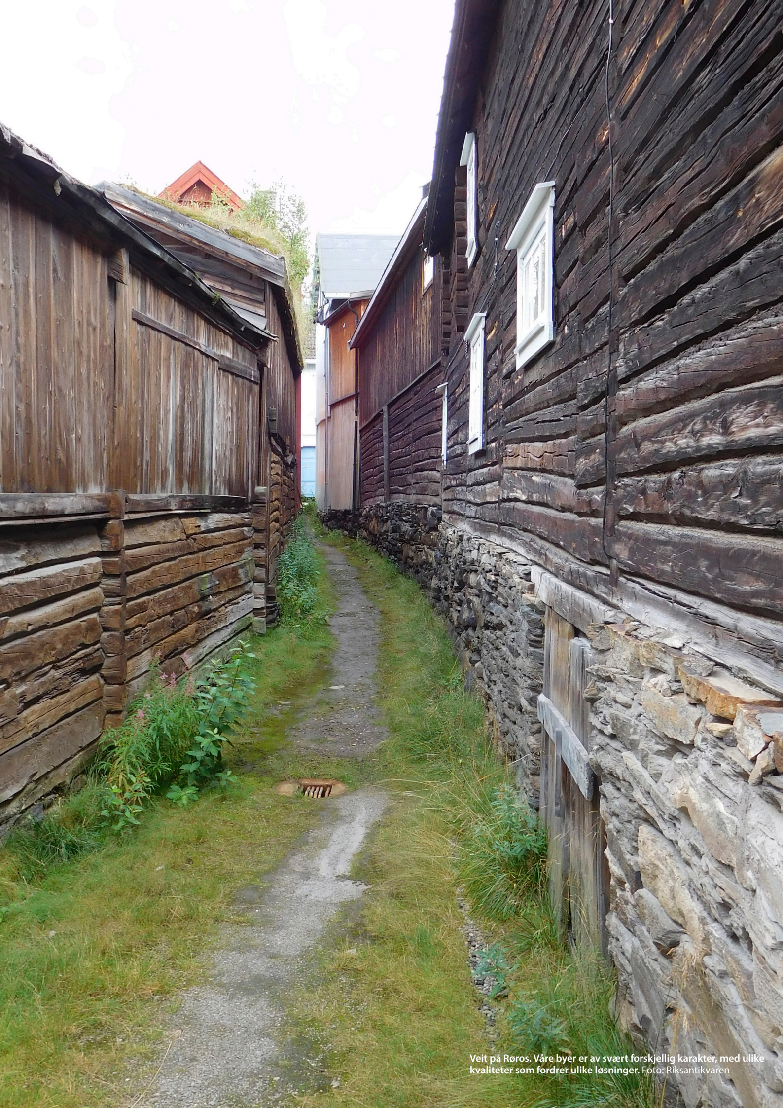
Veit på Røros. Våre byer er av svært forskjellig karakter, med ulike kvaliteter som fordrer ulike løsninger.