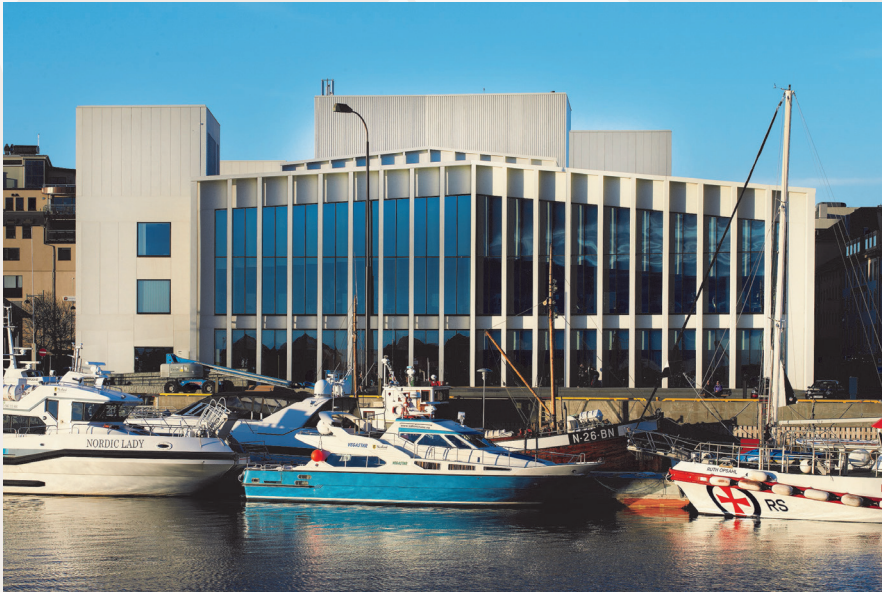
Biblioteket og konserthuset Stormen i Bodø. De to bygningene viderefører mange av de kvalitetene som kjennetegner gjenreisningsarkitekturen som ble bygget etter krigen.