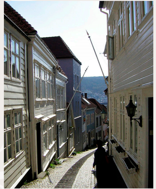
Knøsesmauet i Bergen er karakteristisk for gateløp i den historiske trehusbebyggelsen i byen. Brostein i samspill med tett småskalabebyggelse skaper både gode byrom og gode boområder.

Unesco anbefaler (HUL, 2011) at begrepet integritet benyttes i vurderinger av hvordan historiske kulturmiljøer forholder seg til endringsprosesser.