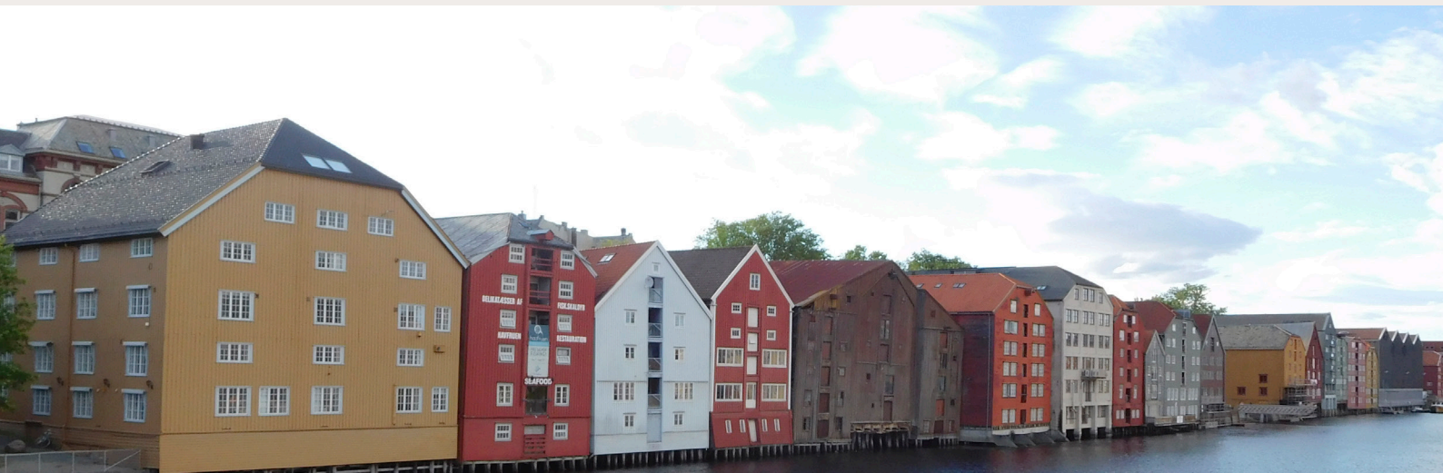
Bryggene i Trondheim. Bygningsrekken er av stor nasjonal verdi, men fremtidig bruk er utfordrende.

Kulturarv omfatter alle materielle og immaterielle uttrykk for menneskelig aktivitet gjennom tidene. De ikke-fysiske sporene finner vi i kunnskap og kunnskapsprosesser om bruk og utvikling av kulturarven. Dette knytter seg for eksempel til materialvalg, tradisjonshåndverk, bruk og vedlikehold av objekter og omgivelser, samt fortellinger som er nær forbundet med de fysiske objektene. Begrepet kulturarv rommer også prosesser knyttet til vurdering og utvalg av kulturminner, kulturmiljøer og landskap av betydning for menneskene på stedet.