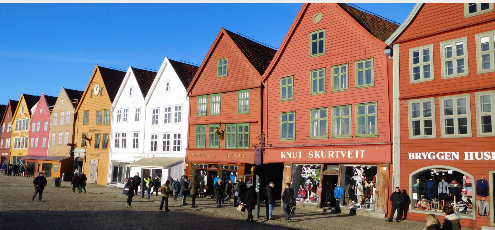
Bryggen i Bergen var foreslått revet. I dag er bygningsrekken en del av verdensarven.

Det er viktig at det offentlige kulturminnearbeidet preges av medvirkning og av åpenhet for ulike tilnæringer, perspektiver og historier. Faro-konvensjonen, landskapskonvensjonen og Unescos arbeid med historiske byer vektlegger alle en bred og åpen medvirkning, både i planlegging, verdisetting og vektning av kulturarv.