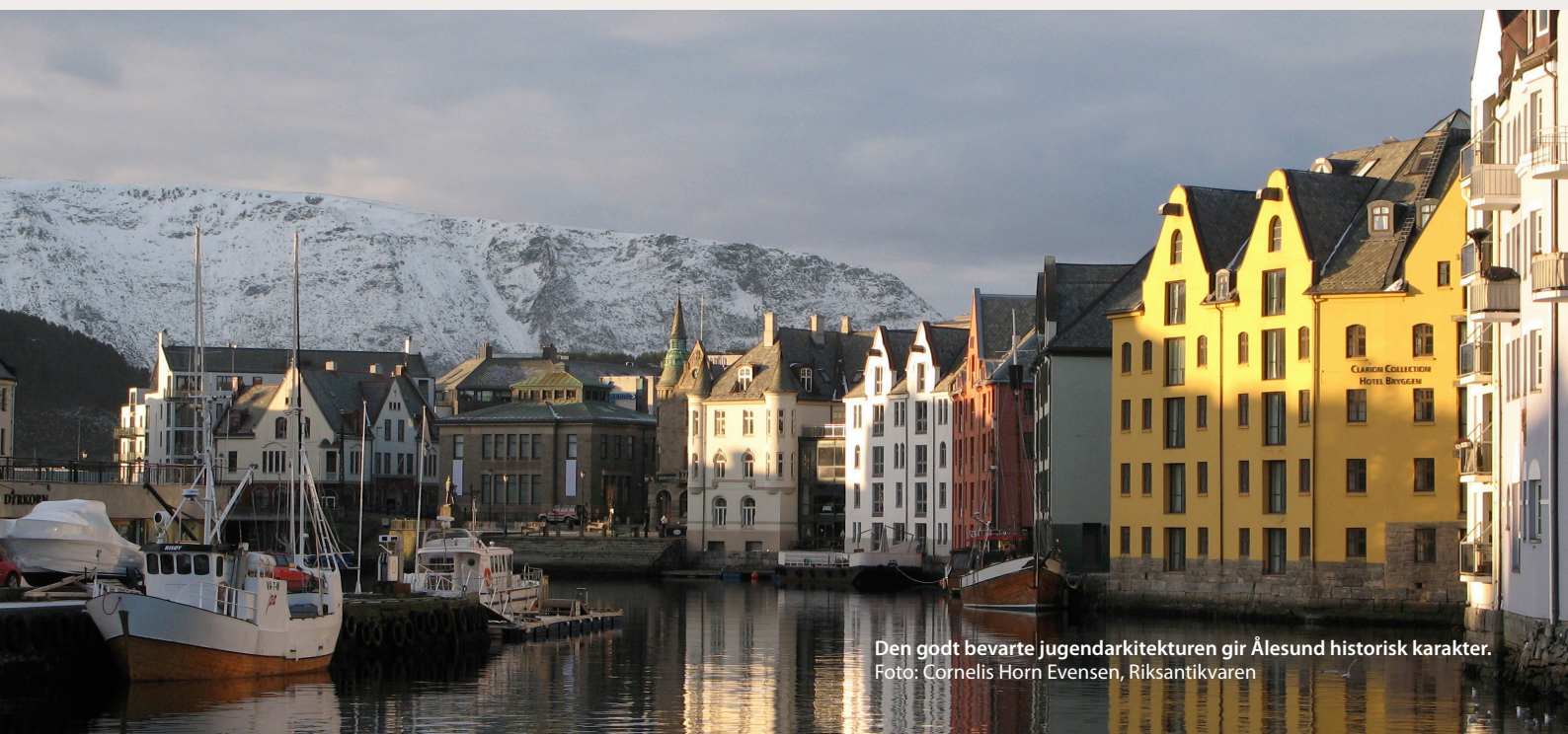
Den godt bevarte jugendarkitekturen gir Ålesund historisk karakter.