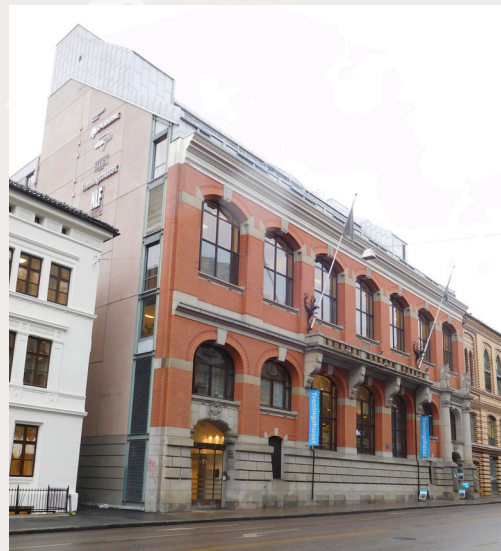
Turnhallen i Oslo er et eksempel der verneverdiene blant annet har vært knyttet til opplevelsesverdier. Etter en brann i 1988 ble det indre av bygget totalskadd, og et nytt bygg er gjenoppført bak den bevarte fasaden.

Det er viktig at forvaltningen bidrar med kunnskap om byutvikling og bevaring i åpne og konstruktive debatter, og stimulerer til engasjement i lokalsamfunnet. Omforente resultater er ikke bare avhengig av ryddighet og transparens, men også av at resultatene har legitimitet og forankring hos de involverte aktørene. Åpenhet og medvirkning handler også om at tiltak, planer og planlagte byutviklingstiltak illustreres og formidles slik at konsekvensene blir tydelige for alle.