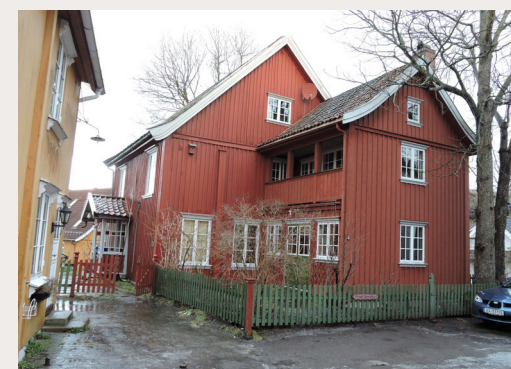
Tilbygget til denne boligen i Drøbak er et godt eksempel på videreføring av byggeskikk og materialbruk.