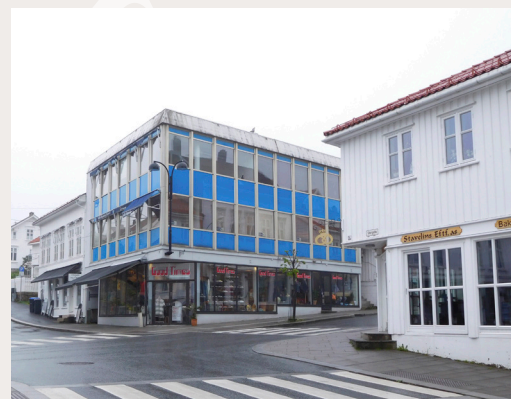
Bygg som kontrasterer med det omkringliggende bygningsmiljøet, har i ettertid ofte vist seg å fungere dårlig. Her fra Risør.