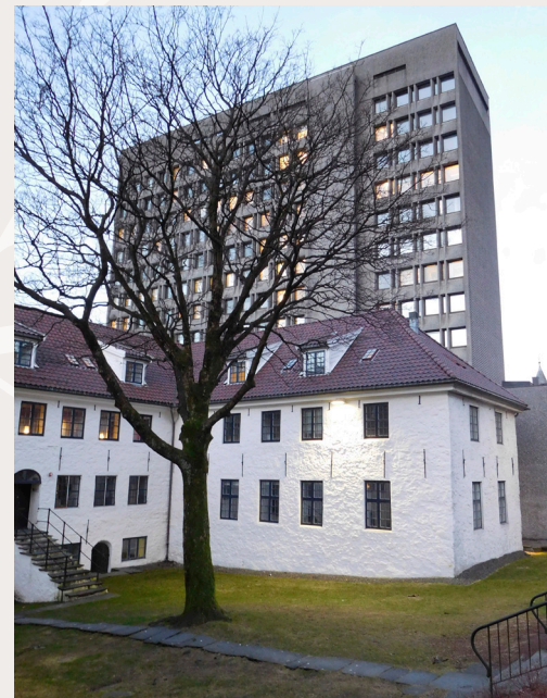
Høye bygg som bryter med omgivelsenes målestokk og dimensjoner, bidrar sjelden til å skape gode bymiljøer. Bildet viser rådhuset i Bergen.