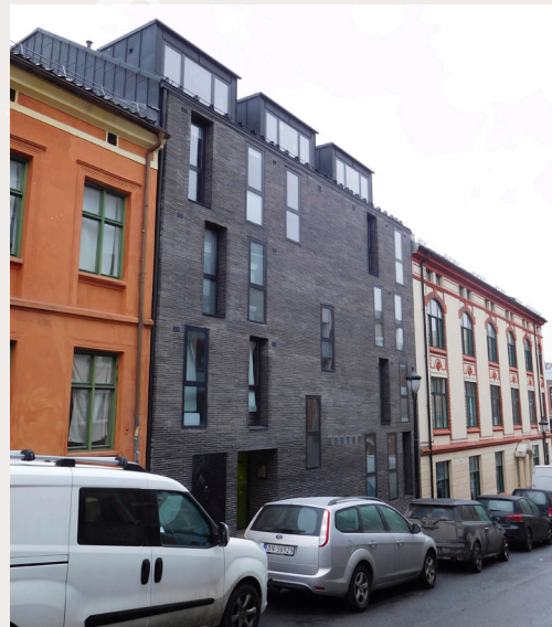
Nytt bygg på Grünerløkka i Oslo. Bygningen kontrasterer med den tilstøtende bebyggelsen, men høy kvalitet i fasadeutforming, materialvalg og et tilpasset volum gjør prosjektet akseptabelt.

Kulturminneforvaltningen skal også være løsningsorientert, ta del i arealplan- og byutviklingsarbeid, og gi råd og samarbeide med de involverte aktørene. Data om kulturarven skal være åpne og lett tilgjengelige for politikere, planleggere, utbyggere og allmennheten.