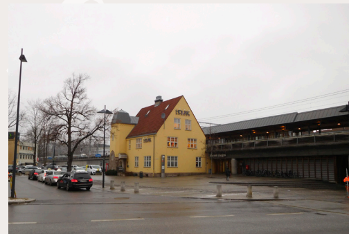
Skøyen stasjon i Oslo er en historisk viktig markør som bidrar til å definere et historisk knutepunkt.

• God håndtering av overflatevann i områder med historisk bebyggelse bør få særlig oppmerksomhet i forvaltning og utvikling av byene.