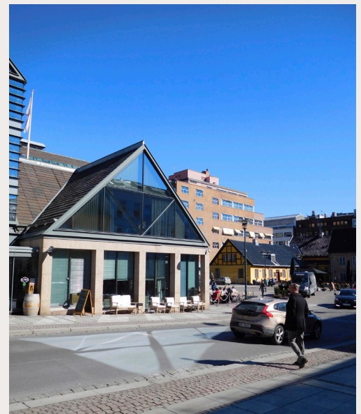
Christiania Torv i Oslo er et forbilledlig eksempel på byreparasjon og tilpasning mellom gammelt og nytt.