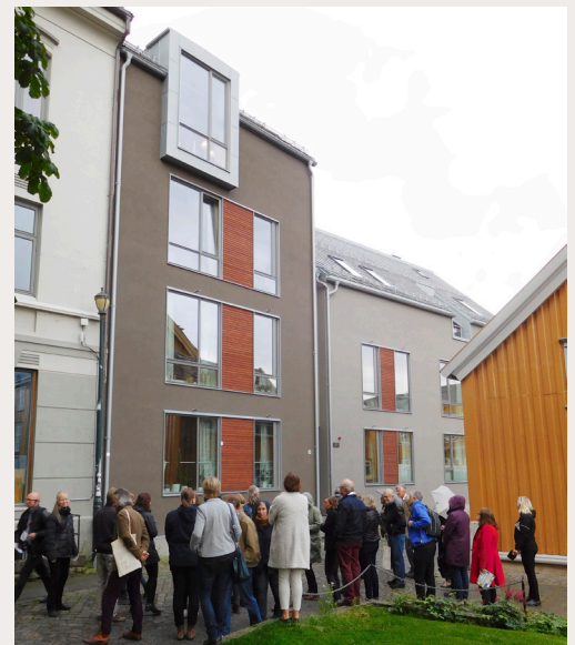
Dette nybygget i Trondheim har fått kommunens byggeskikkpris for vellykket tilpasning. Bygget tar blant annet opp dimensjonene og takformen i omkringliggende bygg.