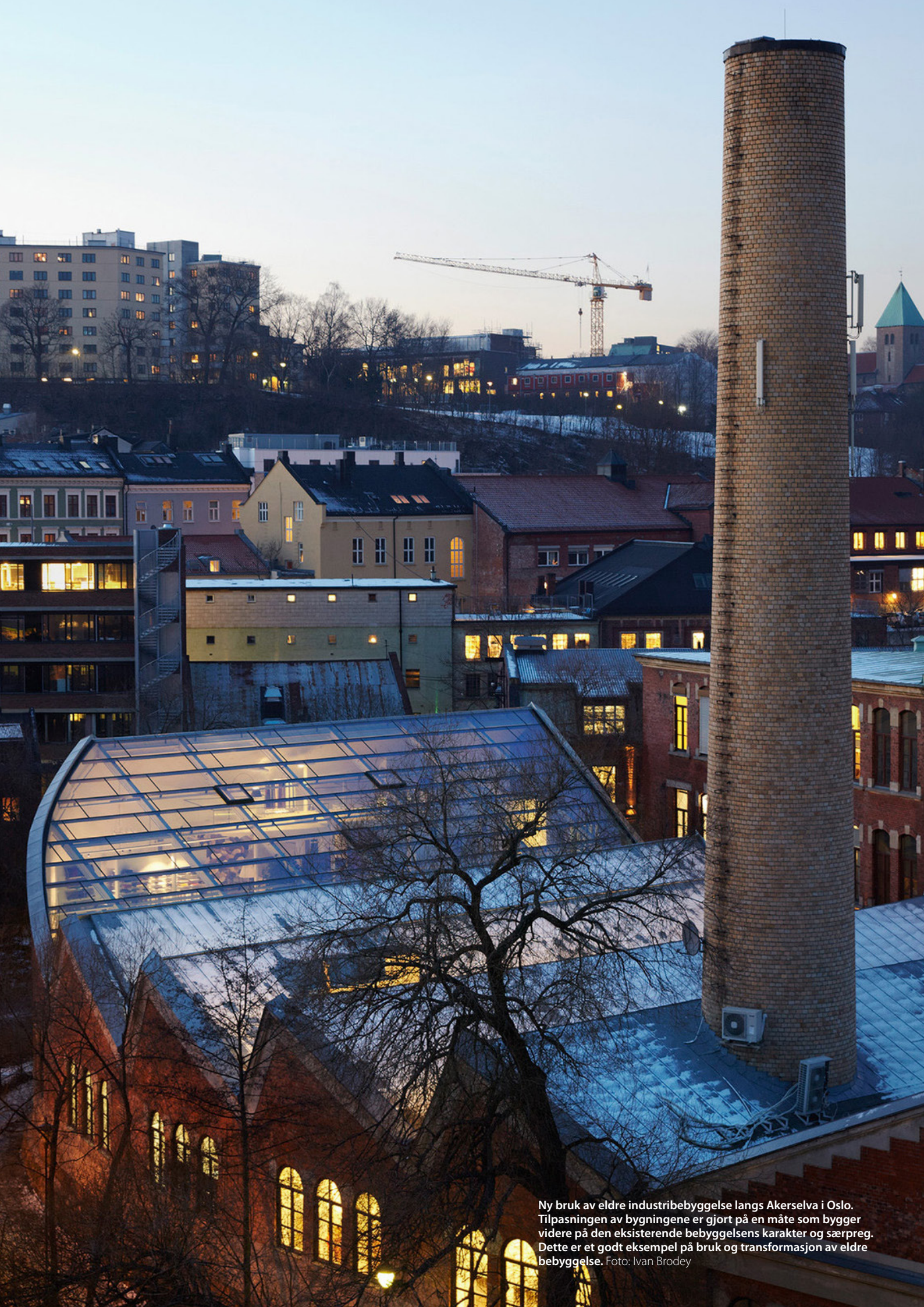
Ny bruk av eldre industribebyggelse langs Akerselva i Oslo. Tilpasningen av bygningene er gjort på en måte som bygger videre på den eksisterende bebyggelsens karakter og særpreg. Dette er et godt eksempel på bruk og transformasjon av eldre bebyggelse.