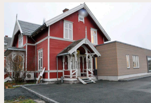
Tilbygg i Levanger som i stor grad svekker verdien av den gamle rektorboligen.