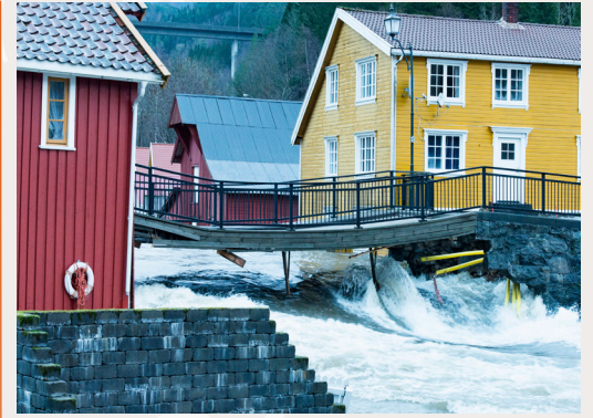
Flom på Feda. Mer nedbør gir hyppigere og kraftigere flommer som kan ramme historisk bebyggelse.

Det er viktig at kunnskap bygges og deles, ikke bare innenfor kulturminneforvaltningen, men også hos planleggere, arkitekter, utbyggere og andre aktører. Nettverk og ulike fysiske eller digitale møteplasser som tilrettelegger for kunnskapsdeling, formidling og dialog om ny kunnskap og kunnskapsbehov, er viktig.