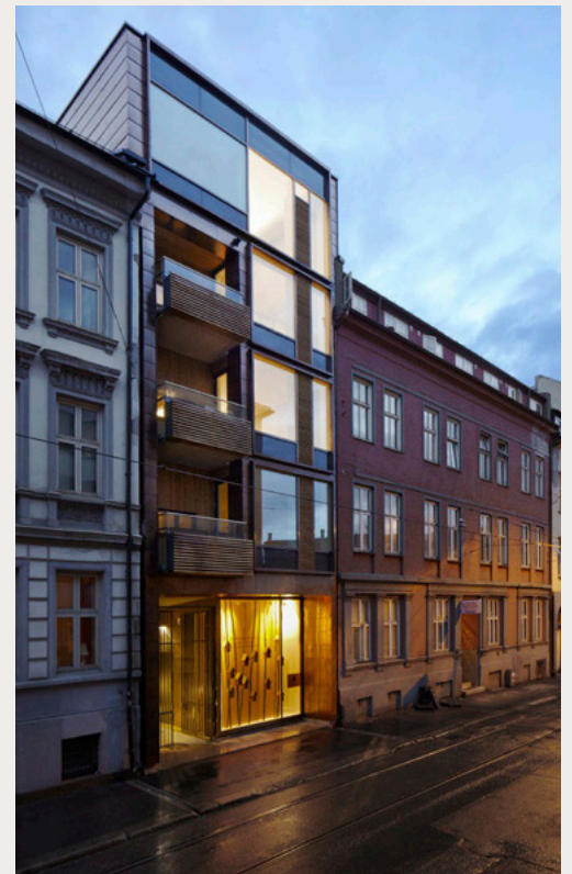
Oppføring av nye boliger på mindre, ledige tomter i eksisterende bymiljøer kan være en god fortettingsstrategi og styrke opplevelse og lesbarhet. Slike infillprosjekter er også krevende, og trenger god kvalitet og tilpasning til omkringliggende bebyggelse. I dette eksempelet er høyden utfordrende.