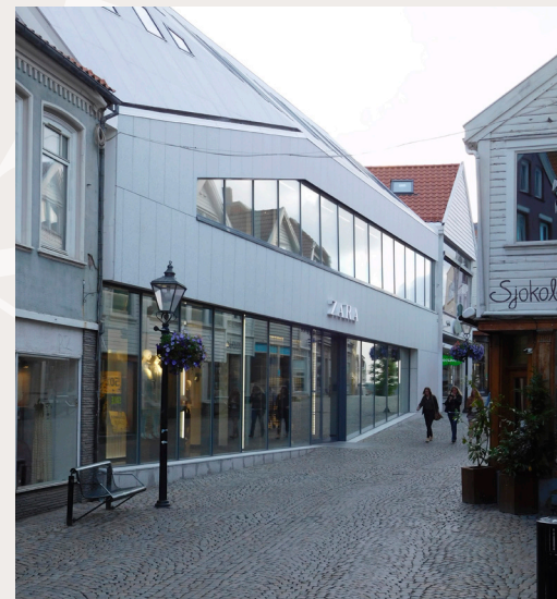
Nybygg som sterkt kontrasterer det omkringliggende miljøet i Stavanger sentrum.