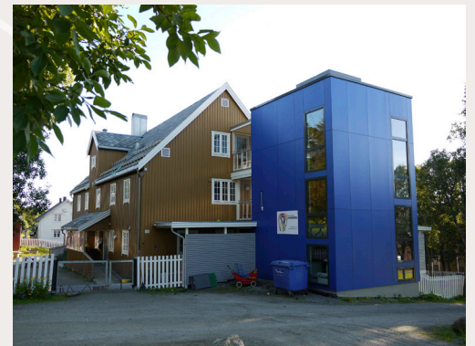
Bioforsk, Holtevegen 70, Tromsø. Statlig listeført verneklasse 2, ikke regulert til bevaring. Oppført 1928 som forsøkslåve, senere brukt som laboratoriebygning/kontorbygning/bibliotek, nå barnehage. Tilbygget er kommet etter verneplanen og utfordrer verneverdiene knyttet til den eldre bygningen.

§ 31-1. Ivaretagelse av kulturell verdi ved arbeid på eksisterende byggverk.