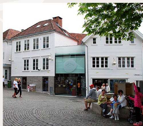
Godt Brød AS på Sølberget i Stavanger. Arkitekt Helen og Hard. Godt eksempel på infill, hvor det lille nybygget på en positiv måte kontrasterer med tilstøtende bebyggelse og i volum underordner seg dette.