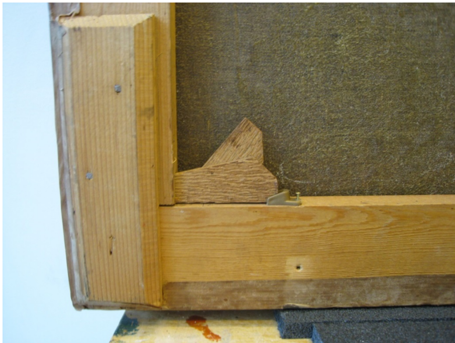
Bilde 9: Baksiden av maleriet med blindramme og kiler med kilestopper.