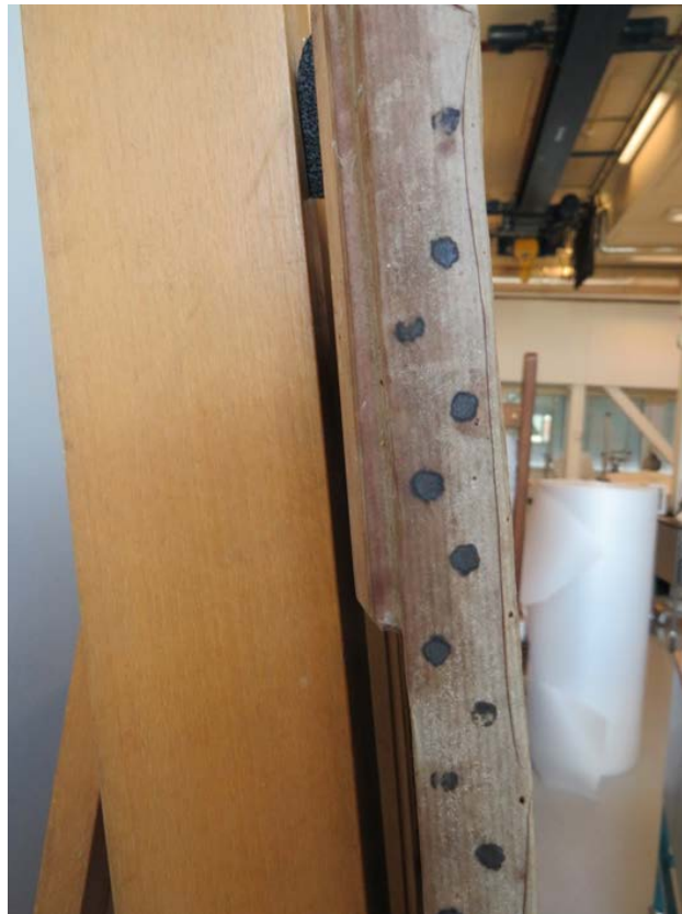
Bilde 4: To rekker med oppspenningsstifter.