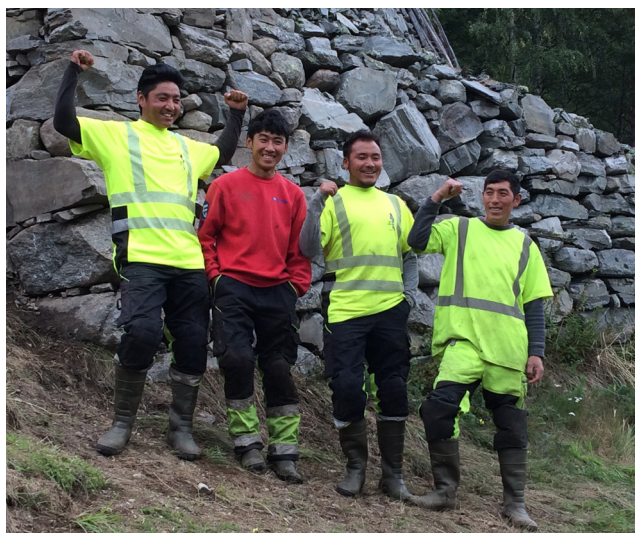
Murarane er ferdige med den vanskelegaste jobben!