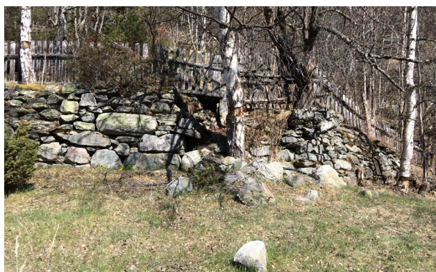
Støttemur før arbeid.