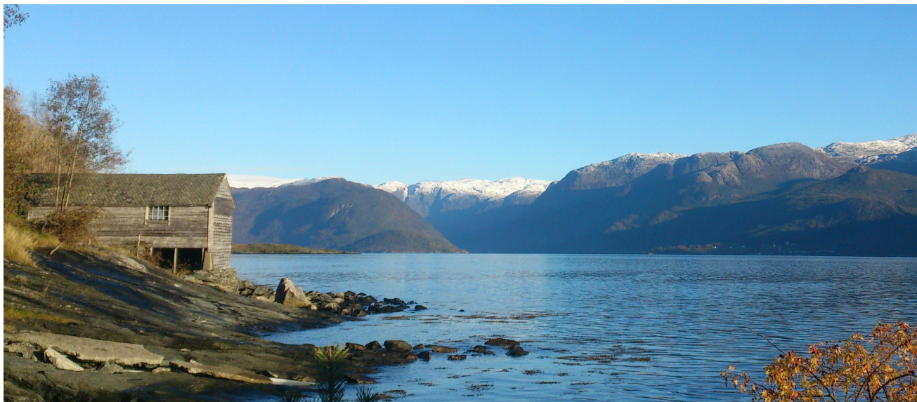
Vass-saga i inngangen til det utvalde området står for tur for vedlikehald. Midlar er sikra for å vøle grunnmuren som det byrjar å haste med vert sett i stand.