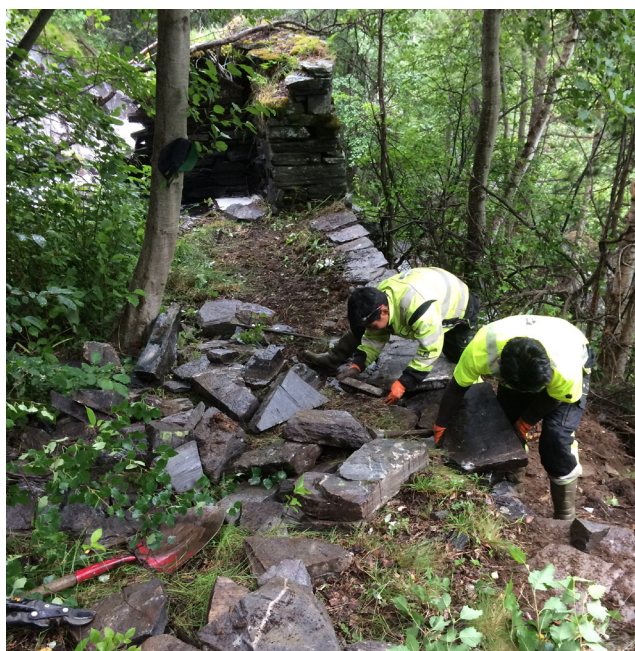
Gammal sti mot Dipra under arbeid.