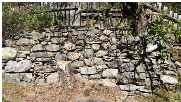
Støttemur etter arbeid.