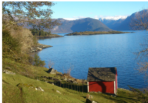
Dei små utløene i området er no alle sett i stand, og er her nærmast ikonisk i haustsola med Hardangerfjorden og Folgefonna i bakgrunnen.