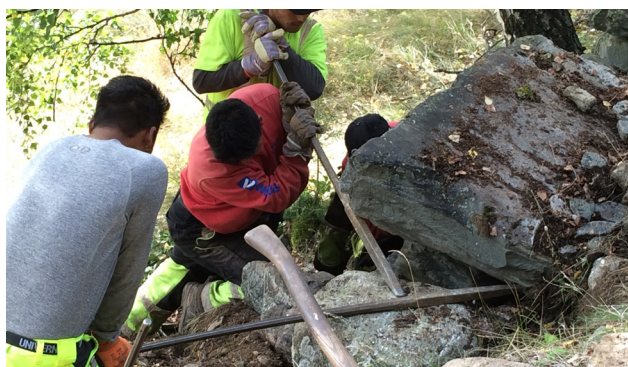
Støttemur under arbeid.