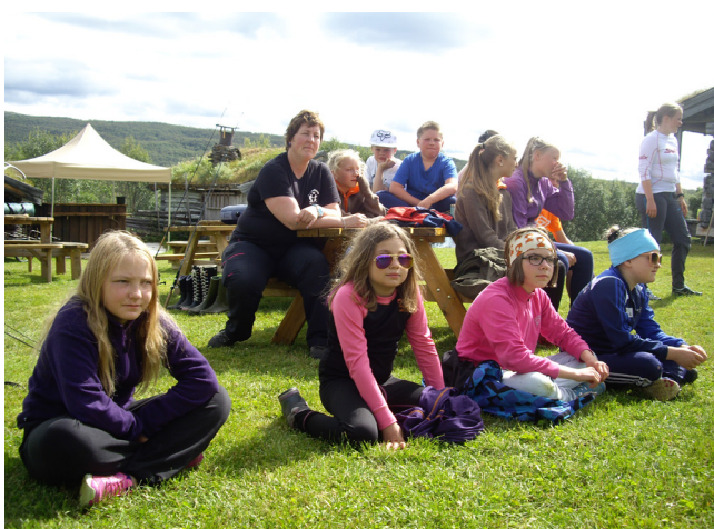
Interesserte hesje-studenter.