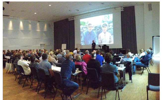
Dag to - samlet til erfaringsutveksling og diskusjoner.

Landbruksdirektoratet, Miljødirektoratet og Riksantikvaren arrangerte samlingen i tett samarbeid med Fylkesmannen i Oslo og Akershus og Nannestad kommune. Takk til alle som bidro til en fantastisk fin samling!