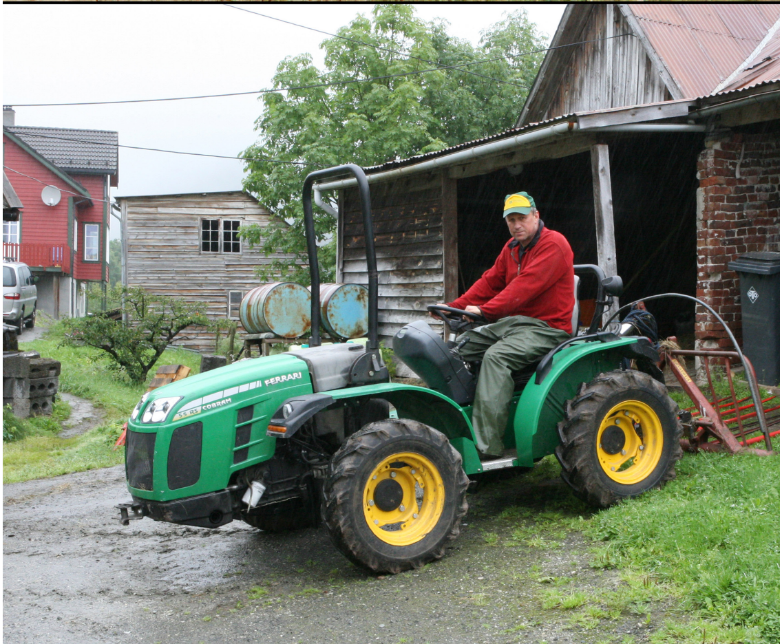
Skiftende tider - skiftende traktor. Grinde i Leikanger, Sogn og Fjordane.