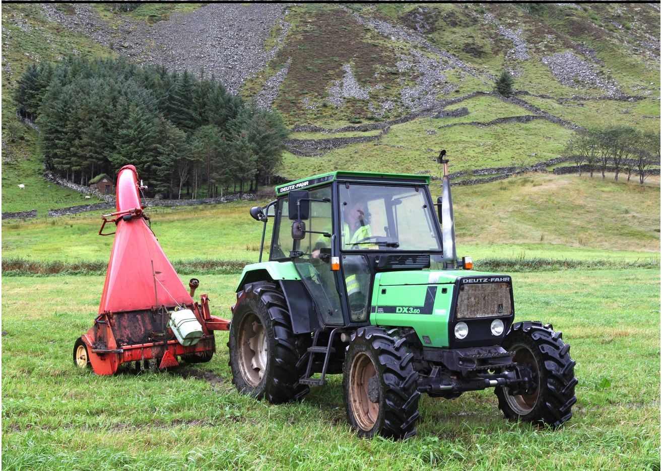
Redskapsskifte i samme landskap. Hoddevik-Liset, Selje i Sogn og Fjordane.