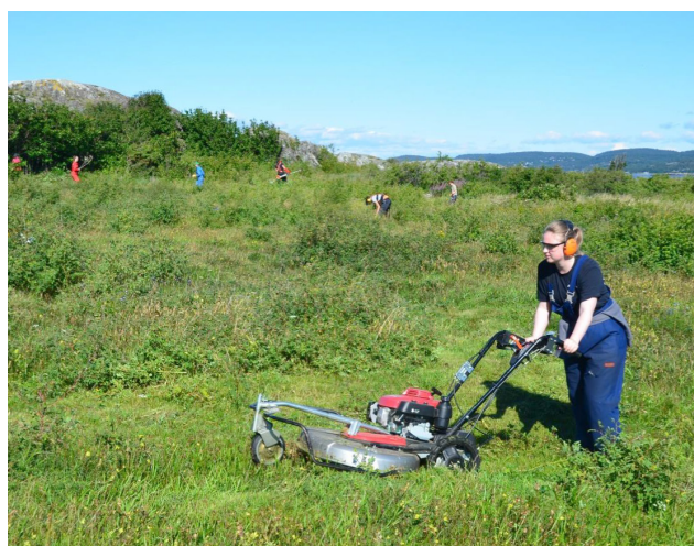
Ungdomsgruppa i aksjon.