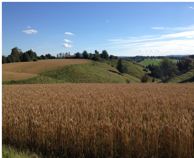
Planerte arealer side om side med ravinene.