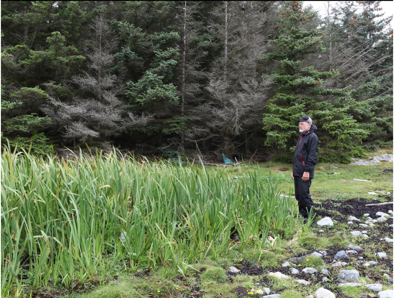
I 1969 ser vi små sitkagranplanter bak sverdliljene. I dag har granfeltet vokst seg stort og dominerer fullstendig. Meithaugan på Tarva, Bjugn i Sør-Trøndelag.