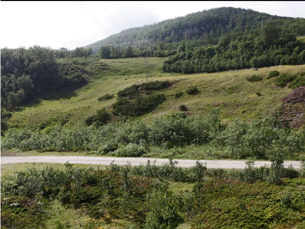
Gårdemielli i Goarahat og Sandvikshalvøya, Porsanger, Finnmark. Det øverste bilde viser hvordan landskapet så ut før området fikk status som utvalgt kulturlandskap. Mindre beitedyr hadde ført til at vegetasjonen hadde tatt helt overhånd og skapte dårlig beite for sauene. Ildsjeler i området fikk tilskudd til å rydde hellinga i 2014/15 og har ført landskapet tilbake slik det var fram til ca 1990. Det er nå utmerket beitemark. Gårdemielli betyr bakke hvor det er innhegning.