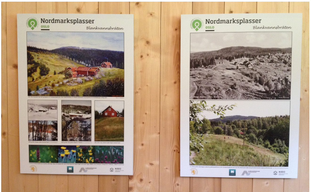
Utstilling med Oskar Puschmanns refotograferinger fra markaplassene på utstillingslåven på Svartorseter.