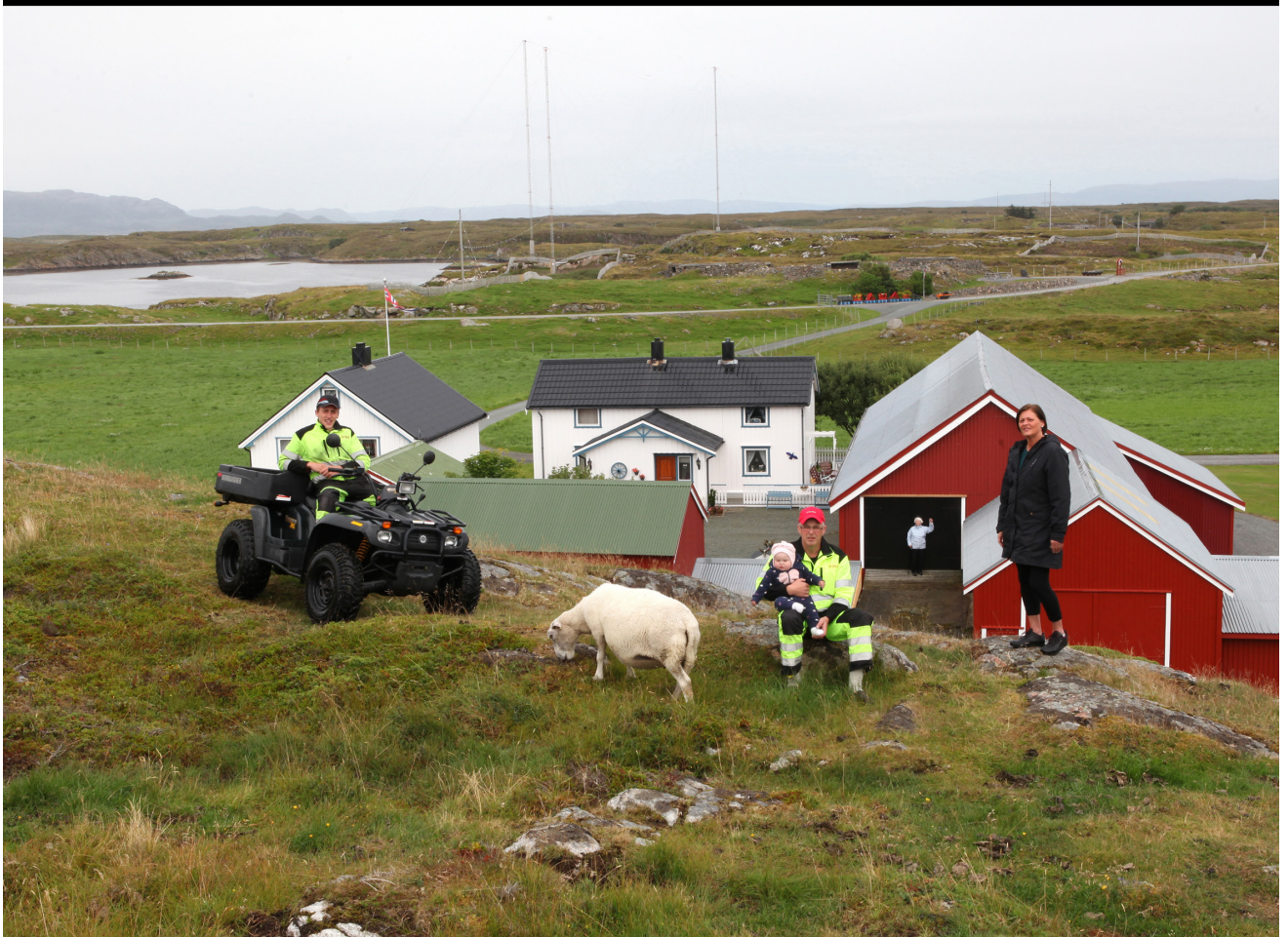
Bildeparet fra gården Valøy på Tarva viser kontinuitet i drift gjennom nesten hundre år.