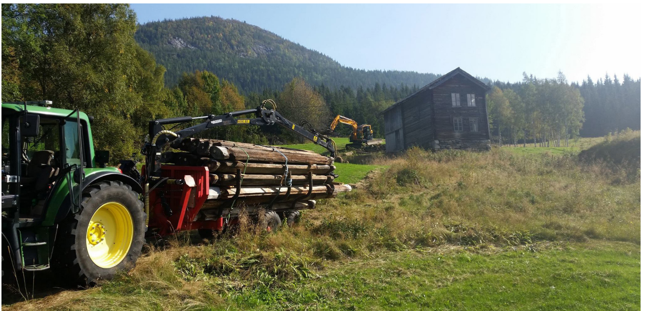
Loftet demonteres og fraktes til Setesdalsmuseet.