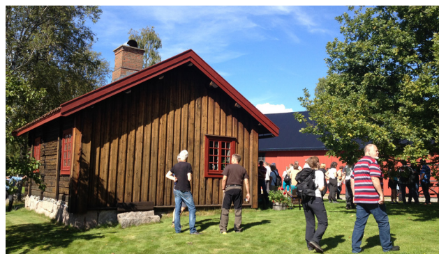
Bakstehuset på Nordre Eik.