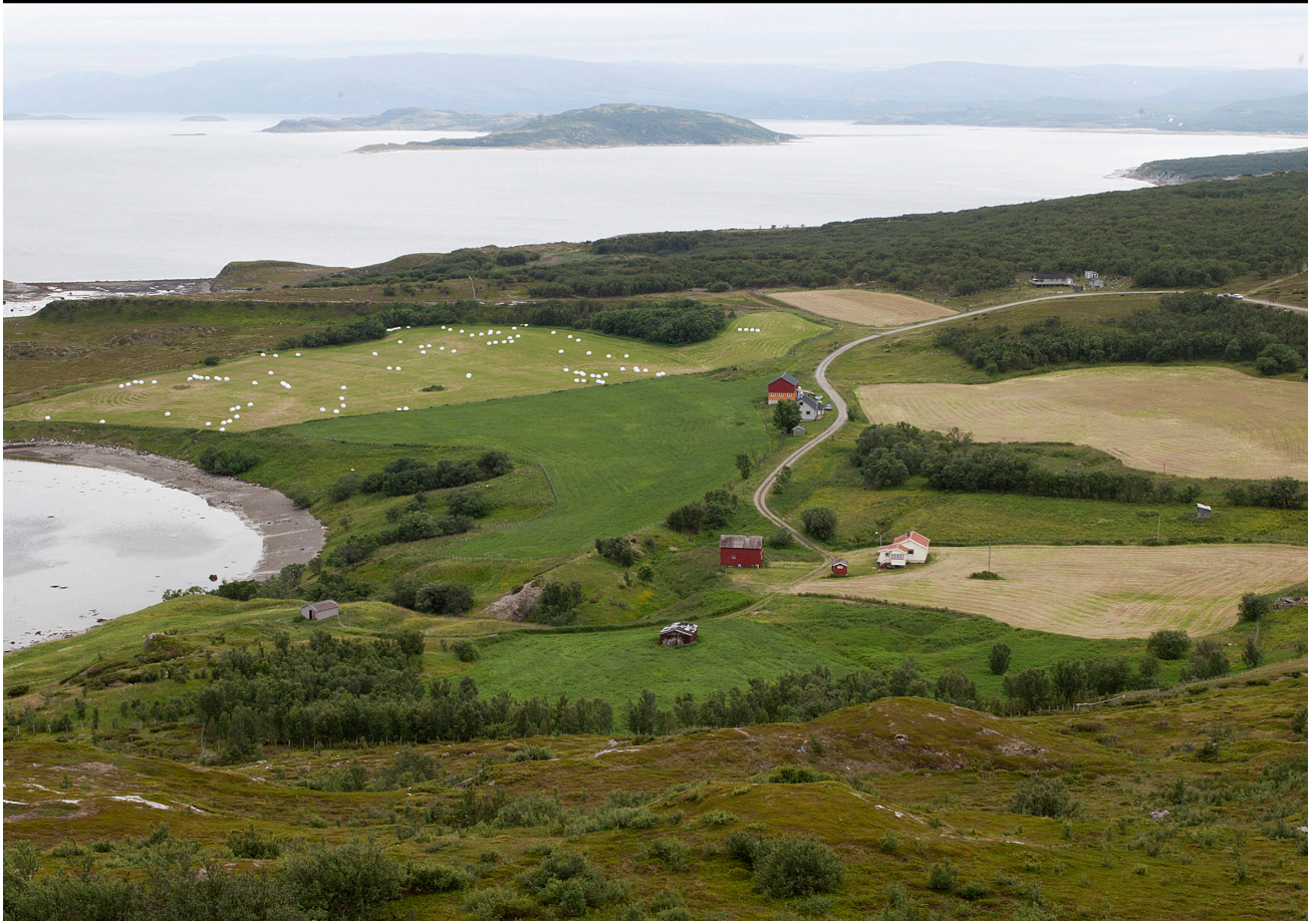
Anopset, Porsanger i Finnmark. Et helhetlig kulturlandskap, som takket være aktive bønder i stor grad er intakt. Så liten forskjell på tre og et halvt tiår er kanskje sjelden i denne type landskap i Norge i dag?