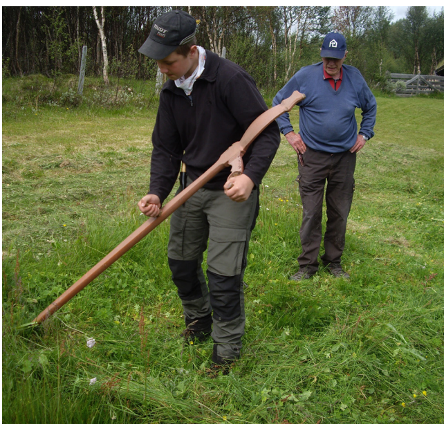
Læremester og -svenn.