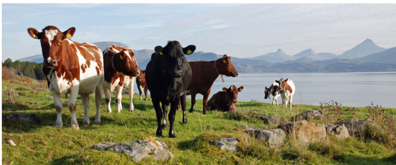
Kviger på beite på Leka.