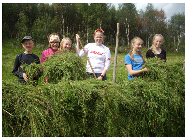
Snart i mål!