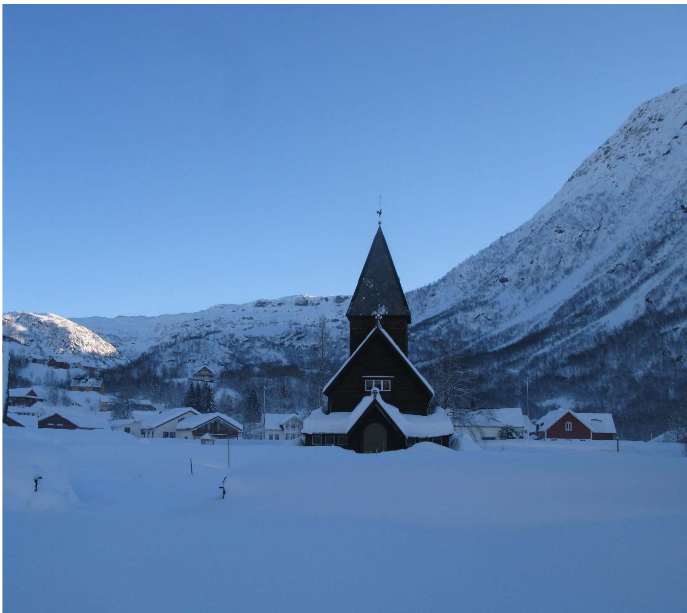
Vinter: Kyrkja slik ein møter ho vintertid.