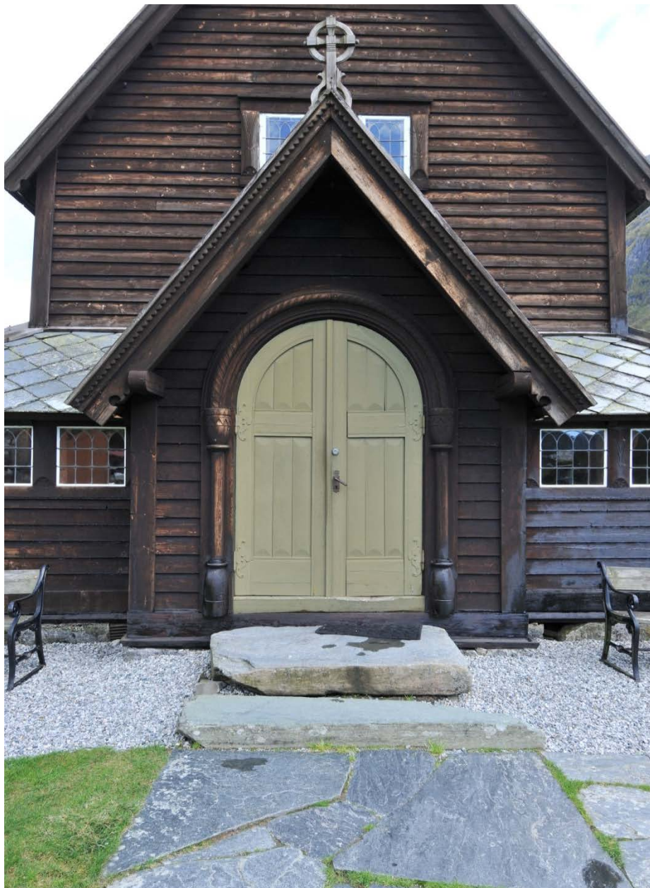
Inngangspartiet: Kyrkja slik ein møter ho ved hovudinngangen i vest.

Det var naudsynt med visse utbetringar i taket på kyrkja. Ein del møne- og vassbord var i dårleg stand og vart difor skifta ut med nye med tilsvarande dimensjon. Det vart nytta tettvokse malma furu til virke. I utgangspunktet vart det nytta spikar til dette arbeidet, men ved visse høve, der det er fare for å påføre skadar på grunn av vibrasjonar, vart det nytta skruar. Nytt materiale vart behandla med tjære. Under dei fleste møneborda ligg det sinkbeslag. I samband med