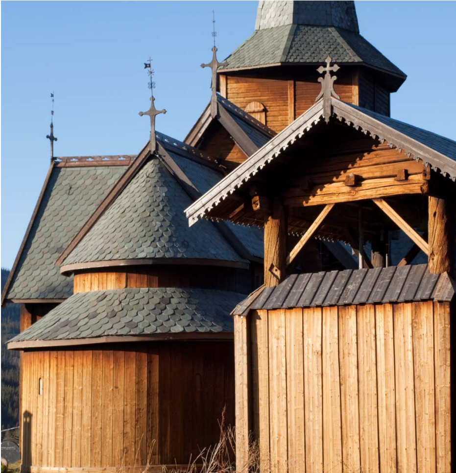
Støpulen ved kyrkja: Vart sett i stand gjennom stavkyrkjeprogrammet.