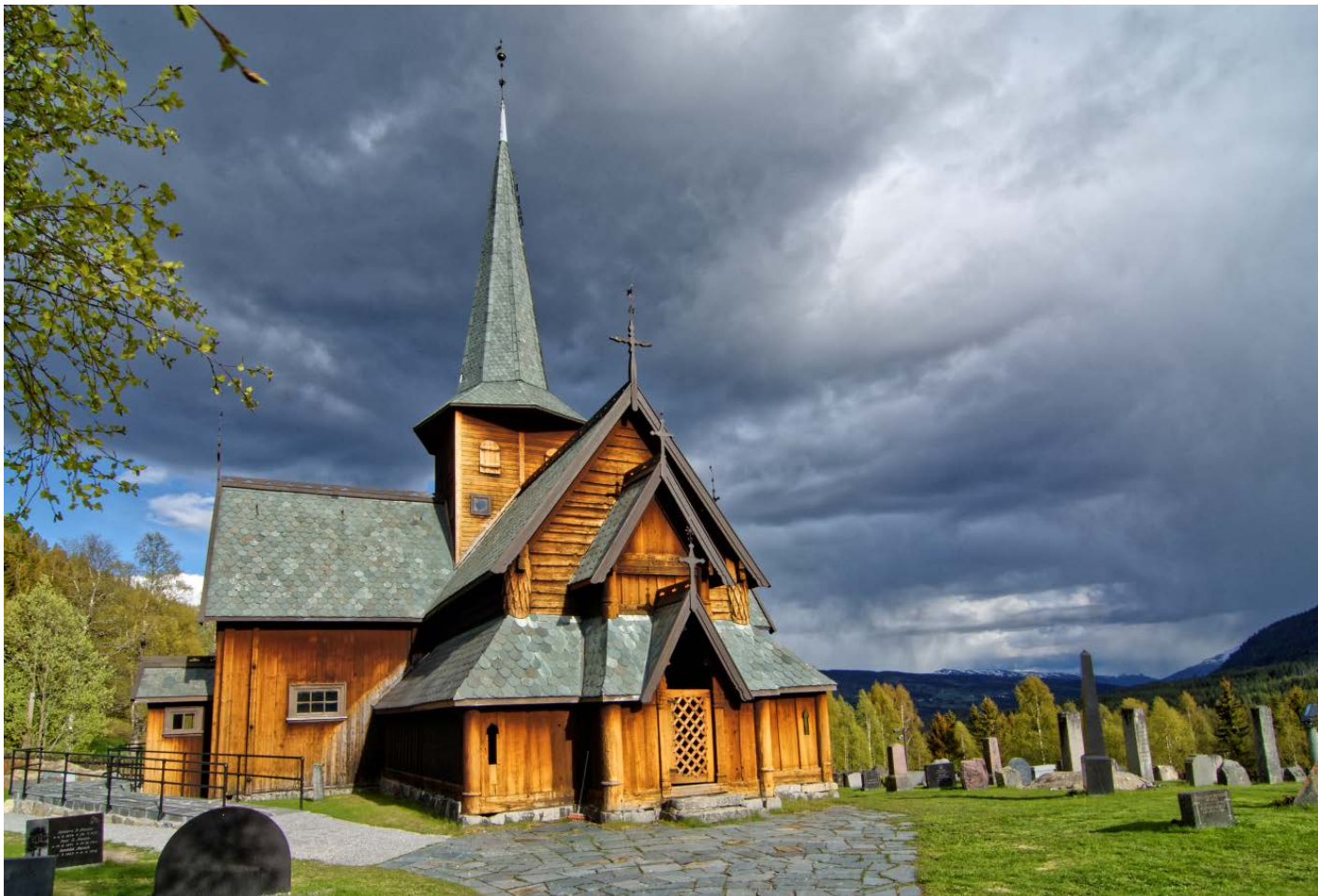
Kyrkja etter istandsetting: Sett frå vest.