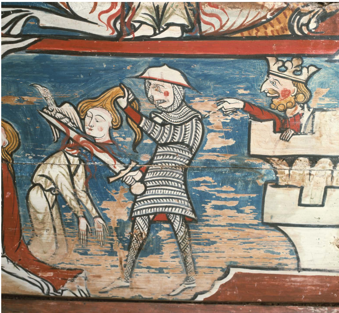
Limfargedekor: Lektoriehimlinga i kyrkja.

Berre benkane frå mellomalderen langsmed ytterveggane til omgangen er bevara. I austveggen står framleis den stengde opninga til koret som vart rive overdekkja med ein boge i heile breidda til skipet. I hjørnestavane er det innhogg som må vere restar av sidealter frå tida før koret vart utvida.