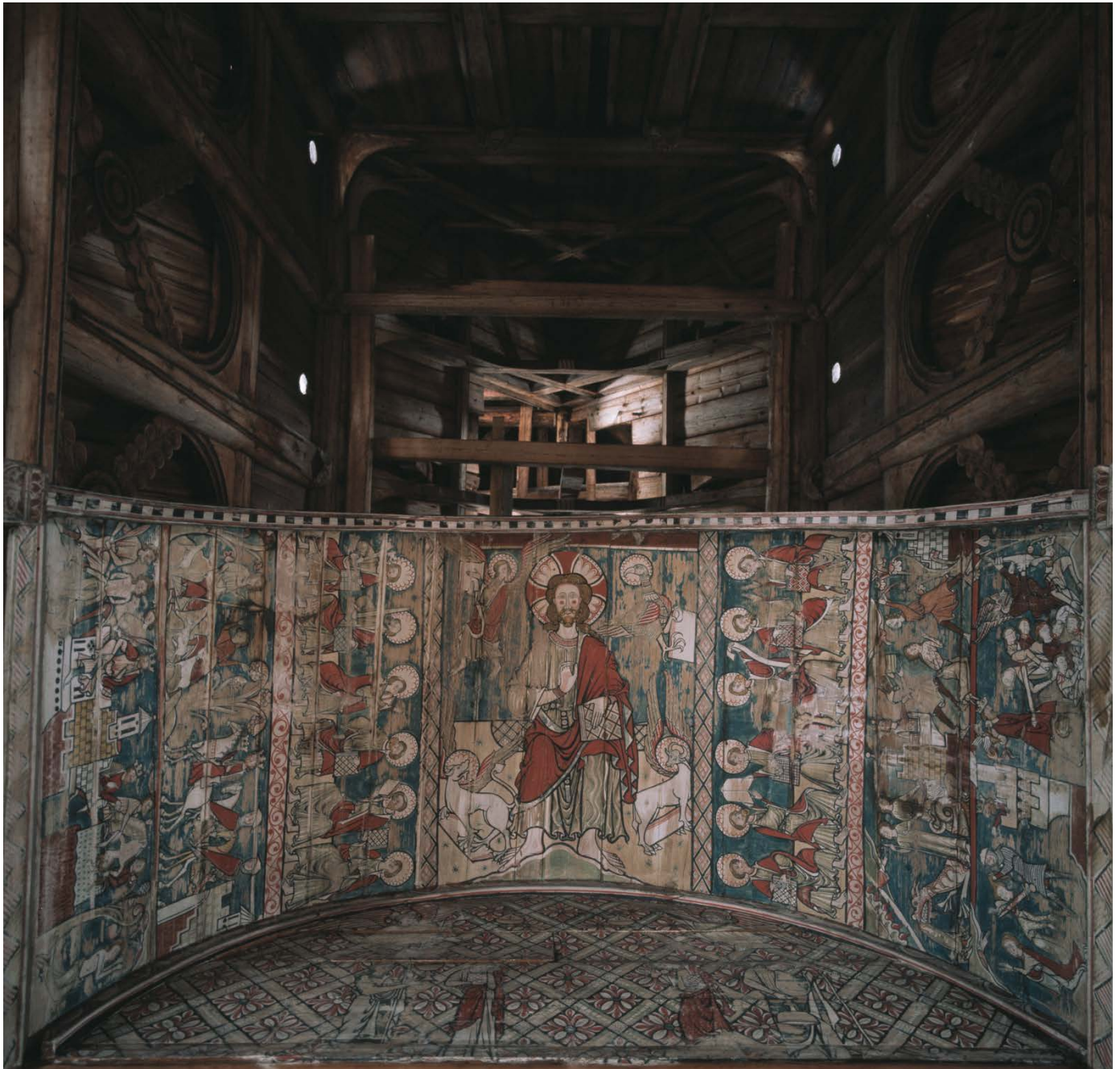
Kvelv: Limfargedekoren i lektoriehimlinga.