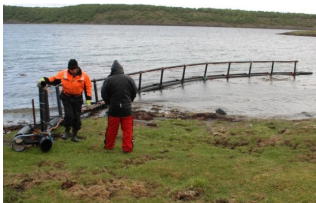
Gjerde laga av utrangert oppdrettsmerdar fungerer bra for å hindre at dyra går forbi i fjøra.

Lekaværingane vart godt mottatt av Utvalde-gjengen på Alstadhaug, med god omvising i området og mange gode innspel. Serveringa var avbesteklasse og det var triveleg og nyttig å treffe bønder i eit anna utvald område. Lekaværingane inviterte vertskapet på gjenvissitt, kanskje blir det aktuelt neste sommar?