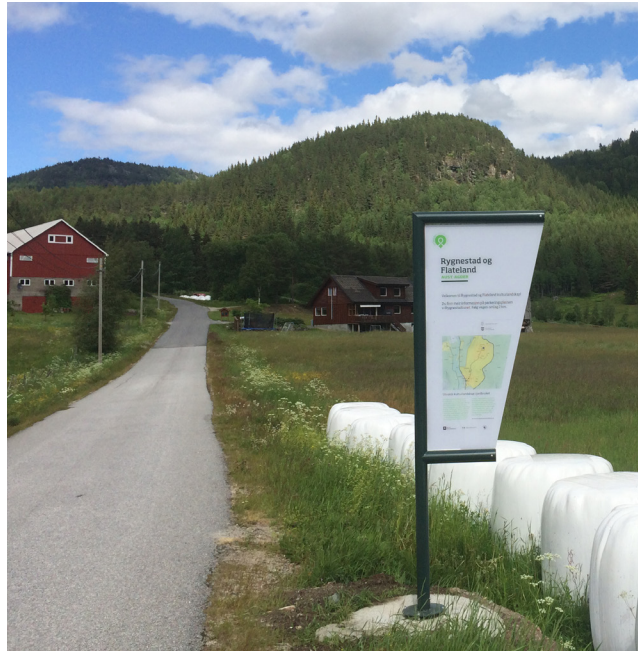
Nytt skilt i 2016.