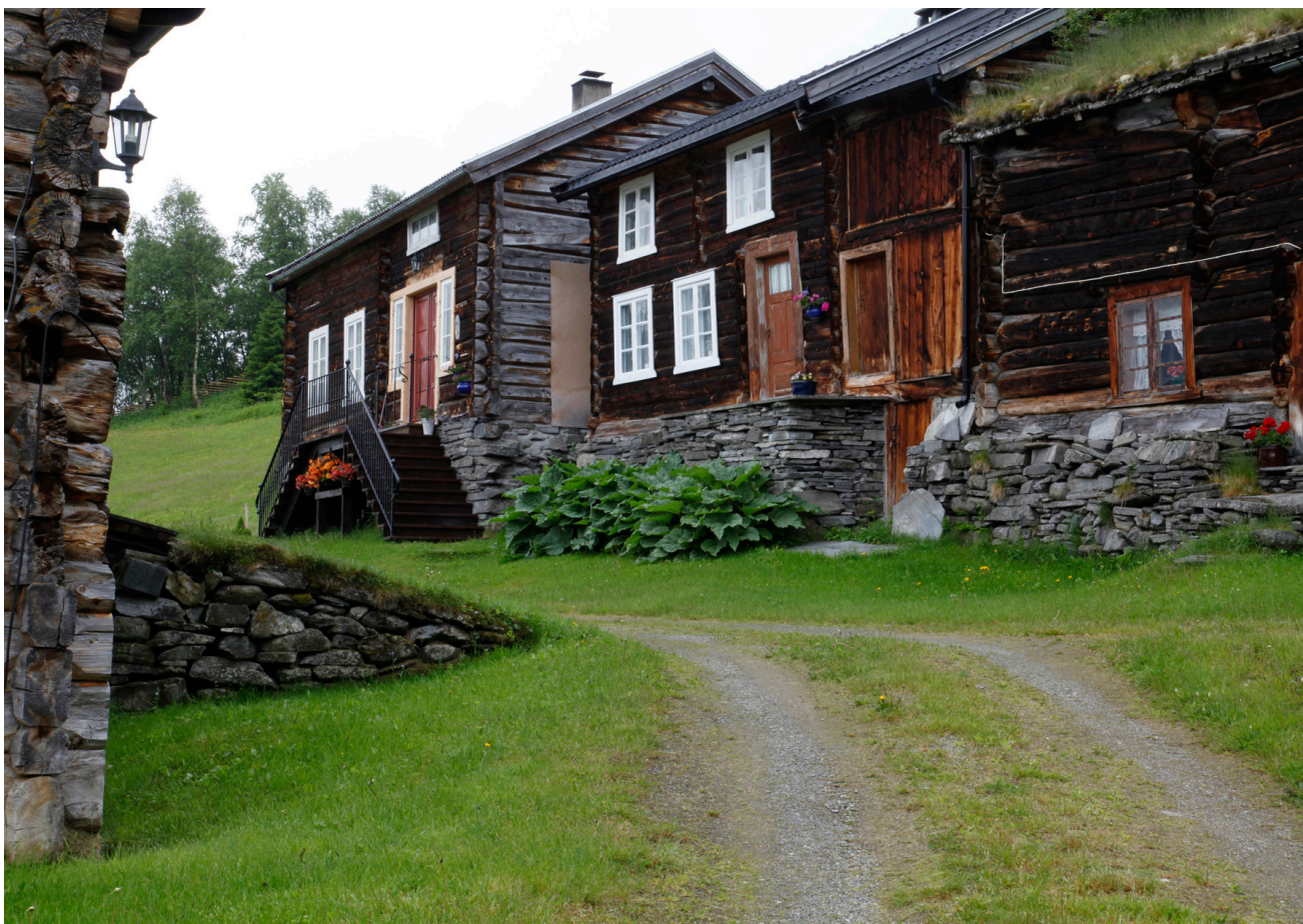
Et av de verdifulle gårdstuna i Øvre Sunndal, Østistu Havsås.

Forvaltningen av Utvalgte kulturlandskap er basert på frivillighet, lokal deltagelse, tverrfaglig samarbeid og helhetlig tankegang, og skiller seg fra konvensjonelt vern. Det er gulroten som er styrende, ikke piskene. Og nettopp dette er det jeg anser som den viktigste årsaken til de positive konsekvensene som deltagelse i satsingen har fått for bygningsvernet.