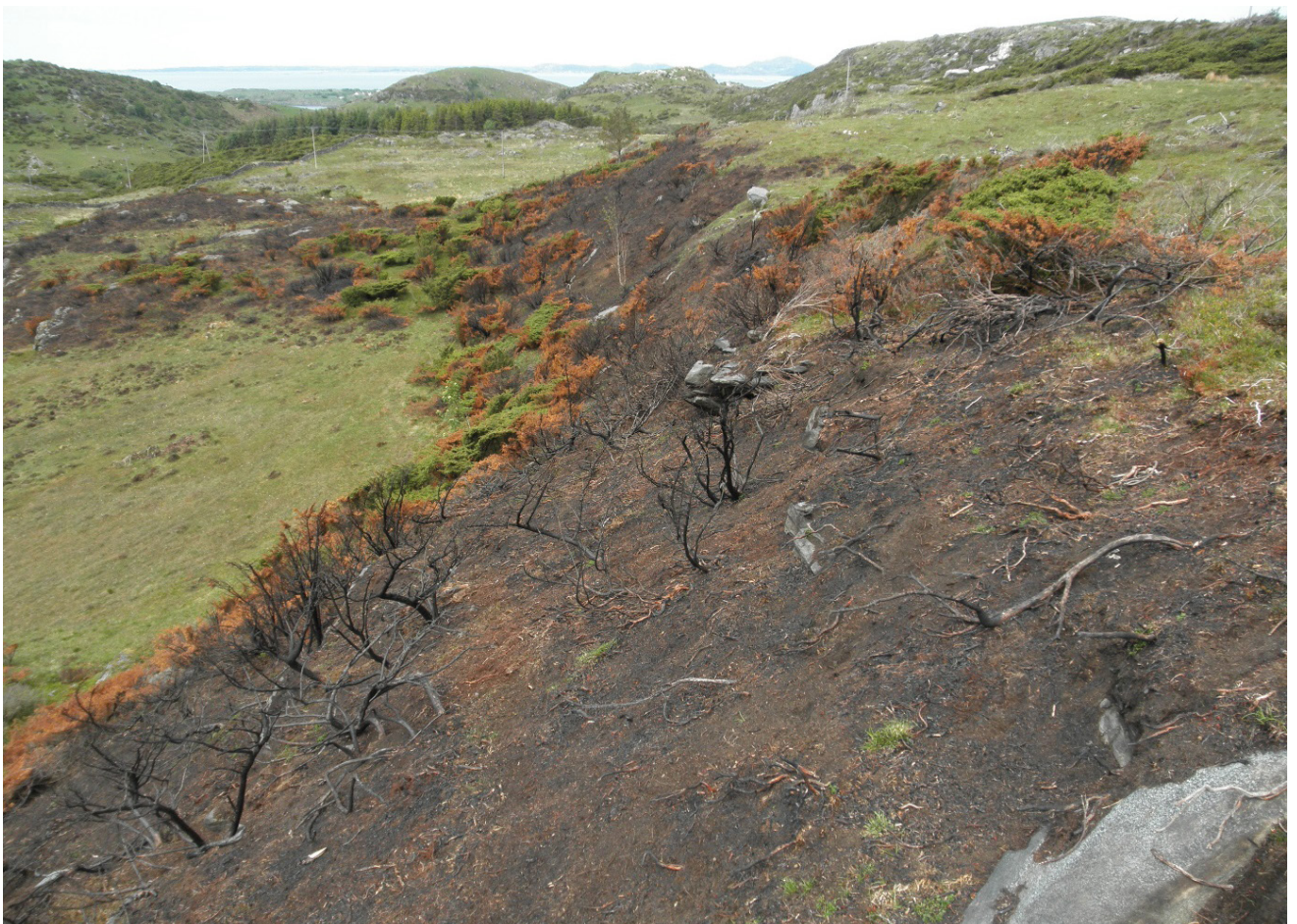
Det står att nokre einerbusker, men me fekk brent all lyngen.