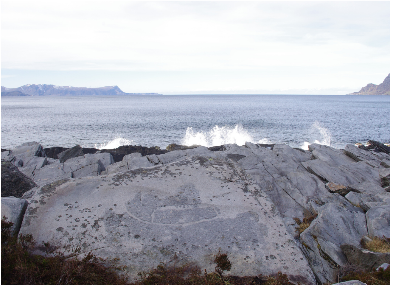
Båtfiguren liknar mykje på Hjortspringbåten frå Danmark, frå tidleg eldre jernalder. Ristinga ligg beint mot storhavet. Stadlandet til høgre.