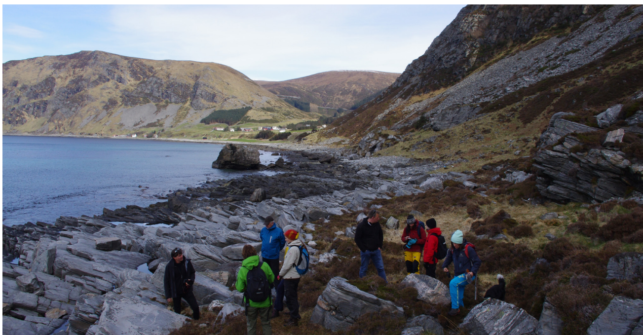
Den nyoppdaga helleristninga ligg på ei steinblokk i strandsona. I bakgrunnen ligg jordbruksgrenda Drage på Stadlandet. Her frå felles synfaring i april.

Båtfiguren er endå eit arkeologisk funn som gjev eit lite innblikk i førestillingsverd og levemåte for fleire tusen år sidan. Det berikar dette utvalde kulturlandskapet på Stadlandet.