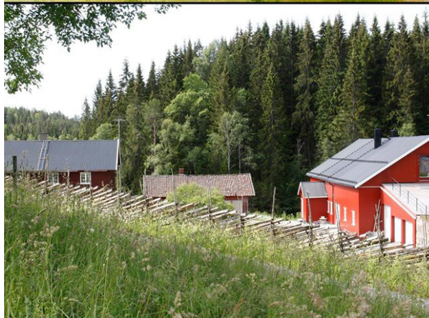
Svartorseter med låven der utstillingen vises.