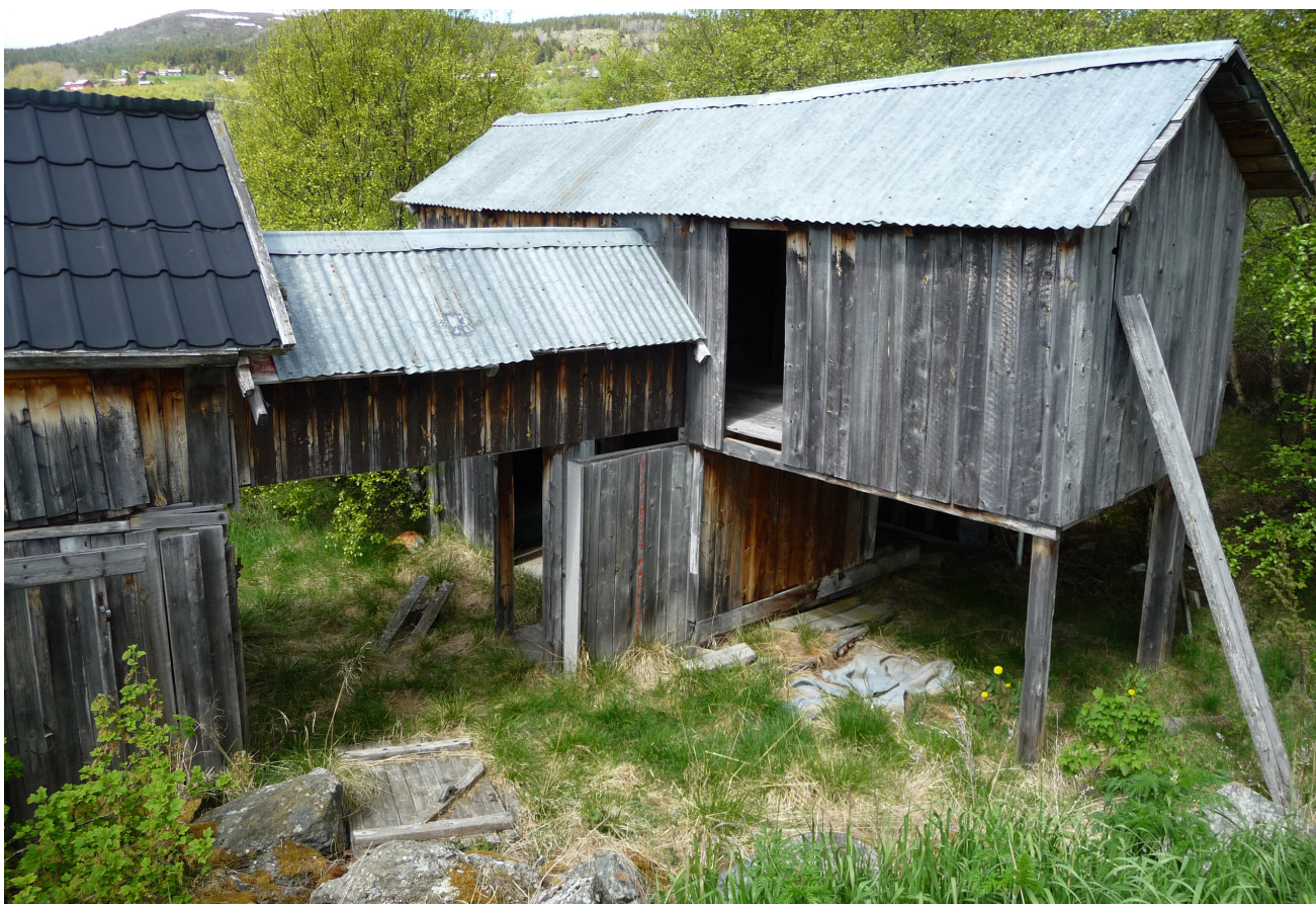
Også bygninger fra etterkrigstida kan fortelle ei historie.

På de ca. 25 landbrukseiendommene som faktisk har SEFRAK-bygninger er det også aktuelt å registrere bygninger nyere enn 1900 med verneverdi. Flere av eiendommene har dessuten hus eldre enn 1900 som ikke er registrert i SEFRAK. Det anslås at det totalt er aktuelt å registrere/vurdere for verneverdi om lag 80 bygninger, fordelt på ca. 35 gardstun. I tillegg er det sannsynligvis enkelte mindre bygninger på boligeiendommer, setrer, allmenningsgrunn etc. som bør registreres.