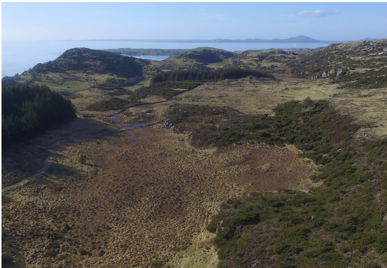
Oversikt bilde av Asmarvik-Bø-Risa-heia før brenning (drone).