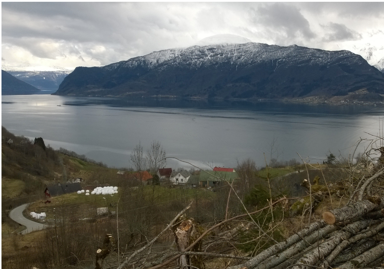
Endeleg utsikt til tunet og fjorden igjen!

Alle som besøker Grinde- Engjasete kan no glede seg over eit meir lesbart og oversiktleg landskap der dei kulturhistoriske elementa trer tydeleg fram. Eigarane har no planar om å følgje opp restaureringa med årvisst skjøtsel og vidareutvikling av formidling av kulturlandskapet.