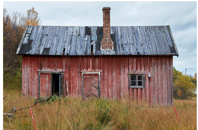
Slik ser fjøset ut i dag. Det vil bli satt i stand på museet.