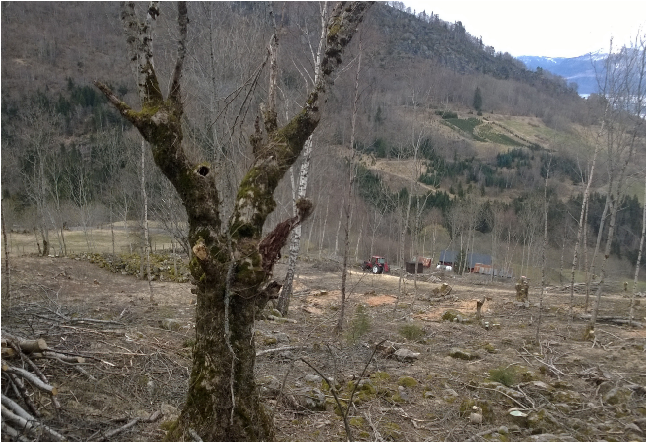
Frå ryddinga våren 2016. Kulturelementa kjem igjen fram i lyset. Her er styvingstre, rydningsrøyser, murar og gamle vegfar rydda fram.