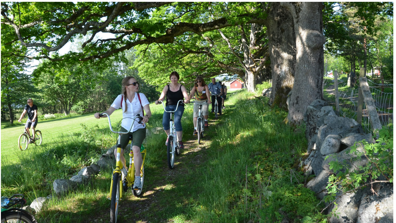
Sykkelturen gikk gjennom vakre landskap med mange kulturminner.