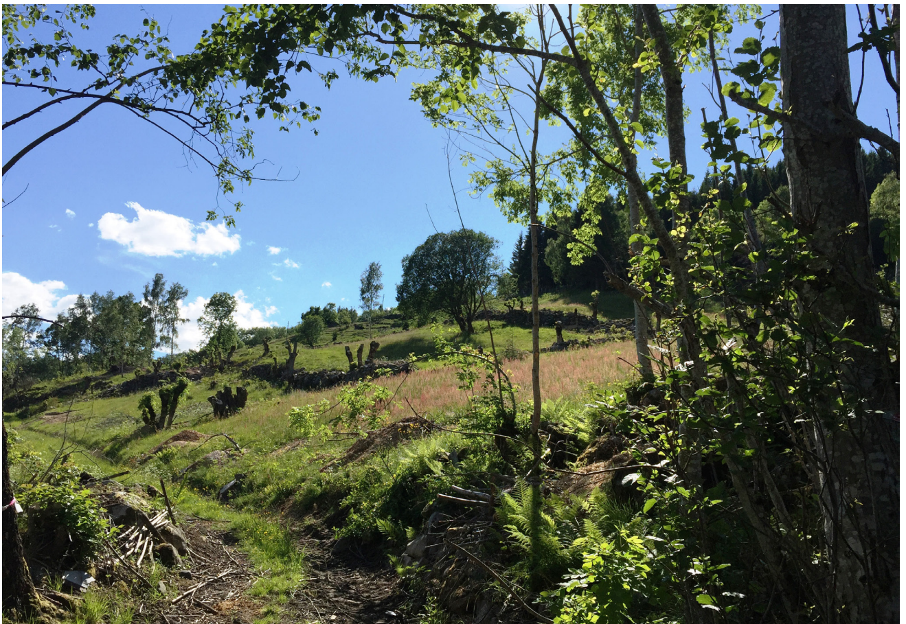
Delar av det restaurerte området slik det framstår sommaren 2016.