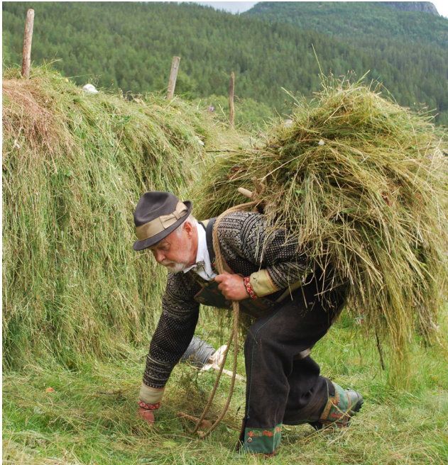
Frå slåttedagen i 2010.

Vi har skilta området med dei nye skilta i profilhandboka. Eit ved innkøyring i området frå rv. 9 og eit på parkeringsplassen ved Rygnestadtunet.