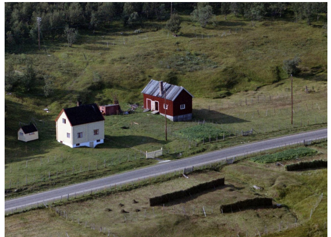
Slik så det ut i 1963: Fjøset på bruket Indre Billefjord skal flyttes til Norsk Folkemuseum.

Vi ønsker å ta vare på gamle bygninger i området, og ga i 2015 tilskudd til å sette i stand en garasje bygd av planker fra den tyske flyplassen som lå i Lakselv under krigen. Vi vil støtte flere tiltak som bidrar til å ta vare på gjenreisningshistoria vår. Den hører også til i kulturlandskapet.