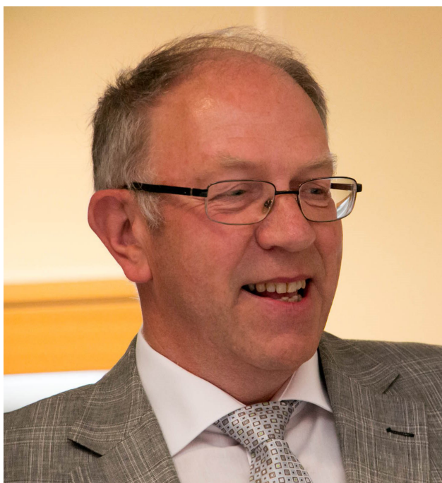
Takk for innsatsen, Byrge!

Arrangører er Fylkesmannen i Oslo og Akershus i samarbeid med Nordmarksplassene, styringsgruppa for Utvalgte kulturlandskap i Oslo og Botanisk forening.