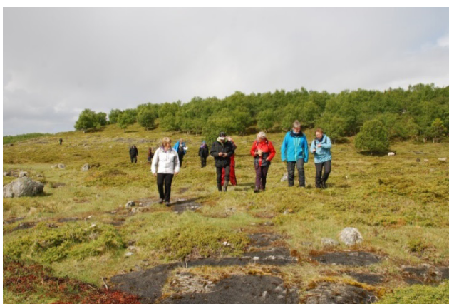
Lekagjengen» på vandring i Kystlyngheia.

I starten av juni reiste seks personar frå Skei utvalde kulturlandskap i Leka kommune i Nord-Trøndelag på studietur til landskapet Blomsøy-Hestøy og Skålvær i Alstadhaug kommune i Nordland. Målet med turen var å finna ut korleis det blir arbeidd med satsinga her og om det er erfaringar som kan takast med til Skei. Ivaretaking av kystlynghei og tilhøyrande jordbruksareal er eit av måla i begge dei utvalde områda. Det store arbeidet er å rydde lauv og kratt og få tilbake det opne landskapet.