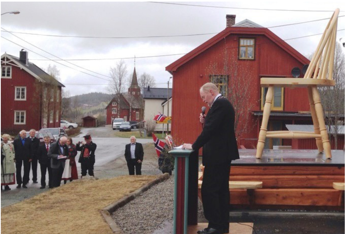
Verdens største budalsstol!

På Tarva skal det også i år være familiedag, nærmere bestemt søndag 11. september. Denne gangen blir det blant annet fokus på kystlyngheia og refotograferingen som skal foregå i sommer. Følg med på hjemmesida til Tarva Velforening når det nærmer seg: http://www.tarvavelforening.velnettbeta.no/ .