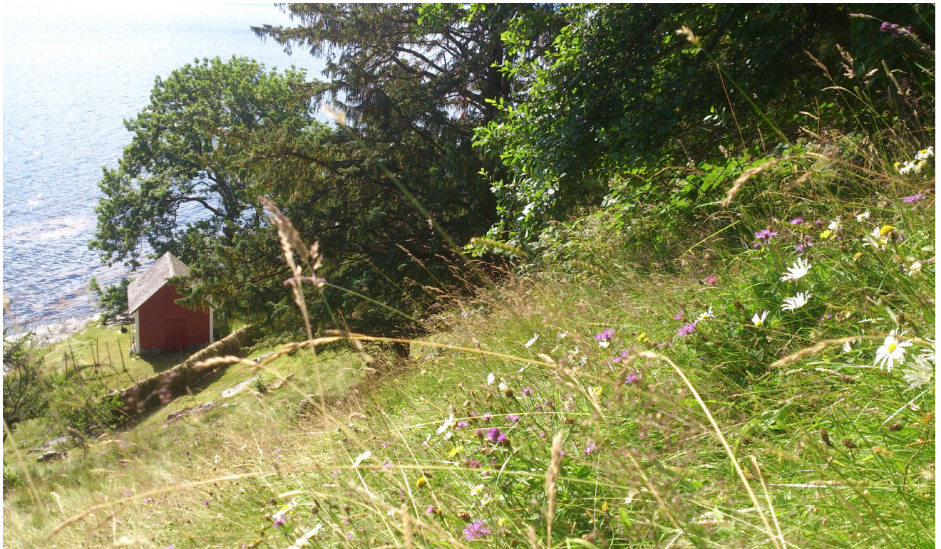
I Gjuvslandslia er det fleire teigar med artsrik slåttemark. Området er svært næringsrikt og går frå fjorden og bratt opp i lia.

Fylkesmannen i Hordaland, ved både landbruksavdelinga og miljøvernavdelinga, jobbar for å oppretthalde dei artsrike slåttemarkane som er registert i naturbasen i Hordaland. Alle som får tilskot til slik skjøtsel var inviterte til kursdagen. Ein ynskjer å skape nettverk, erfaringsdeling og gje fagleg påfyll. Meir botanisk kunnskap kan gjere arbeidet enda meir interessant og spennande. Dessutan er det ekstra kjekt å vise fram dette området for kjennarar av artsrike slåttemarkar!