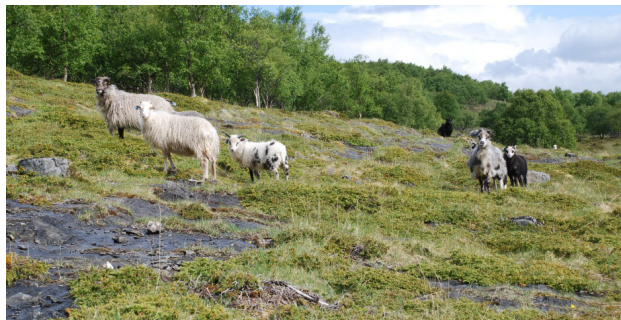
Beiting er nøkkelen til eit oppe landskap. Gamalnorsk sau gjer eit godt arbeid i kystlyngheia.

For å stimulere til beitedrift betaler Utvalde kulturlandskap årleg tilskot til dyr på beite, kr 750 per storfe og kr 250 per vaksen sau. Det blir òg gitt tilskudd til å rydde gjengrodde område, tidkrevjande, men effektfullt arbeid. Her blir det brukt faste tilskotssatsar utifrå kor mykje arbeid det er med ryddinga. I Blomsøy-Hestøy og Skålvær tar dei sauene heim om vinteren der dei har tilgang til husdyrrom. Dyra kan gå ute, men får mykje av fôret inne. Dette gjer at vinterbeitinga blir svakare og at «skjøtselen» sauene gjer i kystlyngheia i denne perioden blir noko redusert. For å kunne halde godt tilsyn i periodar med dårleg ver, må brukarane avgrensa heilårs utedrift til dei øyane dei bur på.