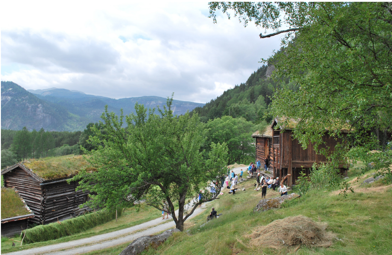
Frå slåttedagen i 2013.