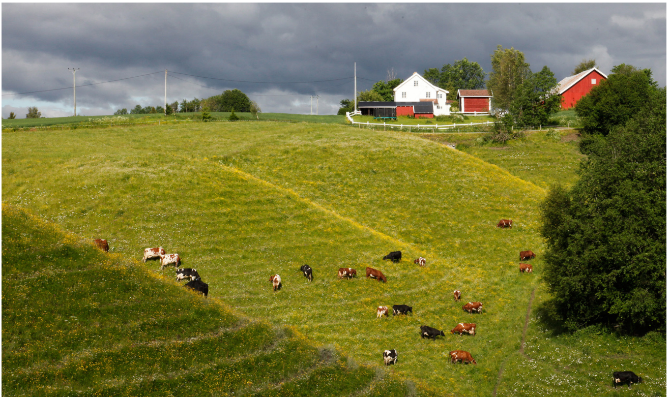
Ravinelandskap på Lyshaug, Øya - Nordre Eik.

NETTVERKSSAMLING PÅ ØYA - NORDRE EIK 23- 24. AUGUST 2016