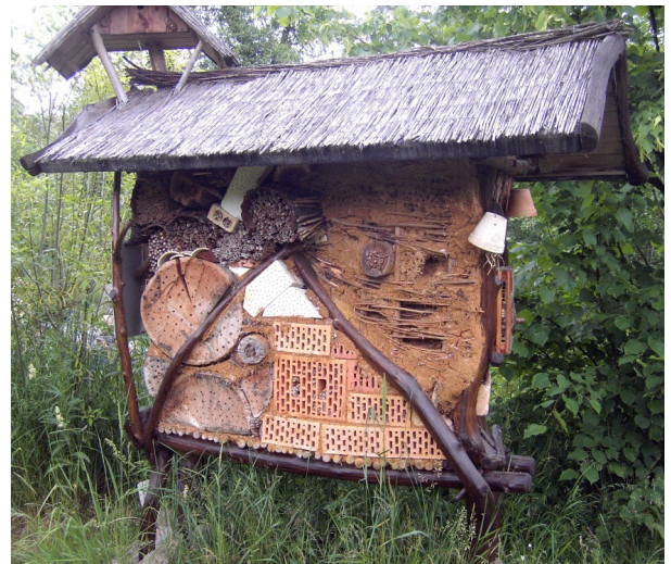
Illustrasjonsbilde fra Tyskland (Wikimedia).

De som ønsker å bygge et insekthotell selv, kan titte på lenken under som viser gode beskrivelser: https://tantegronnshage.no/2015/05/01/slik-bygger-du-et-insekthotell-av-naturmaterialer/