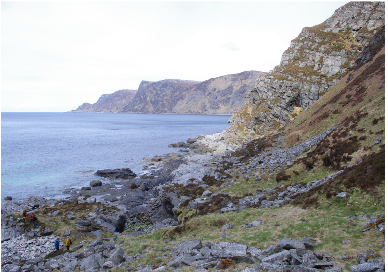
I desse skåningane har det blitt drive jordbruk gjennom lange tider og her ligg også hustuffer.