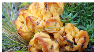
Krypsivaks, en sterkt truet art, og Spademorkel.