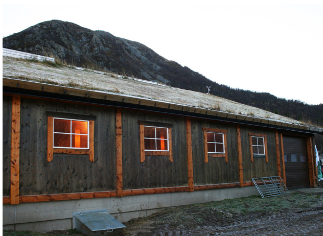
Del av bygget utvendig.