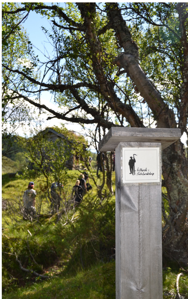
God interesse for slåtttestivandring.

I 2016 planlegges ljakurs der deltakerne får lage sin egen lja. Vi satser på å avslutte kurset med en åpen slåttedag. Invitasjon kommer i neste nyhetsbrev!