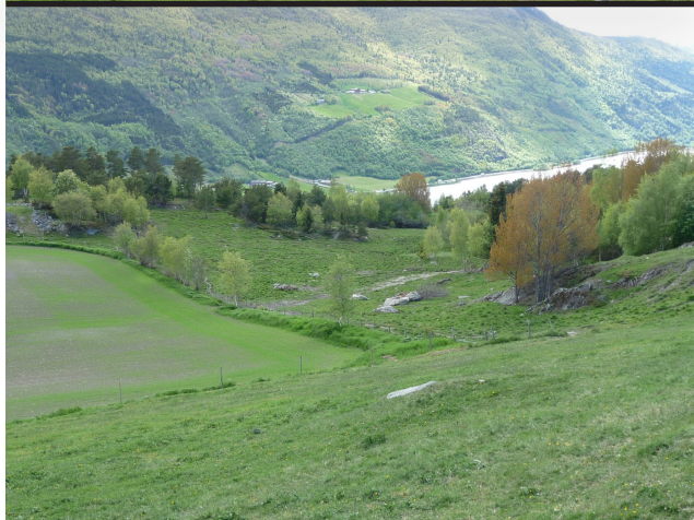
Nigard Kvarberg 2009-2015: Stor forbedring på beite med forbusking og tuedannelse.