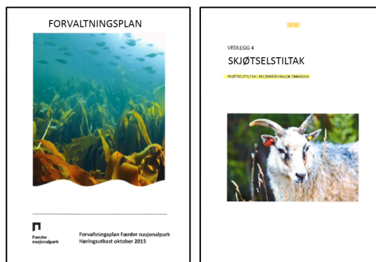
Forvaltningsplan og vedlegg 4 om skjøtsel.