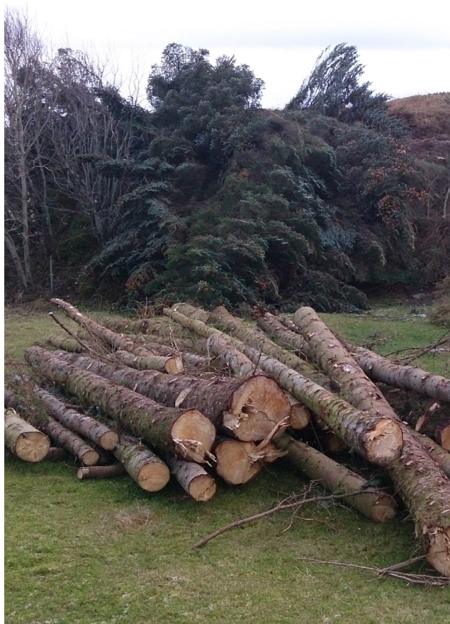
Sitkagranhogst i det utvalde kulturlandskapet på Skei.

Eit sitkafelt med ståande ca 50 m 3 er hogge i haust og arealet skal tilbakeførast til beiteareal. Utvalde kulturlandskap har gitt støtte til sjølve hogsten og til arbeid med å brenne kvisten. Brukaren som har fått støtte plikter seg òg i tre år framover å halde arealet fritt for eventuelle nyskudd av sitkagran.