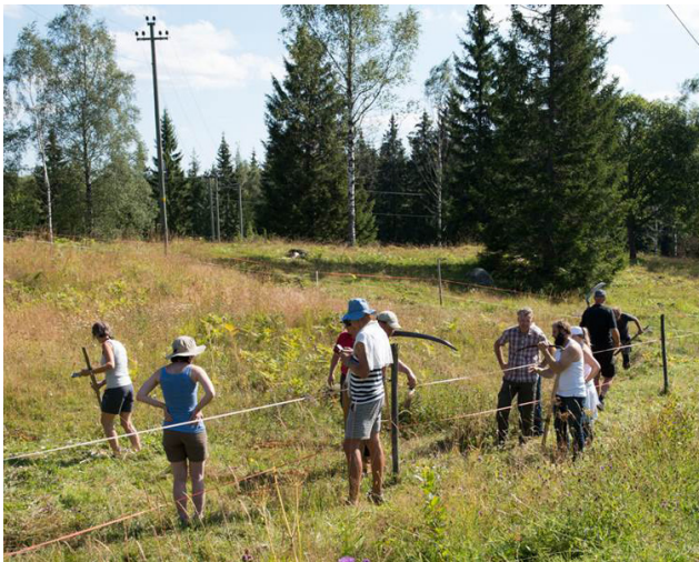
Finnerud Sportsstue

Mange ivrige deltagere møtte fram til slåttekurs på Finnerud i august. Kurset ble arrangert av de fire plassene i samarbeid med Fylkesmannen i Oslo og Akershus. Hensikten med kurset var både å gi brukerne selv økt kunnskap om ljåslått, og å tilby kunnskap og møteplass for andre som har slåttemark i Oslo og Akershus. Alle grunneiere og forvaltere av artsrike slåttenger i Oslo og Akershus var spesielt invitert til å delta på kurset. Erfaringen fra skjøtsel og gjenåpning av slåttengene på markaplassene, er blant annet at det bidrar til å holde slåttetradisjonen ved like, fører til økt artsrikdom og rikere opplevelse av jordbrukslandskapet i Marka.