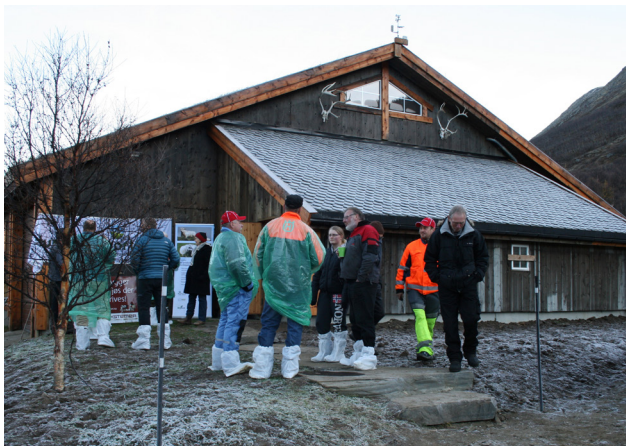
Diskusjonane går friskt. Kontorrom/vaktrom på enden av bygget.

Ein del av meirkostnaden med bruk av tre, ekstra dimensjonering og torvtak/skifertak er støtta med bruk av midlar frå Utvalde kulturlandskap. Vi ønskjer familien på Røymo lukke til med vidare drift!