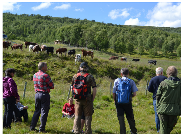
Folk og fe koser seg.