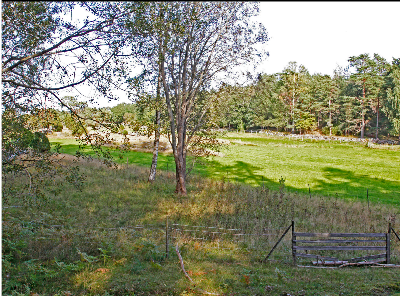
Granskog er ryddet på Sørjordet, Søndre Årøy, Nøtterøy i Vestfold.