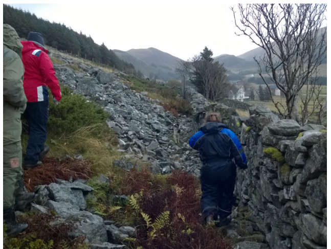
Første gjerdevandring førte samarbeidsgruppa ut på vandring langs gamle utmarksgjerde på Drage.