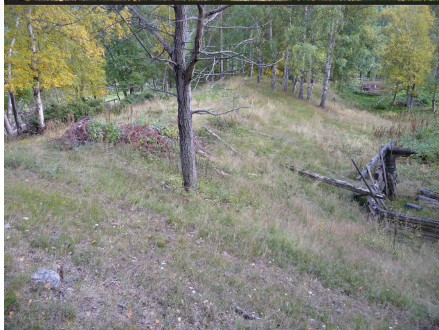
Åbakken 2011-2015: Omgivelsene til ulvegrava (lengst borte til høyre i bildet) er ryddet.