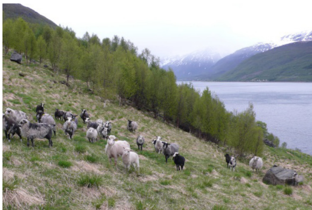
Villsauer i Skárfvággi/Skardalen.