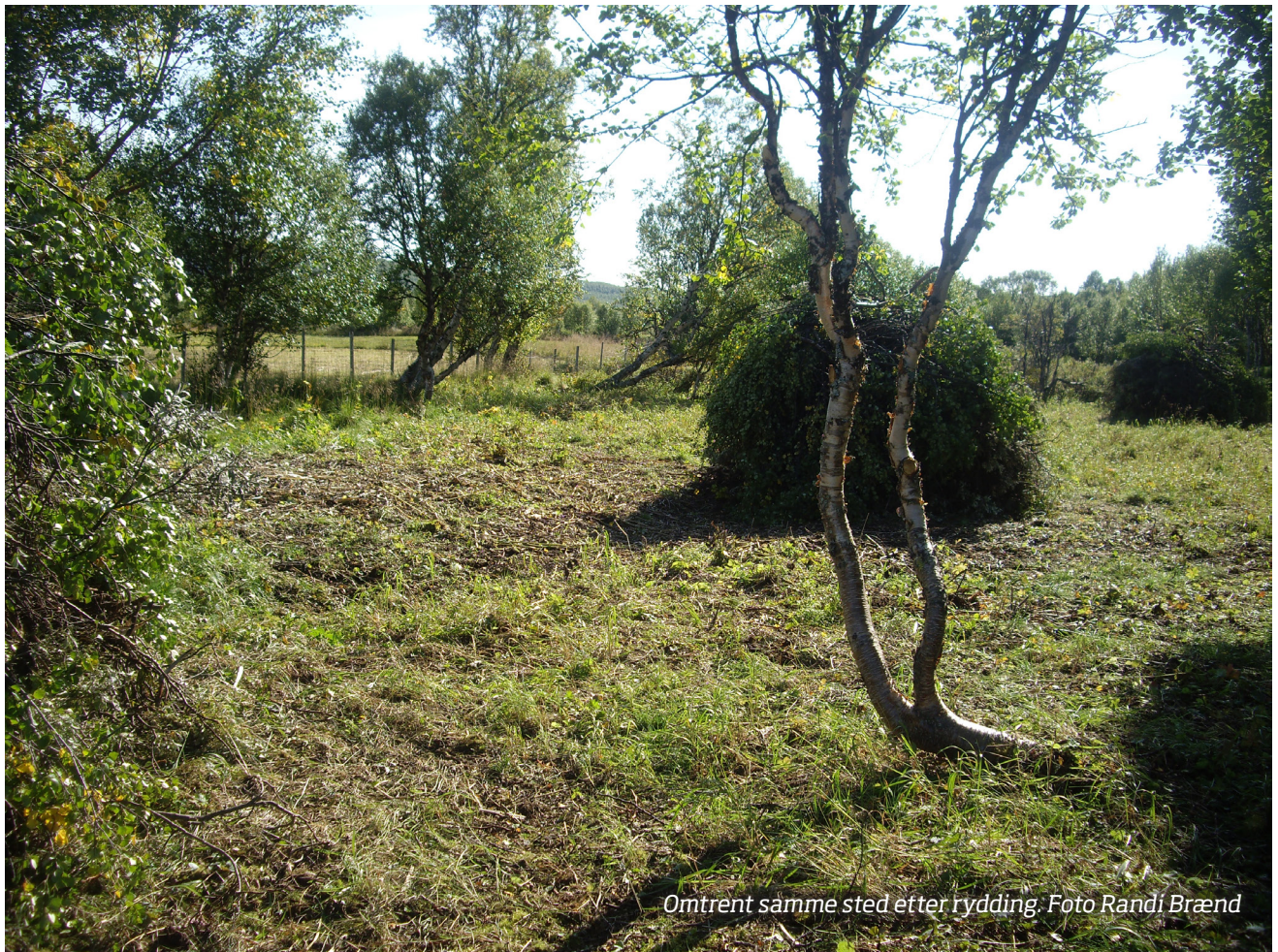
Omtrent samme sted etter rydding.