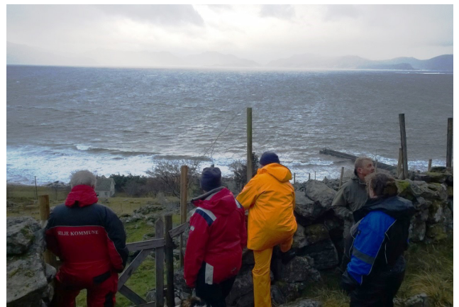
Det var interessant å sjå døme på ulike måtar å gjerde langs steingarden. Her må både omsynet til gjerda som kulturminne, estetikk og funksjonalitet stå i fokus.

Med dette beitebruksprosjektet håper gruppa at det er sett i gang ein prosess der statusen og omdømmet til beitedyra og deira eigarar vert heva.