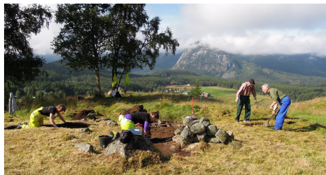
Fra undersøkelse av tuft på husmannsplassen Drenkadøl i Rygnestad.