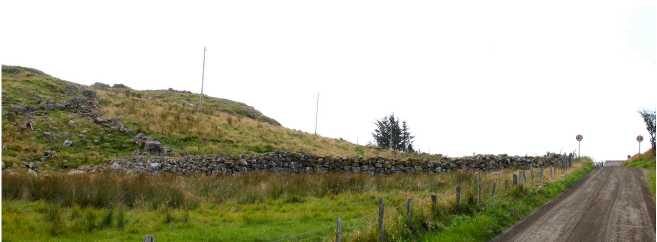
Fjerning av sitkagran på Jølle.