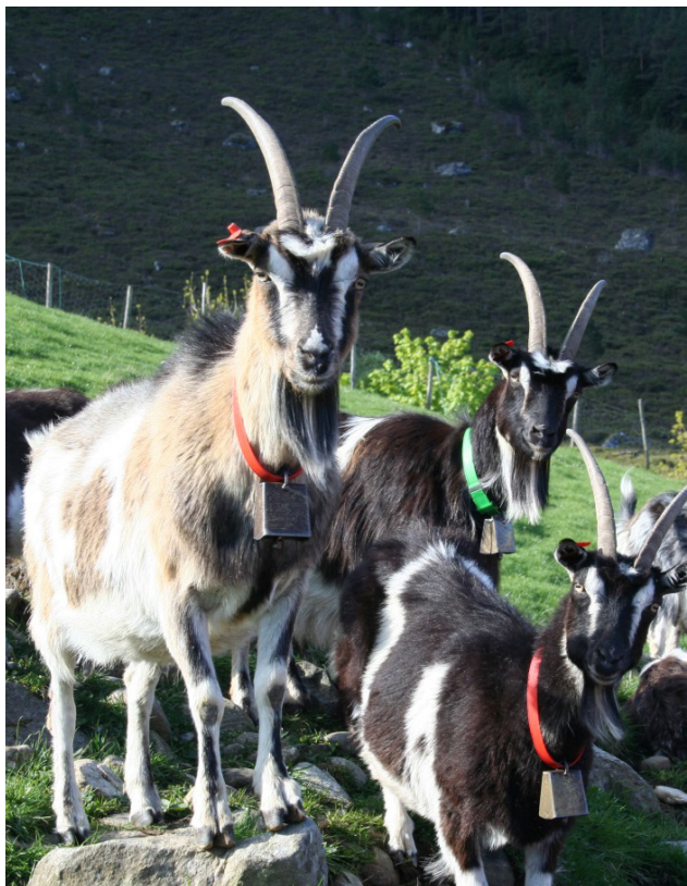
Kystgeita er ei eineståande, utryddingstrua, norsk geitestamme. Den tradisjonelle driftsforma finst berre att i Selje.

Prosjektet har som mål å få ei betre utnytting av lokale beiteressursar, og å oppretthalde eit ope og variert kulturlandskap. Den største utfordringa knytt til husdyrhaldet er manglande gjerdehald og gamle gjerder som fører til at dyr på utmarksbeite kjem ned i innmarksområda og skaper gnissingar mellom bønder og andre grunneigar. Skiping av beitelag og utarbeiding av ein beitebruksplan med tiltaksplanar for viktige beiteområde, er difor sentralt.