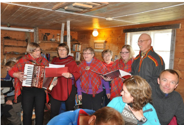
Samisk sang med trekkspill i museet.