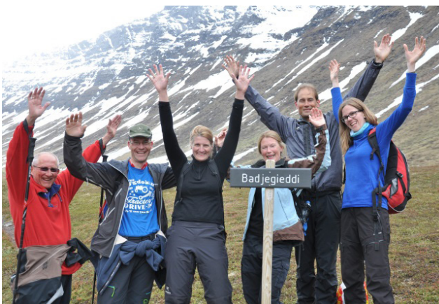
Glad gjeng fra Buskerud på Badjegieddi, der det både finnes samiske gammetufter og rester fra gruvedrift.