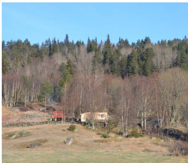
Bygningen i landskapet.