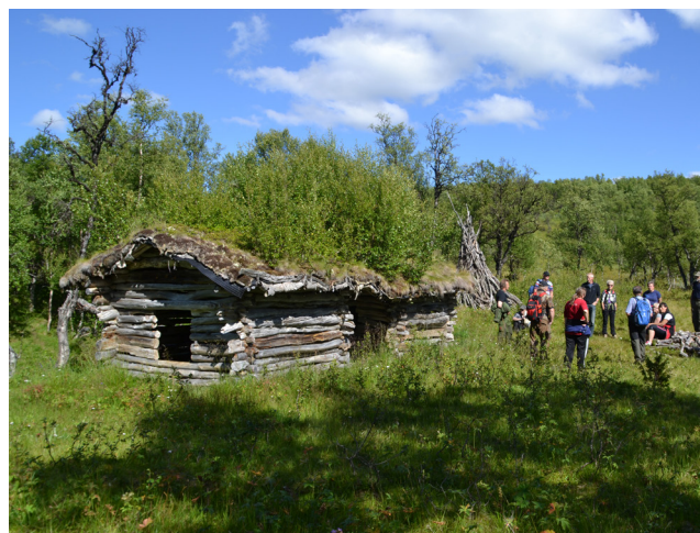
Hopløa - to løer satt i hop.