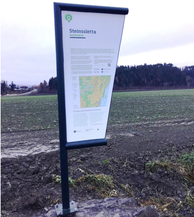
Nytt skilt på Steinssletta.

På Steinssletta er det satt opp skilt på et par aktuelle lokalveier som krysser gjennom området, samt ved en parkeringsplass som brukes av turgåere i området. Skiltene er satt opp av medlemmer i grunneierlaget, og alle er svært fornøyde. Det er videre planer klare for skilt om Halvdanshaugen, som en håper å få ferdig i løpet av vinteren. Det samme gjelder for Bureknatten i Burudåsen naturreservat. Foreløpig har det vist seg vanskelig å få tillatelse til å sette opp to enkle skilt langs E-16 i hver ende av Steinssletta.