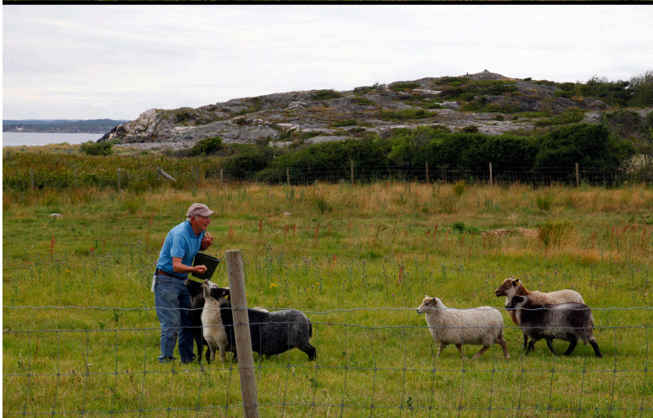
Gjenåpnet beite på Stråholmen, Kragerø i Telemark.