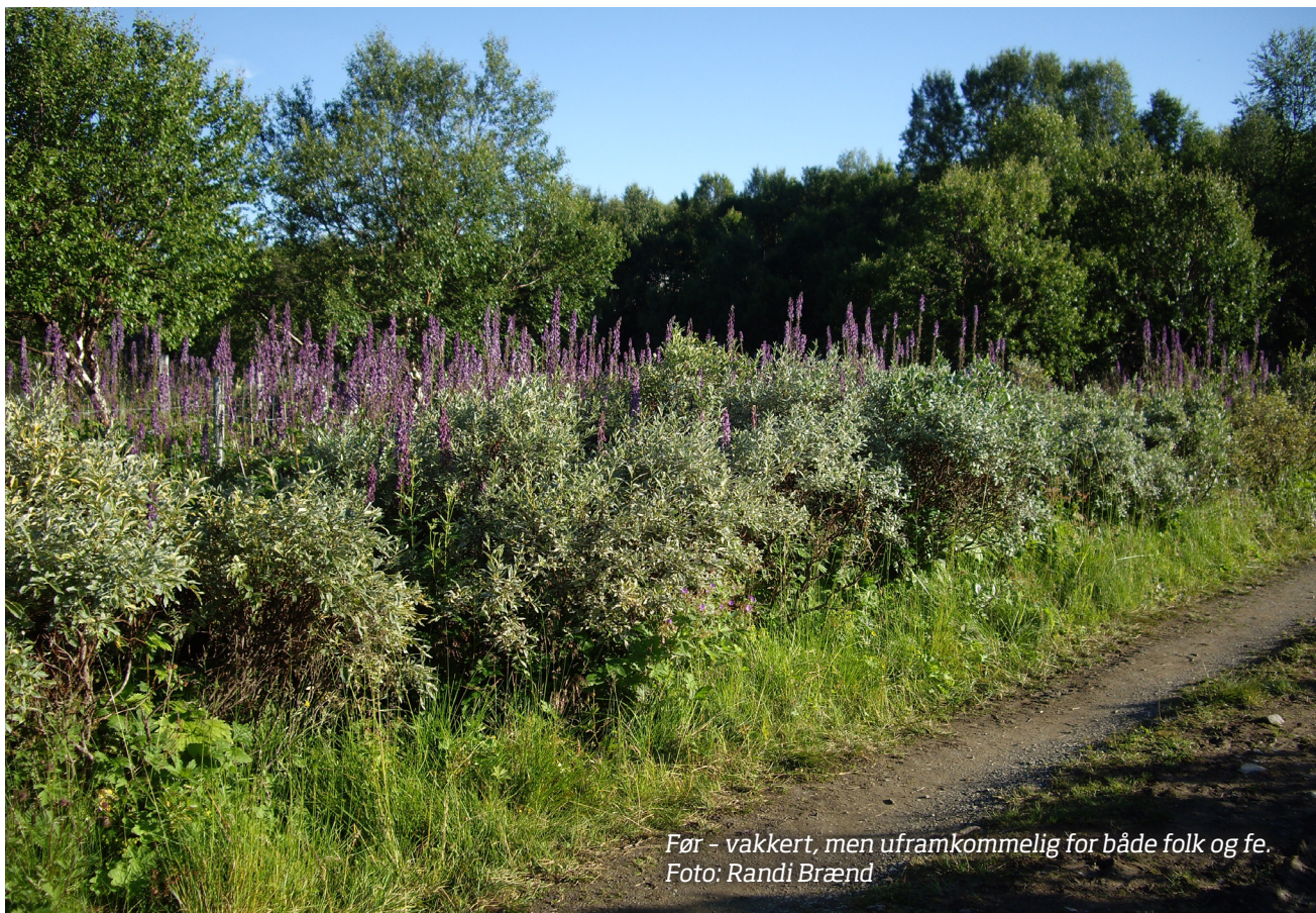
Før - vakkert, men uframkommelig for både folk og fe.

Velkommen til Utistuvollen Seterkafe i 2016. Vi holder åpent lørdager og søndager fra og med 3. juli til og med 14. september!