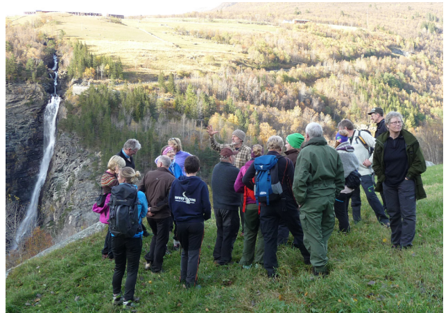
Ved Svøufallet. I bakgrunnen Svisdal-gardane og Lykkjån