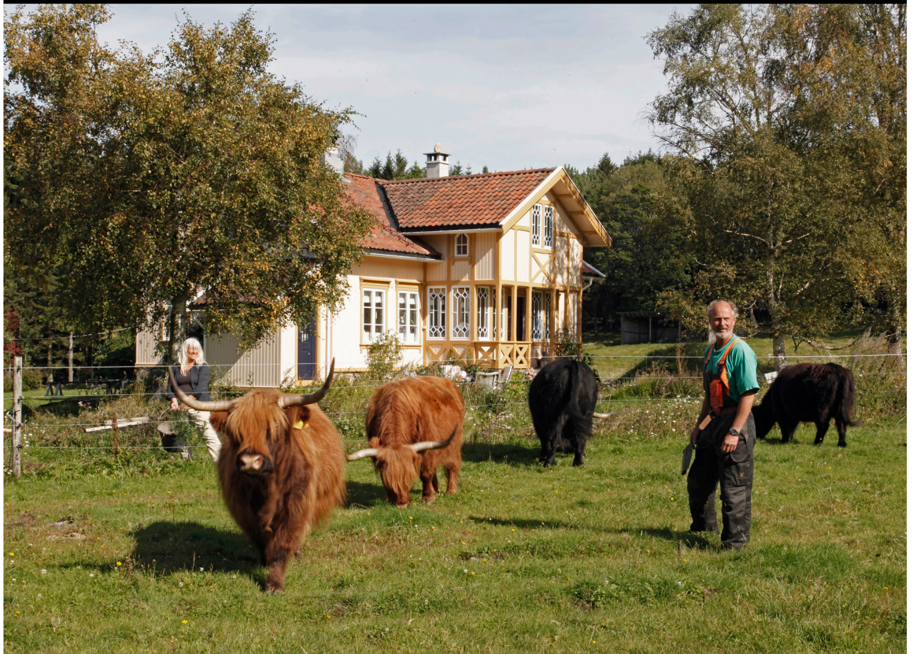
Ny tid - ny virksomhet: Kornbinding for 75 år siden og dagens drift med skotsk høylandsfe og utleie til selskaper, overnatting og kulturarrangementer. Bjerkø gård på Bjerkøy, Nøtterøy i Vestfold.