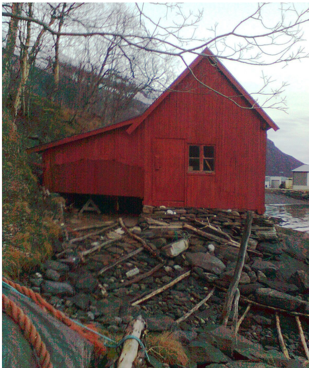
Nymalt naust.

I juni hadde vi besøk av landbruksavdelinga hos Fylkesmannen i Buskerud, med vandring til evakueringsgammen og fjelldalen i Skárfvággi/Skardalen med sitt unike kulturlandskap og rester etter samisk bosetning flere tusen år tilbake. De besøkte også Skardalsfjæra med tradisjonelle naust, fiskehjeller, båtstøer og spissbåter fra området og hørte spennende, fryktelig skumle og sanne historier om Draugen. Dagen ble toppet med servering av rognballsuppe og samisk sang i et av fjøsene som var ombygd til museum med stue