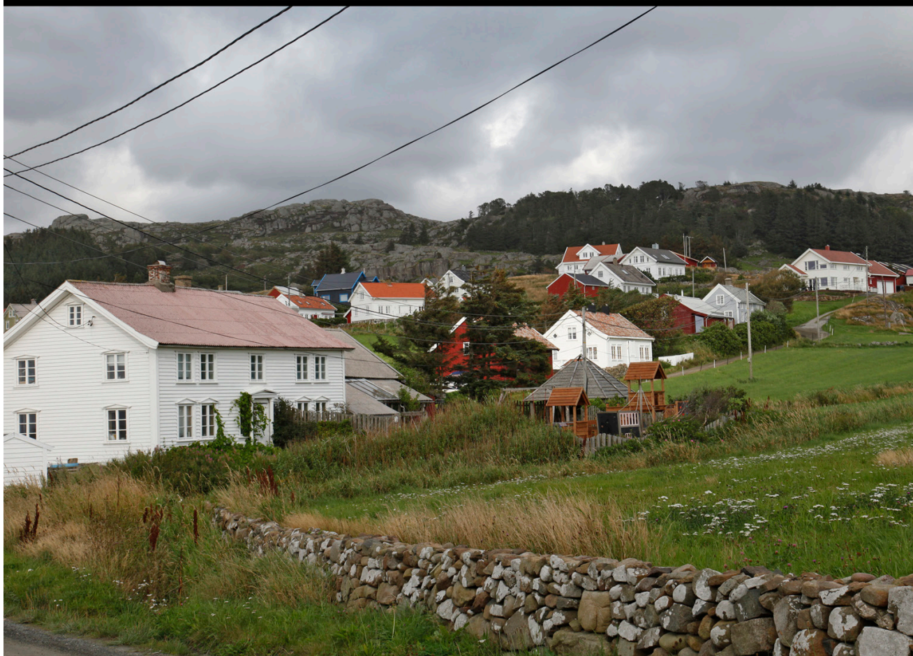
Parti frå Jølle. Postkort frå 1905 og foto 2015 Oskar Puschmann, NIBIO