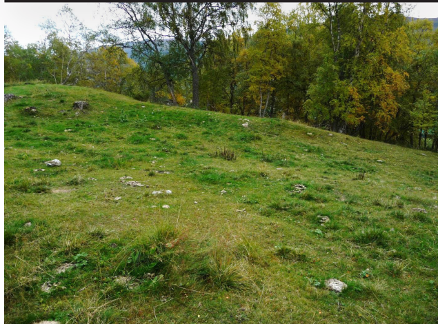
Uppigard Visdal 2011-2015: Platå med jernaldertufter er ryddet og godt beitet av sau og ku.