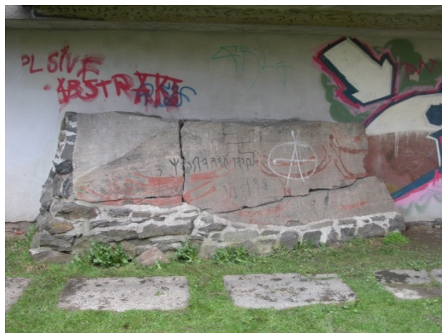
Figur 1. Oppmaling med hvitmaling. Fra lokaliteten Åsli i Balsfjord kommune.

Disse er også gjerne gjort av privatpersoner. Det er også eksempler på at ulike farger har vært brukt på et og samme helleristningsfelt for å markere ulike tidsavsnitt på de ulike figurene (se figur 2).