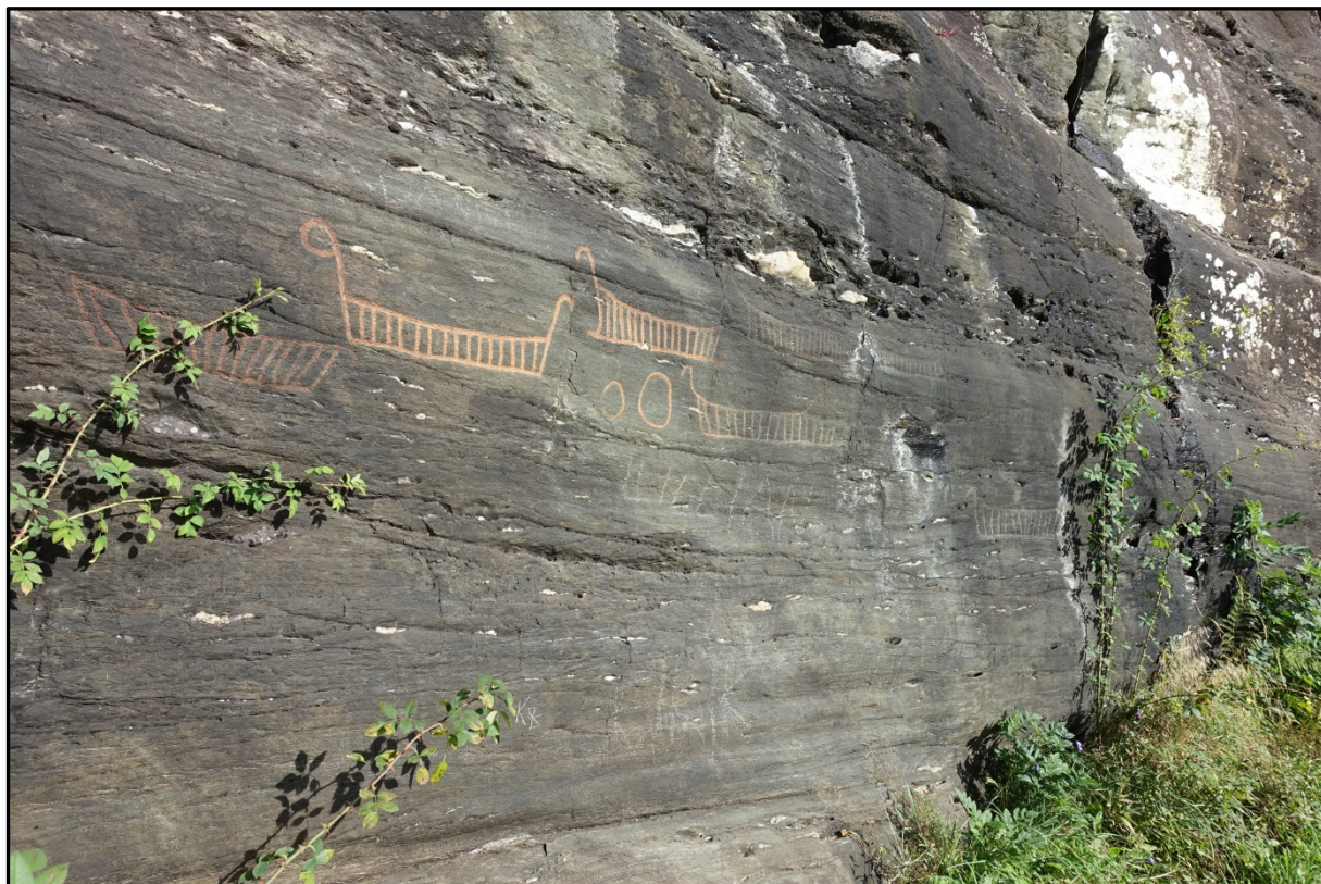
Oppmalte helleristninger på feltet Vangdal I, Kvam kommune, Hordaland.