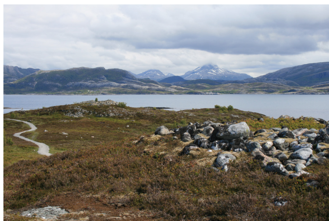
Gravrøyser og lyngheier på Skeisnesset, Leka.