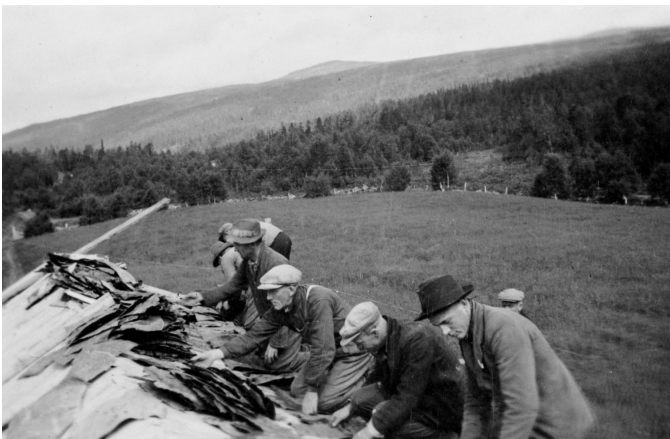
Nevertekking på Tovmo, 1942

Bevaring og bruk av eldre seterbygninger er en viktig del av det utvalgte kulturlandskapet i Budalen. Derfor inviterer Sør-Trøndelag fylkeskommune, i samarbeid med Midtre-Gauldal kommune, Fylkesmannen i Sør-Trøndelag og Norsk Kulturminnefond, til et dagseminar om kulturminner og næring, med spesielt fokus på bygningsvern og tilskuddsmuligheter. Første del av seminaret er rettet mot seterbrukerne i Endal og Budalen, samt administrasjon og politikere i tiliggende kommuner. På slutten av dagen inviteres det til et åpent arrangement for alle som har interesse for bevaring og tradisjonell eller ny bruk av kulturminner.