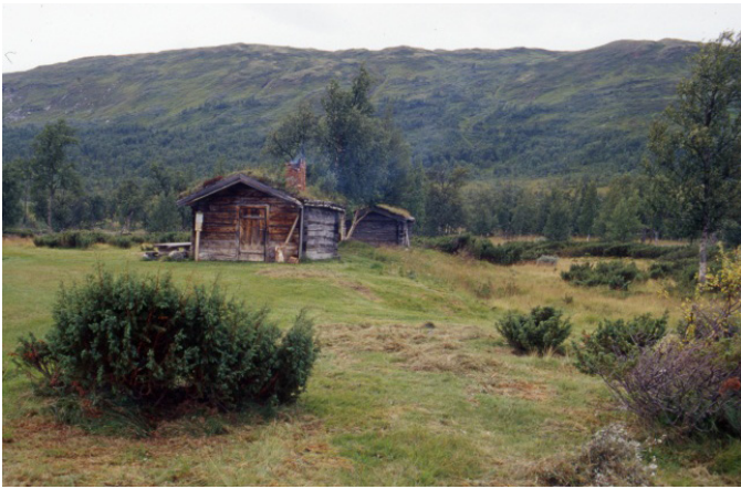
Blåola i Budalen.

SETERDALENE I BUDALEN, SØR-TRØNDELAG: DAGSSEMINAR OM KULTURMINNER, BYGNINGSVERN OG TILSKUDDSMULIGHETER 9. OKTOBER