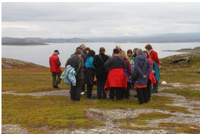
Omvisning, kulturminner på Sandvikshalvøya

I Goarahat og Sandvikshalvøya har det i den siste tiden vært stor aktivitet både hos lokalbefolkningen og på forvaltningsnivå. Det har spesielt vært arbeidet med forvaltningsplanen for området, og lokalbefolkningen er aktivt med. 14. september ble det arrangert Kulturminnedag i området, med utstillinger, guidet tur, servering av lokal tradisjonsmat, informasjon om Goarahat og Sandvikshalvøya som utvalgt område samt foredrag om kulturminnene og tradisjonen i området.