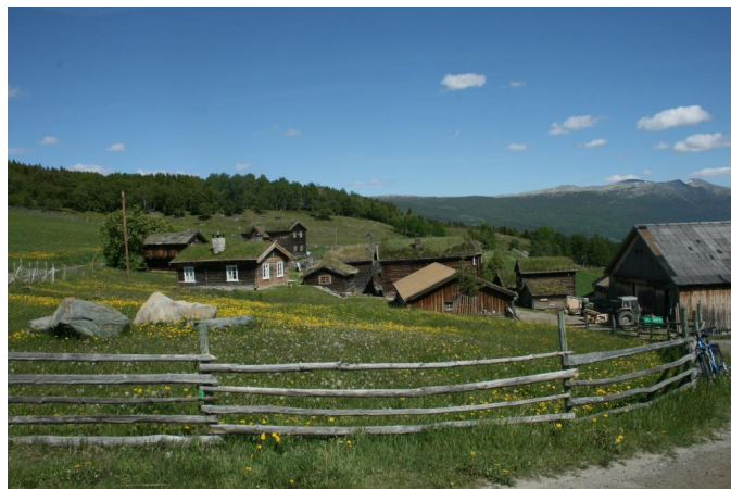
Valbjør gard, Nordherad, Vågå.

Les artiklene her: http://www.utmark.org/