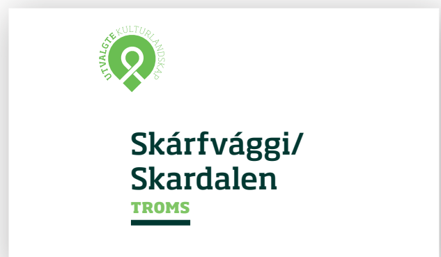
Eksempel på lokal logo.

Fra 1. juli i år ble Direktoratet for naturforvaltning slått sammen med Klima- og forurensningsdirektoratet til Miljødirektoratet. Nå består derfor direktorats-samarbeidet om Utvalgte kulturlandskap i jordbruket av Miljødirektoratet, Riksantikvaren og Statens landbruksforvaltning.