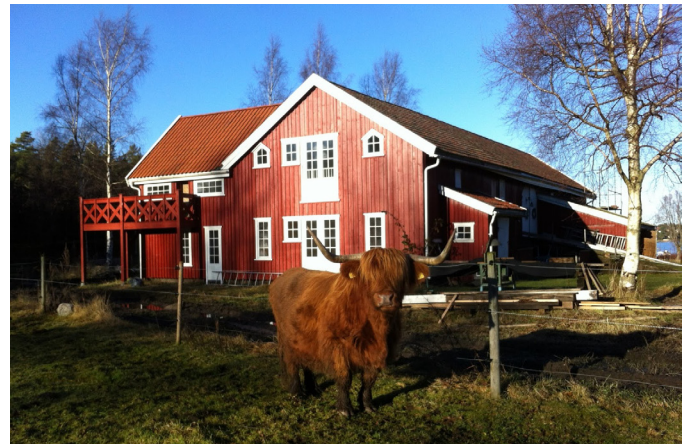
Låve og høylandsku i solskinn.

SKJÆRGÅRDEN ØST FOR NØTTERØY OG TJØME, VESTFOLD: GODE OPPLEVELSER I SKJÆRGÅRDSLÅVEN