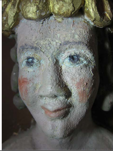
Detalj av karyatideansikt. Trolig tidligere limbehandlet (før 1982).