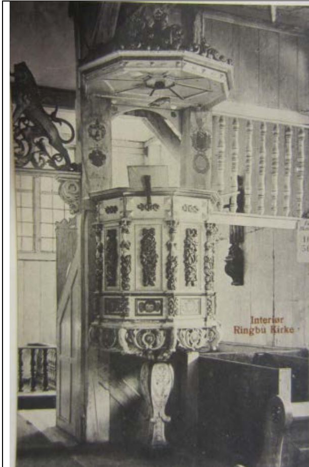
Udatert postkort i Riksantikvarens arkiv viser prekestolen med overmaling.

Prekestolen ble behandlet av Riksantikvarens konservatorer i 1982. Se vedlegg 2.