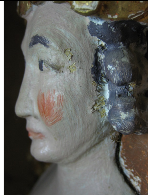
Limskader på karyatide