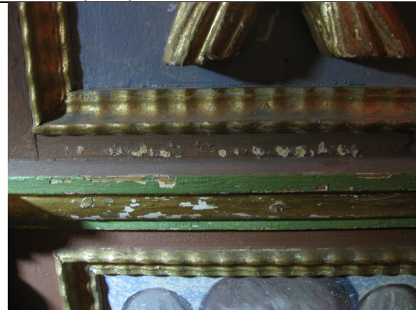
Skader i malingen på listverk