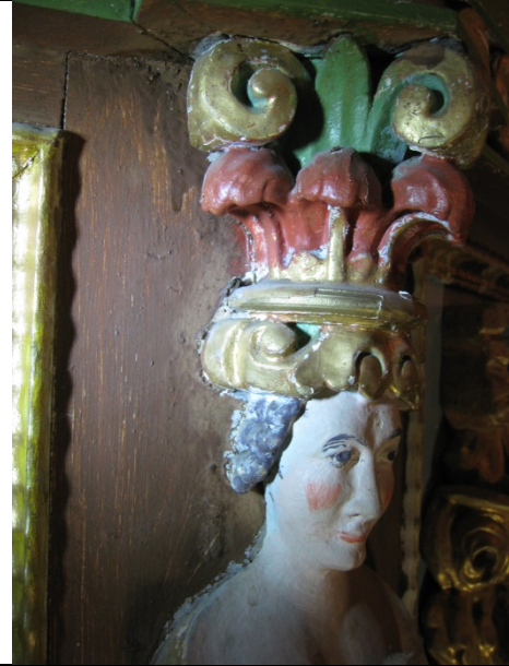
Brunt område med fargeog glansforskjell mot karyatiden.