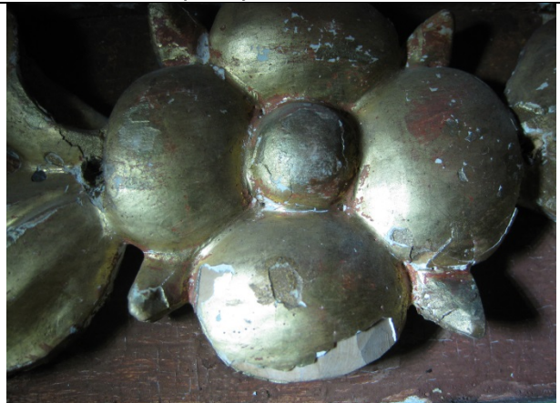
Skader i forgylt område i over fylling