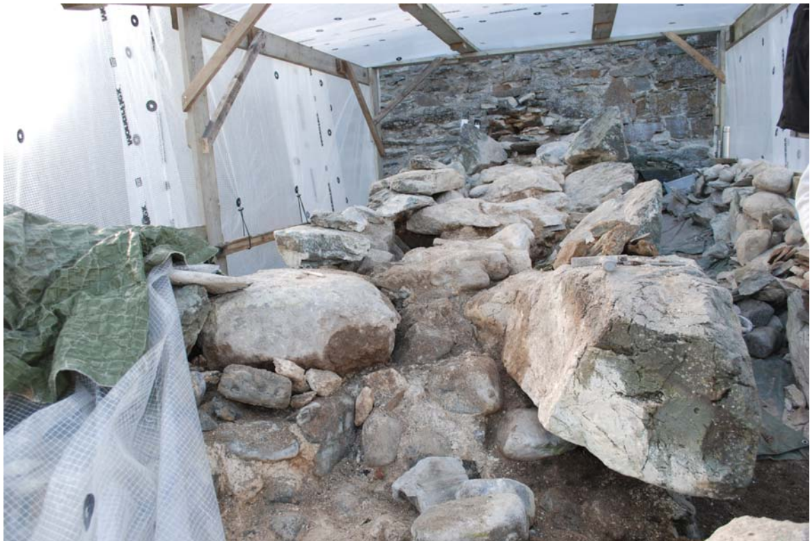
20050721_004 Rensing av murkjerne ned til bevart original murkjerne.

Murkjerne er renset ned til original kalkmørtel. Større løse steiner er tatt ut av muren, renset og murt tilbake. Toppsteiner i murverket er tilbakemurt i sin opprinnelige posisjon. Toppdekket er murt med overhøyde i midten og avrenning til hver side. Det er i dag lagt bentonittblandet fuktsikring på toppen av muren.