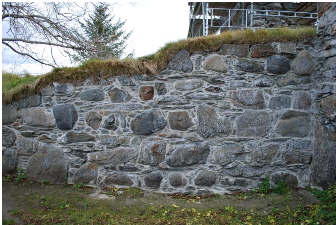
Foto: 20050719_034 Spekking ferdigstilt i nord vestre rom i sakristi