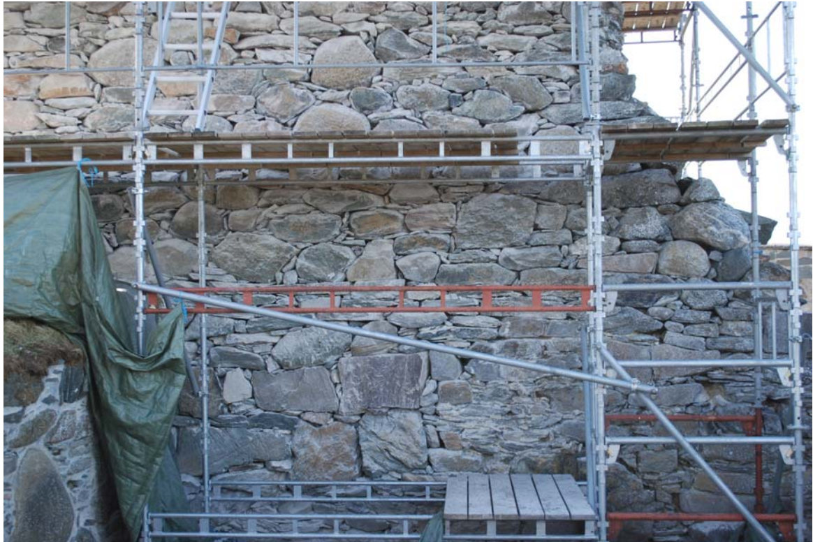
20050721_011 Ferdig meislet og rensset murverk.

Det er så langt i prosjektet på Tautra klosterruin meislet ut en betydelig mengde sementfuger og fjernet også en betydelig mengde oppløst fugemateriale. Vil antyde at etter sesongen i 2013 er mengden til sammen omkring 6 kubikkmeter.