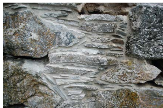
20050727_003 og _030 Før og under arbeidets gang. Murverket er utført med store hovedsteiner og store mengder pinningsstein i mellom hovedsteinene. Under demontering av pinningsstein ble disse fotografert, merket med kritt og murt tilbake. Toppsteiner er merket, demontert, rensert, gyset og murt tilbake i posisjon. Mye av murverket var sklidd ut og dette er rettet opp i veggens naturlige liv.