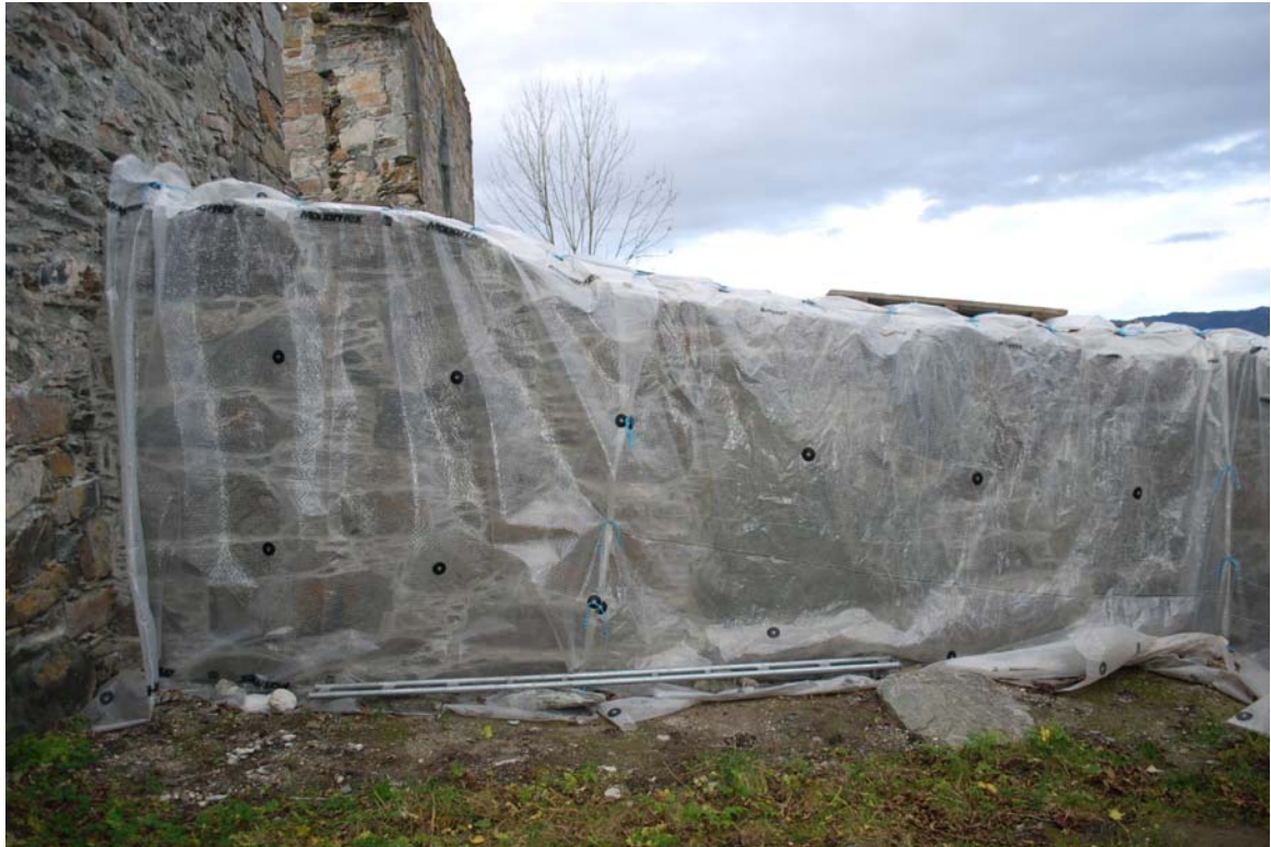
20050721_035 eksempel på ferdig mur, renset, spekket, murt toppdekke og tildekket for vinteren.