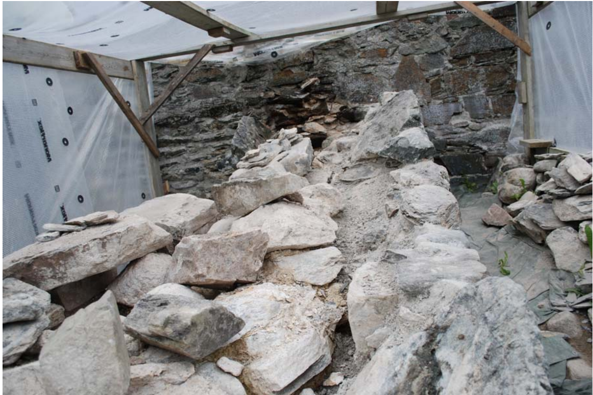
20050721_027 Muring av toppsteiner under arbeidets gang