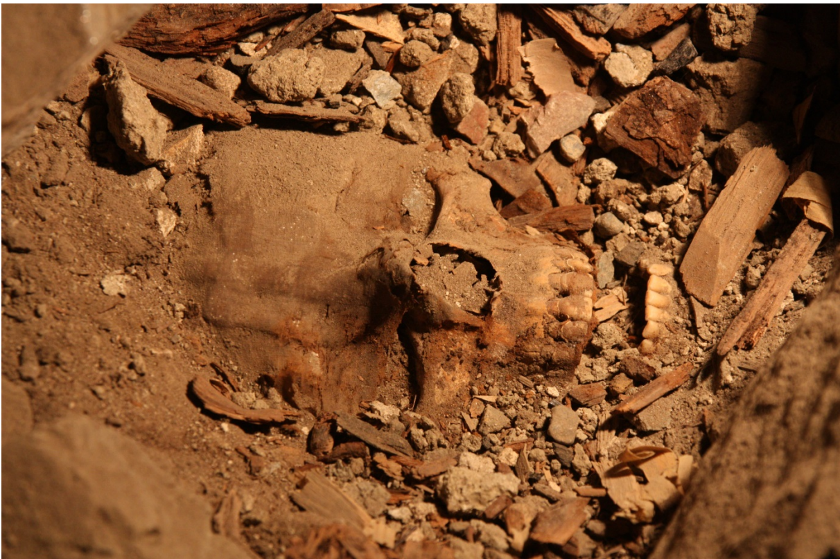
Figur 9. Nærbilde av det delvis påviste kranium. Merk tøystykket på pannen, samt rester av tøy på fortennene. Niku_ark_322135.