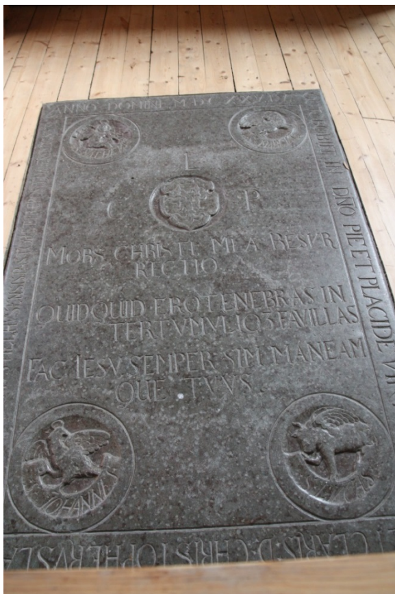
Figur 11. Gravstein/minnestein fra 1626 i gulvet foran alteret i Melhus kirke. Niku_ark_322159.