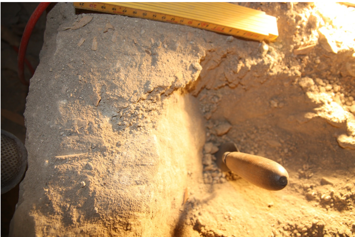
Figur 6. Bredden på kammerets S mur (sett oven i fra, murlivet til venstre). Niku_ark_322157.