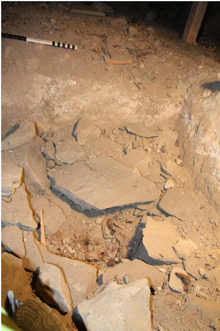
Figur 7. Gravens beliggenhet ved kammerets SV hjørne. Niku_ark_322153.

Noen stykker treflis og spon lå rundt ansiktet; noen av disse kan være rester av en ødelagt kiste, men de fleste er antagelig avfall fra tidligere byggearbeider. Steinene som ligger løst her kan være stein fra middelalderkirken eller fra de øvre delene av murene i kammeret som ble revet i 1890. Skjelettet ble tildekket med planker og stein etter dokumentasjon.