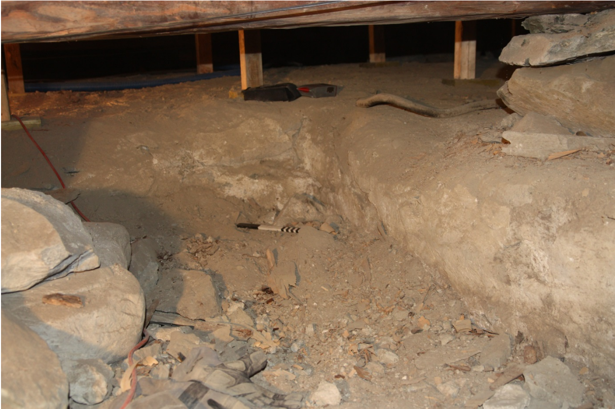
Figur 5. Kammerets SV hjørne. Niku_ark_322143.