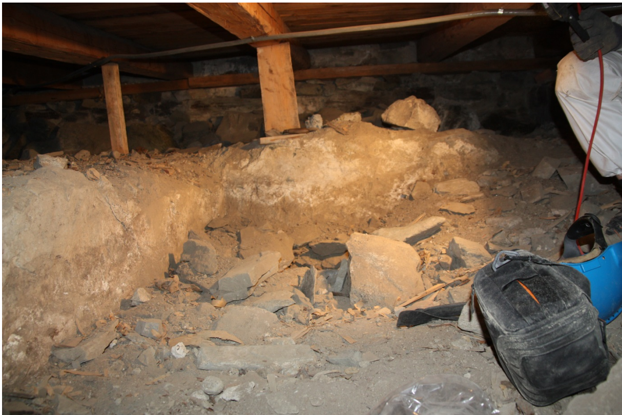
Figur 2. Murene til gravkammeret sett mot V. Dagens kirkefundament i bakgrunn. Bildet viser konstruksjonens murer i vest og nord, med innvendig kalkpusset murliv samt stein, sand og mørtel som dekker graven i konstruksjonens indre. Niku_ark_ 322141.

Konstruksjonens plassering, byggemåte, utforming og dimensjoner tyder på at den fungerte som gravkammer. Skjelettfunnet utgjør trolig en samtidig begravelse i kammeret.