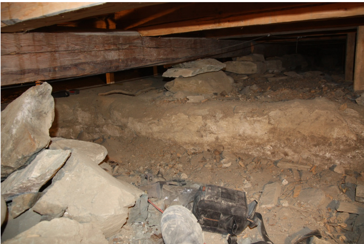
Figur 4. Fortsettelsen av den vestlige muren mot S der den treffer den sørlige muren. Niku_ark_322146.