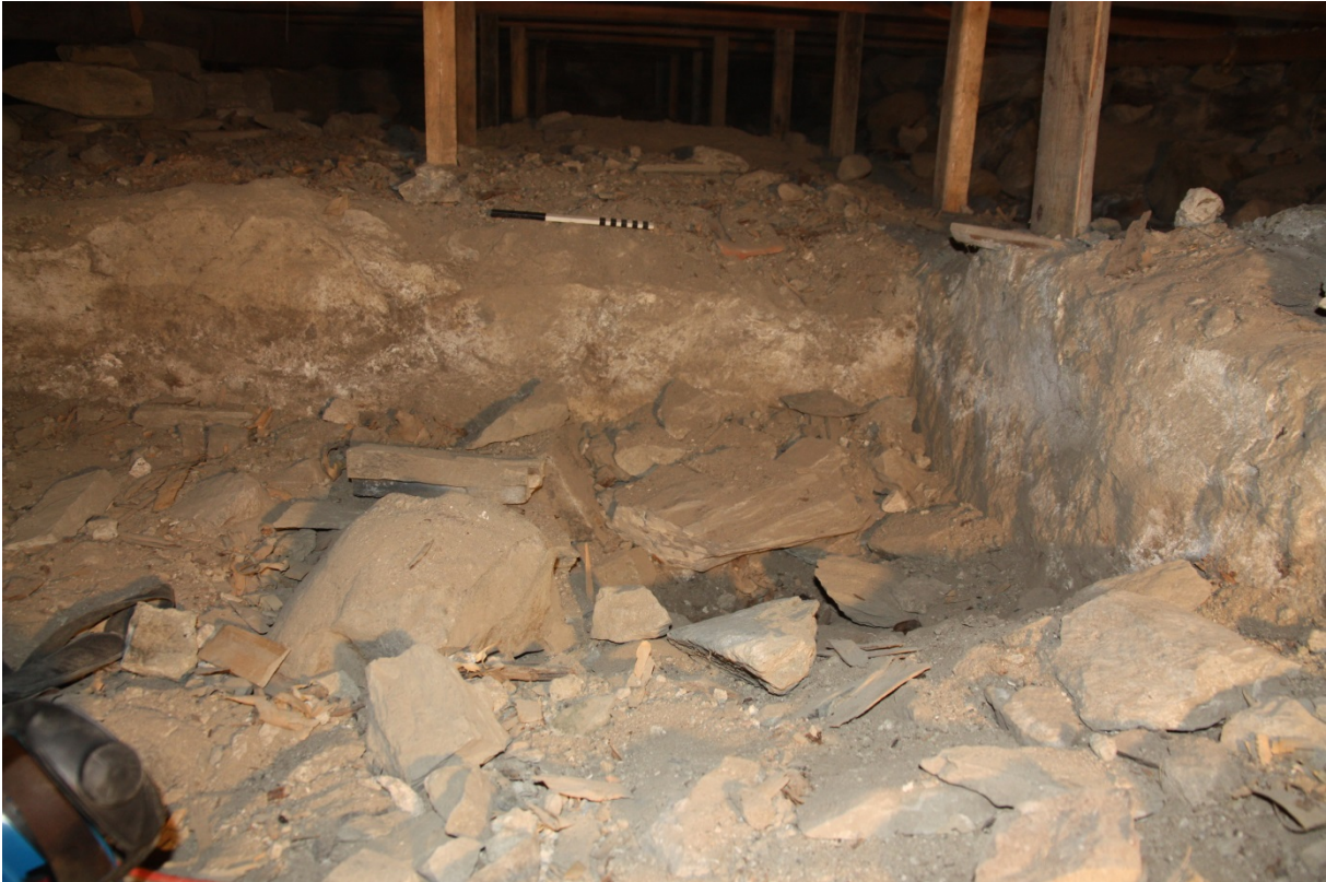
Figur 3. Murene til gravkammeret sett mot V. Bildet viser kammerets N og V murer og NV hjørne. Graven ligger blant steinene midt på bildet. Niku_ark_322143.