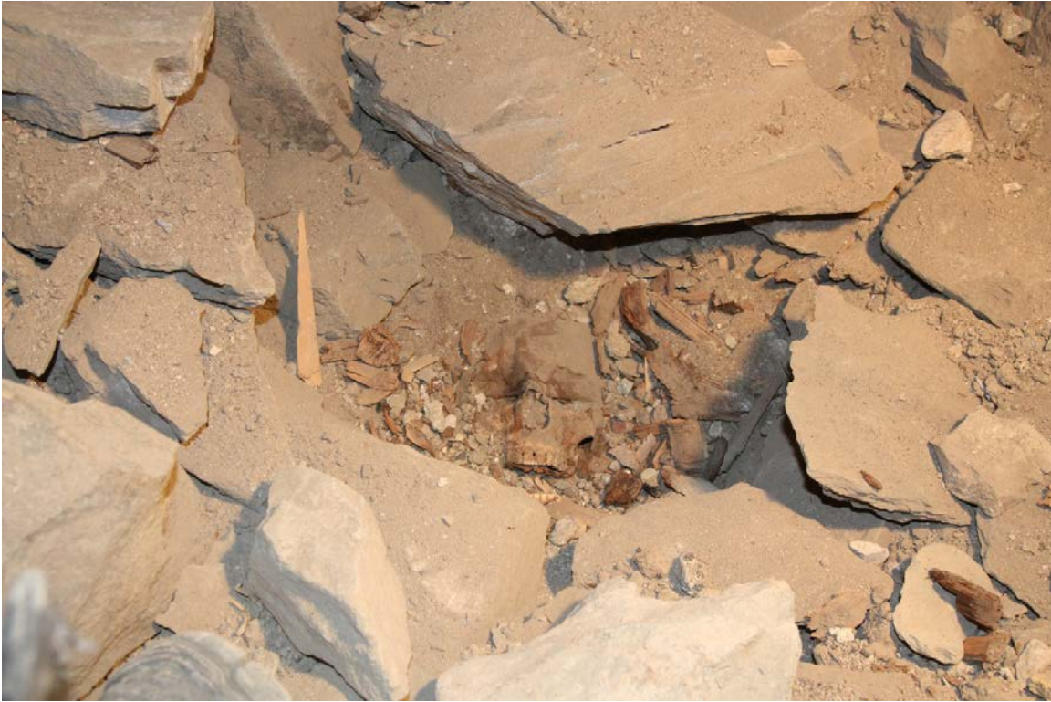
Figur 8. Nærbilde av det delvis påviste kranium. Merk tøystykket på pannen. Niku_ark_322152.