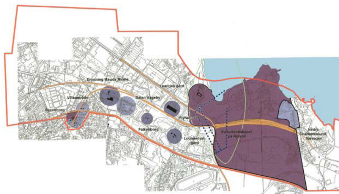
Fig. 6.2.5. Kartet viser kulturminneverdiene på Leangen

Beskrivelsen av de kulturhistoriske verdiene i et område bør illustreres med bilder, og evt andre illustrasjoner som for eksempel bearbejdede kart. Ved bruk av illustrasjoner kan man for eksempel på en lettfattelig måte illustrere viktige forbindelseslinjer eller sammenhenger mellom ulike kulturmiljøer og landskap. Gode eksempler på hvordan dette kan fremstilles på kart finnes også i Riksantikvarens KU-veileder, DIVE-rapporten og i arbeidet med stedsanalyse (se henvisninger ovenfor).