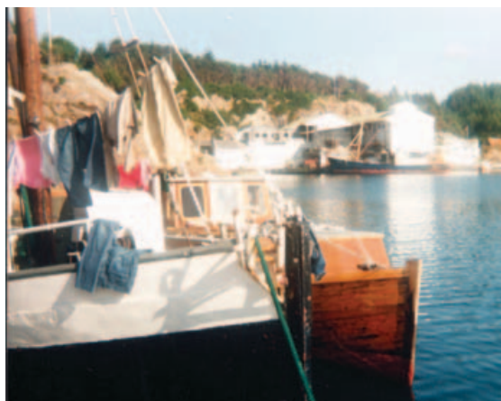
Over: Ankringsplass i Øklandsvågen, vest på Bømlo i Hordaland.