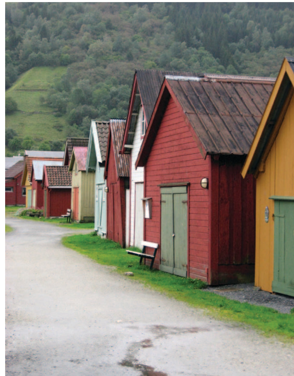
Vik i Sogn, der mange reisende hadde vinterbosted fram til slutten av 1930-tallet.