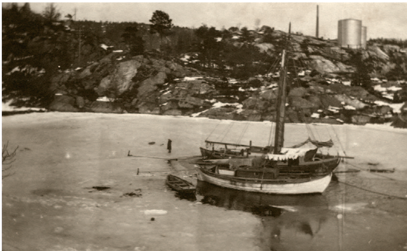
Båtreisende frosset inne i Hannevika ved Kristiansand.

båter helt siden 800-tallet. På nordsiden seilte de ut Ålfjorden og videre nordover til Sunnhordland. En mann født i 1866, fortalte at "Då eg var liten, såg eg splint som drog her òg. Ungane sprang med lunner og la etter båten etter hvert. Det var tofter i båten, hunendar og slikt dei la under. Dei fylgde vegen her borte når dei drog". Senere var det vanlig å leie en bonde i Skjoldastraumen eller Haraldseidvågen som kjørte båtene over dragseidet med hest og høyslede. Haraldseidet er det siste av de store dragseida langs kysten som har vært i vanlig bruk i gjennomgangsferdsel. De båtreisende var av de aller siste som brukte dette eidet, så sent som på slutten av 1940-tallet.