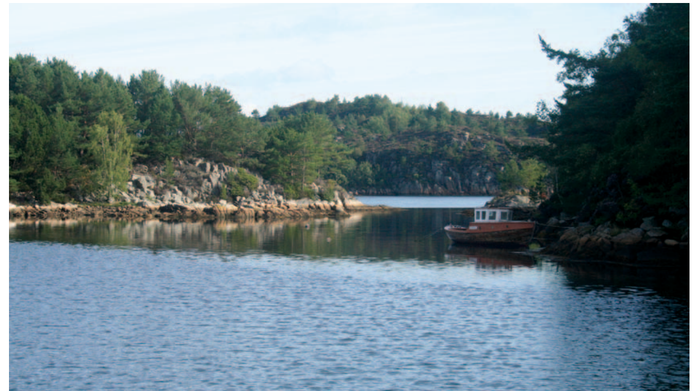
Røyksundkanalen på Bømlo. Mange reisende overvintret i båt her helt fram til 1960-tallet.