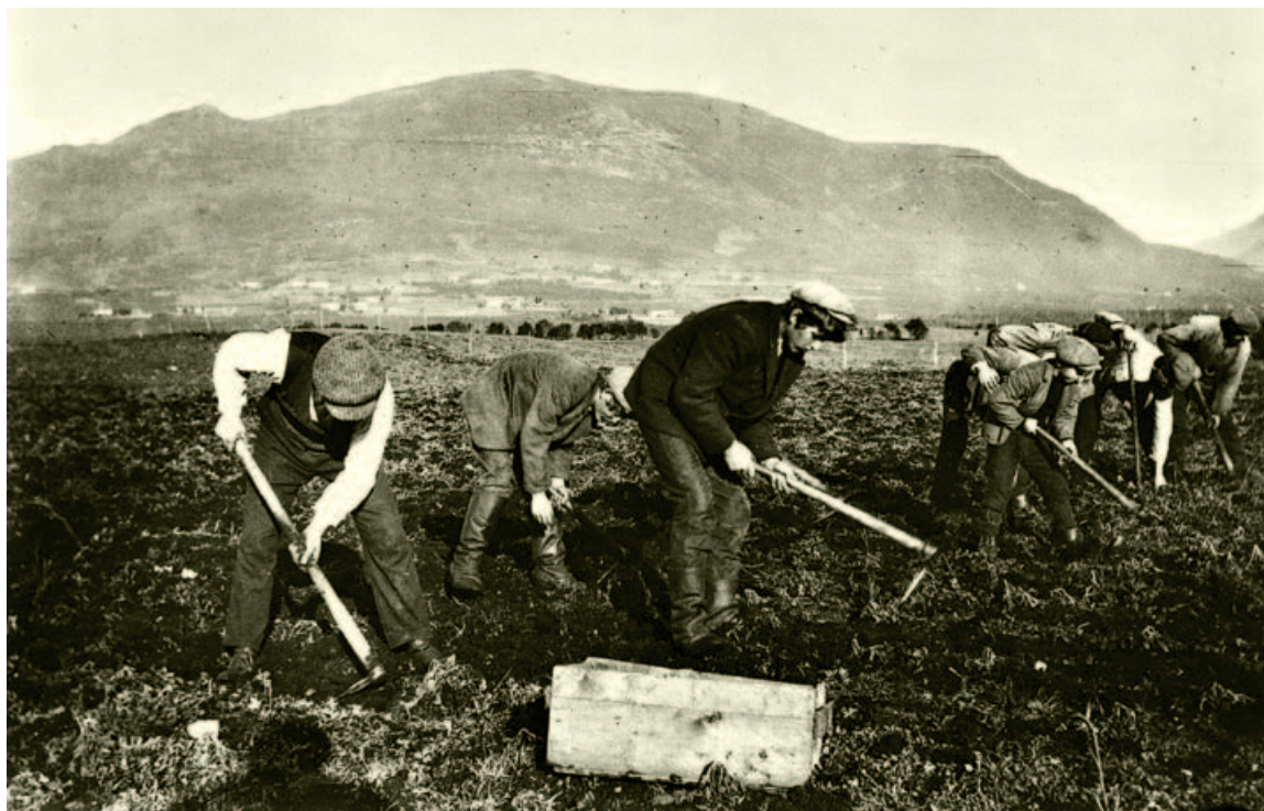
Potetopptaking på Svanviken arbeidskoloni, 1915.