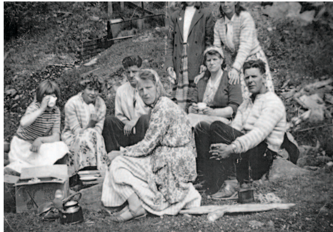
Båtreisende har kaffepause på land, trolig i Os, Hordaland, 1950-tallet. Kjelen og kaffikverna var fast utstyr i båten.

Livet om bord i en liten båt var fylt av gleder og sorger. Kontrastene kunne være store, fra varme solskinnsdager, til kalde vintre, der håret frøs fast i skutesida. Nygifte par, nyfødte, skolebarn, mødre, fedre og besteforeldre levde livene sine om bord i båter – i hverdag og høytid. Ei kvinne, født i 1937, husker hvor lykkelige hun