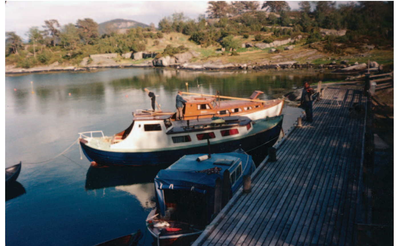
Flere båter har ankret opp på Føyno i Sunnhordland, 1990-tallet. Mange fortsatte å ta små turer med båt etter de ble bofaste.