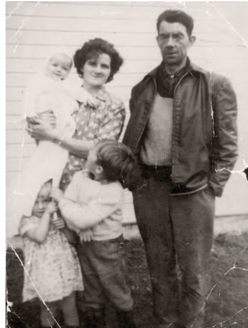
Barn ble født, døpt og vokste opp på Svanviken arbeidskoloni. Familie på 1950-tallet.

Fram til 1929 startet den i alt seks barnehjem. Et av dem var Jacob Walnums barnehjem i Kopervik som åpnet i 1921. Norsk misjon blant hjemløse fjernet til sammen rundt 1500 barn fra foreldrene. Mellom en tredjedel og en fjerdedel av alle romanibarn født mellom 1900 og 1960, som Misjonen kjente til, ble satt bort.