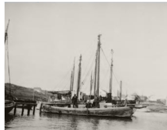
Båtreisende i ei skøyte utenfor Kopervik, omkring 1910.