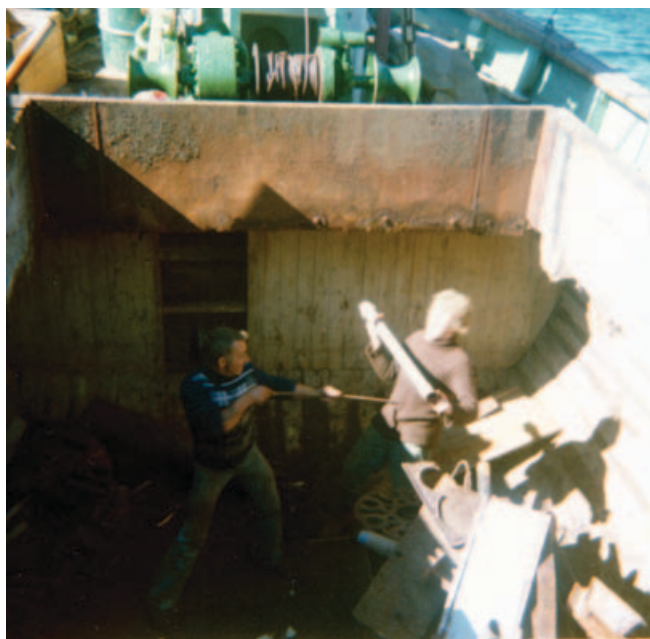
Over: Skøyte med lasterom og plass til jernskrap på 1970-tallet.

laget i perioder mer varer på bestilling enn for tilfeldig småsalg. Denne endringen skjedde gradvis og hadde en oppblomstring i de første årene etter andre verdenskrig, før etterspørselen etter blikkvarer forsvant helt utover på 1970-tallet. Det ga i perioder en sikker inntekt for mange familier.