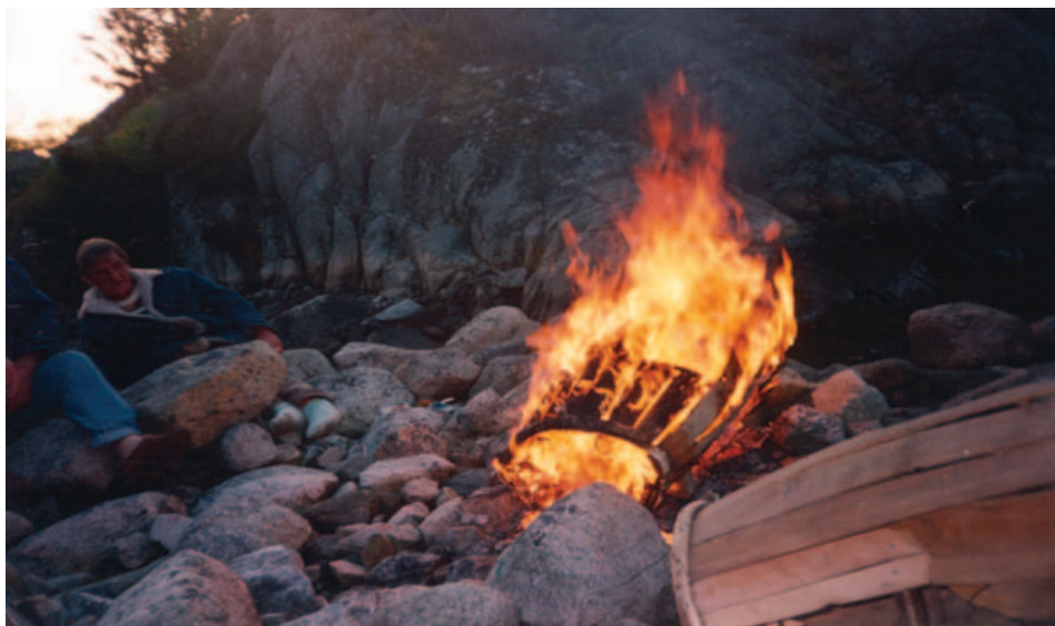
Leirbålet har alltid vært et samlingspunkt for de reisende. Når de reisende samles i dag synges det ennå romanviser og fortelles historier rundt bålet.

I det siste tiåret har det utviklet seg en sterk offentlig interesse for historien og skjebnen til romanifolket i Norge. Dette kommer trolig både av den generelle interessen for minoritetsspørsmål og mer spesielt av den sterke mediefokuseringen omkring rasehygiene, med de ulike tiltakene som over tid er blitt gjennomført i Norge. Særlig har steriliseringsloven av 1934 og konsekvensene den loven hadde for romanifolket, vært i fokus.