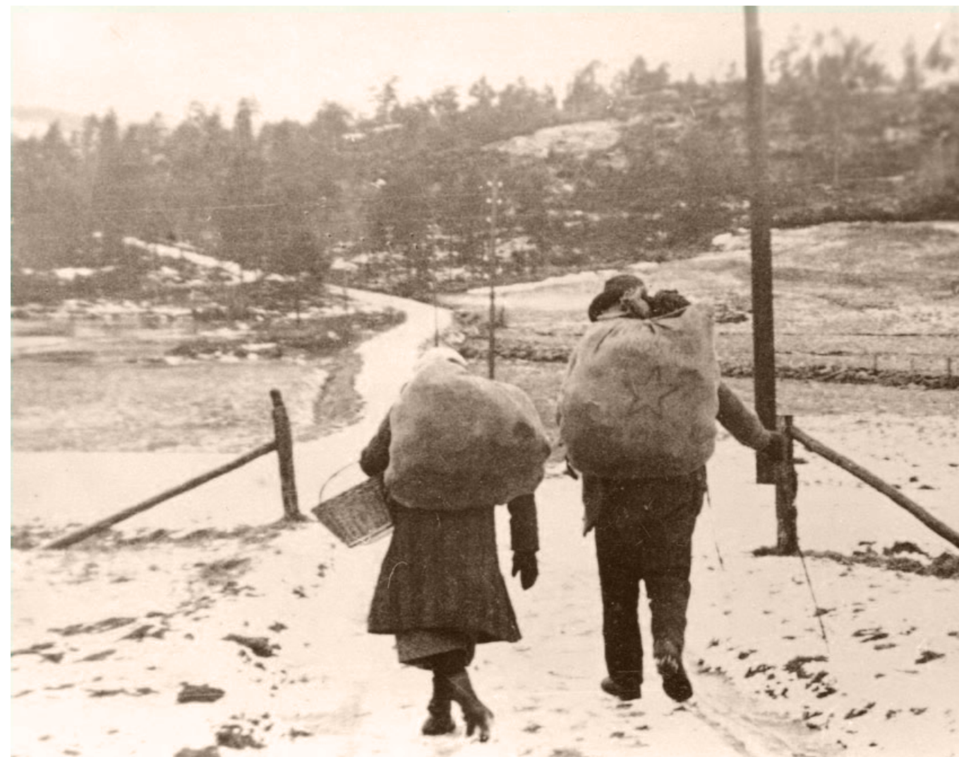
Petter og Tina Strømsing, Bildet er tatt på Engesland i Aust-Agder omkring 1930. Petter stammet fra den kjente reisende Petter Strømsing, som ble født i Skjoldastraumen i Rogaland i 1749.

I flere hundre år har romanifolket reist i båter langs Norges kyst. Like selvfølgelig som de reisende i innlandet brukte hest og kjerre, ble båten brukt som framkomstmiddel langs kysten. Selv om kildematerialet før 1900 er begrenset, kan rettsprotokoller, tingbøker, kirkebøker, folketellinger og reisepass allikevel inneholde opplysninger om bruk av båter blant de reisende. En av de tidligste omtalene av reisende som brukte båt er fra en rettsprotokoll fra 1600-tallet. Sommeren 1682 reiste et følge på femten personer