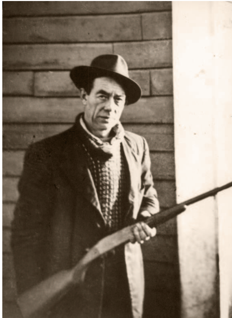
Jakt på sjøfugl var en viktig inntektskilde og matauk.

Å holde sulten borte og skaffe mat til familien var den viktigste oppgaven. Mange fastboende delte mat med de reisende, eller ga dem brød og poteter. En mann født i 1940 forteller at de byttet