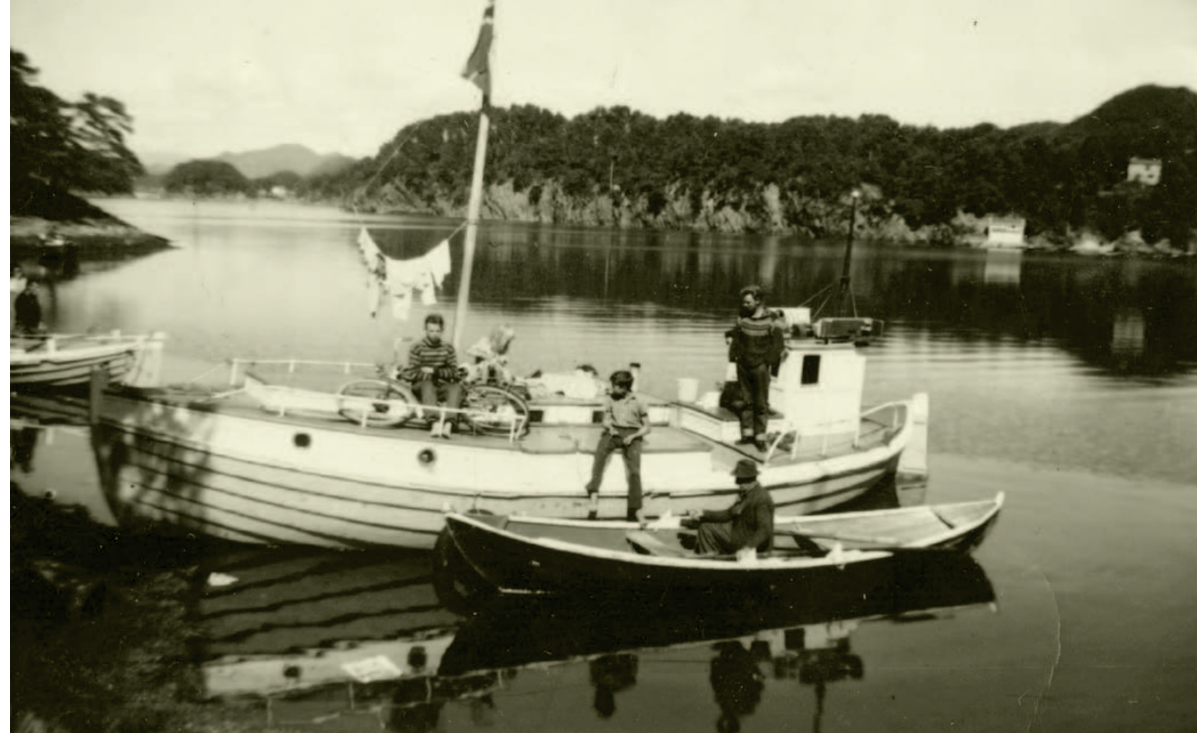
Tre generasjoner båtreisende har ankret opp i Os i Hordaland på 1950-tallet.

Ikke i noe annet land fikk én organisasjon så mye makt som Norsk misjon blant hjemløse. I 1973 laget Vibeke Løkkeberg en kritisk film om Svanviken arbeidskoloni. Den ga støtet til en prosess som førte til at politikken ble lagt om. Misjonen ble en del av de reisendes liv og hverdag fram til den ble nedlagt i 1989. Alle kjente til Misjonen og de aller fleste familier ble berørt av