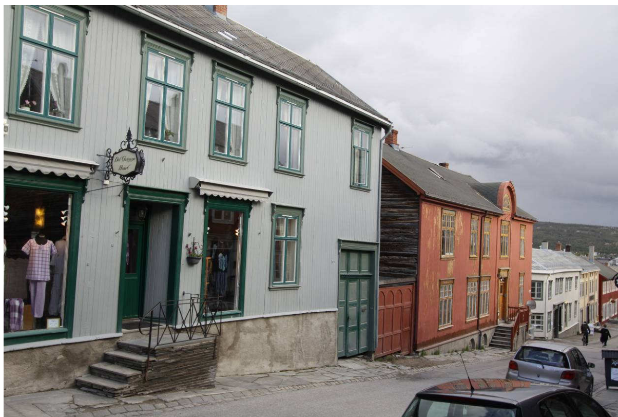
Figur 2. Røros. Kjerkgata. Foto tatt 8.6.2010 fra omtrent samme sted, men litt lavere standpunkt enn fig. 1.