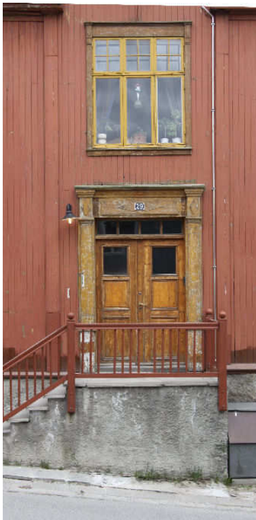
Figur 4. Røros. Kjerkgata 29. Hoveddøra.