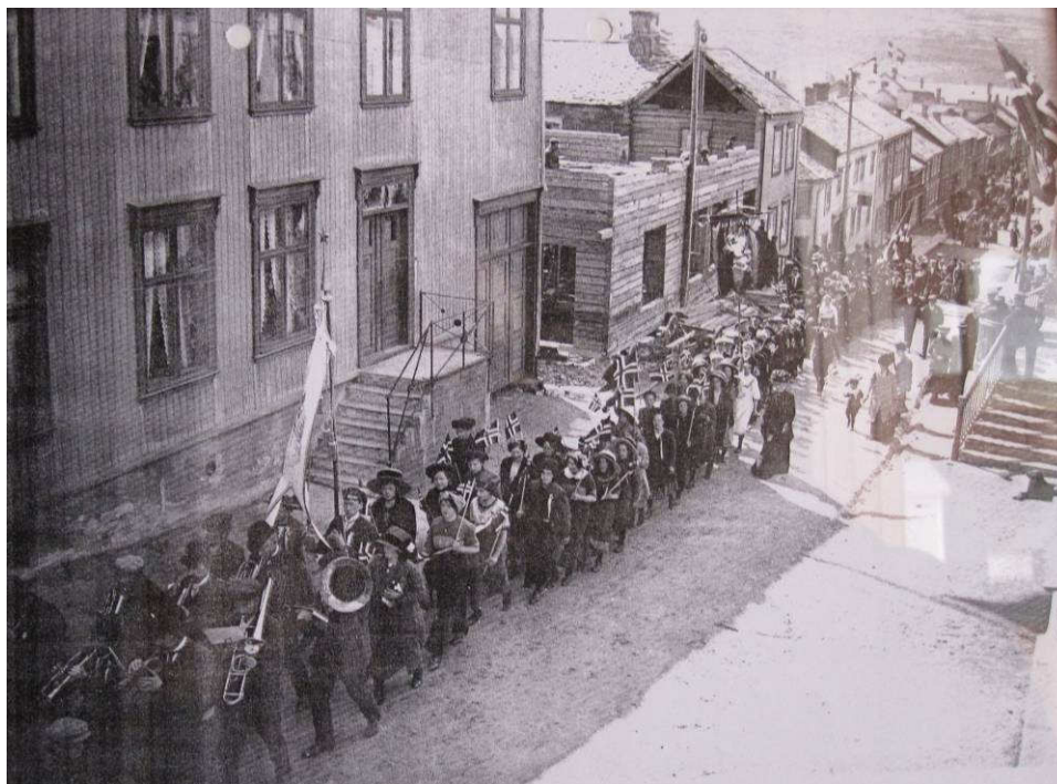
Figur 1. Røros. Kjerkgata. Foto tatt 17. mai, trolig i 1912. Toget passerer Nr. 29 som er under bygging. Det ser ut til at dagens bygning består av et eldre hus som lå nede på hjørnet, og et langt tilbygg mot Kjerkgata. Fotografiet henger i gangen i Kjerkgata 29.