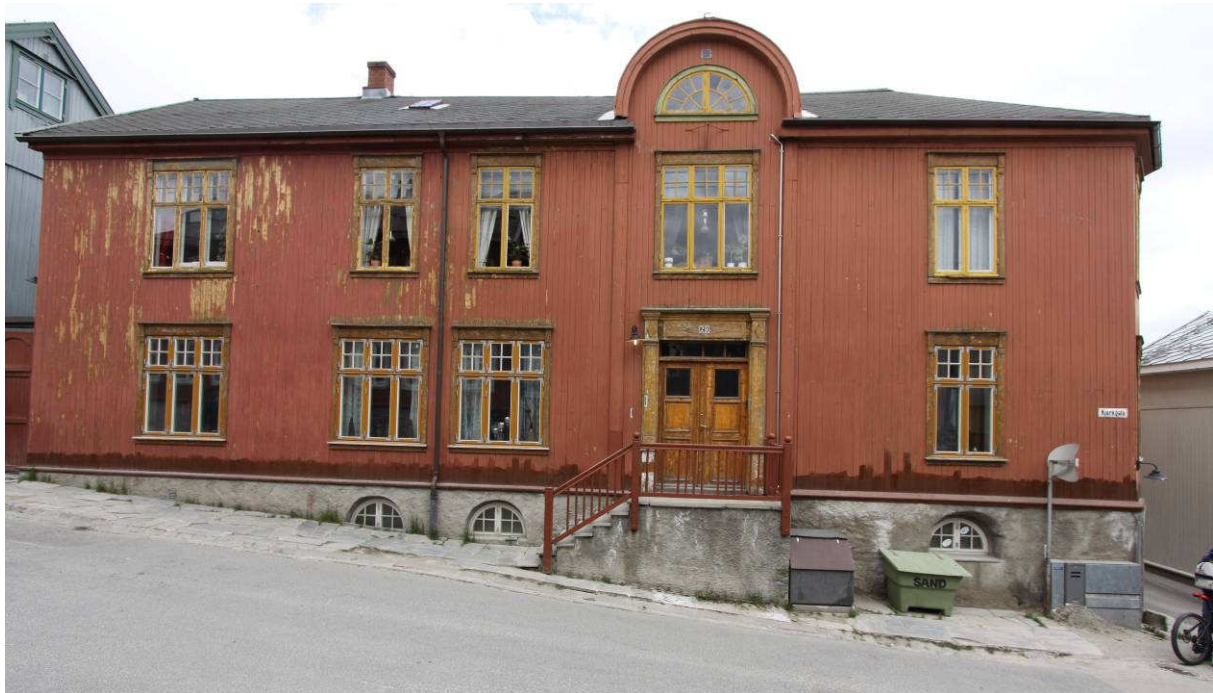
Figur 3. Røros. Kjerkgata 29. Hovedfasaden mot Kjerkgata.