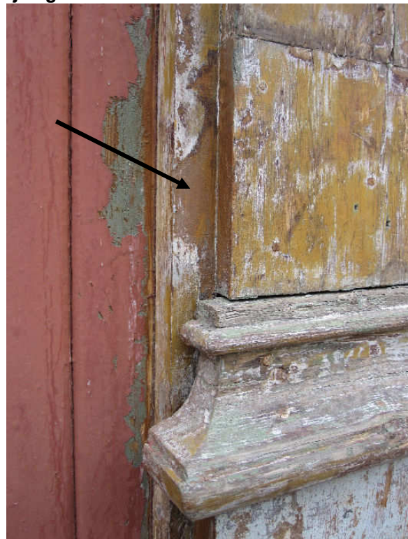
Venstre sidepilaster ved hoveddøra. Negative fargespor viser at dette elementet er endret.