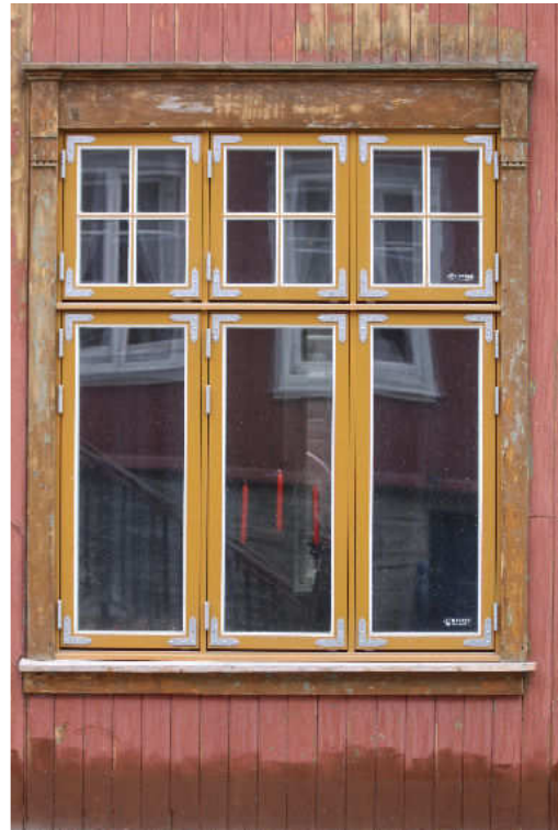
Figur 9. Røros. Kjerkgata 29. Nytt vindu, 2008/09 i hovedfasadens 1. etasje.