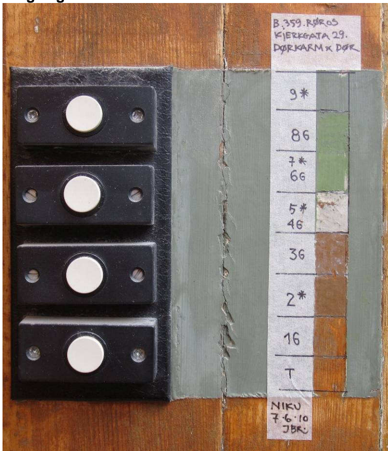
Figur 11. Kjerkgata 29. Fargelagsavdekking på dørkarmen.