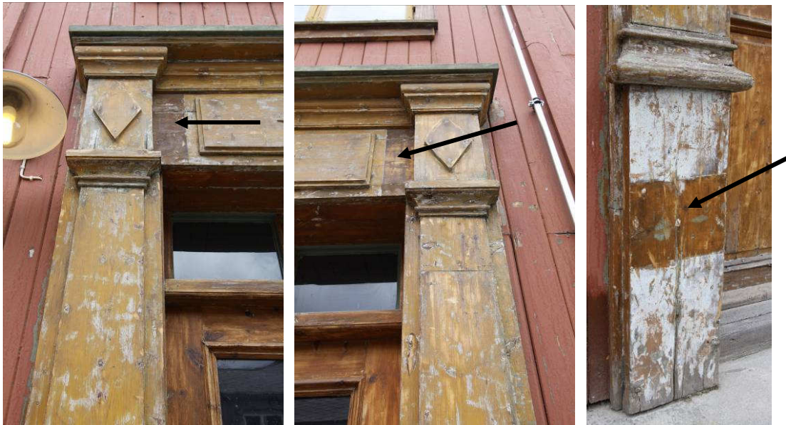
Figur 5, 6 og 7. Tre elementer på dørromrammingen som alle har negative fargespor som viser at de er endret.