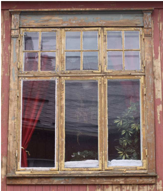
Figur 8. Røros. Kjerkgata 29. Originalt vindu i hovedfasadens 2. etasje.