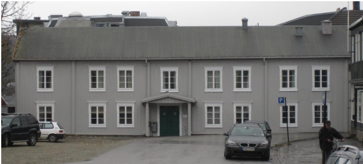
Figur 11. Bergmannsgata 1 etter oppmaling. Foto: Brønne oktober 2012.