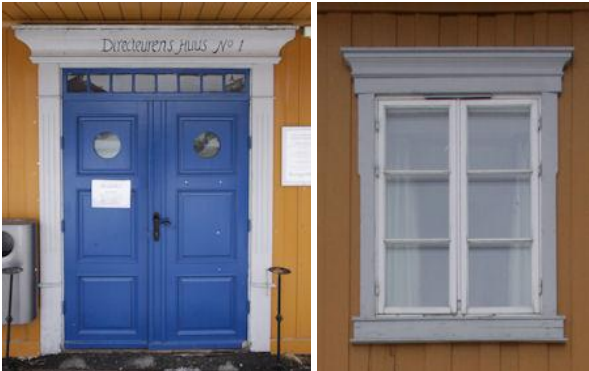
Figur 4. Til venstre. Ny utadslående hoveddør. «Pers Døren». Deler av døromrammingen kan være den som er gjengitt på fotografiet fra 1864-65. Til høyre. Et av de nye vinduene i 2. etasje. Vinduet har løssprosser. Oktober 2012.