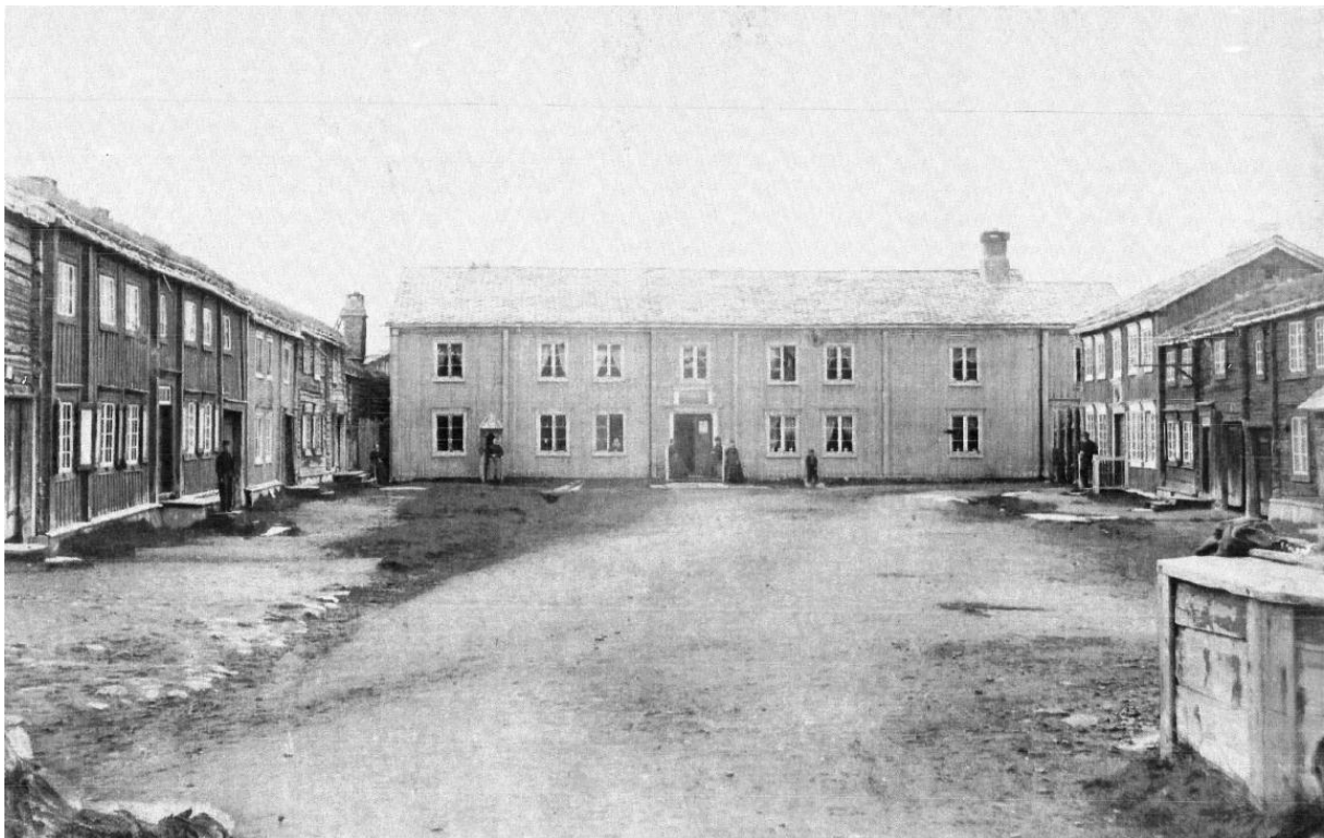
Figur 1. Bergmannsgata 1. Hus Nr. 1a. Fasaden mot Bergmannsgata. Foto: Elen Schomrach. Chr. 1864-65. Rørosmuseet. Ba. 392. B. 2792. Neg. 15440 Dp. 196.04.

Det eldste fotografiet som finnes av bygningen er datert 1864-65. (Fig.1) Kvisten over inngangspartiet er da fjernet og huset er tekket med tegl. Det ser ut til at huset i 1864-65 har samme panel som i dag. Vindustypen var av samme type som i dag, to-rams empirevinduer med tre glass i hver ramme. Slike vinduer var vanlig på Røros i store deler av 1800- åra, - en fast ramme, og en ramme hengslet på midtposten. Hoveddøra ser ut til å være en tofløyet senempiredør med tre eller fire fyllinger i hvert dørblad. Øverste fyllinger er senere erstattet med glass. Det er en supraport over døra. Taket er tekket med tegl.