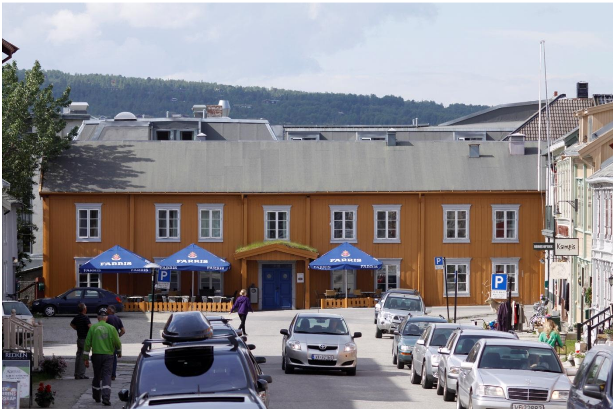
Figur 3. Bergmannsgata 1. Hus Nr. 1a. Fasaden mot Bergmannsgata. 6.7.2012.