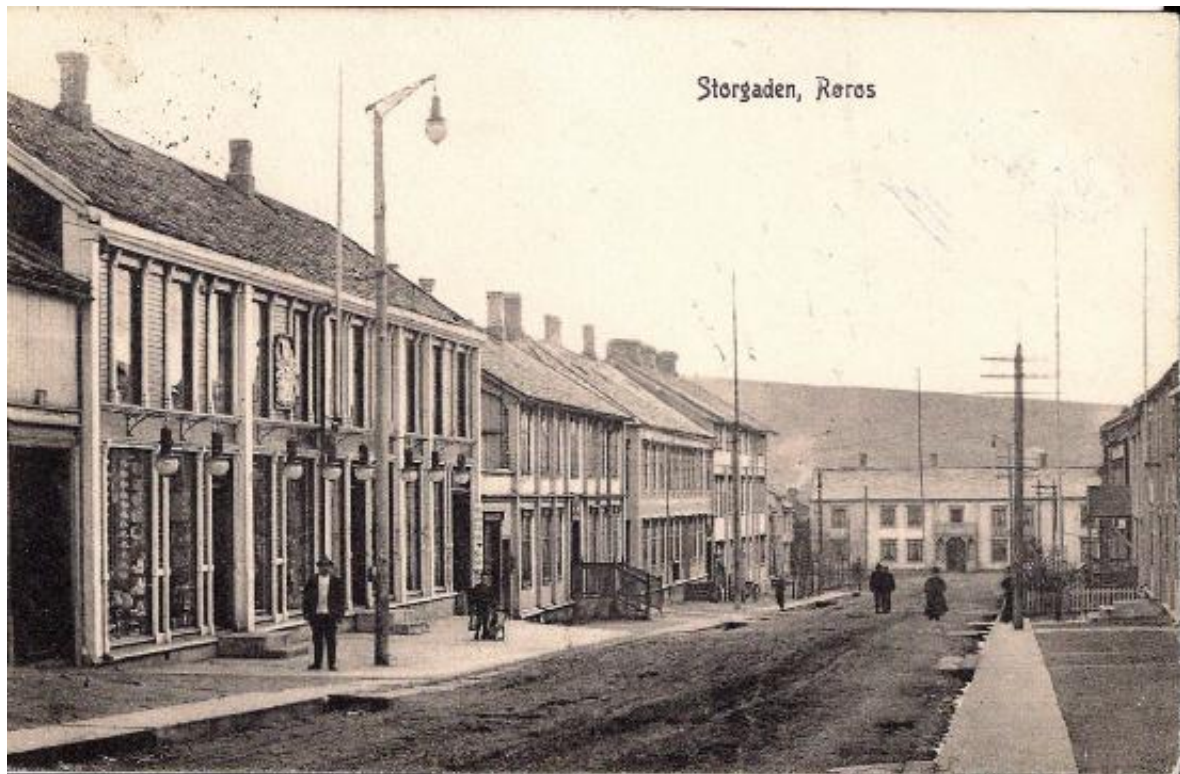
Figur 8. Postkort datert 1909. Huset er lyst, trolig hvitt, med en mellomtone på geriktene. Vinduene er mørke. Balkongen over inngangen, med «nygotisk»/sveitserstils snekkerglede har fått differensierte farger på stolpeverk og snekkerglede. Fargesettingen er også typisk for sveitserstilens siste fase.