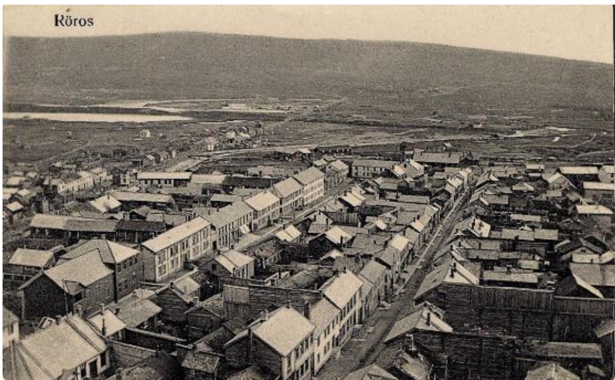
Figur 9. Postkort datert 1911. Bygningen er fremdeles lys, trolig hvit, med mørke vinduer.