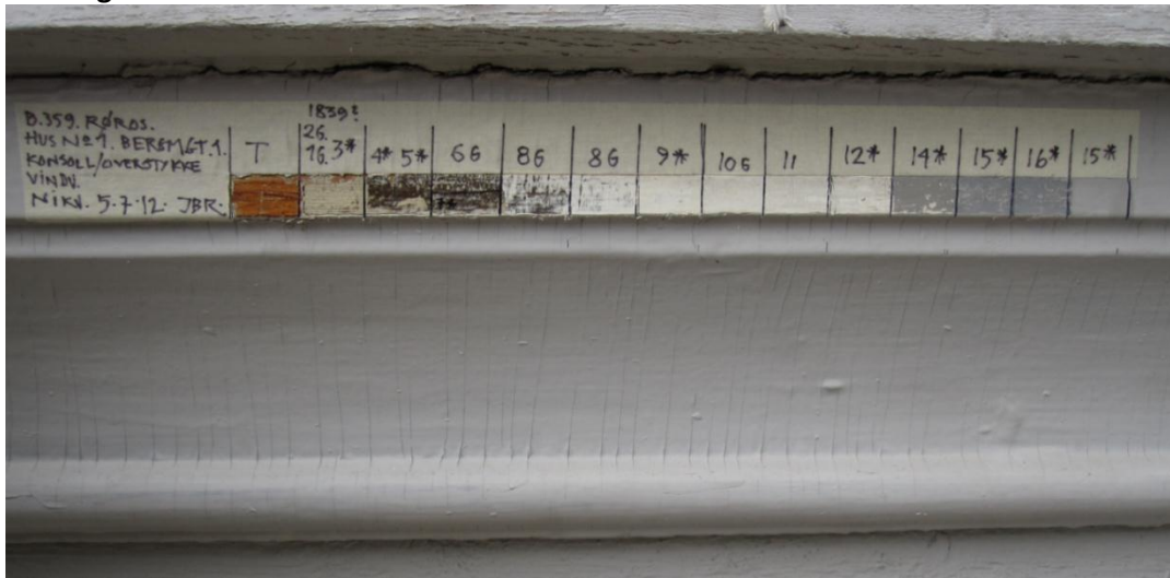
Figur 6. Lagvis fargeavdekking på øvre vindusgerikt/konsoll. Gerikta er tolket til å være påsatt i 1830-åra. Foto. Brønne. 2012.