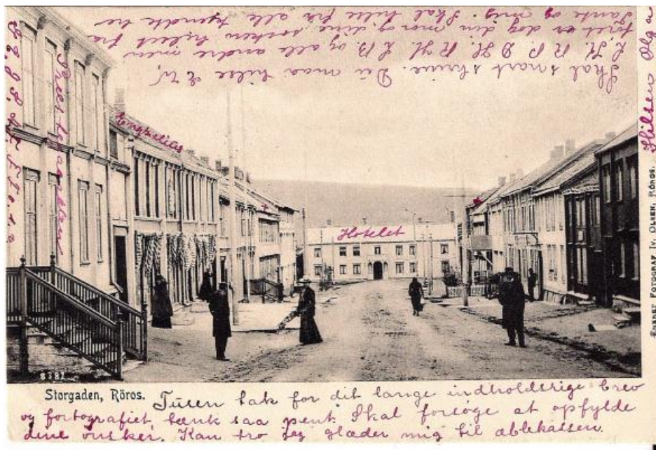
Figur 7. Postkort datert 1904. Huset er lyst, trolig hvitt, med lyse, trolig hvite gerikter. Vinduene er mørke. Det er bygget en balkong over inngangen, med «nygotisk»/sveitserstils snekkerglede. Balkongen ser ikke til å være skilt ut i egen farge. Dette er uvanlig. Fargesettingen for øvrig er typisk for sveitserstilens siste fase.

Undersøkelsen har vist at bygningen skiftet fargesetting og farger i siste del av 1800-åra. Fasaden ble da hvit.