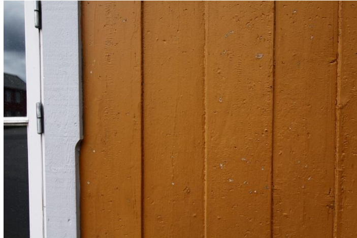
Figur 2. Vekselpanelet. Trolig fra 1830- åra. 6.7.2012.